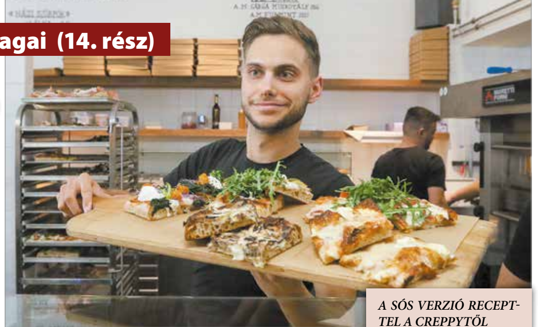
A SÓS VERZIÓ RECEPTEL A CREPPYTŐL

A vega burger középpontjában egy szép szelet grillezett kecskesajt foglal helyet, a buci alját és tetejét pedig padlizsánkrémlellettel bélelték ki. A sajtra kerül még egy adag párolt kaliforniai paprika is és mindez burgonyachipsszel táralva kerül a kedves vegetáriánus vendég elé. Őszintén szólva, egy pillanatra sem hiányoltam ebből a fogásból a húspogácsát. A lány kecskesajt olyan tökéletes elegyet alkot az általam amúgy is kedvelt padlizsánkrémlellettel, hogy úgy éreztem, ez pontosan az a hamburger, amire vágytam.