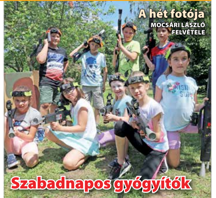
A hét fotója MOCSÁRI LÁSZLÓ FELVÉTELE