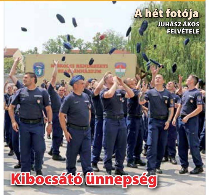
A hét fotója