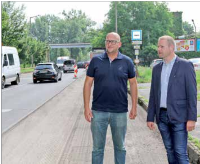
A héten elkezdődött a déli tehermentesítő teljes felújításának a második szakasza.

A felújítás két fő munkaszakaszról áll. Az első május 29-én indult, ekkor szakaszos sávlezárás mellett a MIVÍZ Kft. szakemberei alvállalkozó bevonásával megkezdtek a külső sávban az úttesten lévő vízelvezető-nyílások áthelyezését. A második szakasz jelenti az út felújítás jelentősebb részét. Ezt az iskolai nyári szünetre időzítve június 19-én kezdődött, először a forgalomtechnika kiépítésével, aminek eredményeként irányonként egy-egy forgalmi sávban járható a Kiss Ernő út, várhatóan szeptemberig.