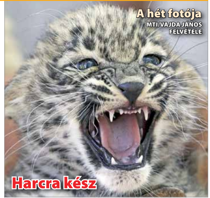
A hét fotója MTI/VAJDA JÁNOS FELVÉTELE

Nem telhet el úgy péntek este Miskolcon, hogy ne lenne igazi „Terülj, terül asztalkám!” a Művészetek Háza előtti GasztroPlacc. A legfinomabb miskolci falatok, a legízesebb környékbeli borok, és a leginkább falatozáshoz illő muzsika fogadja a miskolciakat. Legutóbb ezekről a Keszegsütő és a Tökert Étterem gondoskodott, a nedűt a HetedHét Pince (Görömböly) és a Mezei Pincészet (Tibolddaróc) biztosította.