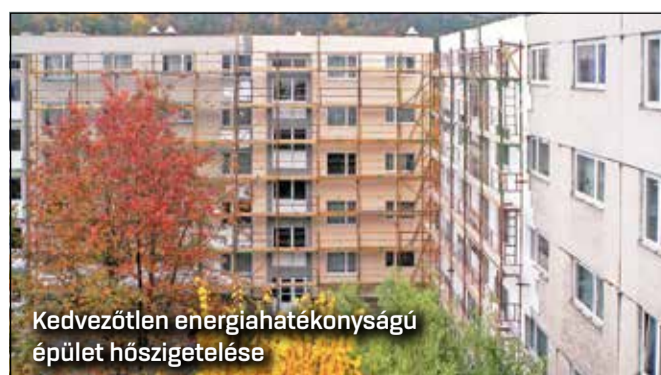
Kedvezőtlen energiahatékonyságú épület hőszigetelése

Az energiatudatos épületfelújítás gondolata és megvalósítása a 2000-es évektől fogalmazódott meg. A Panelprogram bevezetését a lakóépületek energiaszabályozásának csökkentése és a fűtőszabályozás hatásfok-növelése indokolta. A program keretében elvégezték az épületek külső hőszigetelését, a nyílászárók cseréjét és a fűtési rendszerek felújítását, valamint termosztatikus szelepeket és költségosztó készülékeket szereltek fel a radiátorokra. Ennek eredményeként a hőfelhasználás – a korábbi