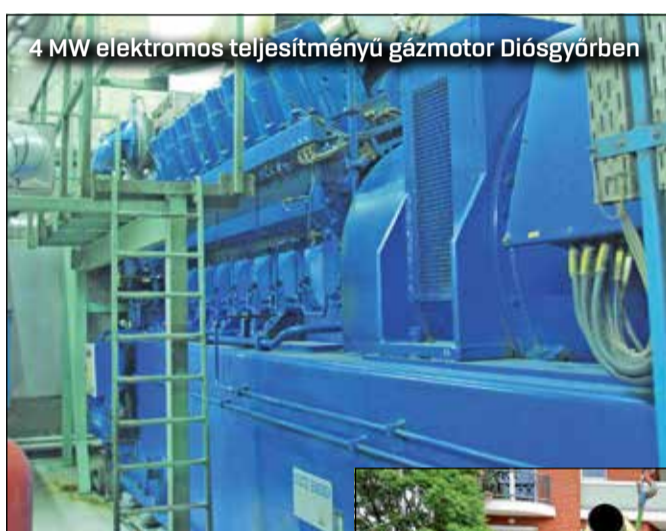
4 MW elektromos teljesítményű gázmotor Diósgyőrben

2007. január elsejétől a 231/2006. (XII.22.) számú kormányrendelet megváltoztatta a lakossági alanyi jogú gázártamogatás rendszerét, ekkor a