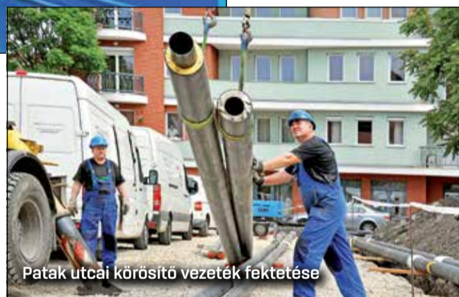
Patak utcai körösítő vezeték fektetése

A 2000-es évek közepétől a város teljes területére kiterjedt a távfelügyelet alkalmazása, majd később a távműködtetés is. A hőközpontok és a kezelő nélküli kazánházak távfelügyeleti rendszerhez mikrohullámon keresztül kapcsolódnak. A távfelügyeleti rendszer előnye, hogy a meghibásodást a fogyasztói érzékelés előtt jelzi, így lehetőség van a gyors hibaelhárításra, távműködtetés során tartalékszivattyú indítására, fűtésindításra, fűtés leállítására. Ez a rendszer lehetőséget nyújt a hőmennyi-