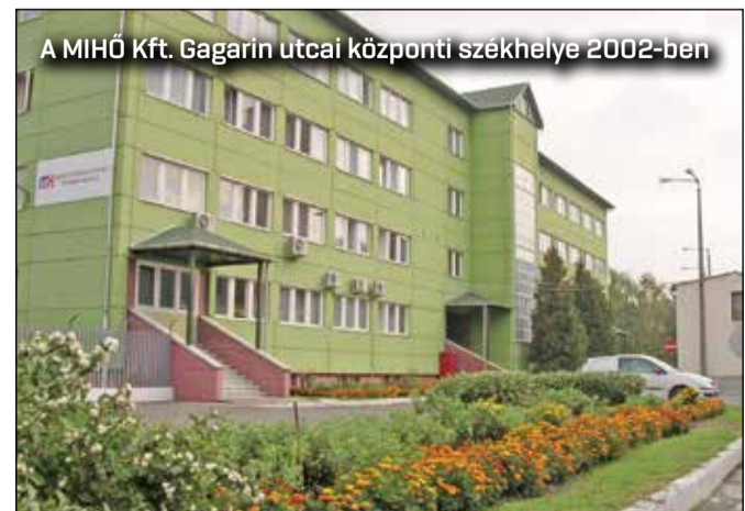
A MIHŐ Kft. Gagarin utcai központi székhelye 2002-ben

Kedves Olvasónk! Jövő héten a miskolci távhőszolgáltatás 2009-2019 közötti időszakát mutatjuk be. Tartson velünk akkor is!