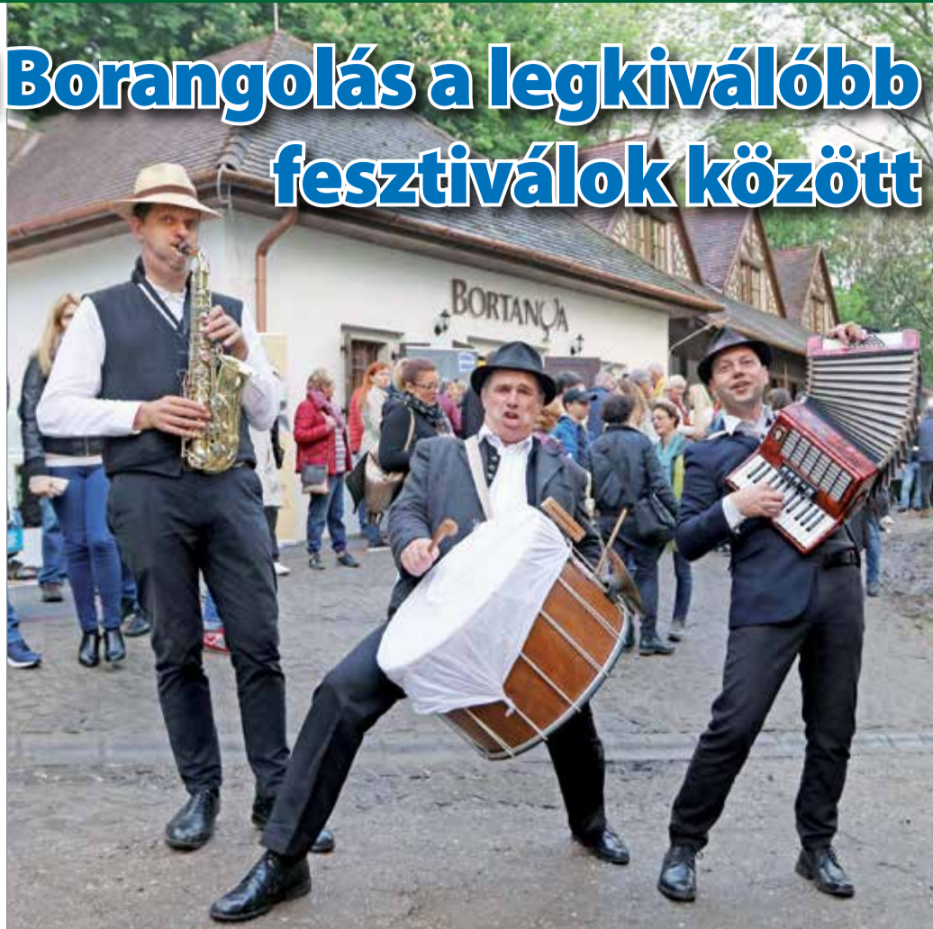
Az Avasi Borangolás minden év májusában három napon keresztül várja a látogatókat.

A Miskolczi Borbarátok Társasága Egyesület által elindított, civil szervezetek, polgármesteri hivatal, helyi vállalkozások és magánszemélyek összefogásával szerveződő, a tradicionális miskolci pincekultúra hagyományainak újjáélesztését célzó Avasi Borangolás minden év májusában három napon keresztül várja a látogatókat. A Miskolc belvárosában, a sétáló utcától pár perc járásra található Avas hegycsúcs patinás pincesorai és hangulatos utcái kiváló helyszínei baráti összejöveteleknek, minőségi bor- és gasztrónómiai élmények megélésének és a történelmi avasi pincesorok helyi értékei felfedezésének. A kü-