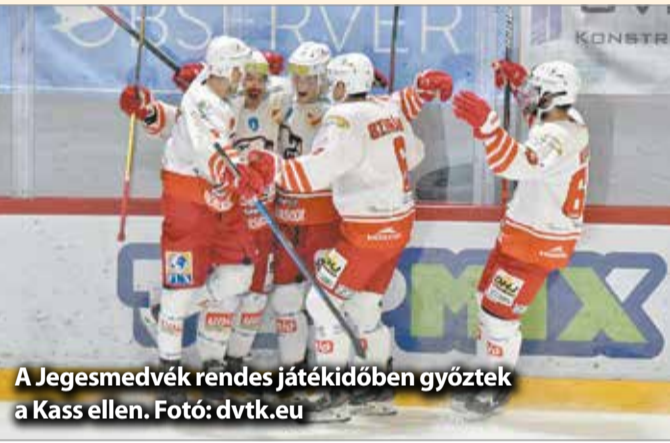
A Jegesmedvék rendes játékidőben győztek a Kass ellen.