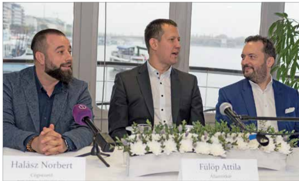
A zip's kezdeményezte, hogy a program országossá váljon.

A Szociális Ügyekért Felelős Államtitkárság, kiváló lehetőséget lát a Miskolcra indult #mosolytfakaszt programban, így a SVÉT-nek hárommillió forint támogatást nyújt a program országossá duzzasztásához.