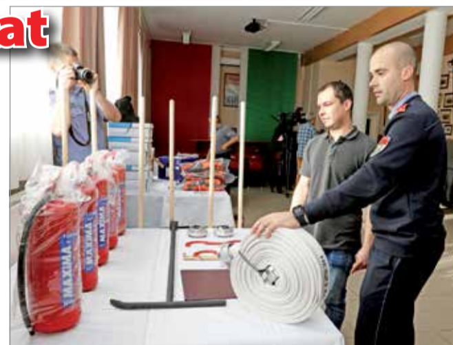
Az egyesületek olyan eszközöket rendeltek, amivel az alapvető műszaki feladatokat el tudjuk látni.

A Magyarországon működő önkéntes tűzoltó-egyesületek és mentőszervezetek között idén összesen 700 millió forintnyi támogatást oszthatott szét a katasztrófavédelem. A BM Országos Katasztrófavédelmi Főigazgatóság és a Magyar Tűzoltó Szövetség idei pályázatán mintegy 23 millió forint értékben harminc Borsod-Abaúj-Zemplén megyei önkéntes tűzoltó-egyesület és két mentőszervezet részesült sikeres elbírálásban. A Borsod-Abaúj-Zemplén megyei önkéntes tűzoltó-egyesület első sikeresen elnyert pályázatának köszönhetően fejlesztheti eszközparkját. – Olyan eszközöket rendeltünk, amivel a leges legalapvetőbb műszaki feladatokat el tudjuk látni esetleges keletkező tüzeset során. Ez a falu tűzcsap hálózatának a fel szerelvényezé-