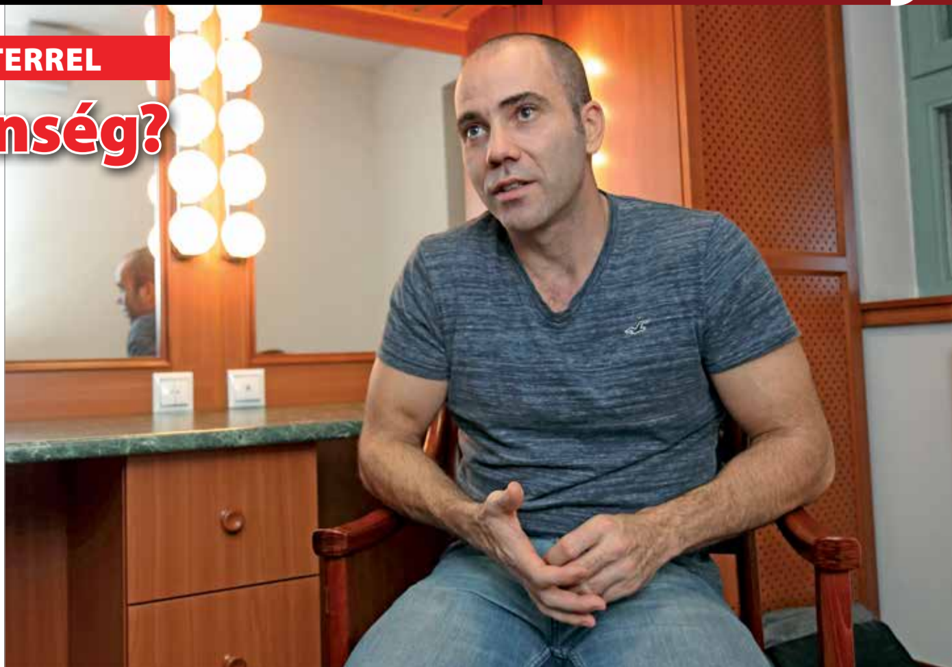
„Az sem mind maradhat, ami vicces, ha nem építi a mondandót”

– Nem. Ha az élet úgy hozza, hogy a stand-up karrier beáll, mint a gerely és nem megy tovább, még akkor sem hiszem, hogy lenne visszaút. Annyi minden megváltozott már az-