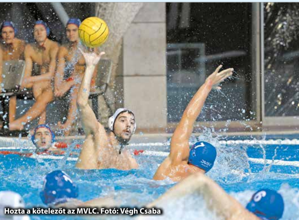
Hozta a kötelezőt az MVLC.