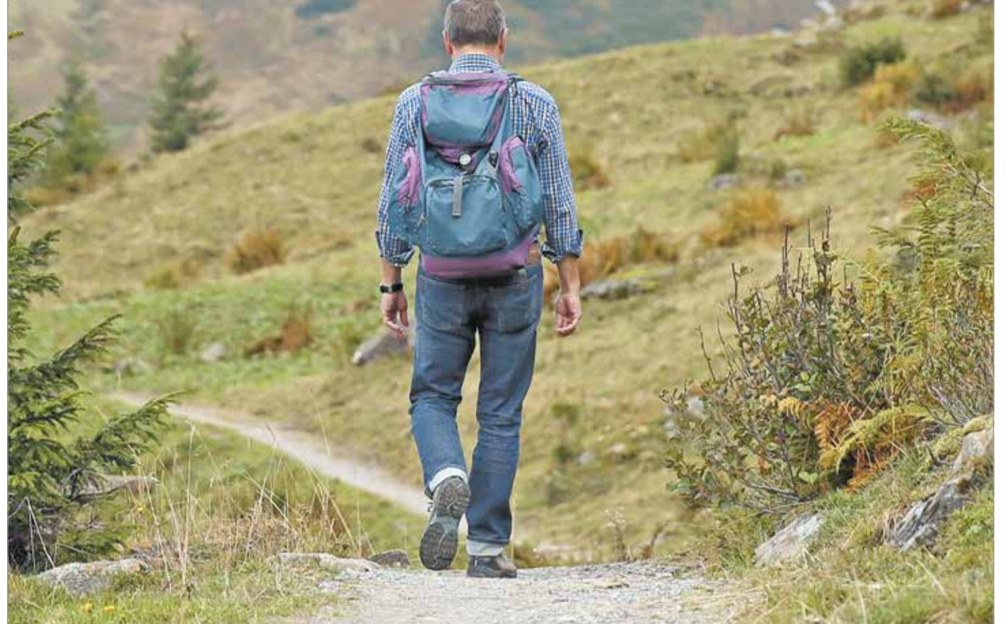
A rajtunk lévő nyomás is megszűnik létezni a természetben.

Mint mondja, ősszel megfigyelhető, hogy többen vannak az edzőtermekben. Ez egyrészt köszönhető annak, hogy nincs már meleg, ilyenkor aktívabban az emberek. Illetve edzéshez nincs semmi más szabadteri lehetősége az embernek, és mindenki „beszorul” a terembe. Karácsony környékén megcsappan ez a létszám, olyankor mindenki az ajándékok után rohangál, de januárban újra felélnékelnek az edzőtermek,