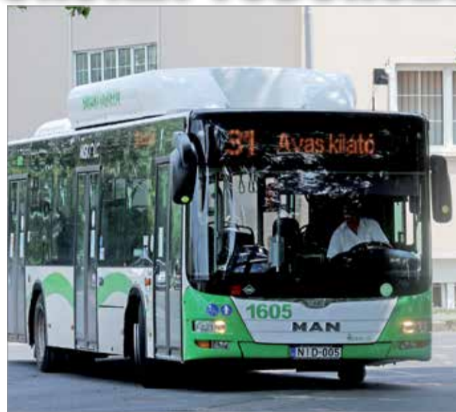
A zökkenőmentes működéshez 300 sofőrre lenne szükség.

Az MVK 150 járművel rendelkezik, a cég zökkenőmentes működéséhez 300 sofőrre lenne szükség, a rendszerből jelenleg 40 fő hiányzik. Országos, sőt európai probléma, hogy kevés a buszsofőr. A szakma szerint egyrészt azért, mert maga a képzés költséges és időigényes, másrészt pedig sokan inkább átmentek kamiont vezetni. Az MVK tájékoztatása szerint egy kezdő buszsofőr ma nettó 220-250 ezer forintot kap, ehhez jönnek a prémiumok. A cég az