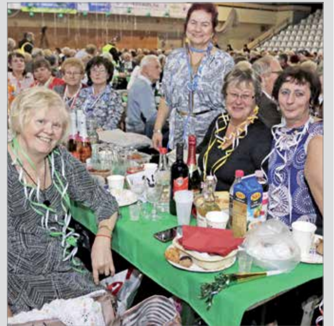
Salkaházi batyus bál a sportszarnokban.

Miskolc ezzel is szeretne hozzájárulni ahhoz, hogy az itt élő szépkorúak nyugdíjas éveiket boldogan, megbecsülésben élhessék abban a városban, amelyért dolgoztak, fáradoztak évtizedeken keresztül.