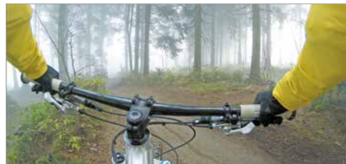
Töltsünk minél több időt a szabadban!

tént eseményeken, de ne aggodjunk a jövőnk miatt sem. – Erre lehet magunkat kondicionálni, tudatosan irányítani a fókuszot, mert az energia is ott van. Nagyon hasznosnak tartom a rászorulóknak segítségét, az adakozást, mert az az igazi