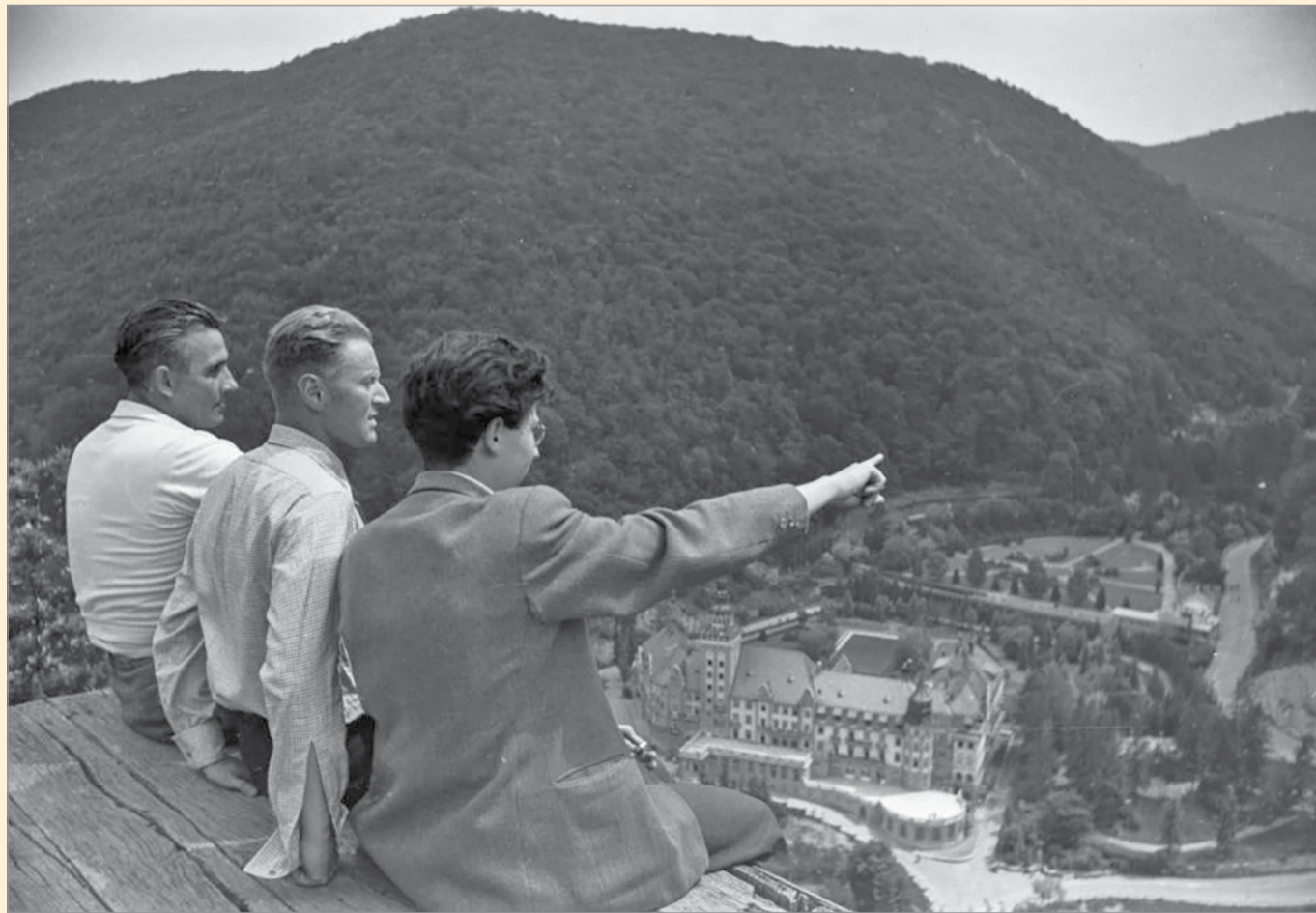
A videóban lillafüredi felvételek is megtalálhatók.