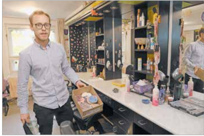
Folyamatosan tesztelik a mosható textil smink törölkendőket.

A Miskolci Nemzeti Színház szeretné, ha felhívásuk eljutna minden hazai színházhoz és kulturális intézményhez, és ezennel szeretnék felkérni őket, hogy csatlakozzanak a Jövő Nézőiért – Zöld Színház Projektet.