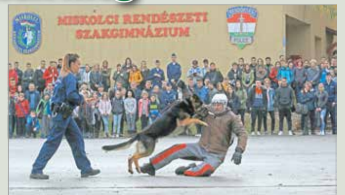
Kétség kívül a bevetési gyakorlat volt az egyik leglátványosabb program.