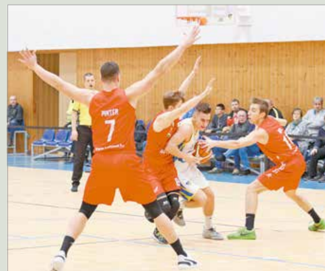
A kiélezett végjátékot a végig jobban összpontosító vendégek nyerték.