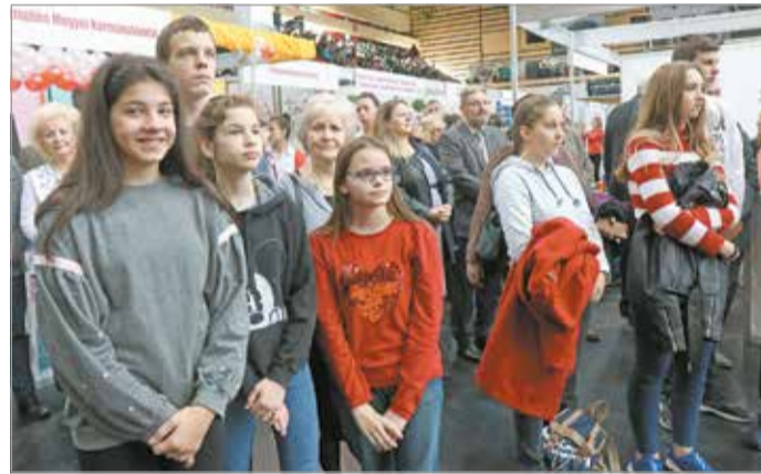
A kiállításra két nap alatt mintegy háromezer fiatal vartak.