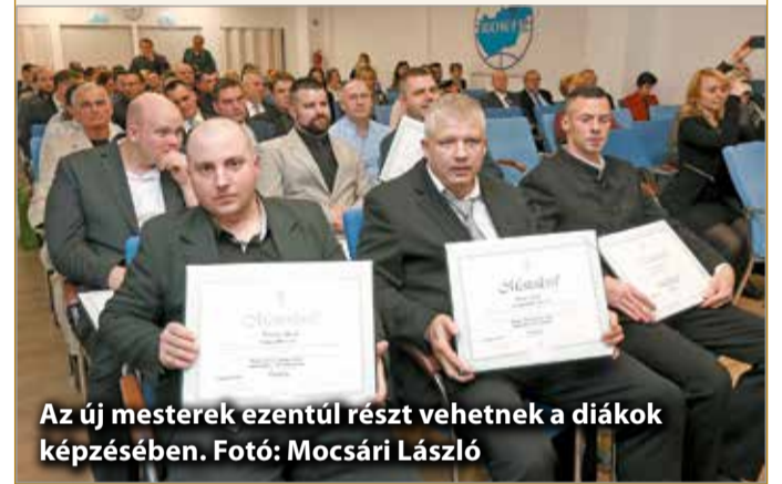
Az új mestereket ezután részt vehetnek a diákok képzésében.

A mesterek képzése azért fontos, mert jogos az feltételezés, hogy ezek a szakemberek magasabb minőséget és szolgáltatást képesek nyújtani, valamint az ő feladatuk a tanulók nevelése és az utánpótlás gondozása is – hangzott el az ünnepségen.