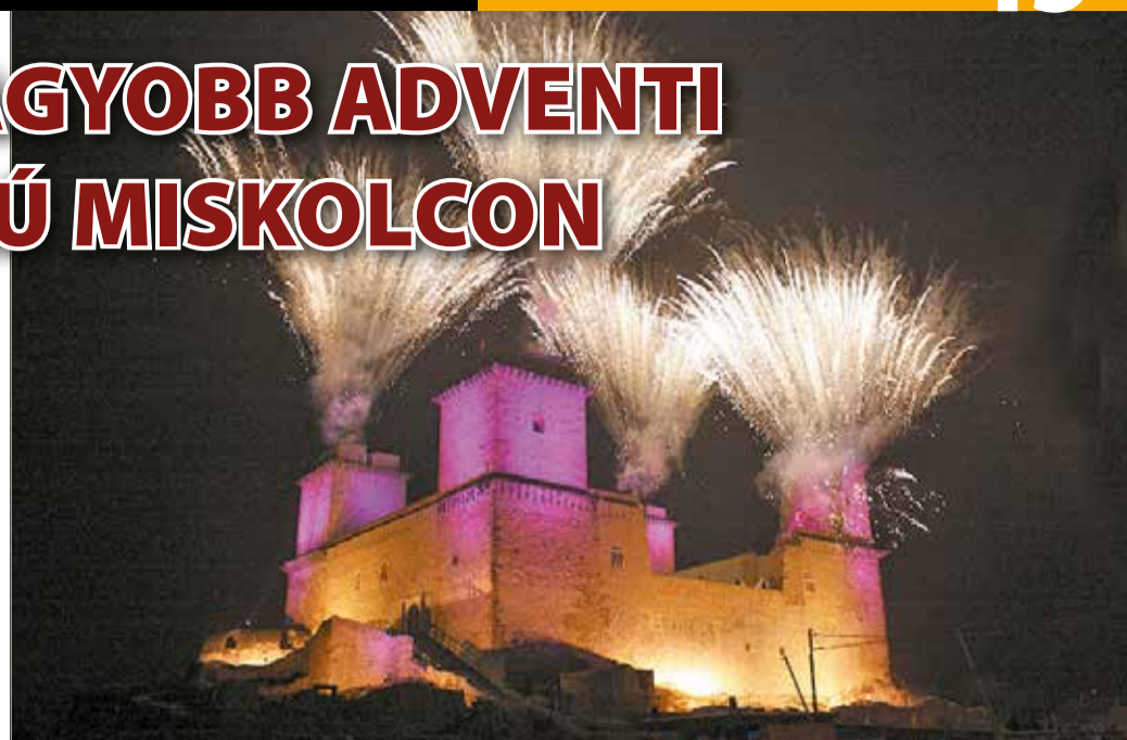
Egy csipet „varázslat” vár mindenkit a Diósgyőri várnál az adventi hétvégéken.

A vár bástyái az adventi koszorú négy gyertyáját jelképezik majd - ilyenkor a megvilágítás is eltér a megszokottól - ünnepi fényfestés jelzi az idő múlását. A látványos tűzefeketek pedig mindenkit ámulatba ejtenek. A karácsonyra való készülődés hangulatában a közös várakozás helyszínévé változik a Lovagi Tornák Tere előtt található vásártér. A hatalmas adventi koszorún hétről hétre újabb gyertya árasztja fényét és minden hétvégén más iskola diákjai ajándékozzák meg műsorukkal a közönséget. Miko-