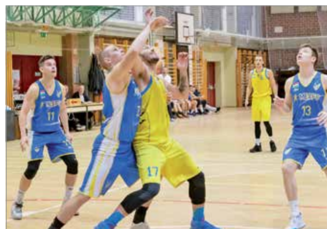
A fordításra már nem maradt idő Baján.