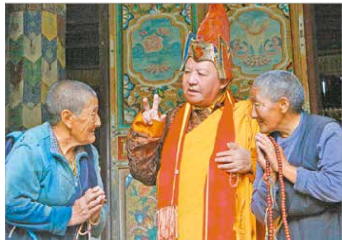
Tanpai mester idős dharmagyakorlókcal Tibet-Kínában

szokták mondani, hogy pont a gőg, a büszkeség alakítható át valakiben a legnehezebben. Ha nagyon túlteng, ezzel a legnehezebb „dolgozni”, hiszen nem is feltétlenül gondoljuk eleve rossznak ezt a tulajdonságunkat. A „megszelidítés” mind a hat negatív érzelmre vonatkozik. Az emberi természetből fakadnak ezek, de nagyon sok