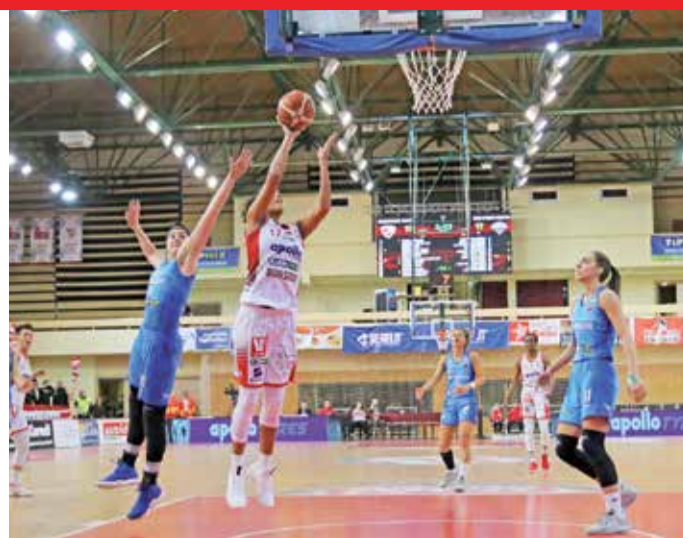
A DVTK kosárlabdázói is sikerrel zárták a hétvégét.