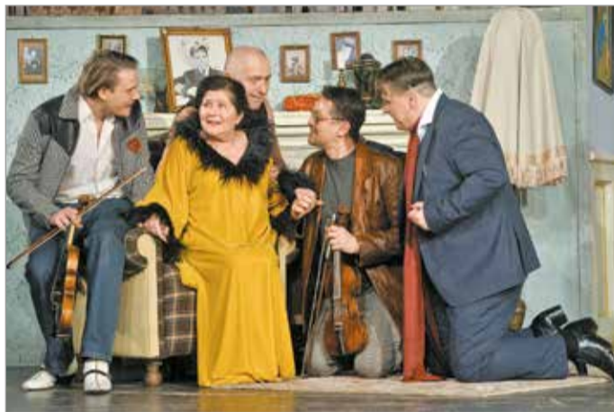
A fekete humorban bővelkedő komédiát november 22-én mutatták be.

poénokon keresztül fejt meg magában a történetet, mindennek jókor, jó helyen kell történnie, ez pedig nagyfokú precizitást igényel. Nem szeretem az olcsó megoldásokat, a belső igazságok megkeresését nem helyettesítheti a ripacság. Nagyon jó színészcsapat dolgozom, akik komolyan veszik a „vicces” szerepeket is. Ebben a rengeteg félreértésen alapuló, lassan kibontakozó történetben önironikus, cinikus megnyilvánulások és igazi angol humor várja a nézőket 12-től 112 éves korig.