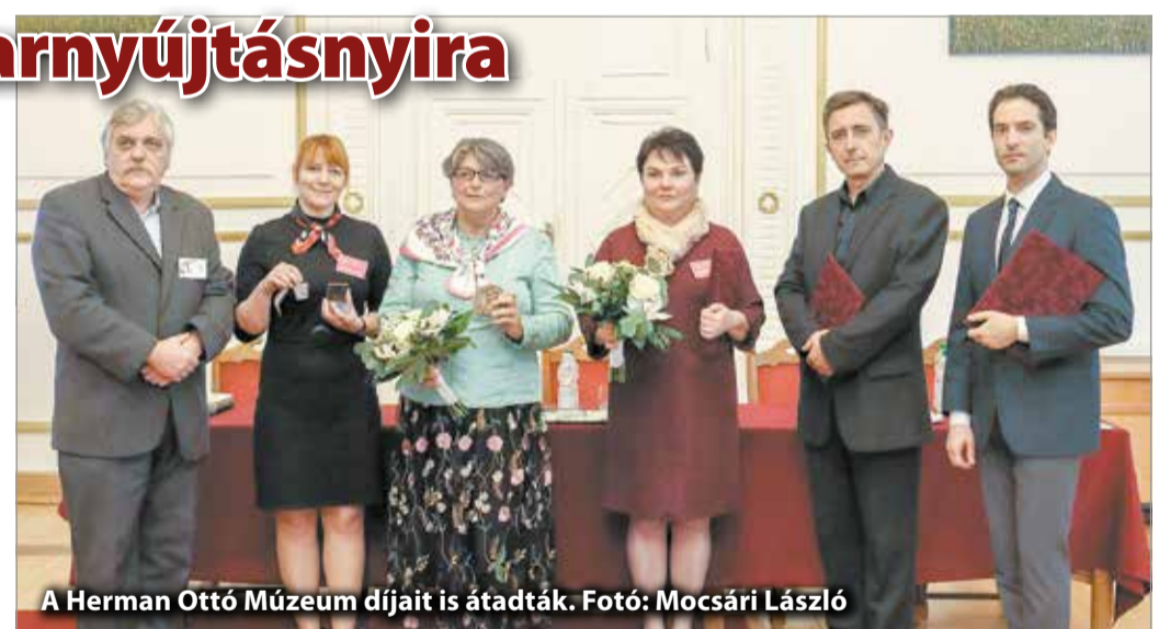
A Herman Ottó Múzeum díjait is átadták.

Az évfordulót kétnapos konferenciával ünnepelték nemcsak a múzeum dolgozói, hanem a vidéki és országos múzeumok munkatársai is. Ugyanis a születésnap alkalmából Miskolcon rendezték