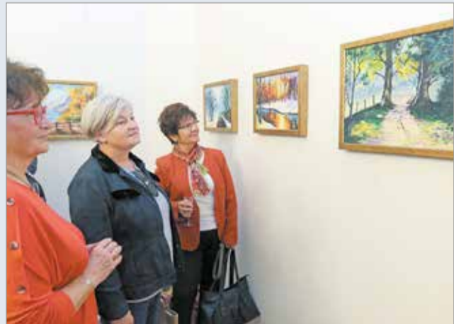
A festményeket októberben a színházban állították ki.

A tárlatot vándorkiállítás formájában a kórház több épületében és telephelyén bemutatják majd a következő hónapokban. A festményeket azon a gálavacsorán árverezik el, amit január 24-én este 6 óráig rendeznek meg. A befolyt összeget pedig a Borsod-Abaúj-Zemplén Megyei Központi Kórház és Egyetemi Oktatókórház kapja, műszereket vásárolnak majd belőle.