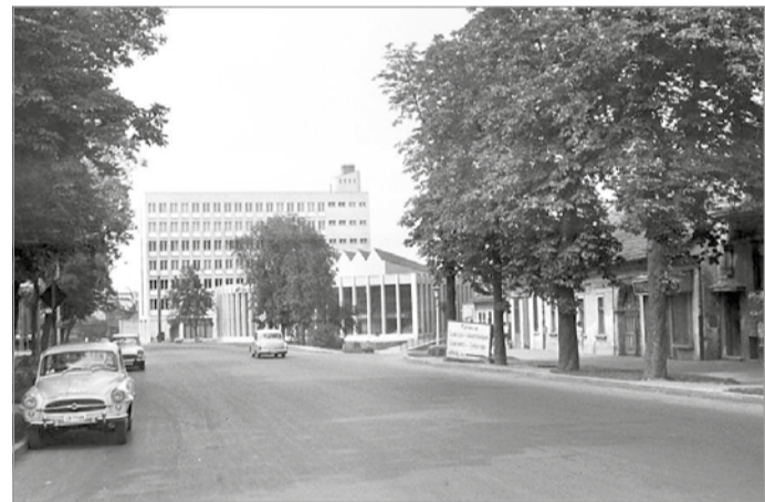
Az újonnan kialakított Csabai út.

vette ezen szőlőhegy az ottan mindenütt szerte heverő kova vagy tűzkövekről” – írja a meg nem nevezett miskolci előljáró a Pesty Frigyes által jegyzett Borsod vármegye leírása 1864-ben című kötetében. Bár a Tűzköveshez fűzött kommentárban vannak pontatlanságok, a