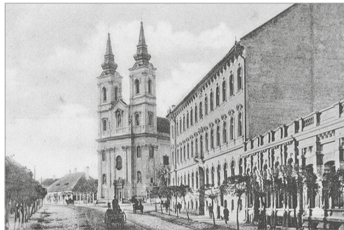
A mindszerenti templom egy 20. század eleji ábrázoláson.

nepség keretében, 1864-ben szentelték fel, ezt követően pedig szinte azonnal kedvelt