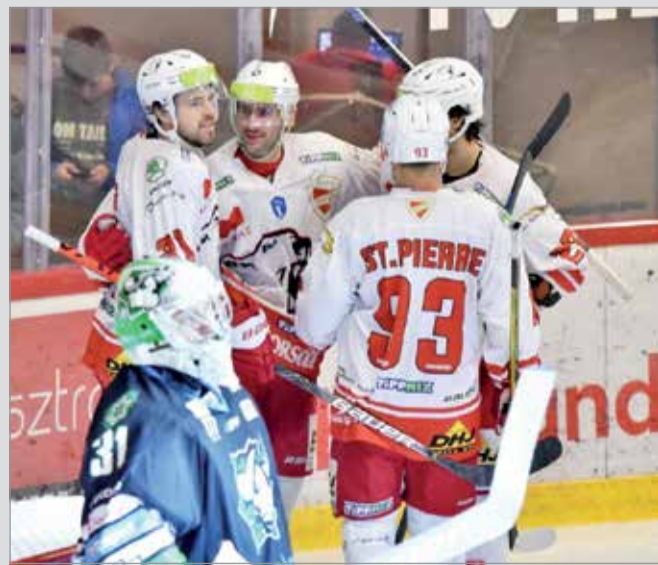
Kétszer három pontot tartottak itthon a Jegesmedvék.