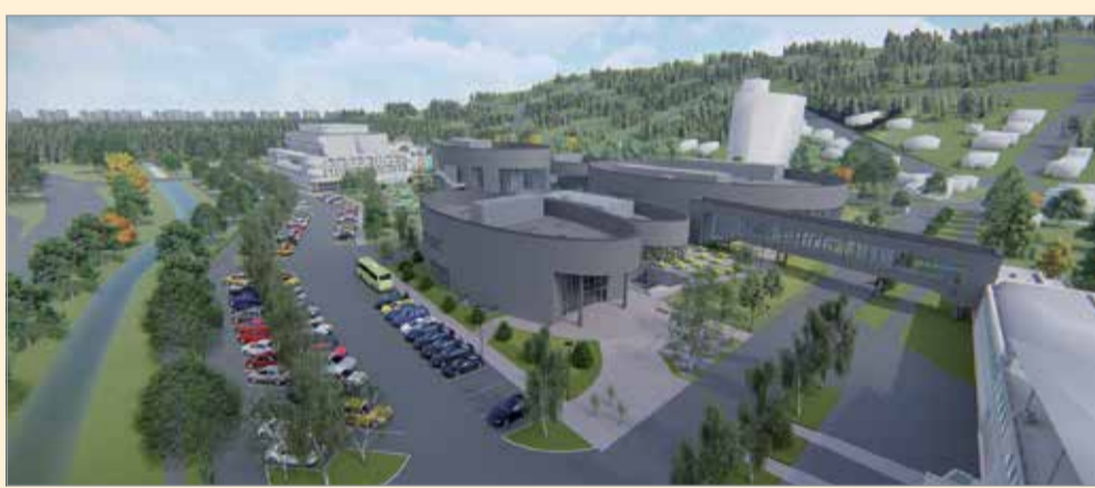
Az Aradi sétány látványterve.