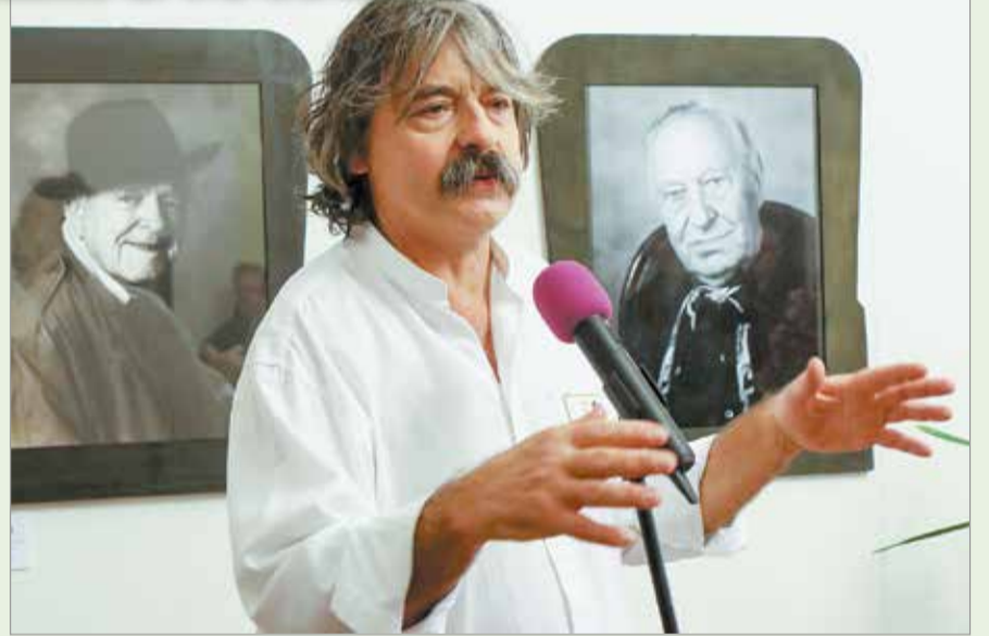
A tárlat húsz év munkáját öleli fel.

– Szécsi Zoltán a lehető legnehezebb utat választotta technikailag is. A digitális korban nem csak analóg módon készít képeket, de analóg módon is gondol-