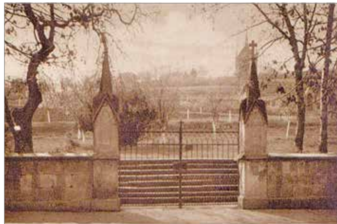
Képslapon a Kálvária.