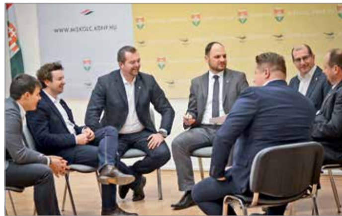
Fiatalos elnökség vezeti tovább a KDNP-t Miskolcon.

A politikus egyben a KDNP vezetője is, aki 2005-től tölti be helyi közgyűlési frakciójának a városi szervezet elnöki tiszt-