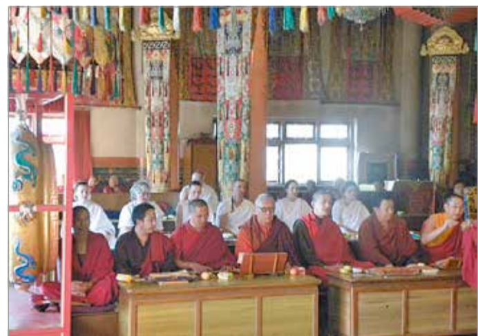
Nepáli szerzetesek és európai elvonulók szertartáson a mester katmandui kolostorában

zus amolyan lámaképző. Az elvonulók tanításokat kapnak, meditációs gyakorlatokat sajátítanak el. A nyugati ember számára szenvedés lehet bármiféle „nélkülözés”, és általában a változás, legyen az fizikai vagy mentális. Ám éppen ez a relatív szenvedés – ami nem más, mint a komfortzónából való kilépés – adja meg annak lehetőségét,