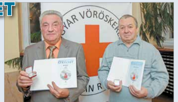
Ketten is százszor nyújtották már segítő karjukat.

November 27-e 1988 óta a Véradók Napja Magyarországon. Évente 250 ezer ad vért hazánkban. A Magyar Vöröskereszt 1939 óta szervez véradó napokat.