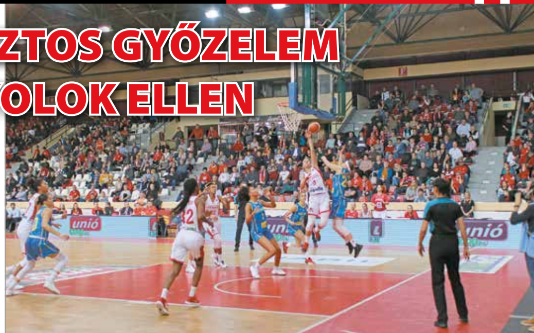
A győzelemmel a DVTK megőrizte esélyét a továbbjutásra.

A mérkőzés elején a spanyolok vezettek kétszer is, de Goree második kosarával már a DVTK-nál volt az előny, amit Morrison növelt, és miután Medgyessy is elvállalt egy sikeres hárompontos dobást, a negyedik perc végén időt kértek a vendégek (11-4). A folytatásban sokáig csak büntetőből találtak gyűrűbe a csapatok, a különbség nem