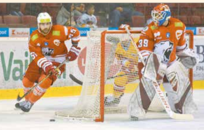
Nem sikerült a pontszerzés a Trencsén ellen.

A nagyszünet után öt spanyol ponttal indult a játék, Morrison és Škorić 2+1-es akcióival és Walker-Kimbrough tempójával helyre állt a világ rendje (46-36). Gustavsson és Pujol dupláival közelebb jött a Sedis, szerencsére Maja Škorić keze sem remegett meg a büntetővonalon állva (48-40). Morrison újabb 2+1-esével folytatódott a mérkőzés, erre Wiese majd Nogić re-