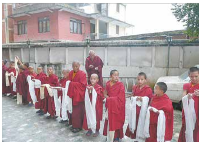
Kis szerzetesek a mesterre várnak a kolostor udvarán

– Úgy mondanám, hogy a gőg is jellemzi. A buddhista tanokban hat fő negatív érzelm szerepel: büszkeség/gőg, irigység/féltékenység, vágy, tudatlanság/ostobaság, mohóság, harag/agresszió – ezek meghatározóak az életünkben. Azt