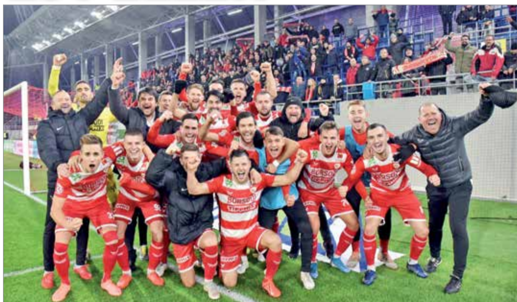
Megérdemelten hozták haza a három pontot.

A bajnokín a vezetést a 23. percben szerezte meg a DVTK. Shestakov ívelte a kapu elé a labdát, amit Tabakovic fejtelt kapura, a kapusról kipattanót pedig a jól érkező Márkvárt lötte a hálóbba, 0-1. Teljesen megérdemelt vezetése után, egy újabb tanítanivaló ellenakcióból növelte előnyét a miskolci együttes. Hasani átadásával megint csak Shestakov iramodott meg a szélén, a 16-os sarkától pontosan ívelt középre és az átvétel után egy helyezett, túppontos lövéssel Tabakovic vette be az újpesti kaput, 0-2. A folytatásban is jól