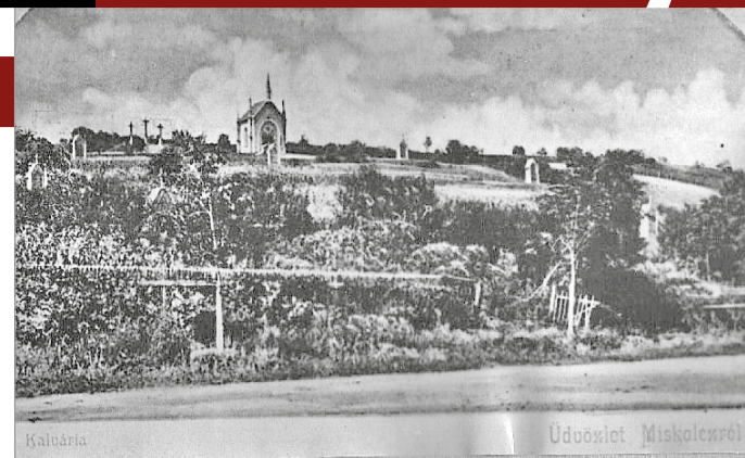
A Tűzkövesnek nevezett dűlő egy részén létesült később a Kálvária.