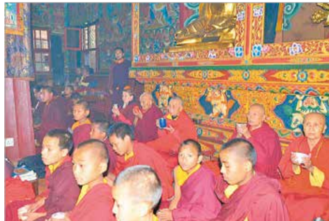
A szerző katmandui szerzetesek körében a Baudhanath sztúpánál

– Nem volt 180 fokos fordulat. Intenzív hároméves gyakorlat volt, majd a mester felajánlotta, hogy maradhatunk átadni a tapasztalatainkat az újabb gyakorlóknak, vagyis a Kunhegyesi Mahámudrá Meditációs Központ működtetésében segíthetünk. 2011-ben a média kezdett átalakulni, oda már nem kívántam visszatérni, viszont úgy éreztem, hogy az elvonulókörzpontban jó helyen vagyok, értelmes feladatokkal. Mesterünk folyamatosan európai és ázsiai tanítókörutakra