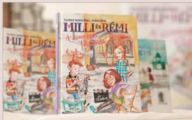
Milli és Rémi történetének folytatása hatalmas népszerűségnek örvend.

Két, felnőtteknek szóló könyv fért még fel a képzeletbeli dobogóra. Nem is lehetett kérdés, hogy ha Leslie L. Lawrence regény jelenik meg, az azonnal toplistas lesz. Nincs ez másként a Donovan ezredes piros kabátja I-II.-vel sem. – Lőrincz L. László több mint nyolcvan könyvet írt. Az idén nyolcvanadik születésnapját betöltő szerző új könyvében is ziporkázik, történetei életkortól függet-