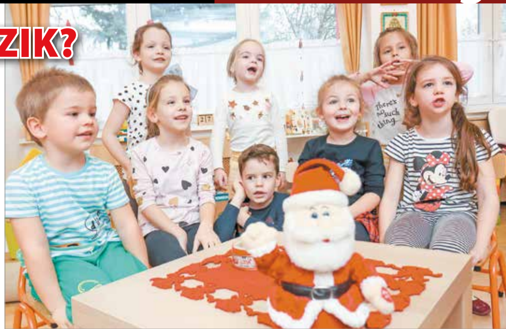
Az ovisok már lelkesen várják a Mikulást.