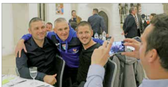
A csapatok egy vártúrán is részt vettek.