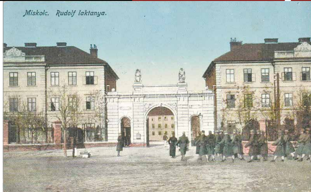
A Rudolf laktanya egy korabeli képeslapon

A Reggeli Hírlap december 25-i, ünnepi száma némileg több helyet szentelt a karácsonynak. A lap többek között a szibériai hadifoglyok javára való adakozásra hívja fel a figyelmet, amelyet a város több pontján elhelyezett urnákban lehet megtenni. A gyűjtés apropóján szépségversenyt is rendeztek, ahol a szavazólapok, valamint „művész propagandá” ábrázolások megvásárlásával lehetett adományozni. A „zenés-sétával”