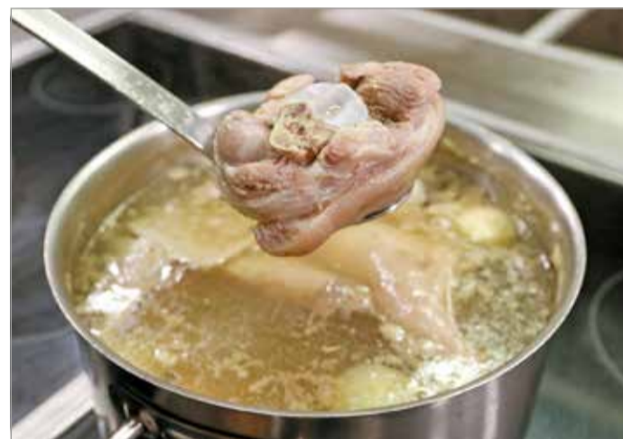
A kocsonya titka, hogy alacsony hőfokon 5-6 órában keresztül kell főzni, hogy kioldódjon belőle a kollagén.