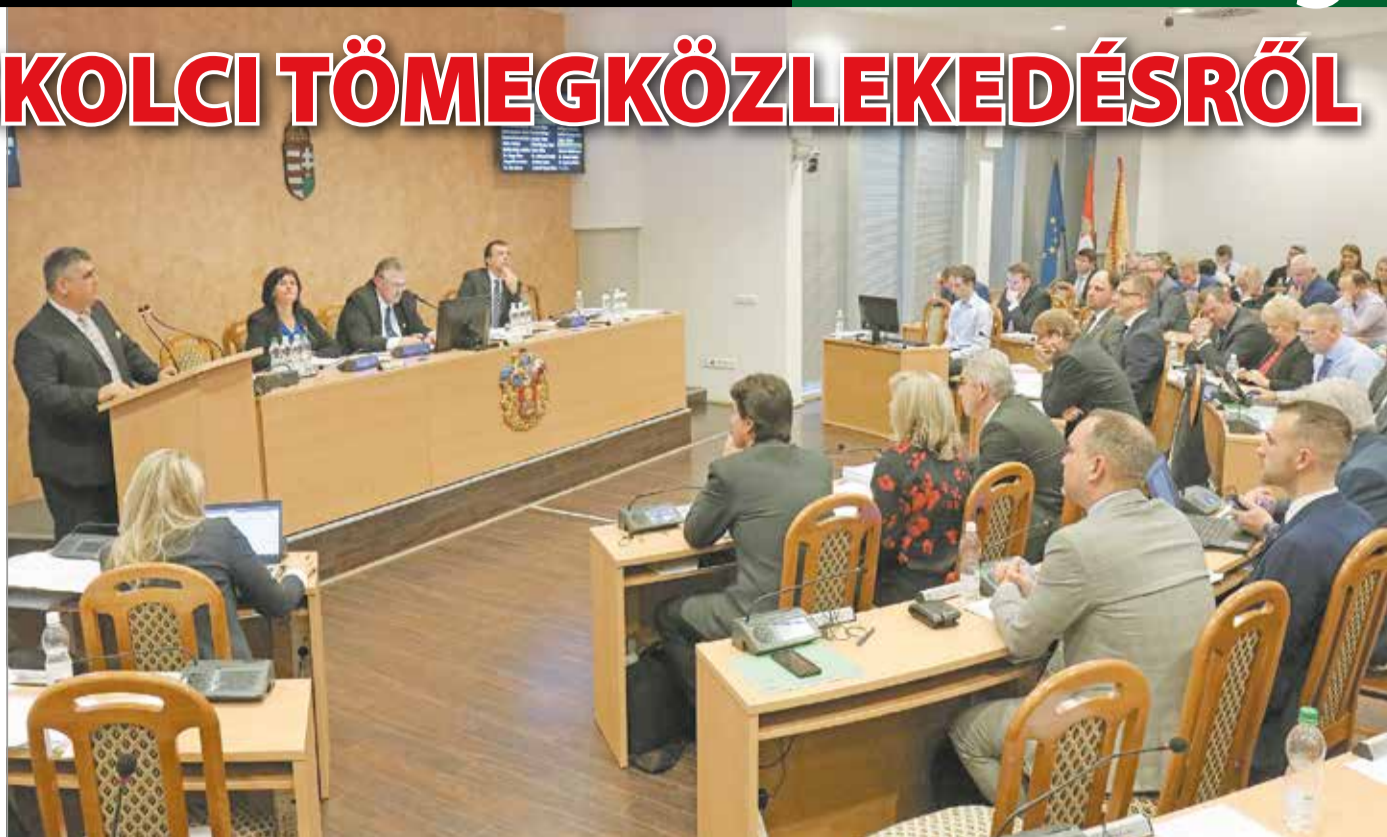
Kemény vitákkal tarkított ülést tartott csütörtökön a miskolci közgyűlés.

A közgyűlésről a frakciók vezetői a következőket nyilatkozták lapunknak: