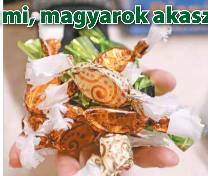
Karácsonykor háztartásonként átlagosan egy kilogramm szaloncukor fogy el.

A karácsonyfá-állítás szokása Németországból érke-