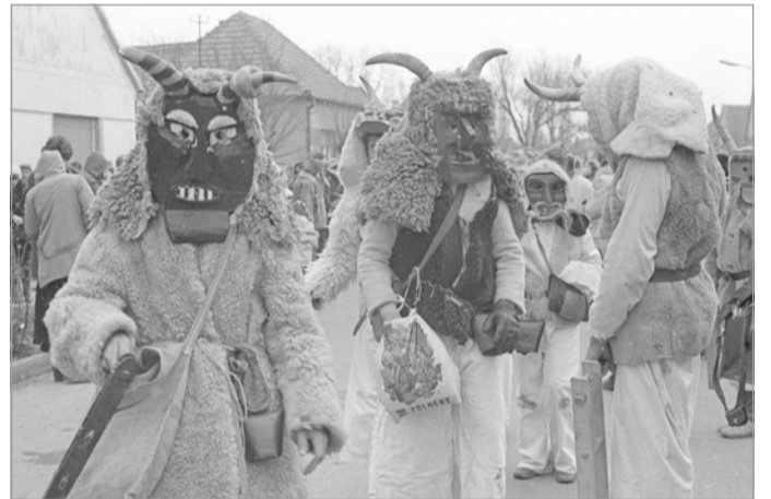
Busójárás Mohácson.

A húshagyó keddet követi a hamvazószerda, amely a 40 na-