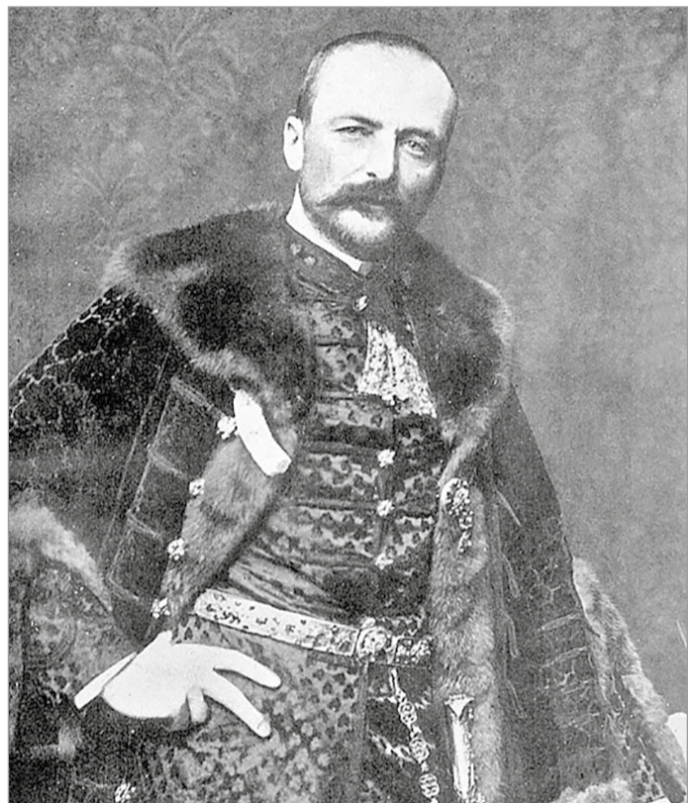
Tisza István első miniszterelnöksége idején (1903. november 3. – 1905. június 18.)

ben fiatalember, holnap reggelre idehozzuk” volt a válasz, így aznap családostan indultam haza. Mikor másnap megérkeztem, már mindent értem: a zsúrkocsin tornyosuló aktarengetergbe magasodó látványa megdöböntően hatott a számító-gép világában szocializálódott énemre, de a kezdeti rémületet legyőzve belevettem magam a város száz évvel ezelőtti ügyeibe. Ekkor találtam rá egy bizonyos