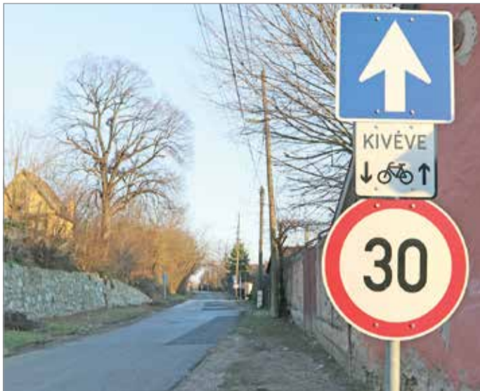
Március elején vizsgálják meg, hogy szükséges-e a forgalmi rend további módosítása.