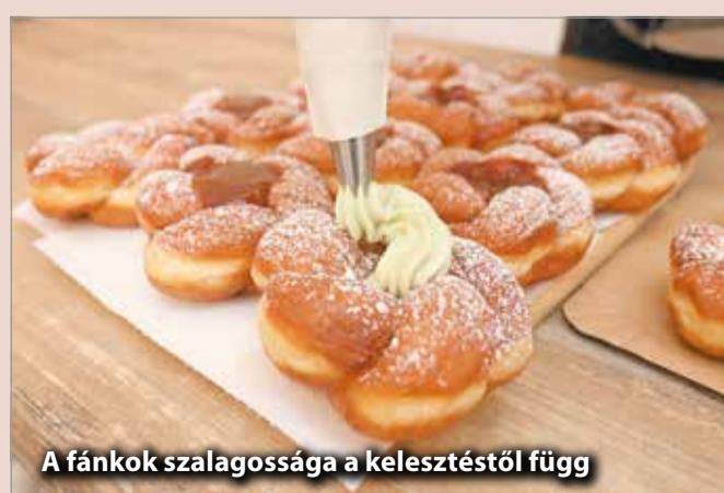
A fánkok szalagosága a kelesztéstől függ