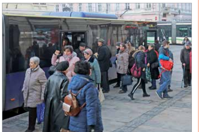
A legnagyobb hitelfeltevő a maga 4,6 milliárdjával az MVK Zrt.

Végül elhangzott: az átvilágítás részletekbe menően folytatni fogják, és a közeljövőben kiterjesztik az önkormányzati intézményekre is. A Miskolc Holding átalakítása tehát megkezdődött, új a cégstruktúra, vezetői szinteket szüntettek meg, takarékosági intézkedéseket léptettek életbe, a Városháza és a Holding pedig egyeztet a cégcsoport és a városi költségvetés konszolidációjáról. K.I.