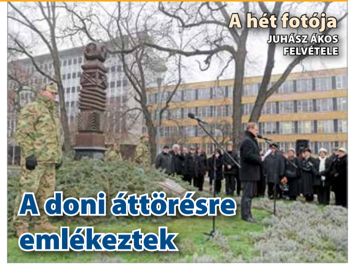
A hét fotója JUHÁSZ ÁKOS FELVÉTELE

A Borsod-Abaúj-Zemplén Megyei Főügyészség vádat emelt hat személy ellen költségvetési csalás, csödbűncselekmény büntette és hamis magánokirat-felhasználás vétsége miatt. A vád szerint az egyik vádlott ügyvezetése alatt működő elektronikai termékekkel foglalkozó gazdasági társaság, amely Hongkongból szerzett be termékeket magyarországi forgalomba hozattal, olyan számlázási láncolatot állított fel, amelynek során a vádlott-társai által képviselt gazdasági társaságoktól számlákat fogadott be, és azok ÁFA-tartalmát jogellenesen levonásba helyezte. A láncolatban voltak országghatáron kívüli gazdasági társaságok is, és olyan közbeiktatott cégek, amelyek a számlák szerint az árukat további cégeknek értékesítették, majd az adó megfizetése nélkül elérhetővé váltak. A felépített rendszer adókirovására irányult, és a vádlott részéről az elektronikai termékek európai közösségi értékesítése nem igazolható, adólevonási jogot nem gyakorolhatott volna, cselekményével ÁFA adónemben a költségvetésnek 69 717 068 forint kárt okozott. Az érintett gazdasági társaságot az adóvizsgálat alatt értékesítették, és létrehozott egy újabb gazdasági társaságot, amely átvette az eredeti kft. helyét. Ezen az egyik vádlott-társ ügyvezetésében működő gazdasági társaság valótlan tartalmú számlákat fogadott be, adóbevallásaiban felhasználta,