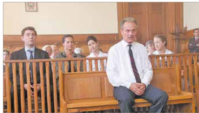
Béres József életéről most először készült egész estés mozifilm

ahhoz, hogy a néző tovább tudjon jönni. A filmben nem. A film közel jön, sokszor már elég, ha az ember csak rágondol valamire, és az látszik. Az is kontextusban lesz a vágásnak köszönhetően, így hatásos és érthető is marad. Sokat tanultam eddig is, és van még mit tanulnom. Most már az apaszerepek, a rendőrfőnök-szerepek, illetve az orvosszerepek találhatnak meg, de nincs ezzel semmi baj.