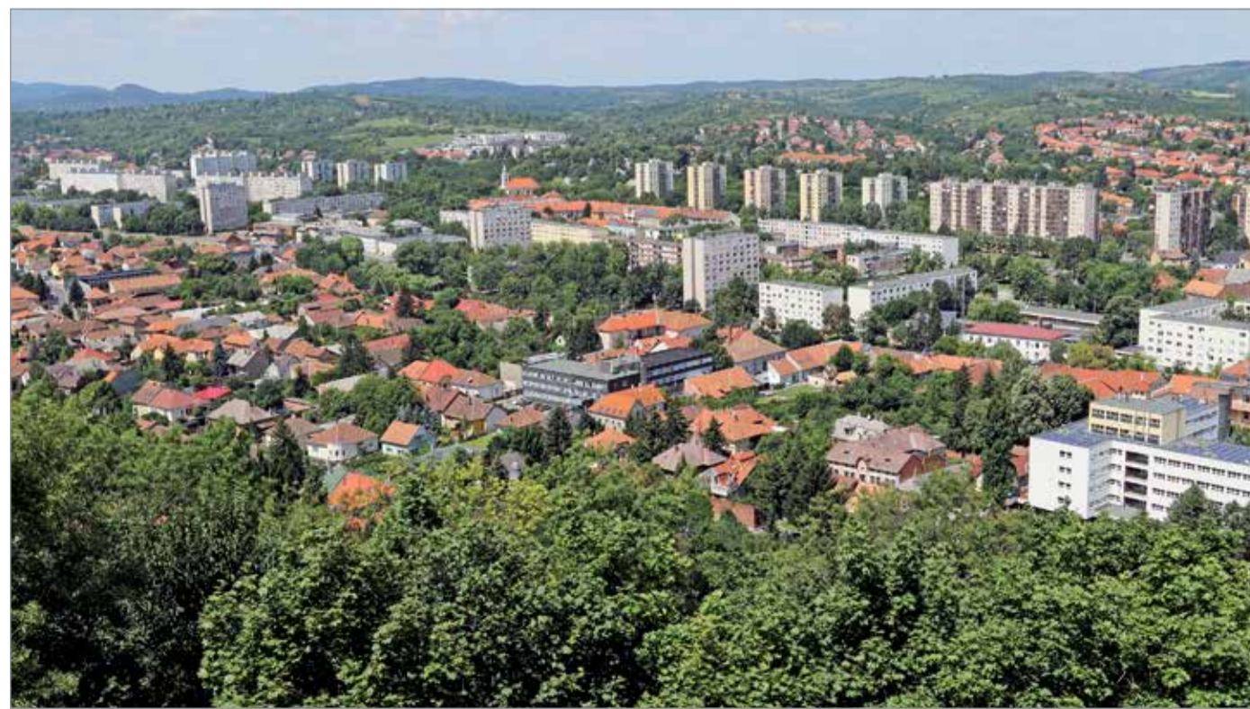
A város költségvetésének tervezése már elkezdődött.

– Ez a helyzet hogyan befolyásolja a fejlesztéseket?