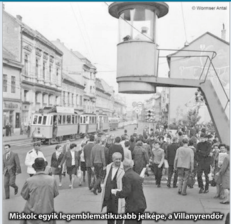
Miskolc egyik legemblematikusabb jelképe, a Villanyrendőr