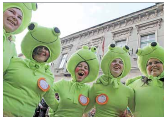
A Kocsonyafesztivál visszatér szülővárosába.

gandisztikus felelősségre vonás. Megalapozatlanul senki ellen nem teszünk feljelentést, mint ahogy ezt az előző városvezetés tette. Ellenben kell hogy legyen felelőse annak, hogy a Holding gazdálkodásában közel 53 milliárd forintos hiány keletkezett az elmúlt években. Jogászok bevonásával már vizsgáljuk a szerződéseket, az előző vezetés által kötött kötelezettségvállalásokat, és jogi úton keressük a város igazát.