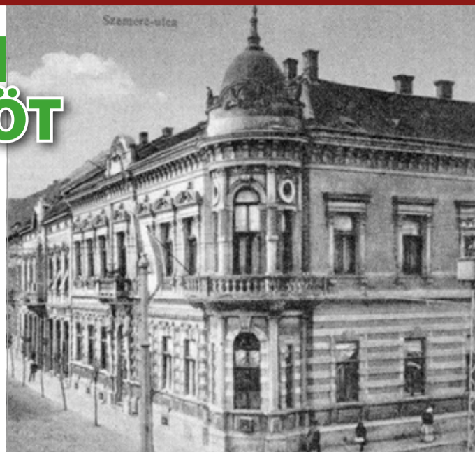
Az Ügyvédi Kamara székháza a Szemere és a Kandia utca sarkán 1916-ban

Hogy pontosan milyen megfontolásból, azt nem tudni (valószínűleg a párt népszerűségét akarták növelni a városban), de a Miskolchoz sehogyan sem köztöltő miniszterelnököt az 1905-ös választásokon épp a város északi kerületében indították el, pont ott, ahol Bizony Ákos is indult az országgyűlési képviselőségért. Tisza Istvánt megérkezésekor a Gömöri pályaudvaron, majd szálláshelyén, a Korona szállóban is atrocitások érték, végül a rendőrség zavarta szét a tömeget. A két párt aktivistáit deszkakerítésekkel választották el egymástól, tartva a komolyabb incidensektől. Bár a különböző médiumok más-más eredményeket hoztak le, végül hivatalossá vált, hogy Miskolc mindkét körzetében a Függetlenségi Párt képviselője győzött, Bizony Ákos 507-398 arányban kerekedett felül az épp regnáló miniszterelnökön. A választási