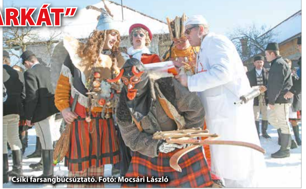
Csíki farsangbúcsúztató.

Farsangkor többféle dramatikus játékokat is szerveztek. Például megelevenítették a lakodalmat, amiben maszkos alakoskodók, tréfacsínalók vettek részt, akik a közönséget szórakoztatják. De ugyanígy halottas játékok is voltak a farsang farkához kapcsolódóan: ekkor tetteket el az emberek a farsangot. A farsangtemetés pedig a téltemetés egyik formája is volt. – Vidékünkre jellemzőek a kivégzést utánzó játékok. Egyik formája Sajónémetiben maradt