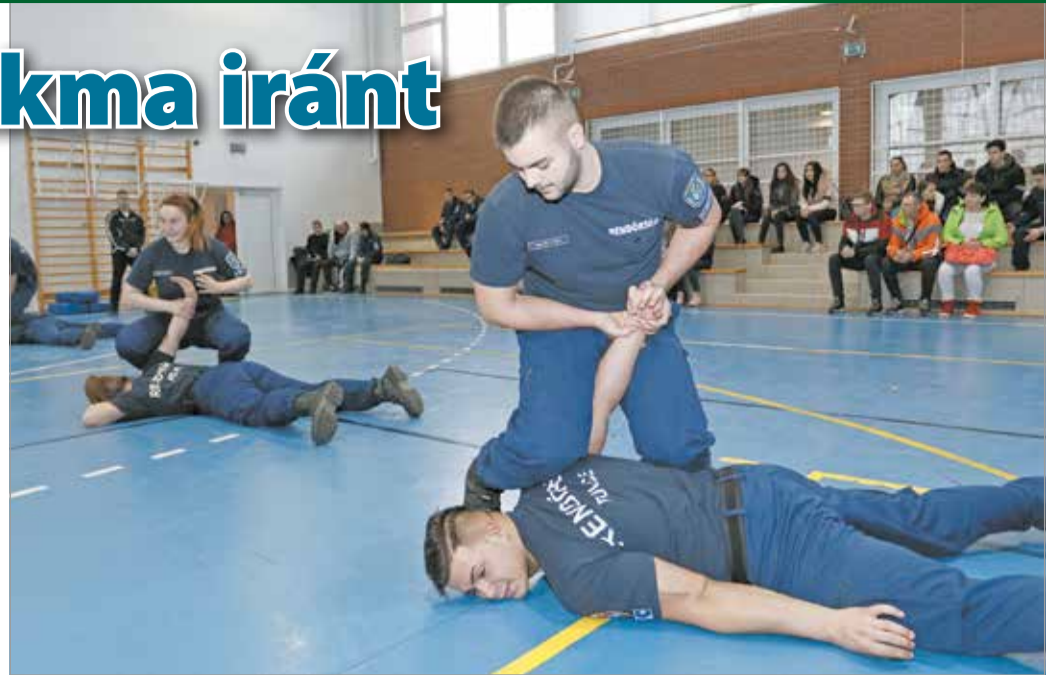
A leendő diákok több bemutatót is megnéztek.

bűnügy vonzza, de eddig még nem gondolkodott azon, hogy jövőre, milyen szakirányt fog választani. Jövőre 6 hetet leszünk bent az iskolában, és 6 hetet kint, a területileg illetékes rendőri szervnél, majd az utolsó félévben kell szakirányt választani – tette hozzá.