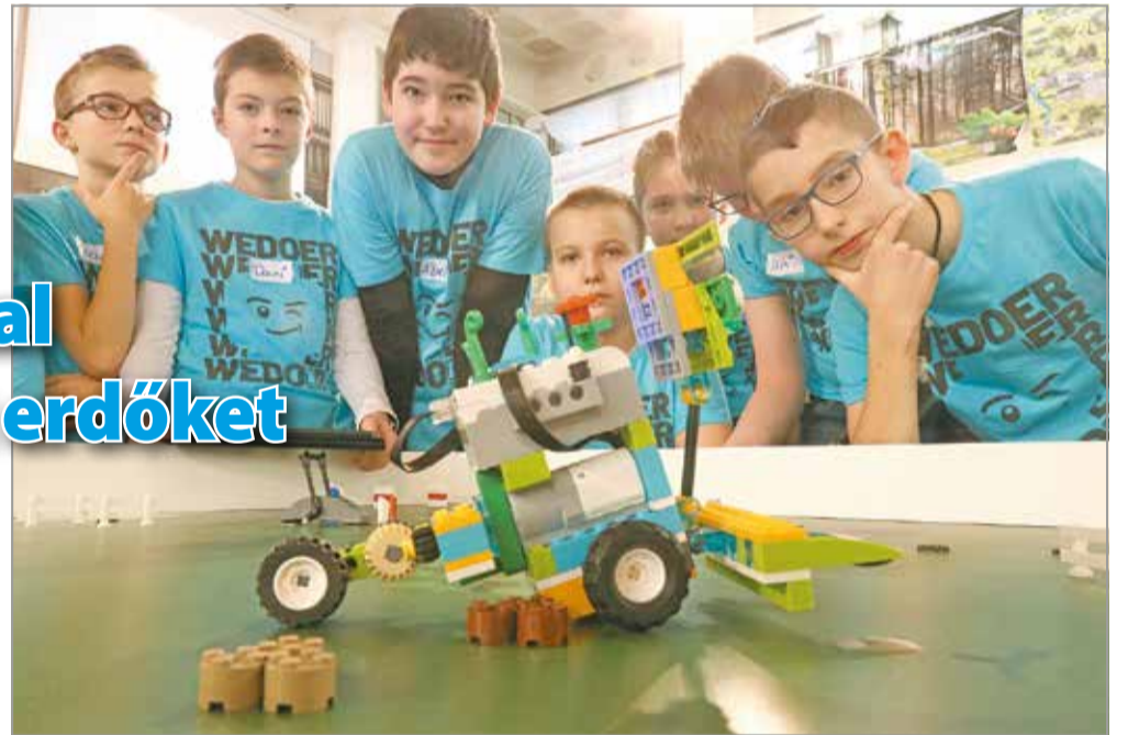
A gyerekeknek erdészeti problémákra kellett megoldásokat találniuk.