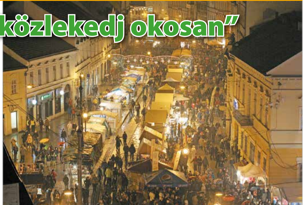
A Villanyrendőrnél, az Erzsébet és a Szent István téren várják majd könnyűzenei programok a közönséget.

A Hunyadi utcán, a Polgármesteri Hivatal előtti útszakaszon a zárás kezdete február