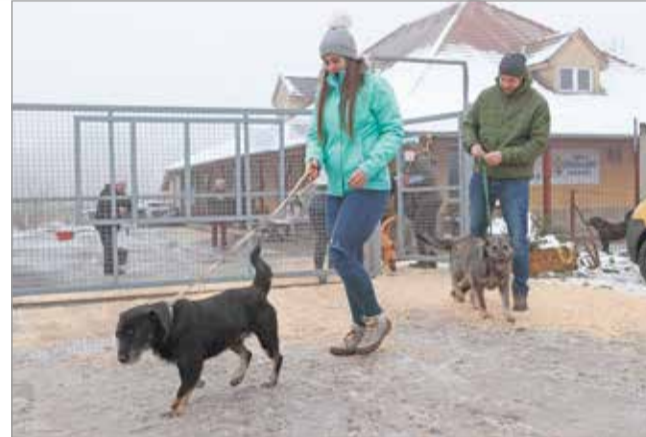
Évente ötszáz kutyát fogad be a MÁSA.

Miskolc jegyzője szerint a mintaprogram egyfajta felmérésnek is tekinthető, ami a ké-