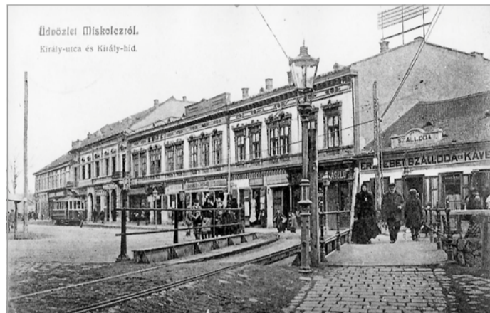
A Király utca és a Király híd 1913-ban

„Túl sok az árnyék ebben a városban, ezért döntöttem úgy, hogy a fényről fogok írni. Miskolc ezernyi titkát csak elhullajtotta az emlékezet, hogy egyszer újra megtaláljuk őket. Amint felemeljük és markunkban tartjuk, máris fényesedni kezdenek” – írja Miért Miskolc? című kötetében Fedor Vilmos. A lokálpatrióta 63 válaszban indokolja meg, hogy miért szereti Miskolcot.