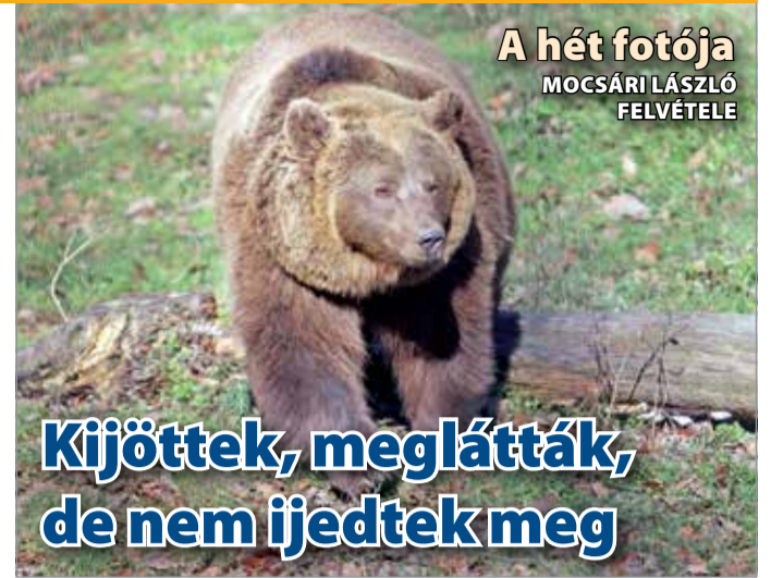
A hét fotója