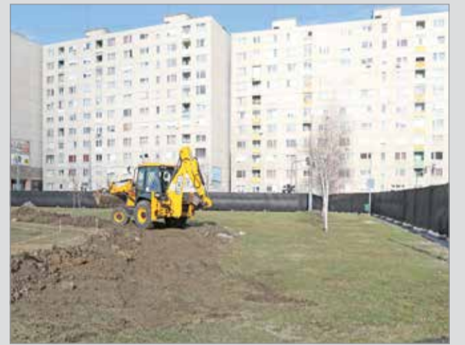
A téren új sétányok is helyet kapnak.

A munkával várhatóan 2020. őszére végez a közbeszerzési eljárás nyertes kivitelező, a DHJ Építő Kft. A felújítás mintegy 299 millió forintból, a Diósgyőri városközpont integrált rehabilitációja projekt keretében valósul meg.