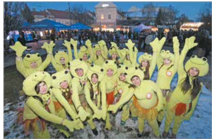
Hazatér Miskolcra a Kocsonyafesztivál

A Kocsonyafesztivál szervezői azonban nemcsak azt szeretnék garantálni, hogy a fesztiválózóknak idén újra színvonalas programok közül válogathassanak, hanem arra is törekcsenek, hogy a rendezvények