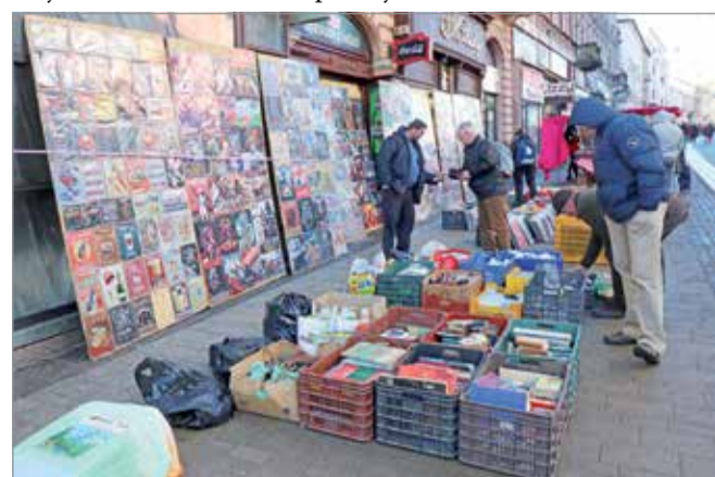
Programokkal is igyekeznek majd csalogatni az embereket.