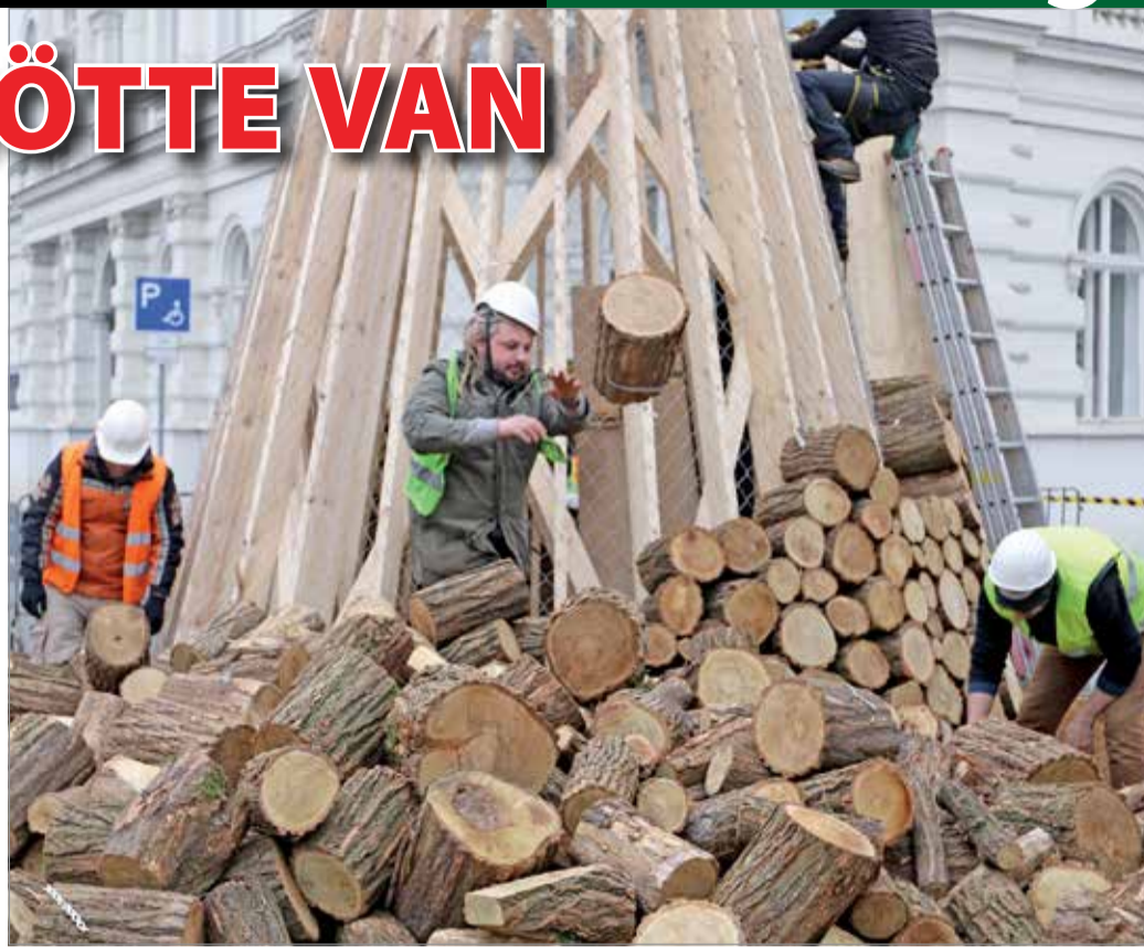
A rászorulókat segíti a tűzifából megépült adományfa, amely az ünnepek alatt látványosságként szolgált a Városház téren.

A MESZEGYI az a szociális intézmény Miskolcon, amelyik a gyermekjóléti alapelállástól kezdve az idősök ellátásáig a teljes szociális vertikumot lefedi. Ennek az intézménynek a látókörében vannak azok a legrászorultabb, legelesettebb családok, amelyeknek valamilyen szociális segítséget kell nyújtani. Több mint kétezer családról van szó, miközben szociális tűzifaosztásra a város 200-300 család számára elegendő fát tud éves szinten biztosítani. Sokkal többre lenne tehát szükség, mint ami rendelkezésre áll. Amikor az új városvezetés ezt a kérdést elkezdte átgondolni, akkor az alpolgármester leült egyeztetni azokkal a szociális szakemberekkel, akik évtizedek óta végzik ezt a feladatot, és megkapták tőlük a jelzést, hogyan érdemes