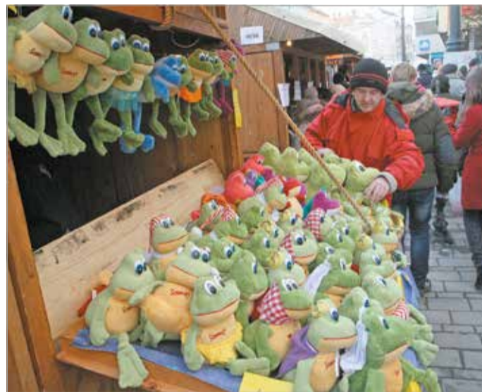
Február 14. és 16. között Miskolc ismét a „béka szigete” lesz

A lezárások mellett a Miskolci Önkormányzati Rendészet munkatársai folyamatos járőrszolgálatot látnak el, ennek elsődleges célja a fesztiválra érkezők tájékoztatása, útbaigazítása és segítése mellett a közbiztonság fenntartása. A lezárt területekre csak behajtási engedély birtokában lehet behajtani, kizárólag a rendezvény nyitvatartási idején kívül.