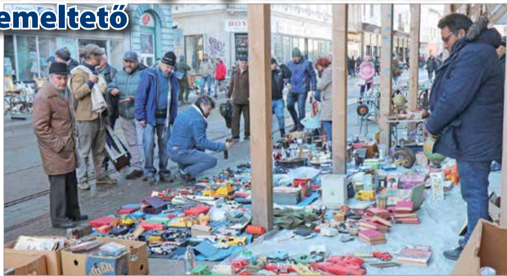
A februári régiségvásárt már az új üzemeltető szervezte