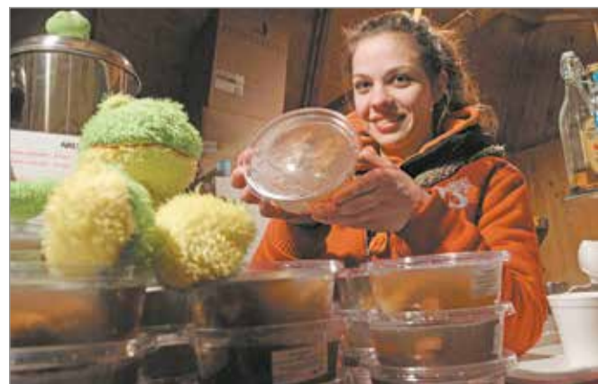
A kóstolóadag ára 490 forint lesz.

És ahogyan azt idén újra el is készítik majd, ki tudja, hányféle titkos, féltve őrzött recept szerint, amelyeknek valószínűleg az egyetlen közös összetevője a „miskolciság”, amiről itt fent, az ország északi csücskében mindenki pontosan tudja és érzi,