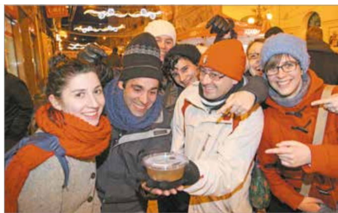
A fesztiválózóknak új színvonalas programok közül válogathatnak

Pénteken, szombaton és vasárnap napközben, 5:00 és 21:00 óra között a Színpark/Centrum, illetve a Malomszög utca között szállítják majd buszok az utasokat, míg a Tiszai pályaudvar és a Színpark/Centrum, illetve a Malomszög utca és Felső-Majláth közötti szakaszon továbbra is villamosok közlekednek. A 2-es villamos helyett az Újgyőri főtérről induló buszokat lehet igénybe venni a Vasgyár irányába, illetve a Vasgyárból az Újgyőri főtérről. További információk és a részletes menetrend az MVK Zrt. honlapján olvasható.