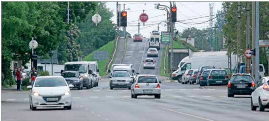
A beruházás második ütemében kezdik meg a Vörösmarty utcai felüljáró bontását, és a híd építését.

A munkálatok első ütemében a kivitelező az Y-híd Vörösmarty és Kisfaludy utcák találkozásától keleti irányban tervezett támaszait alakítja ki, valamint