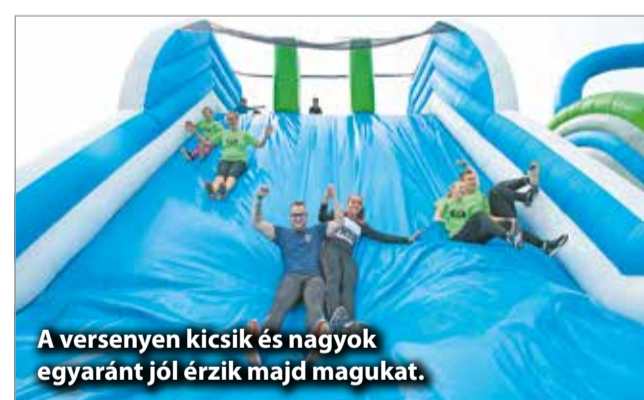
A versenyen kicsik és nagyok egyaránt jól érzik majd magukat.

Újra megmozdul az ország a CRAZY5K Sprintnek köszönhetően, hiszen elindult a nevezés a rendezvénytársaság tavaszi állomásaira.