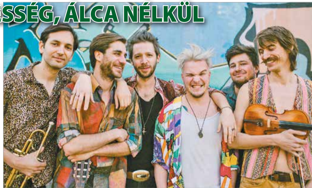
Pénteken este a Villanyrendőr színpadon lép fel a Bohemian Betyars

– Nyilván rengeteg dolog történt a zenekarral, a fél világot bejártuk közben, nagyon sok mindent láttunk, hallottunk. A legfőbb változás talán