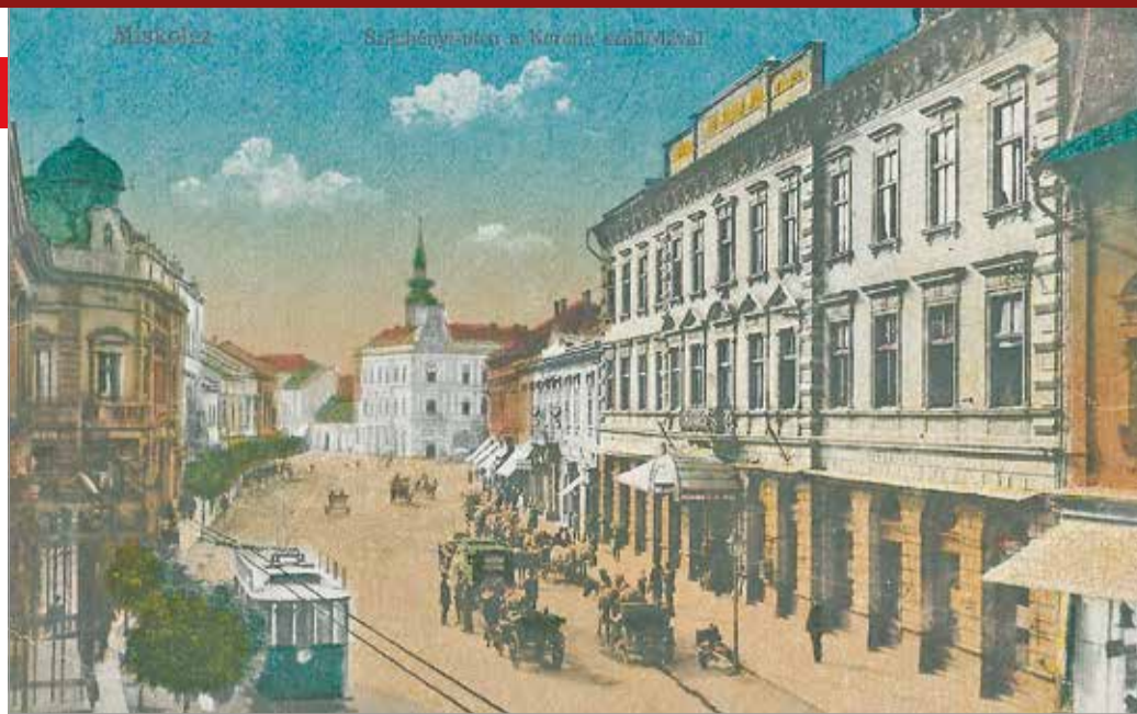
A Széchenyi utca a Korona szállóval 1913-ban.