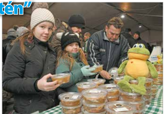
Egy jó tál sertéskocsonya 850 forintba kerül majd

Egy jó tál sertéskocsonya 850 forintba kerül majd, a kóstolóadag ára pedig – gondolva a diétázókra, a gyerekekre, a csak kóstolni vágyókra és azokra is, akik egy gasztrotü-