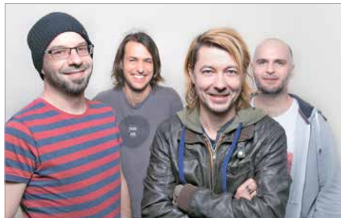
Vasárnap a Villanyrendőr színpadon lép fel a 30Y

Február 14. és 16. között ismét megtöltik Miskolc főutcáját a finom illatok, a hömpölygő tömeg, a fergeteges hangulat, a fabódék sokasága és a színpadok felől dübörgő ritmusok. A hamisítatlan fesztiváli hangulatról több tucatnyi koncert, számos gyermek- és családi, valamint kulturális és gasztroprogram gondoskodik az év legnagyobb téli gasztronómiai eseményén, a Kocsonyafesztiválon.