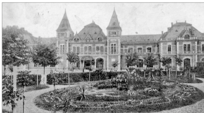
A Tiszai pályaudvar a 20. század elején

A kislány hamarosan elbó-biskolt, nagymamája mosolyogva igazgatta meg a lebillenő fejet, úgy helyezkedett, hogy minél kényelmesebben pihenessen a kislány, szeretettel nyugtatta szemét a kicsin. Arca barázdái elárulták, hogy dolgos élet áll mögötte, unokája karját simító kézfejének ráncai őrizték a finom sütemények, kalácsok, sülték és megannyi finomság készítésének titkát. Mélyvörös hajában bőséggel csillantak az ősz szálak, ahogy végigfutottak rajta az apró sugarak, smaragd szemek elgondolkodva néztek ki az ablakon. „Istenem, ez előtt... hány évvel is? Épp így utaztam nagyapámmal...” S egyszer csak újra lát-