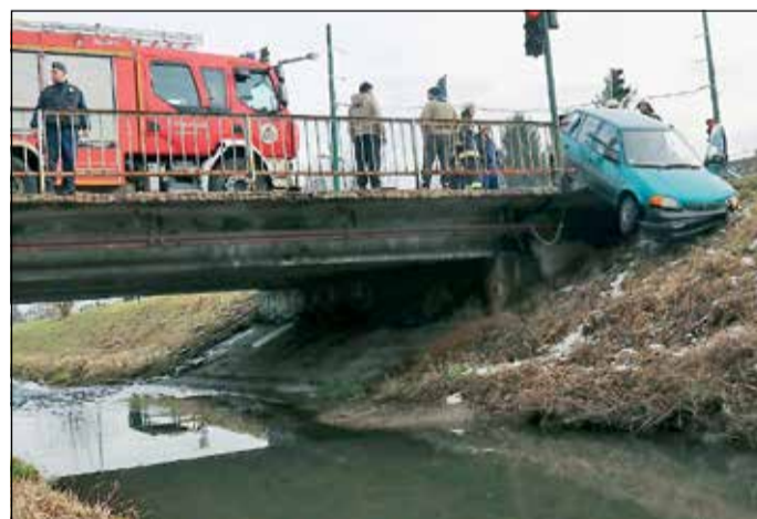
További rendőrségi, katasztrófavédelmi, bírósági hírek első kézből hírportálunkon, a www.minap.hu honlapon.

Baleset történt a Kiss Ernő és a Thököly utcák kereszteződésében, aminek következtében egy autó átszakította a Szinva-híd korlátját, és lelógott az útról. Egy autós a Vasgyár felől érkezett a kereszteződéshez, amikor vélhetően rosszul tájékozódott a forgalmi rendről, és bekanyarodott a hídra. Ezt látva egy másik sofőr, hogy elkerülje az ütközést, elrántotta a kormányt, ezért kocsija átszakította a korlátot. Az hídról lelógó járművet a katasztrófavédelem munkatársai húzták vissza az úttestre. A balesetben személyi sérülés nem történt.