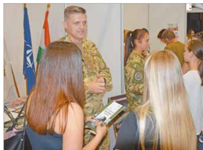
Folyamatos az érdeklődés a honvédségben vállalható szolgálati lehetőségekről.