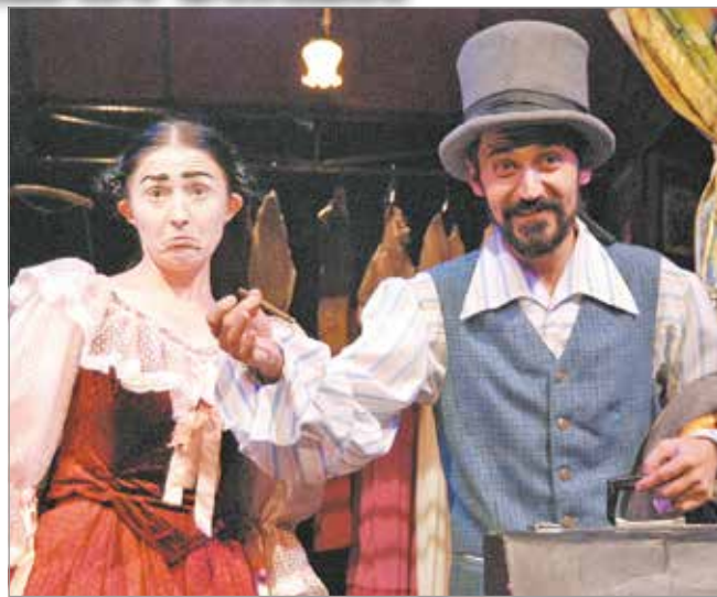
A Liliomfit is előadták

Juhász Ferenc A sarvas-sá változott fiú című költeményből Vidnyánszky Attila 2003-ban nagy sikerű színházi előadást rendezett, 2014-ben pedig filmre vitték Töröcsik Mari és Trill Zsolt főszereplésével, melyet most