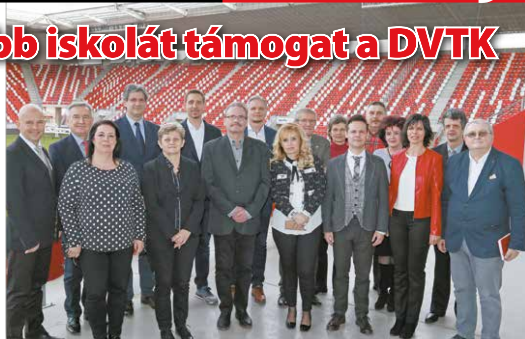
Tíz intézménnyel vette fel a kapcsolatot a DVTK.

Első körben tíz intézménnyel vették fel a kapcsolatot: Diósgyőri Gimnázium, Földes Ferenc Gimnázium, Herman Ottó Gimnázium, Bársony János Általános Iskola, Diósgyőri Nagy La-