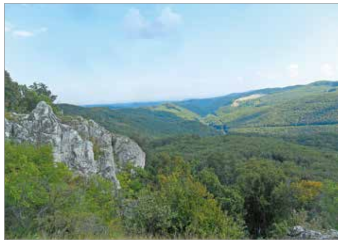
Solyom kö.

Itt minden évszak gyönyörű. A tavasz harsogó zöldje, a madarak párválasztó trilláitól hangos erdő, az ételt követelő utódokkal megtelt fészkek, a május pettyes ögzidái és a virágok, melyek színes festékpöttyökként lepik el a völgyeket és a patakok partját. Aztán a nyár meleg takaró