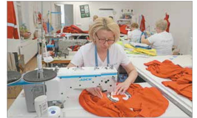
A varrodában munkaruhákat és gyerekágyneműket készítenek.

Bodnár Erika kommunikációs munkatárs elmondta, a Vöröskereszt hajléktalanszállót és bölcsődéket is működtet. – Varrtunk már ágyneműket nekik és egyenruhákat a hölgyeknek és a Vöröskereszt munkatársainak, de vállalnak a lányok kívülről érkező megrendeléseket is – tájékoztató. Ez a