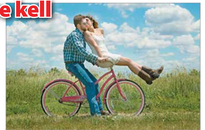
„Boldognak is kell lenni, közben.”