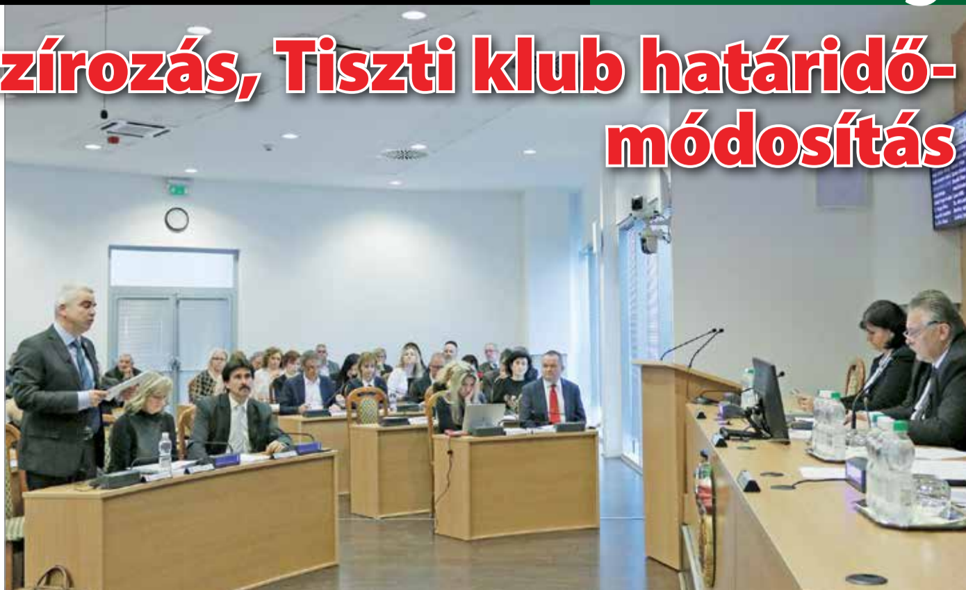
A közgyűlés elé került a volt Tiszti klub sorsa is.

A közgyűlés elé került a Csegey Gusztáv utca 3. szám alatti épület – ahogy a miskolciak többsége ismeri, a volt Tiszti klub – sorsa is. Az ingatlant a miskolci önkormányzat 2014-ben adta el a Magyar Cserkészszövetségnek azzal a kikötéssel, hogy a romos házat felújítják. Ennek határidejét 2017-ben egyszer már meghosszabbították, az előterjesztés most újabb módosításra, hosszabbításra tett javaslatot. A közgyűlésről élő tudósítást olvashatnak a minap.hu-n.