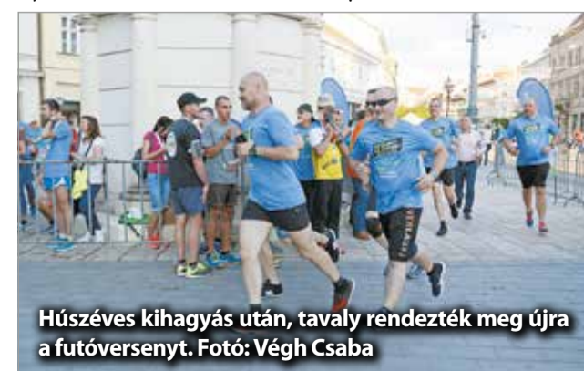
Húszéves kihagyás után, tavaly rendezték meg újra a futóversenyt.

A III. Kassa-Miskolc Ultramaratonnal a hazai és külföldi hosszútávú futó társadalom számára kínálnak remek méretelési lehetőséget. A két testvérváros közötti 115 km-es távot egyéni futók, illetve az 5 és 10 tagú férfi, illetve mixváltók teljesíthetik. Ez utóbbi két kategória jó alkalom csapatépítésre, munkahelyi, egyesületi, baráti közösségek erősítésére is. A nevezés már megy a rendező miskolci Marathon Club honlapján, a www.maratonclubmiskolc.hu oldalon, ahol az érdeklődők a magyar mellett szlovák és angol nyelven is regisztrálhatnak, illetve a versenykiírásból, pályaleírásból hasznos információkhoz juthatnak. Február 25-éig tart a legkedvezményesebb regisztráció. A jelentkezésre legkésőbb március 31-éig van lehetőség, helyszíni nevezés nincs.