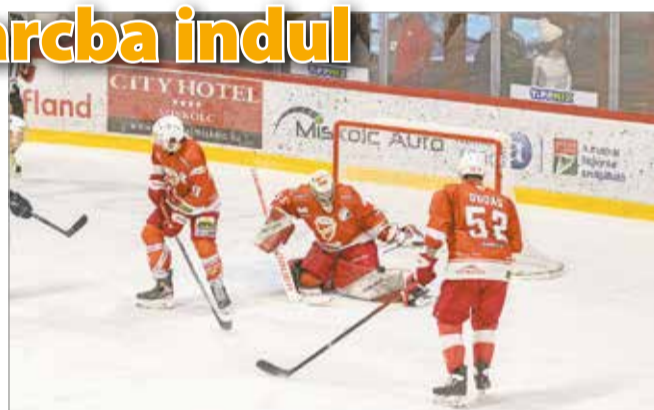
Jegesmedvék is bekerültek a keretbe.

Már az első feladat is keménynek ígérkezik, hiszen például Nagy-Britannia két évvel ezelőtt éppen Budapestben előzte meg a magyar nemzeti csapatot a divízió 1/A világbajnokságon, és azóta is a legjobbak között szerepel. A magyar válogatott