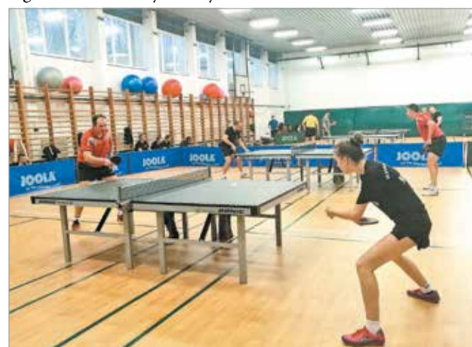
A három bajnoki találkozót két-két asztalon bonyolítják le