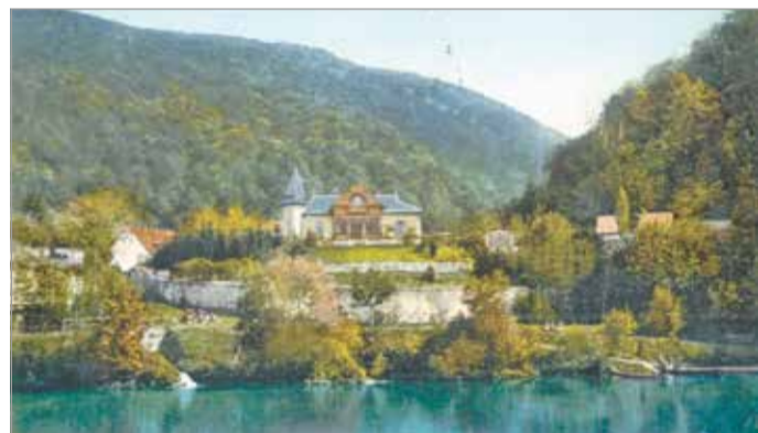
A Weidlich-villa a Hámori tó partján