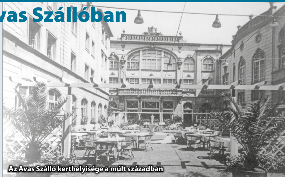
Az Avas Szálló kerthelyisége a múlt században

Erről a Hunguest Hotel idejében lemondott a város javára. Többen is pályáztak rá komolytalan ajánlatokkal. Egy éjszakán egy rejtélyes kínai befektetővel is bejártuk a már patkányoktól hemzsegő épületet. Az étterem konyháját, a Fapadost és a Vörös termet. Végül a Déli Hírlap kft. kapta meg hasznosításra. Így lett ez Miskolc első bevásárlóközpontja. Bérelhető vásári pavilonokkal csaknem két évig sikerült életet lehelni a Fehér terembe, s osztozhattunk a bevétel az önkormányzattal. Volt egy élelmiszerüzlet és sok divatárus stand. A bérletéből