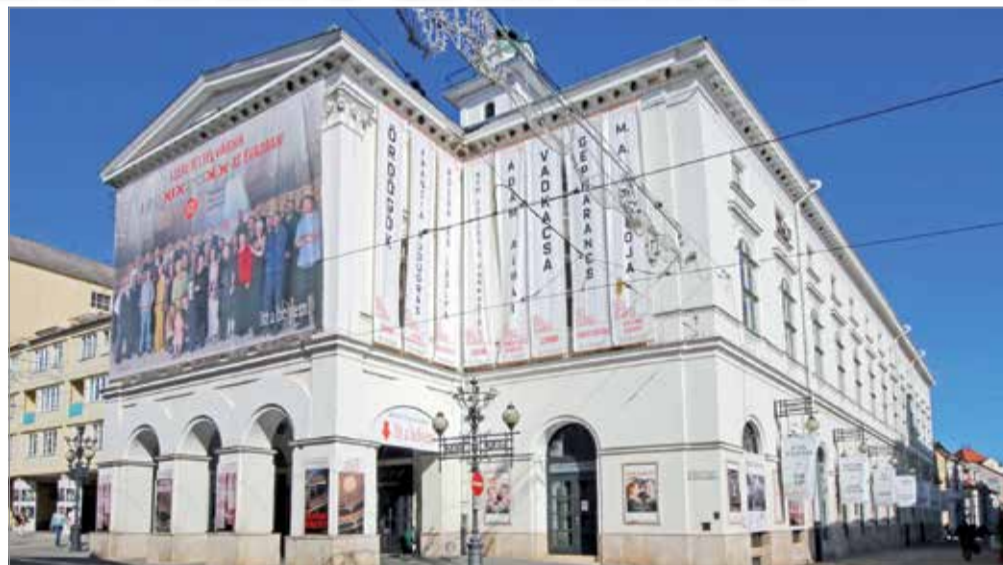
A Miskolci Nemzeti Színház szeretné a meglévő művészeti színvonalat fenntartani.

hogy milyen feltételek mentén és milyen összegben van lehetőség a két színház támogatására, illetve hozzájárulnak-e a fenntartásukhoz. Mi beterveztük a korábbi összeget, annak ellenére, hogy takarékos városi költségvetést készítettünk. Ezzel is szeretnénk megmutatni, hogy nekünk fontos a kulturális és a művészeti intézmények fenntartása. Az arányokból jól látszik, hogyha nem kapunk segítséget, akkor a következő évadot nagyon nehezen tudjuk elkezdni.