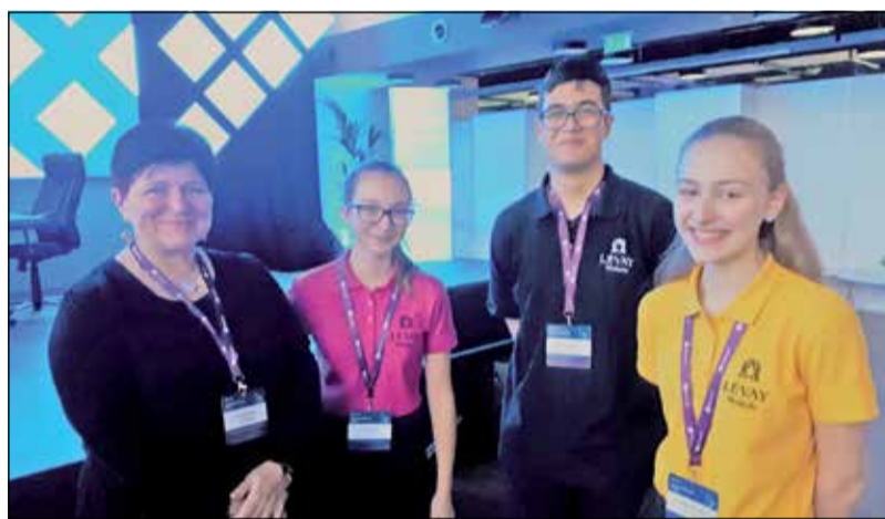
Tanulóink és kollégánk a Microsoft ENVISION FORUM-on

A hatév folyamatos képzés keretei között egy osztály indul. Harmadik éve digitális, tehetséggondozó osztályként működik angol, valamint matematika-informatika tagozatokkal.