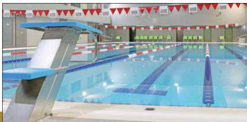
A Lévy Sportközpont uszodája a reggeli és esti órákban a nagyközönség számára is nyitva áll

Kedves Szülők! Kedves Tanulók! Alapos tájékozódást, bölcs mérlegelést és megfelelő döntést kívánunk!