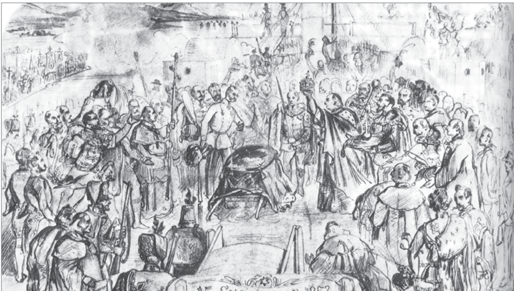
A korona azonosítása az Erzherzog Albrecht hajó fedélzetén 1853-ban