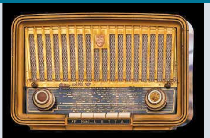
Ilyen rádiókon hallgatták a Szabad Európát

Talán ez volt az egyetlen időszak a sajtóházban, amikor mindannyian törölközővel, szappannal vonultunk a folyosó végi mosdóba. Jó ideig különböző trükkökkel kerültük a pacsit, és a hátbaveregetős