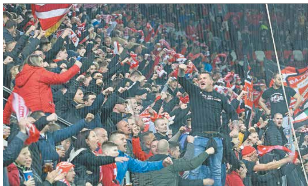
Több mint 8300-an szurkoltak a diósgyőri stadionban

Az OTP Bank Liga 25. fordulójában a Diósgyőr idegenben lép pályára, szombaton este a Fehérvár ellen zárt kapuk mögött játszik.