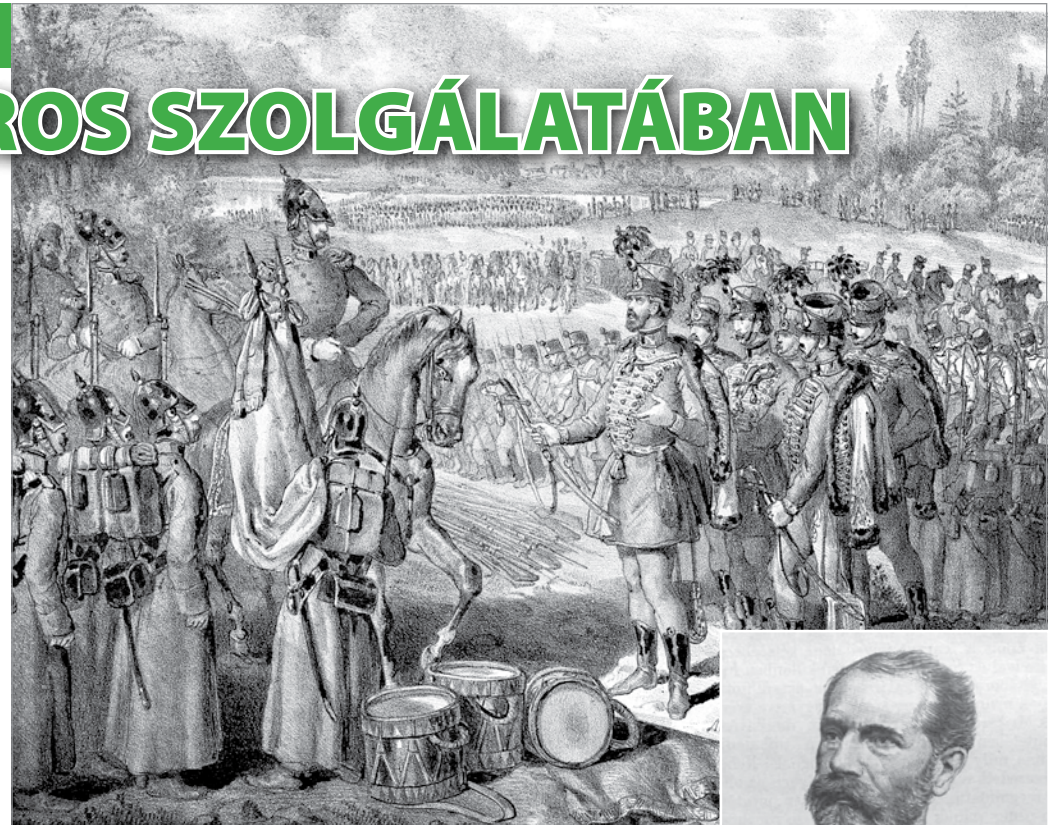
Magyar honvédtiszt átadja a kardját az oroszoknak

A temesvári csata után, augusztus 11-én Kossuth úgy nyilatkozott, hogy nem érdemes tovább szállítani a koronát, Szemere ennek ellenére nem mondott le a kimenekítésről. Lugoson, majd Karánsebesen is el akarták rejteni, végül Orsován sikerült. Szemere három