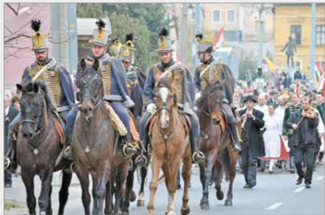
Március 15-e több mint egy történelmi esemény.