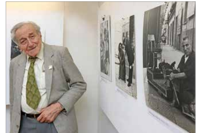
Farkas Gyula fényképeiből szerdán nyílt kiállítás.