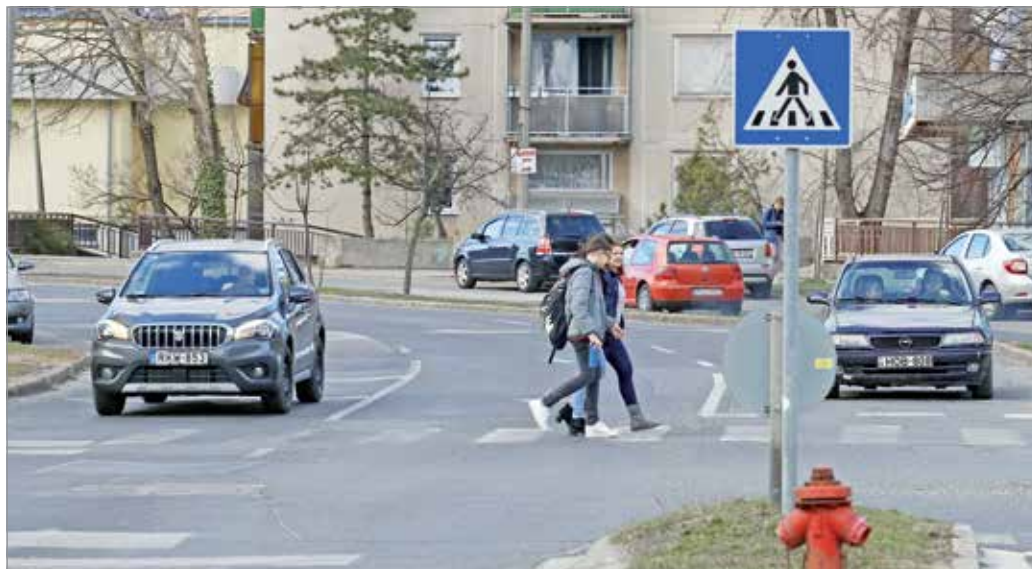
Az avasi gyalogátkelő is több figyelmet igényelnék a közlekedőktől.