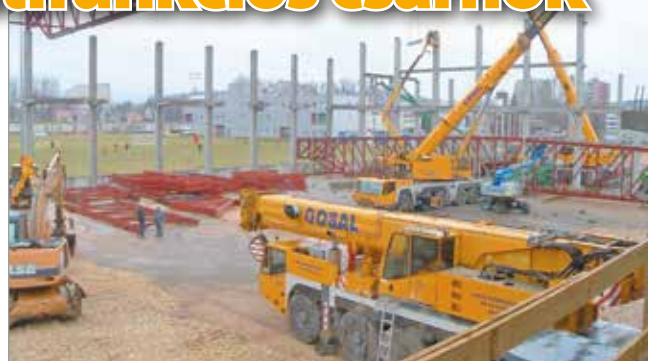
Öt szabvány méretű pálya és két félpálya fér el a csarnokban

Folyamatosan dolgoznak a szakemberek a DVTK multifunkciós sportcsarnokán. Tavaly nyáron tették le az alapkövet, jelenleg pedig már a vázszerkezet jelentős