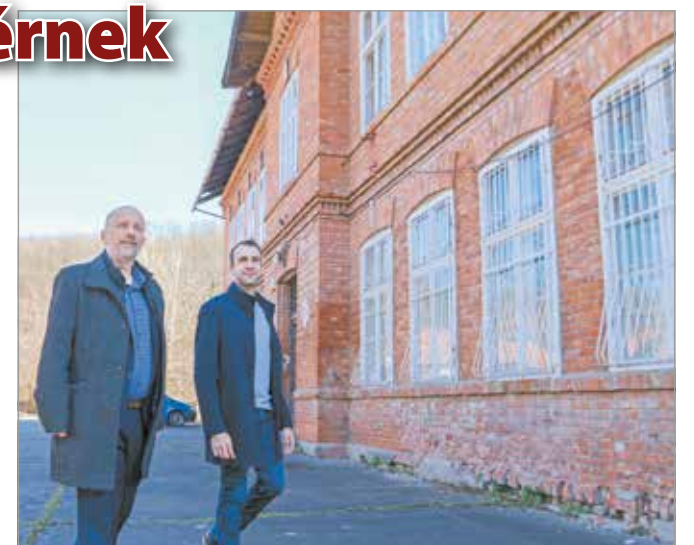
Bejárason mérték fel az épület állapotát.

A bejárati ajtó fölötti „Kabinet” táblák fogadják a látogatókat: Kuti István ’60-as években bevezetett módszerére, az ún. kabinet- és tálcás rendszerre utalva. A szaktantermekben számtalan „tálcás” – a témákhoz illő – szemléltetőeszközt is használhattak a diákok. Ez a módszer oktatók ezreinek keltette fel érdeklődését, és gyakorlati tudásuk miatt a középiskolák is szí-