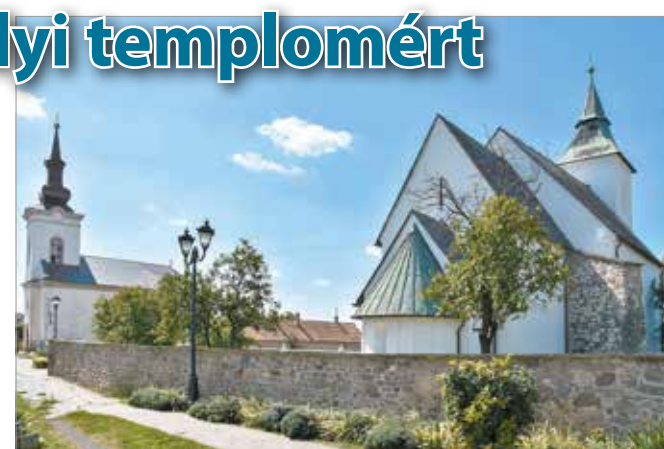
Összefogással élesztené újja görögkatolikus templomát Vizsoly

A mindössze 17x7 méteres, Istenszülő Elszenvedése nevű, kedves kis görögkatolikus templomnak azonban pillanatnyilag ez a közösségi összefogás az egyetlen esélye a megmaradásra. A polgármester elmondása szerint javításra szorulnak