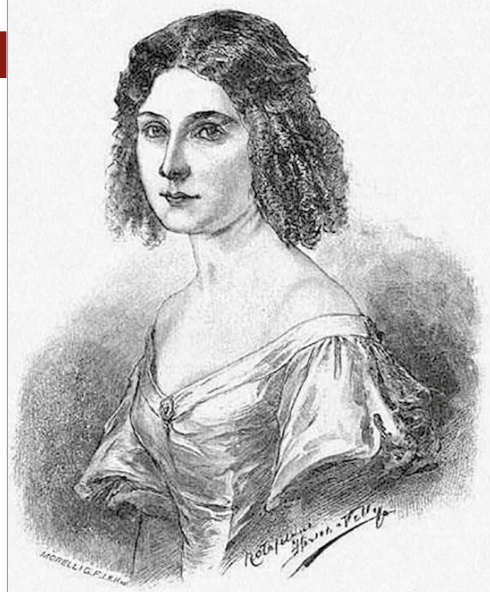
Hirsch Nelli idealizált Déryné-portréja egy korabeli metszet nyomán

Végül Déryné itt érte el népszerűségének csúcát, mesze városokból is jöttek nézők, hogy láthassák. Benke József és Déryné szerepe nagyban hozzájárult a miskolci színjátszás előmeneteléhez. „... Miskolcra, mint Magyar Nyelven beszéllő ... vidék közepén fekvő népes mező városban, állandó játékszint építeni és ki is nyitni akarunk” – vallotta ekkoriban a város vezetése, amelyet tettek is követték, így 1823. augusztus