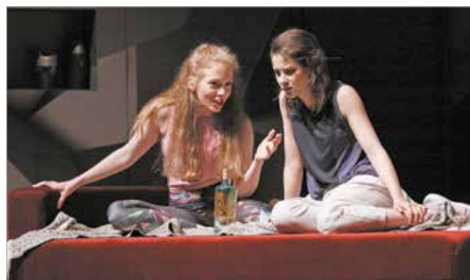
A Francia rúdugrást múlt héten mutatták be.