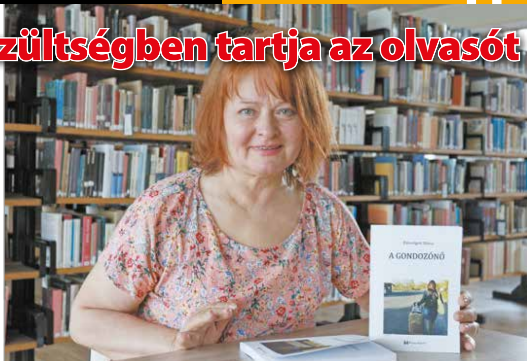
Hamarosan megjelenik a regény második kiadása is