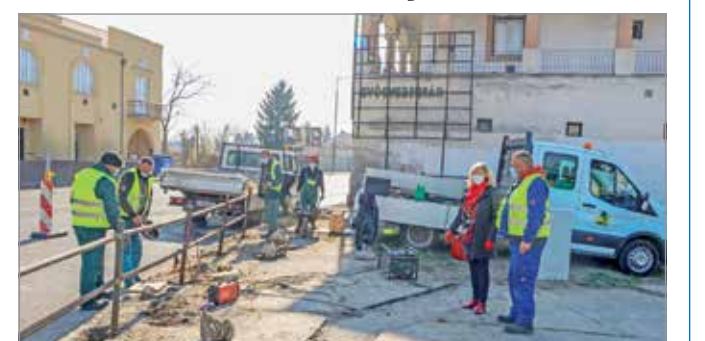
A hejőcsabai gyógyszertár környékét is rendbe tették

A képviselőasszony beszélt még további fejlesztésekről, erről bővebben olvashatnak a minap.hu oldalon.