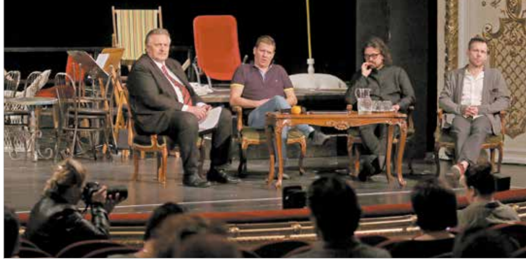
Szerdán tartotta évadzáró ülését a tétrum

– Amikor elindultunk, tudtuk, hogy nem lehet felépíteni – labdarúgó-hasonlattal – a Barcelonát. De az Ajaxot, a Portot lehet példaként állítani: a fiatal színészek mellett a nagy tekintélyek és a szakmaiság jól kiegészítik egymást, sőt