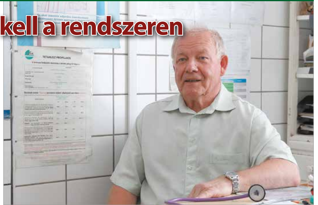
„A személyes kapcsolat és az ebből eredő bizalom nagyon fontos.”

Vallja, az egyetem elvégzésével még nem orvos valaki, „kellenek az évek”, hogy lássa a rendszert, szembesüljön a gondokkal, és elkezdje iga-