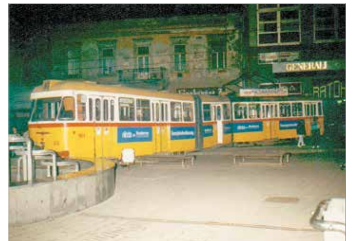
1996 októberében siklott ki egy Bengáli villamos a centrumnál

érkezett ide. Azonban ez már a sokadik sorozatgyártott széria egyik darabja volt, emlékeim szerint csak egy-két ezer kilométert kellett futnia a forgalomba állításig. A villamost Kassa annak idején