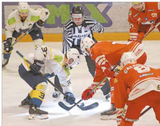
Október 2-án kezdődik a pontvadászat.

A Tipsport Liga csapatai megállapodtak a következő szezonról, és ennek alapján a DVTK Jegesmedvék a szlovák bajnokságban indulhat jövőre.