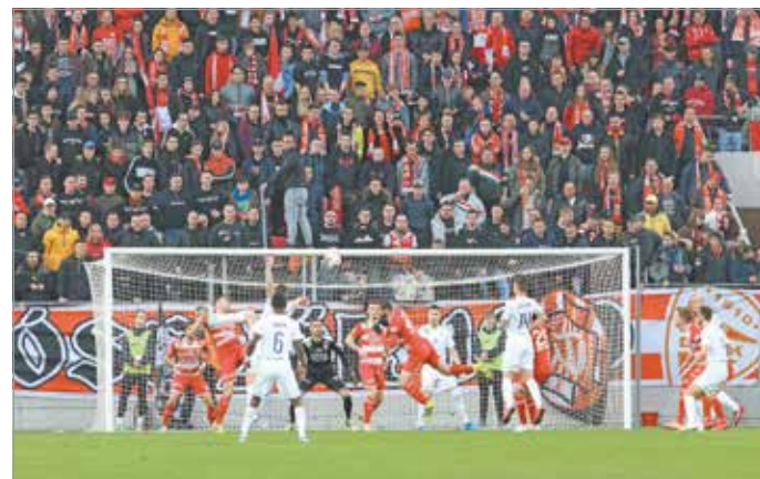
A téli felkészülés során sikerült olyan taktikai kommunikációt kialakítani, ami sorra szállította az eredményt.

A teljes interjú a dvtk.eu oldalon olvasható el.