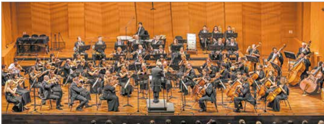
Az elmaradt koncerteket is pótolják a miskolci szimfonikusok.

Hagyomány és folyamatos megújulás egyszerre jellemzi a Miskolci Szimfonikus Zenekar 2020/2021-es zenei évadának programját. Két hagyományos bérletük – amelyekkel évről évre megörvendeztetik a zenekedvelőket –, a hét estét magában foglaló Tűzvárzás, valamint a négy alkalomra szóló Hangforrás mellett egy új sorozatot is meghirdetnek januártól a miskolci publikum számára Yamaha bérlet néven, amely a tavaly vásárolt versenyzongorájukra épül majd a hangszer zeneirodalmának remekeivel a műsorán.