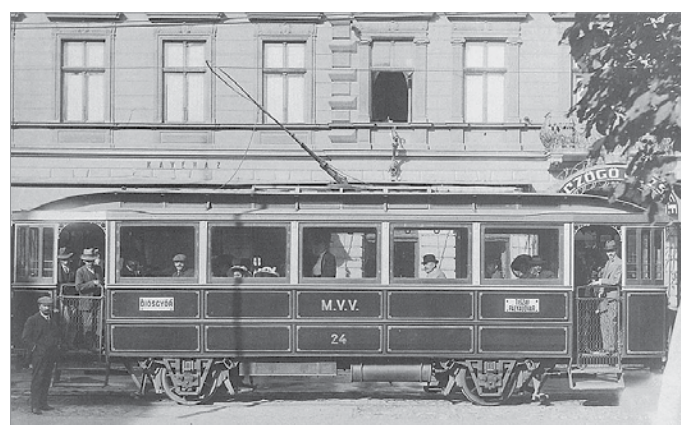
A forgalmat 1897. július 10-én indították

A villamospályát legutóbb 2010–2012 között újították fel teljesen, amikor a Zöld Nyíl projekt keretén belül a villamospálya rekonstrukcióját követően Majláth városrészig meghosszabbították az 1-es villamos vonalát (ezt egyébként annak idején a MiNap, később Miskolci Napló tudósításain keresztül is figyelemmel kísérhették). A projekt keretén belül nemcsak a pálya, de a villamosflotta is teljesen megújult: 31 korszerű, alacsonypadlós, kifejezetten Miskolc igényei szerint kialakított Skoda-szerelvény állt forgalomba. Bár a járműparkot teljesen lecserélték, az