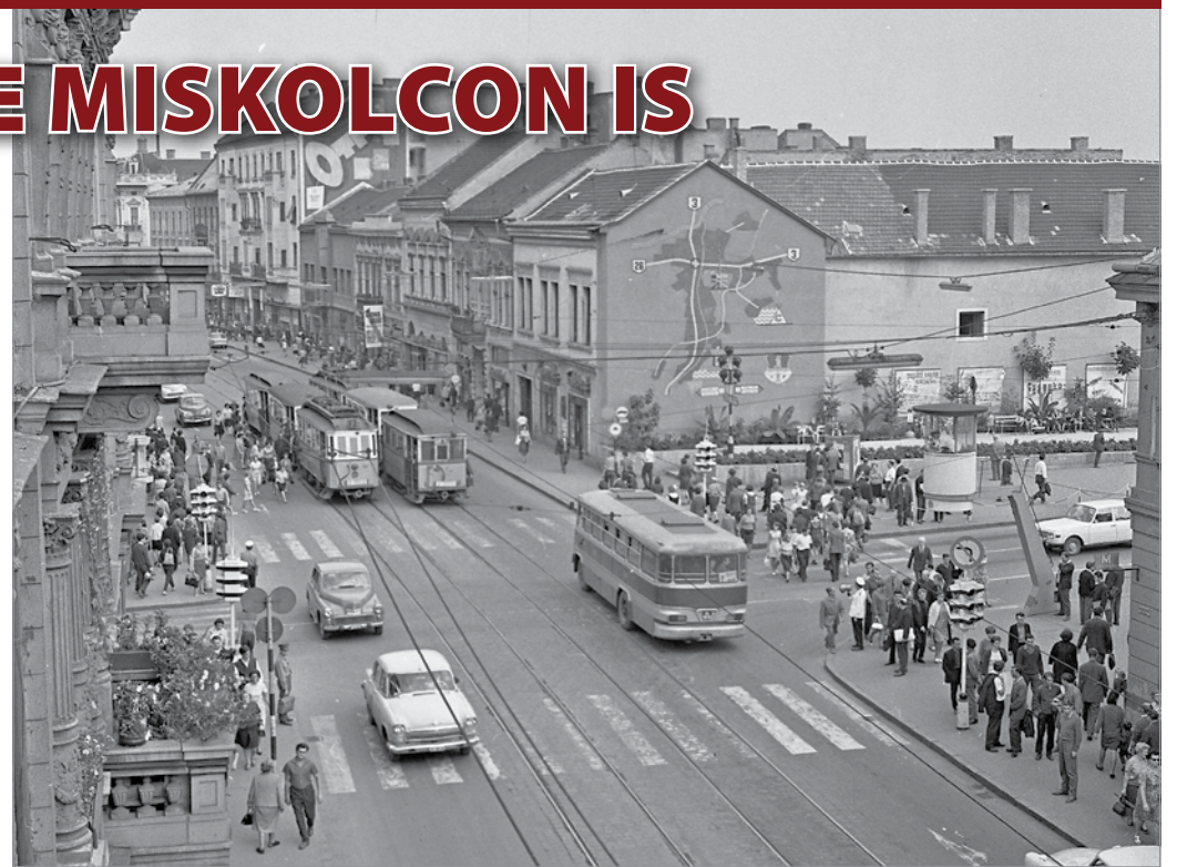
A Széchenyi utca és a villanyrendőr 1954-ben

MVK több korábbi járműtípusból is megtartott egy-egy szerelvényt.