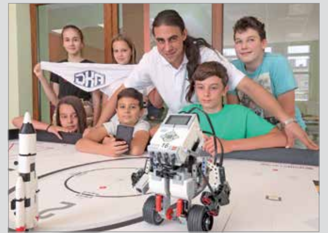
Többféle táborral is várják a tanulókat.