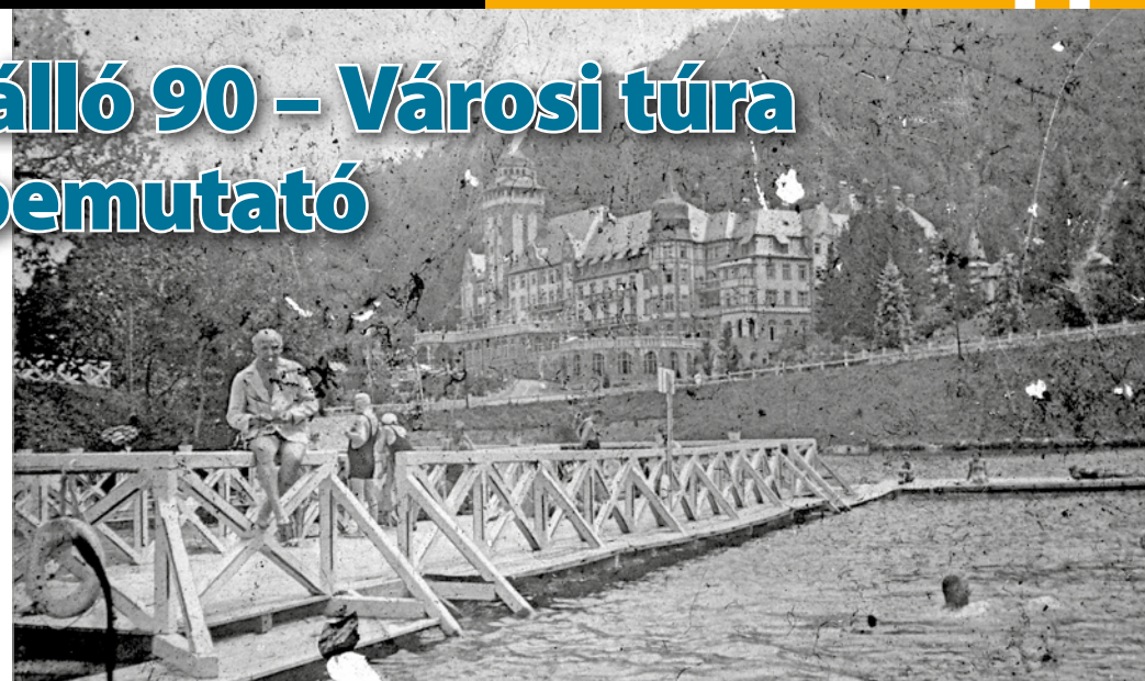
A Hámori-tó, háttérben a Palotaszállóval egy 1931-ben készült felvételen.

A kötet a 2005-ben, a 75. évfordulóra kiadott képeskönyv egyfajta kiegészítő-