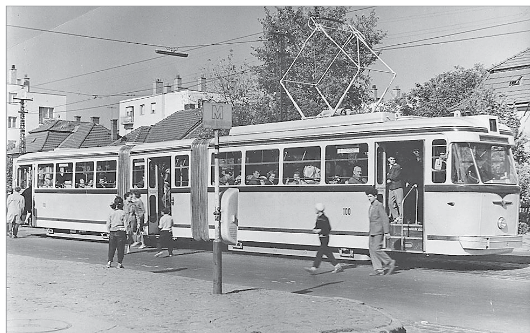
A csuklós villamosok csak 1962-től jelentek meg Miskolcon

gányos villamosvonalat épített, amely észak-déli irányban haladt, a Búza tér és a Népkert között. Ezt jóval kevésbé használták ki, emiatt megszüntetése már négy hónap múlva felmerült, de 1960-ig nem került rá sor, sőt, 1910-ben Hejőcsabáig meg is hosszabbították. A Vasgyár munkásai kérésére a Tiszai pályaudvar–Verestemplom villamosvonal folytatásaként kiépült a Verestemplom–Vasgyár vonal is, ez