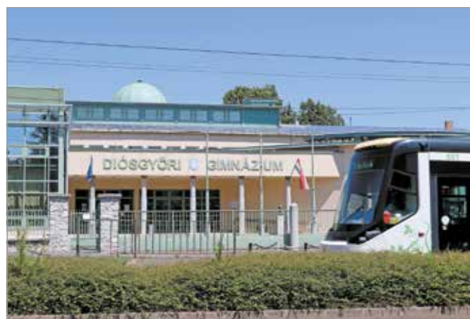
Hétfőn este tartanak csendes demonstrációt az intézményben.