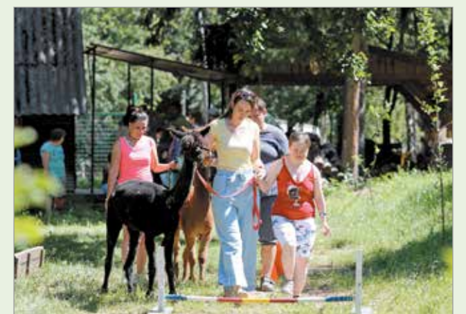
Speciális szükségletű diákok táboroznak a hétén a Szimbiózis Alapítvány Baráthegyi Majorságában.

A díjjal kétféle millió forint összegű anyagi elismerés jár. Az összeget a megváltozott munkaképességű és fogyatékkal élő munkatársainak értékteremtő foglalkoztatására, valamint „Korai fejlesztési és kommunikációs központ” kialakítására fordítják.