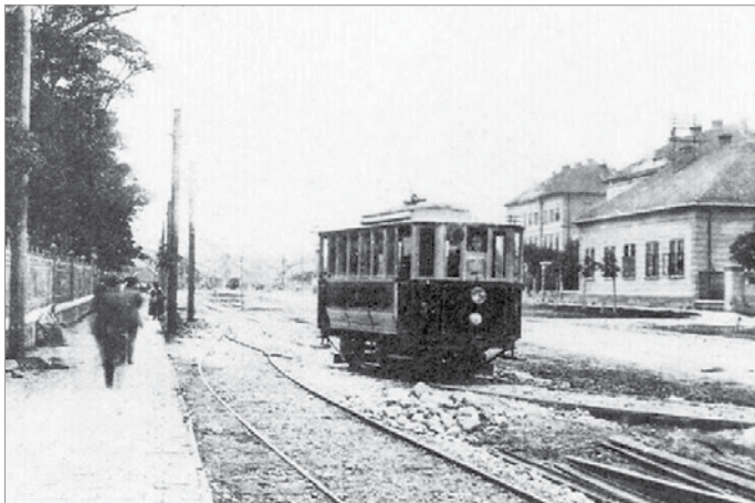
Az első villamos a Tiszai pályaudvar és a Verestemplom között közlekedett

A forgalmat 1897. július 10-én kilenc motor- és négy pótkocsival indították. A 30 férőhelyes, 7190 mm-es járművek