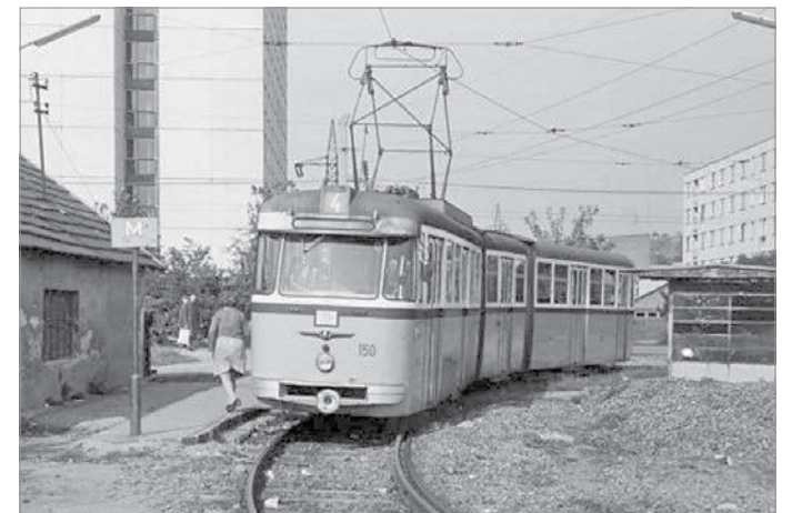
A 4-es villamos a Bulgárföld és Tatárdomd között közlekedett

azért ajánlotta fel Miskolcnak, mert a megváltozó gazdasági körülmények között ott nem volt szükség ekkora járműre, Miskolcon viszont igen. Ezt követően még 9 kocsit érkezett Kassáról 1-2 évesen, ezek a 201 és 209-es pá-