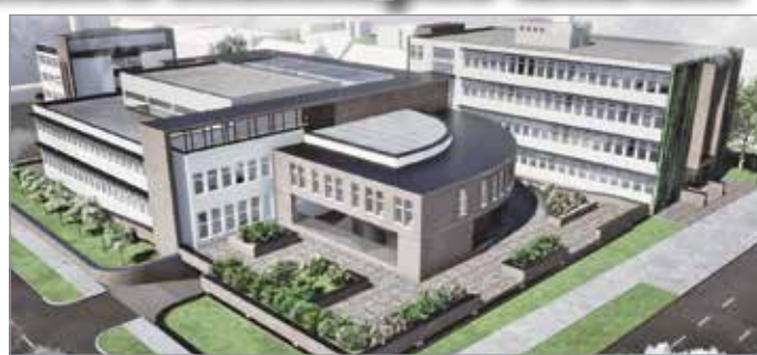
A Kandó Kálmán Informatikai Szakgimnázium látványterve