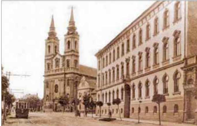
Budapest után Miskolcon épült meg az országban elsőként normál nyomtávú közúti villamosvasút

Százhuszonhárom éve gördült ki az első villamos a miskolci sínekre. Az évforduló alkalmából egy Tátra villamos is kigördült a pályára.