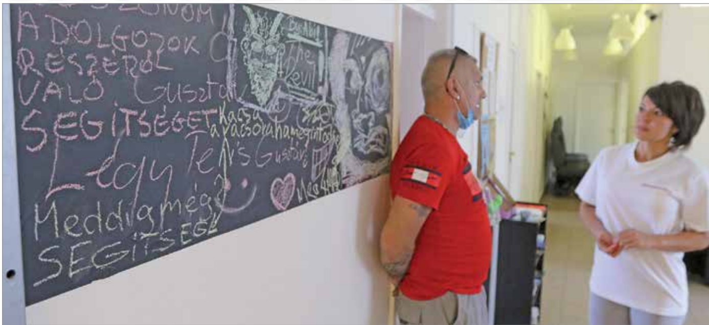
A miskolci Drogambulancia az egész megyéből fogad klienseket.

Újraindul a kábítószer elleni összehangolt munka a városban. A probléma kezelésében résztvevő szervezetek a járvány után először üléseztek.