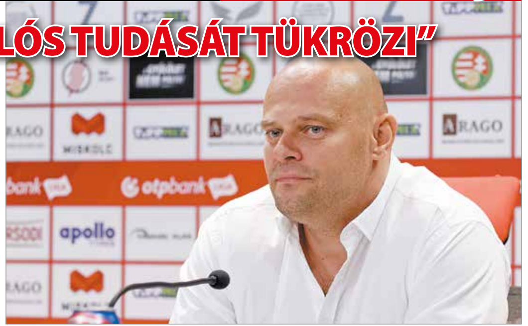
„Teljes mértékben meg tudom érteni a szurkolók csalódottságát...”

Harmadszor, az a három csapat, a DVTK, a Mezőkövesd és a DVSC nyújtott önmagához képest gyengébb teljesítményt az újraindulást követően, amelyek játéka a legtöbb magas intenzitású futást, a legtöbb kontrajátékot, a legtöbb hosszú sprintet tartalmazza. E három csapat játékosai tudtak legkevesebbet regenerálódni a mérkőzések közti rövid időben, ami megmutatkozott a teljesítményben. Magunkról nem beszélve, biztos vagyok benne, hogy ha megszakítás nélkül az eredeti menetrend szerint ér véget a bajnokság, akkor a