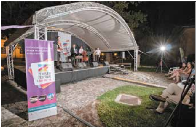
Augusztus 14-23. között várják a fesztiválozókat

Az idej, több mint félszáz programból álló rendezvény magas színvonalú komolyzenei hangversenyekkel, színházi és irodalmi estekkel,