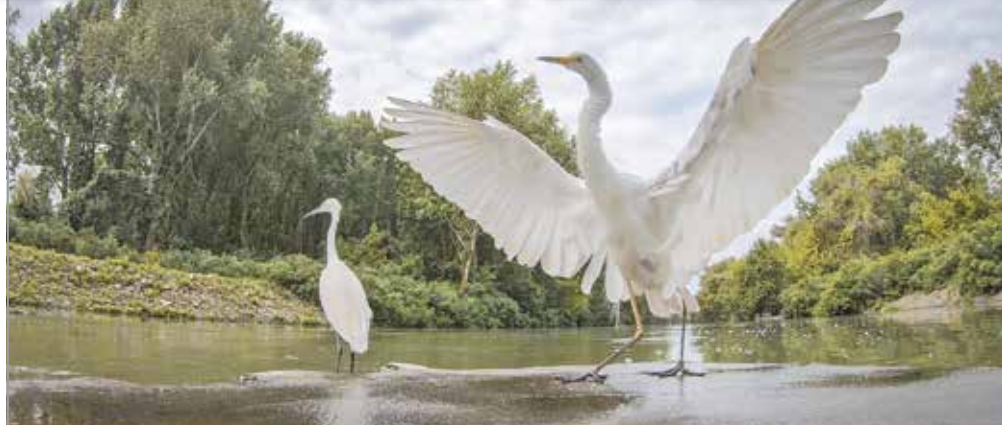
Pillanatkép A szöke tó – A Tisza-tó hat évszaka című filmből.

A koronavírus-járvány okán a hagyományoktól eltérően, de megrendezik a Nemzetközi Természetfilm Fesztivált Gödöllőn. A Pest megyei városban a megszokottnál kevesebb helyszínen lesznek programok, ám a változásra reagálva a szervezők más platformokat keresve mégis tovább tudták tágítani a fesztivál helyszíneit. A természetfilmes eseményt évről évre egyre nagyobb érdeklődés övezi, ezért a programkínálat mára kiegészült más művészeti ágakkal is, emellett jelentős környezetvédelmi szemléletformáló rendez-