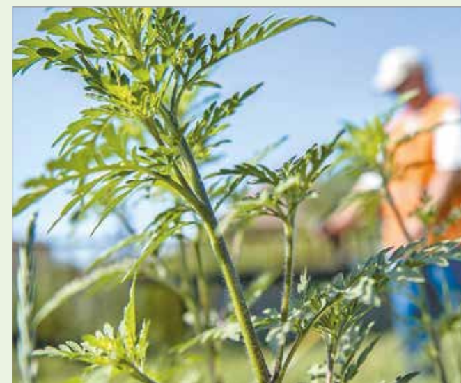
Mérséklődni látszik a parlagfű pollenszórása.

– A koronavírus tipikus tünetei a láz, a hőemelkedés és az izomfájdalom, míg az allergiát többnyire az orrdugulás, torokirritáció és szemviszketés kíséri. Ha az allergiások tünetei megváltoznak, amögött lehet valamilyen szezonális vírus is. Aki nem tudja, hogy allergiás, de jelentkeznek a tünetek, mindenképpen egyeztessen háziorvosával – tanácsolja a Népegészségügyi Főosztály vezetője.