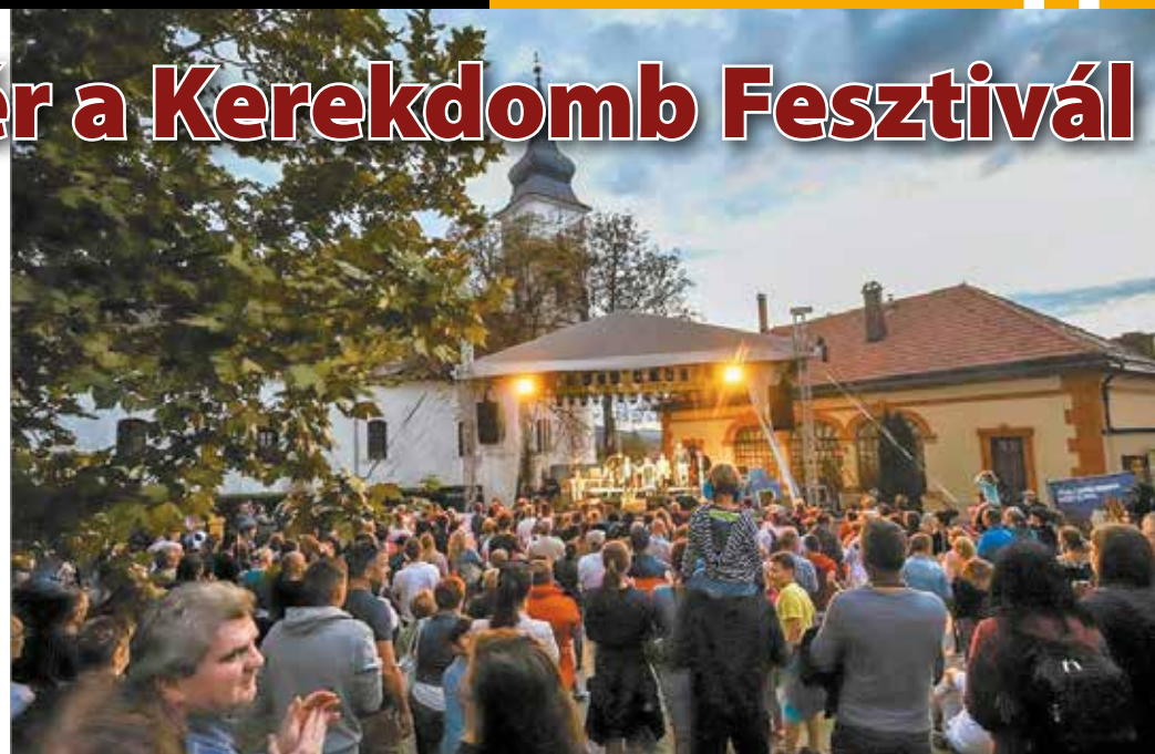
Fővárosi Rapcirkusszal és a Miskolci Szimfonikusokkal tér vissza a Kerekdomb Fesztivál

A tokaji borvidék összművészeti fesztiválja gyalogos, bicikli- és kajakos túrákkal, színházzal, irodalommal, filmekkel, koncertekkel és boros programokkal várja a látogatókat szeptember 17. és 20. között Tállyán és Golopon.