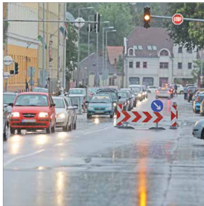
Reggeli csúcsforgalom a Dayka Gábor utcában.

tését, ami leromlott állapota miatt vált elodázhatatlanná. Továbbá a Dayka Gábor utca „átkötését” a Meggyesalja felé, amely házak elbontásával és egy teljesen új utca megépítésével jár majd. A helyzet faramuciságát mutatja, hogy a jelenlegi önkormányzat illetékes szakemberei nem minden tekintetben értenek egyet ennek az utóbbi beruházásnak az indokoltságával – ám az előző helyhatóság előkészítette, megszavazta, állami szervekkel jóváhagyta; immár szinte lehetetlen elállni tőle. (Mert ha igen, az eddigi megkapott pályázati összegeket vissza kellene fizetnie Miskolcnak.) Használna lesz mindenképp: megszüntethetővé válik majd a Szent István tér mögötti zöldterület kettészelő, valódi parkként való használatát megnehezítő Kálvin utca. A házbontások már idén elkezdődhetnek. Még egy mondat a Thököly utcai hidról is: a jövő tavasszal esedékes munkálatok idején természetesen megszűnik majd egy időre a déli és az északi tehermentesítő utak összeköttetése (a Thököly utcán), ami szintén nem teszi könnyebbé a következő időszakok miskolci közlekedésszervezését.