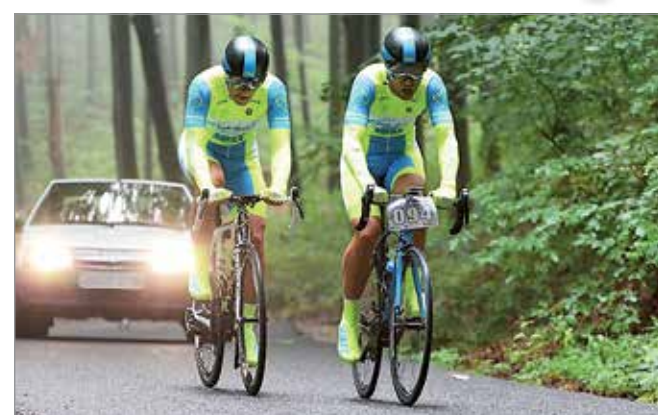
Vasárnap a Somogyi József emléktúra része az egyenkénti indítású MTB és országúti hegyi időfutam.

A jávorkúti futamot évről évre növekvő érdeklődés kíséri. A családi és céges jótékonyági túrát szombaton rendezik meg.