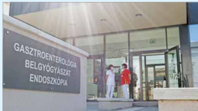
Új épülettel bővült a belgyógyászati tömb.

Az új épületben kialakították a száz fő elhelyezését biztosító betegvartó betegirányító pulttal, a hét vetkőzőfülkével ellátott rendelő- és vizsgálólétesítményt, egy kétágyas fektetőhelyiséget, központi endoszkóposó helyiséget, betegforgalmi és személyzeti szociális vizesblokkokat, valamint raktárhelyiségeket.