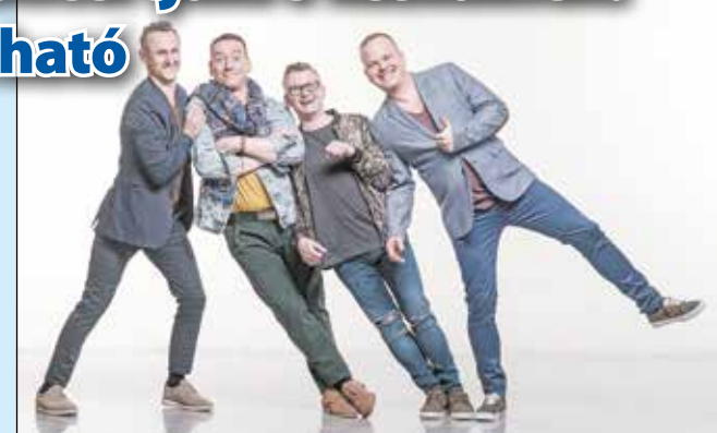
A miskolci közönség lehet a „bétatesztelője” a különleges zenei programnak