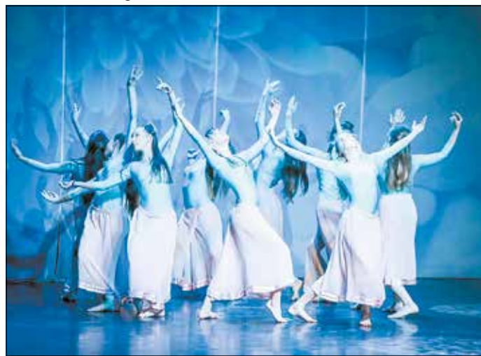
Az eLTE Best Dance Company táncosai is fellépnek