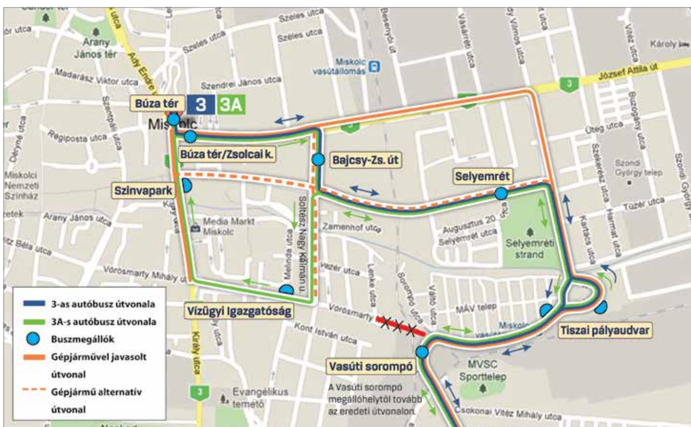
Vasárnap a kora délutáni óráktól kezd meg az érintett szakaszon az ideiglenes forgalmi rend kialakítását és kitáblázását

A Búza tér irányába: a vasúti sorompó után a Tiszai pályaudvaron (a pályaudvar épülete előtti leszállóhelyen), a Selyemréten (a Búza tér irányába a templom előtti megállóhelyen) állnak meg, majd a Bajcsy-Zsilinszky utcától az útvonaluk és a megállóhelyeik változatlanok. Mint írják, az útvonal módosulása menetidő-növekedéssel jár, ezért a 3-as és 3A-s autóbuszok menetrendje is változik vasárnaptól. Fontos, hogy a 24-es autóbusz a Szinvapark megállóhelyen csatlakozást biztosít több alkalommal a 3A-s autóbuszhoz, emiatt a 24-es autóbuszok menetrendjében a garantált csatlakozások változnak. Az útvonal- és menetrend-módosítás miatt a 3-as autóbuszok reggeli meghir-