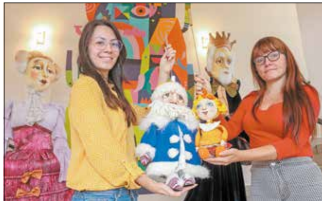
Három mű felújításával készül az évadra a Csodamalom.