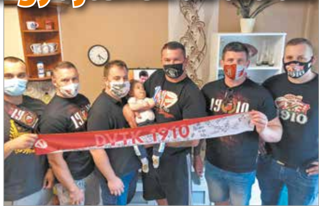
Egy kisebb szurkolói csoport meg is látogatta otthonában a kisfiút

Az Ultras Diósgyőr hivatalos Facebook-oldalán tájékoztatott arról is, hogy a gyűjtés szépen halad, de hogy még inkább felpörögjön, egyedi sálát bocsátanak árverésre. A selyemáron fel van sorolva minden olyan játékos neve, aki valaha DVTK-mezt öltött magára. Az Aranycsapat élő