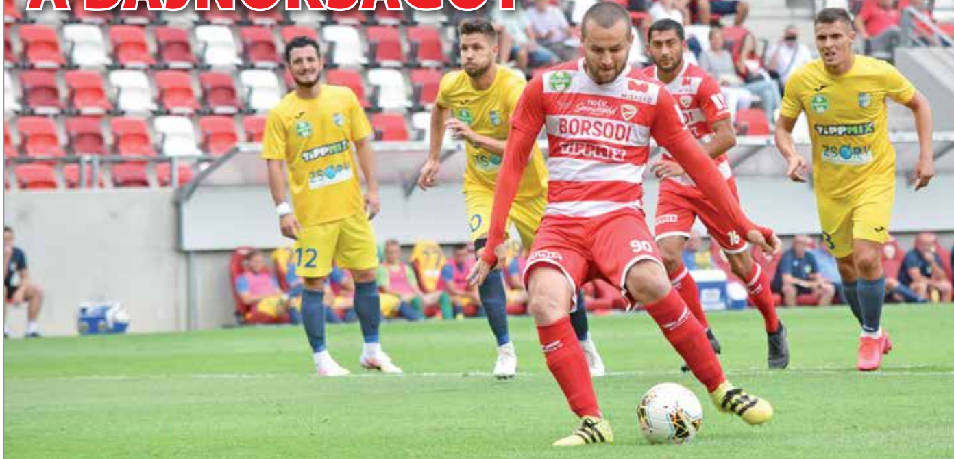
A piros-fehérek szombaton délután 5 órakor folytatják a bajnoki küzdelmet.

A válogatott miatti szünet után folytatódik a labdarúgó-bajnokság, a DVTK szombaton fogadja a Honvédot.