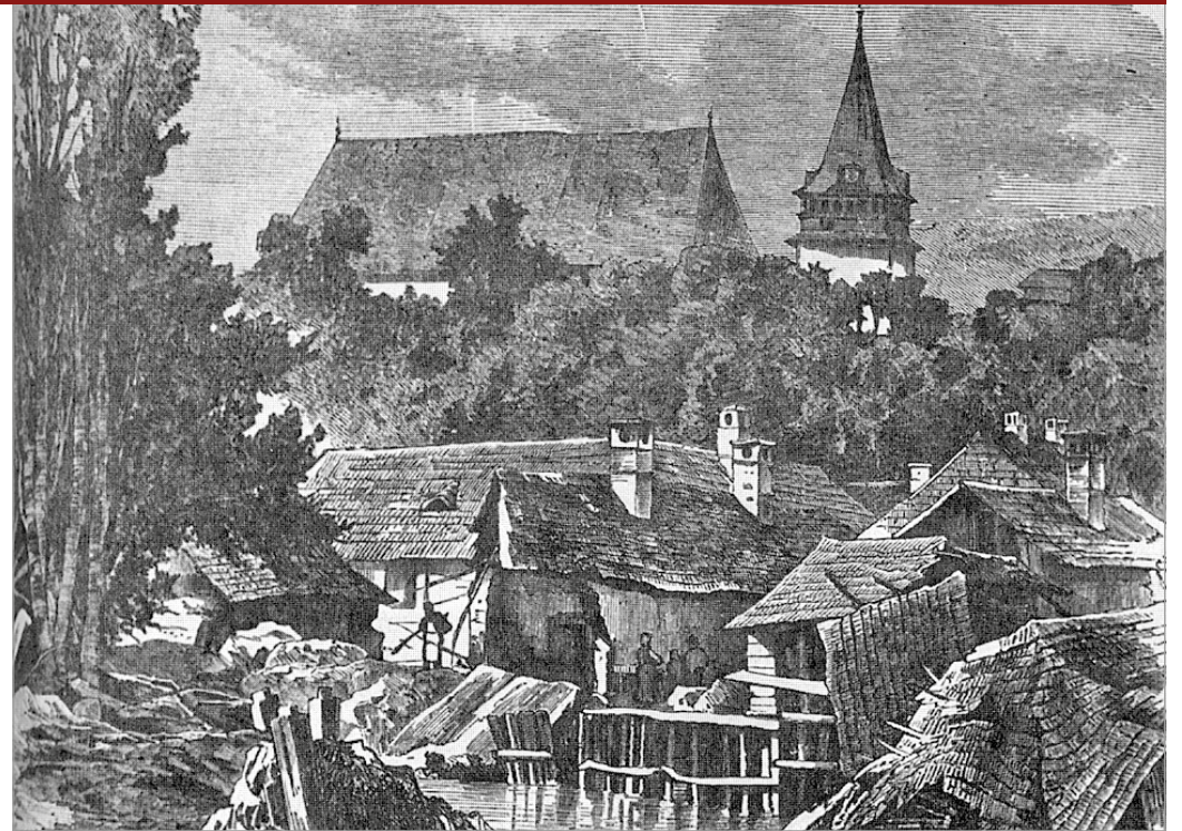
Az Avas alja az árvíz után

tározó szerepet töltött be a várost nyugat-keleti irányban átszelő, Miskolc gazdasági vérkeringésének egyik ütőereként lüktető Szinva patak, valamint a 19. században még szabályozatlan, az északi dombvidékről a csapadékok elvezető Pece, mely a város területén egyesült a Szinvával. Utóbbin a korban több vízimalom is üzemelt, amely a különböző termelő- és megmunkáló épületek energiaszükségletét látta el. Amikor 1845-ben húsz emberéletet követelve mindkét patak kiöntött, a város előljárói legfőbb okként megállapították, hogy a víz felgyülemelését a malmok és a lakosság által felhalmozott hordalék, valamint a medrek kotrásának hiánya okozta. A problémát fokozta az a nem elhanyagolható tény, hogy a már említett völgyi fekvésből adódóan a város a Szinva vonalán terjeszkedett. Bár a közvetlen meder melletti építkezést rendszerben tiltották, sokan így is a patak partjának közvetlen közelében építkeztek. Még azok is, akiknek ezt a tiltást be kellett volna tartatniuk a lakosokkal... Szintén tilos volt