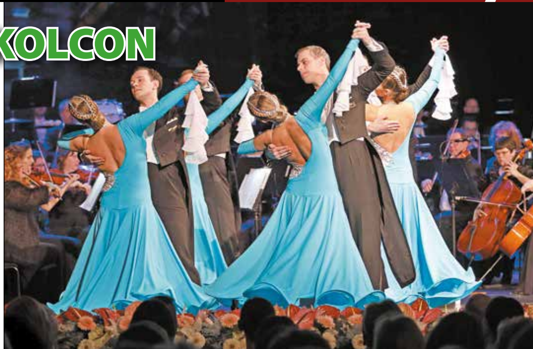
A KÖDMÖN Formációs Táncegyüttes is bemutató tart a MúHa előtti téren.