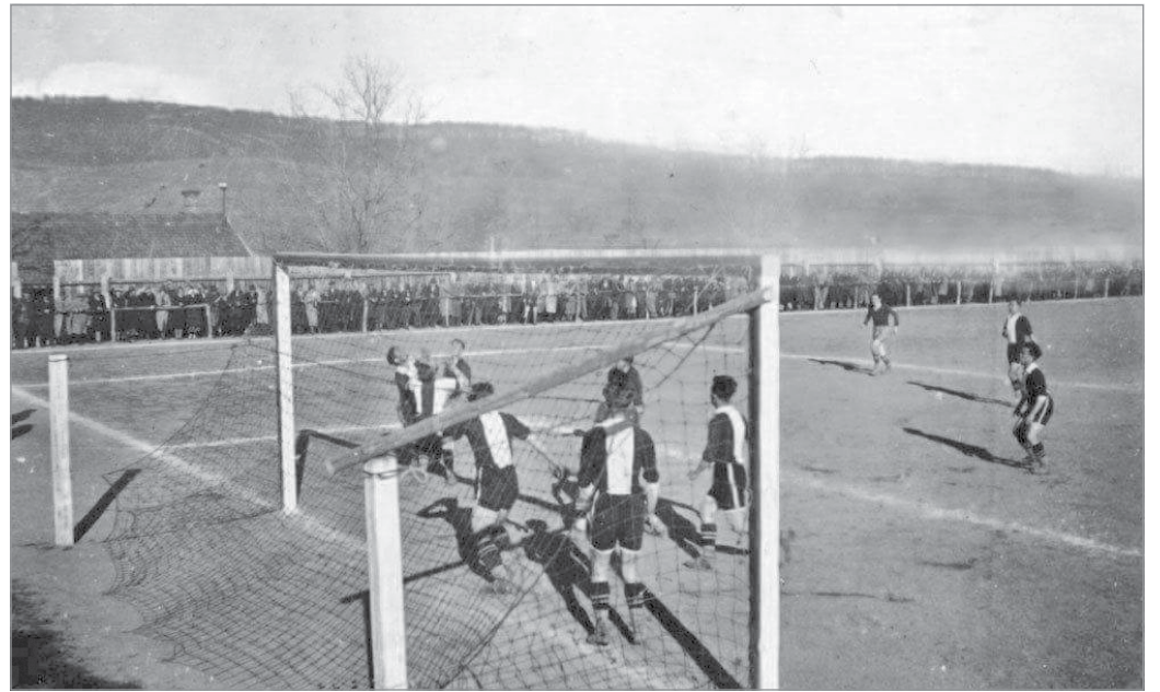
A perecesi csapat játékosai nagyot vizsgáltak hitből és összefogásból, amikor három gólt rúgtak a Ferencvárosnak

pálya 4000 fős lelátóval és salakos borítású futópályával, erdővel övezett környezetben. Az ország egyik legszebb fekvésű pályája volt. 1937-ben feljutnak az NB II-be, majd a 40-es évek közepén a legmagasabb osztályba. Ekkor, 1947. április 20-án került sor a nevezetes mérkőzésre.