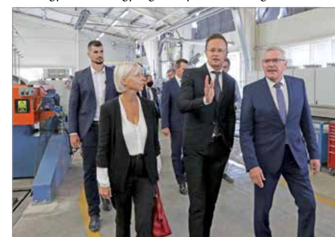
Szijjártó Péter szerint nagy szerep hárul az olyan vállalatokra, mint amilyen a FUX is.

mazott, a világvárvány második hullámának elkerülése hiú ábránd volt csupán, ma már egyértelmű, hogy az életünk része, alkalmazkodnunk kell hozzá. És ez kijelöli a kormány feladatát is: meg kell védeni az emberek életét és egészségét, de biztosítani kell továbbra is Magyarország működőképességét. Ezért fogtak össze a vállalatokkal, amelyek bátran vállalják a beruházást. Több mint 900 magyar vállalat gondolkodott így, összesen 425 milliárd forintnyi beruházás jön létre a következő hónapokban. Ezzel több mint 155 ezer munkahelyet tudnak megvédeni.