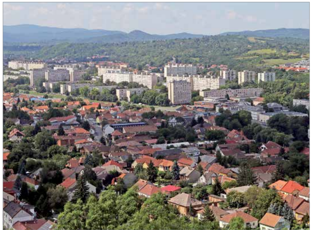
Növelni kell a zöldfelületek nagyságát, ez viszont nem mehet a város élhetőségének terhére.

Miskolcot az egyik legzöldebb nagyvárosként tartják számon, azonban ahhoz, hogy ez így maradjon, tennünk is kell. Annak idején a nagy lakótelepek építését követően a város kerttervező csapata megtervezte a közterületeket, és elültette azt a sok-sok fát, cserjét. A parkfenntartó csoport pedig gondozta azt. Aztán az évek során ilyen-olyan okok miatt ezek a növények elkezdtek kopni: hol a házban élőknek lett útban egy fa, hol annak lettek áldozatai, hogy növekvő igények miatt egyre több parkoló épült. Azért, hogy ezt a mennyiséget viszapótolhassuk, vezettük be azt, hogy minden kivágott fa helyett kettő újat kell ültetni. A program azért nagyon jó, mert egyrészt kapcsolódik a város zöldinfrastruktúra-fejlesztésével kapcsolatos programjához, másrészt pedig az önkormányzati képviselőkön keresztül a