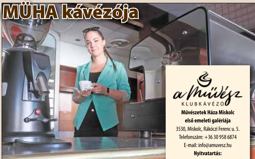
A MÜHA kávézója szeptember 20-án nyit újra

– A Déryné utcában volt egy legendás Művészklub, ami már régen bezárt. Ez a kávézó szinte