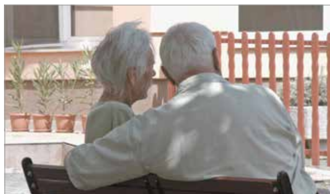
A Hűség több szempontból is egyedülálló alkotás lett

– Az első elképzelés az volt, hogy vajon gondoskodhat-e egy férfi odaadóan a feleségéről. Ez volt a hívógondolat, és