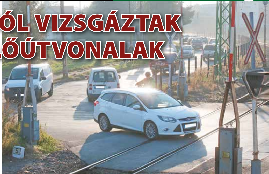
Több útszakaszon alakultak ki torlódások, hosszabb kocsisorok.

Sokszor alakult ki hosszabb kocsisor a Baross Gábor utcán is, ami még mindig logikus, a Tiszai, Kandó Kálmán tér után erre vezet az út a belváros felé. A Barosztól a Nemzeti Infrastruktúra Fejlesztő Zrt. (NIF) két kerülőutat javasolt: úgy tűnik a