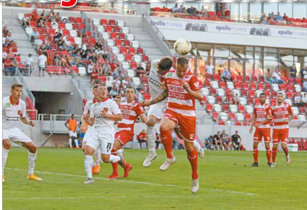
A múlt szombati mérkőzésen a Budapest Honvéd 4-2-re győzött a DVTK ellen.

A vendégek rendkívül érdekes körülmények között született harmadik gólja döntően befolyásolta a mérkőzés kimenetelét. Teljesen