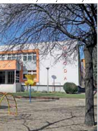
Fokozott ellenőrzési előírásokat vezettek be az óvodákban is. Illusztráció: Juhász Ákos

Az aktuális tanév, mint ismeretes, rendben elindult szeptember elején, ez vonatkozik a 32 óvodára is, ami a borsodi megyeszékhelyen a városi önkormányzat fenntartásában működik. Az illetékes állami szervek által kiadott intézkedési terv szerint kezdettől fogva fokozott ellenőrzési előírásokat vezettek be: alapos takarítás, fertőtlenítés az épü-