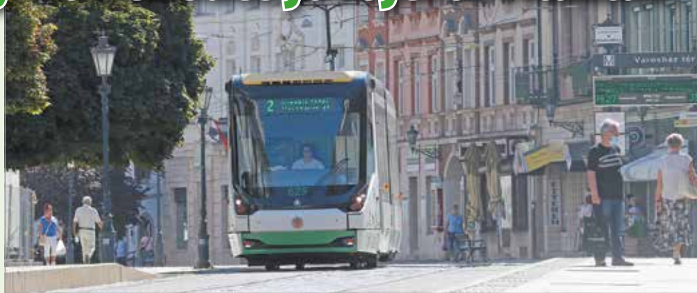
Vitézy Dávid szerint a jövőt a közösségi közlekedés jelenti.

Előadásának elején a közlekedési szakember a Budapesti Közlekedési Központ (BKK) hasonló, a közlekedés