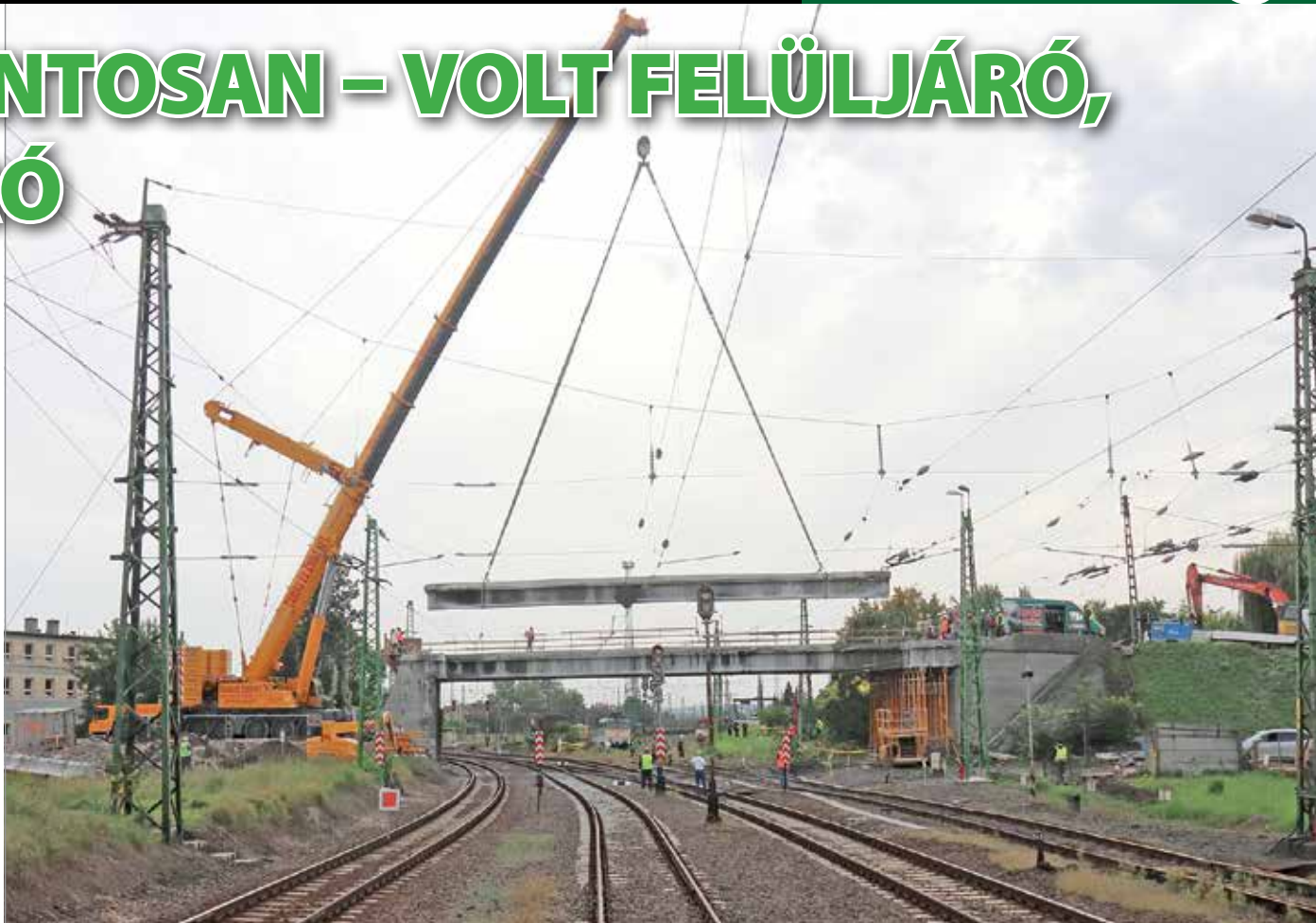
A kivitelező hétfőn megkezdte a régi útpálya vasbeton elemeinek eltávolítását.

Átmeneti fennakadásra márpedig még készülni kell – ezt a tájékoztató mindkét résztvevője megerősítette. A beruhá-