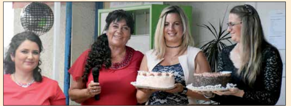
A vendéglátók a Klíma és Fűtéstechnikai Kiállítás és vásáron 2020. 07. 15.-én

A közelmúltban robbanásszerűen jelentek meg a hőszivattyúk, az akár egy egész lakás gazdaságos fűtésére is alkalmas hűtő-fűtő klímák, villanykazánok, hővisszanyerős szellőztetőrendszerek.