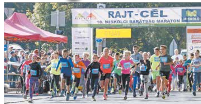
Négy egyéni távot és félmaratoni váltót kínálnak.

A verseny idejére, azaz vasárnap hajnali 6:30-tól délutánig 4-ig lezárják a gépjárműforgalom elől a belváros verseny által érintett részét. Nevezetesen: a Görgey – Corvin – Vörösmarty – Uitz – Toronyalja – Petőfi – Dayka utcák – Városház tér – Déryné – Serbu Adolf utcák – Hősök tere – Horváth I. – Szentpáli – Corvin – Dankó P. – Szilágyi D. (járda) – Budai J. – Görgey utcák – Sportszarnok útvonalak és állomások által meghatározott szakaszokat. Az érintett közlekedési