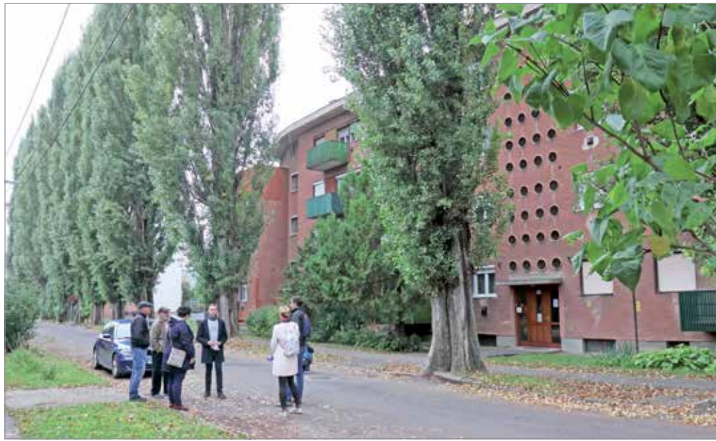
Még nem dőlt el a jegenyefasor sorsa.

Több mint hatvan fa szegélyezi a két utcát. Úgy tudjuk, legalább hatvan évvel ezelőtt ültették el őket. Gyönyörű, ahogy sorakoznak egymás mellett a magas fák, az utca képét jelentősen befolyásolják – de most is láthatjuk, hogy erős ágak hajolnak meg a szélnek, egészen az