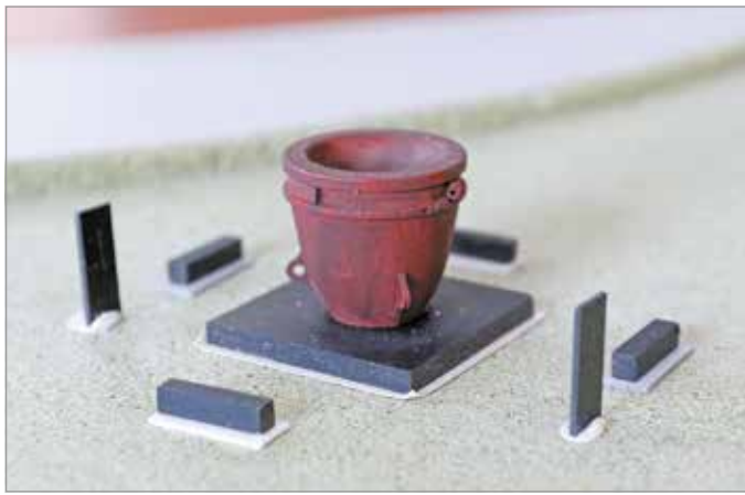
A kohász emlékmű makettje.

Az emlékmű felállításának egy részét a művész ajánlotta fel, a fennmaradó összeget pedig közadakozásból finanszírozná a Miskolc Város Közoktatásáért Közalapítvány. A szervezet a „Kohászati Emlékműért” néven elkülönített bankszámlaszámra várja az adományokat: 11734004-25959499 (OTP Bank). Szükség esetén adományigazolást is adnak.