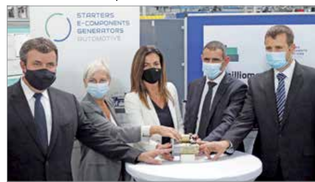
Elkészült a 75. milliommodik önindító.