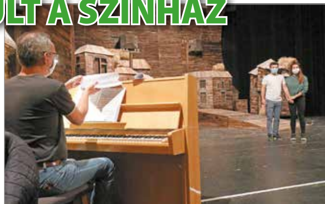
Az előadásokra már készülnek a művészek.

A miskolci nemzeti szeptember végén állt le tíz napra, miután kiderült, hogy a társulat egyik tagjának PCR-tesztje pozitív lett. Az épületet fertőtlenítették, és a teljes társulatot letesztelték.