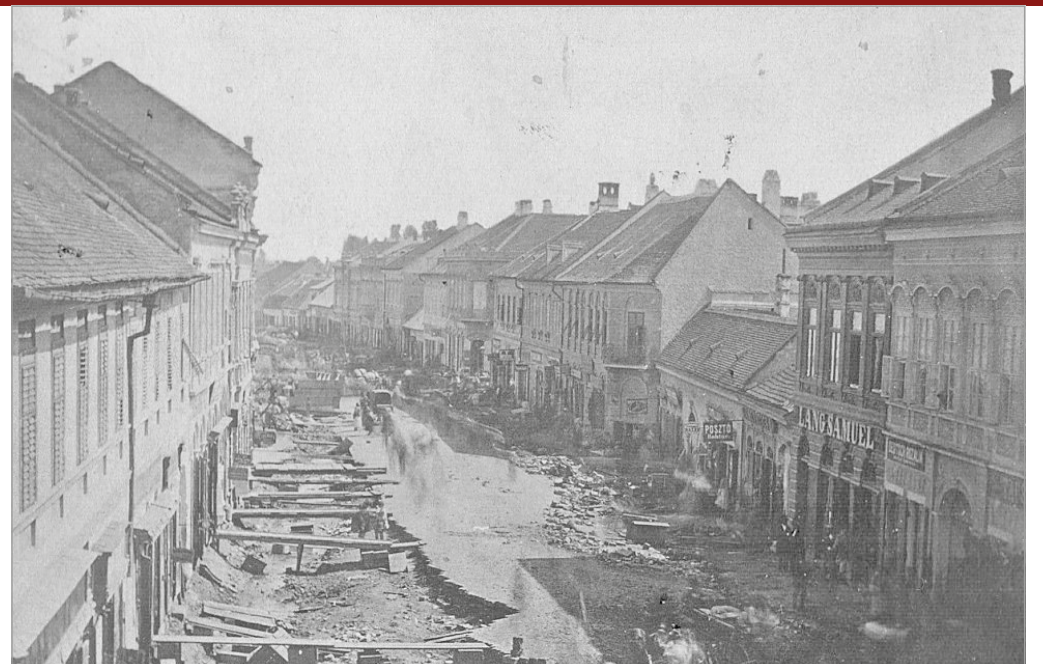
A Széchenyi utcán lévő üzleteket teljesen elmosta az áradás

Miskolc azonban továbbra is pénzügyi gondokkal küszködött, ezért a város vezetése „Kérő Szóval” fordult az országhoz. A vármegyében lévő települések erejükhöz mérten küldtek élelmiszert, ruhákat, majd később az ország minden részéből érkeztek adományok. Dobsinából, Sátoraljujhelyből