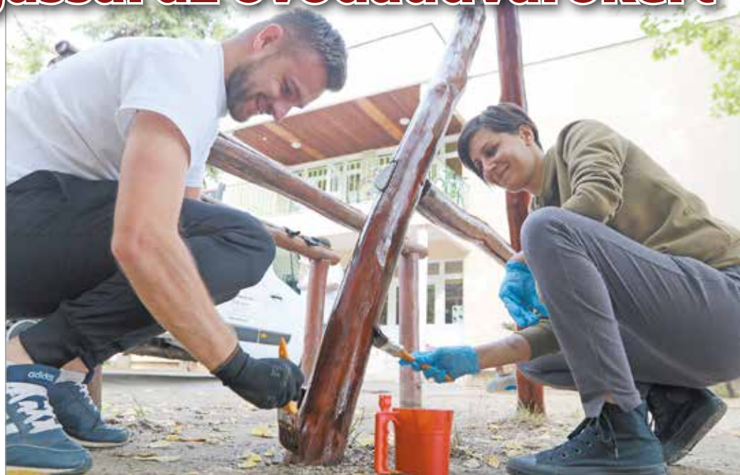
A MIVÍZ szakszervezetének munkatársai is besegítettek szombaton.