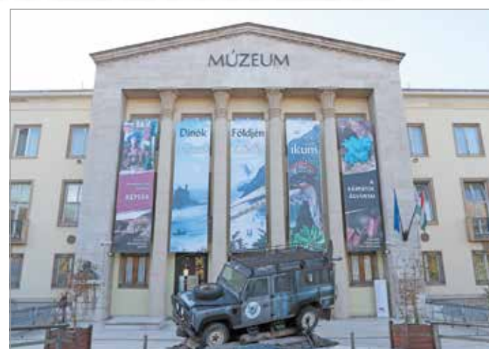
Változatos programokkal várják az érdeklődőket.