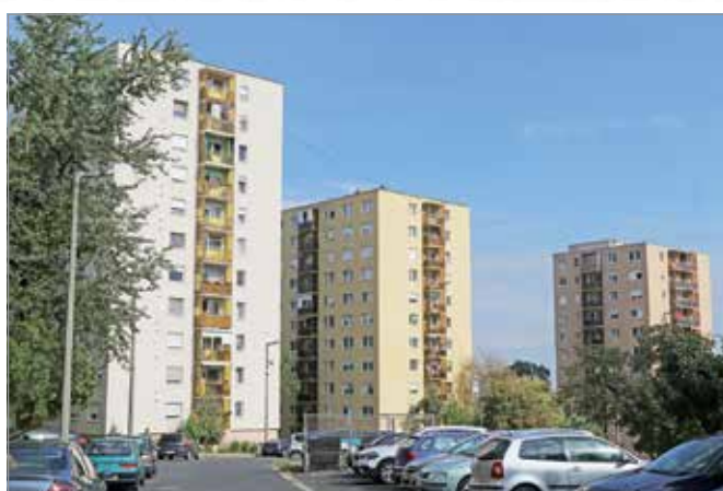
A kódex hetven oldalon foglalja össze az együttélési fontosabb szabályait.

Jelenleg a kódex hetven oldalon foglalja össze az együttélési fontosabb szabályait. A paragrafusok és cikkelyek között olyan pontok találhatóak például, mint a szomszédjogi panaszokkal kapcsolatos rendelkezések, a vendéglátó üzletekkel összefüggő panaszok rendelkezései, a város zaj és