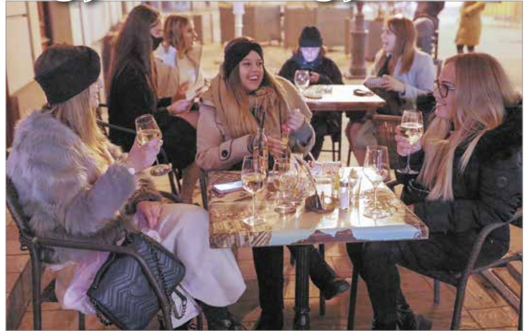
A kedd esti felhőtlen hangulat a Déryné utcában.

Mindent összevetve tehát, a várt hangulattal ellentétben,