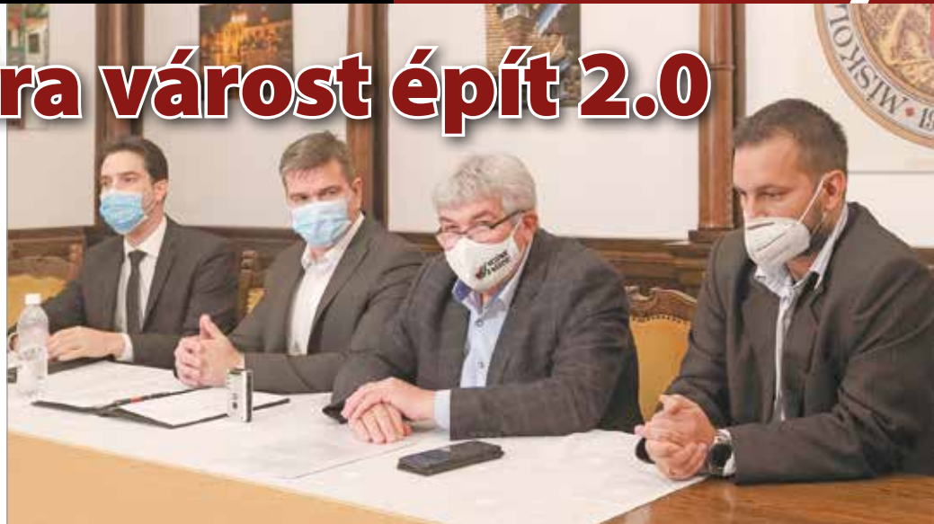
Kedden sajtótájékoztatót mutatták be a kuratórium tagjait.

– Miskolc kulturális jelentőségének túl kellene mutatni a város határait: olyan régiós szerepkörre kell törekednünk, ami által meg tudjuk szólítani a megye lakosságát. Ezek az igények, úgy gondolom, kissé eltompultak az utóbbi időszakban. Emellett olyan egyedi státuszt kell elérni, ami szimbolizálja, hogy Miskolc milyen kulturális és környezeti értékekkel rendelkezik. 2008-ban a város megkapta a kultúra magyar városa címet: akkor olyan időszakot éltünk ebből a szempontból, amire jó visszaemlékezni. Az „A kultúra várost épít”