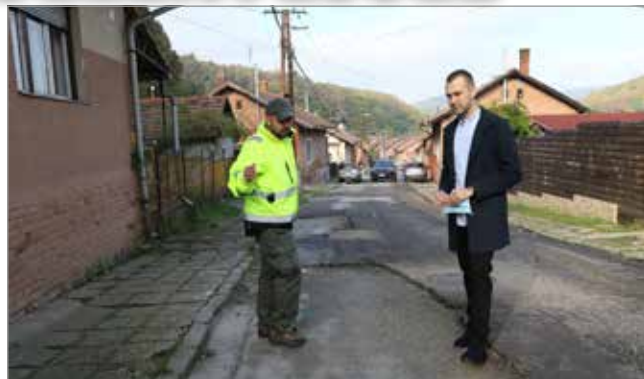
A Finkey utcában kicserélték az ivóvízhálózatot.