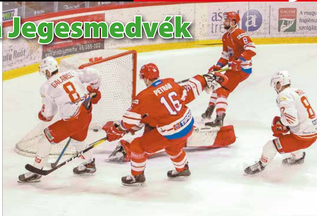
A Jegesmedvék kedden 7-2-es hazai győzelmet arattak a Liptószentmiklós ellen.

Ebben némileg segíthet, hogy a Digisport az idén ismét közvetíti a miskolci hokisok meccseit, az első adást kedden sugározták a népkerti jégcsarnokból. „Az az igazság, hogy a keddi már a harmadik közvetítés lett volna, csak a korábbi mérkőzéseket el kellett halasztanunk. Nagyon hálásak vagyunk a Digisportnak, hogy a tavalyi szezon után az idén vál-