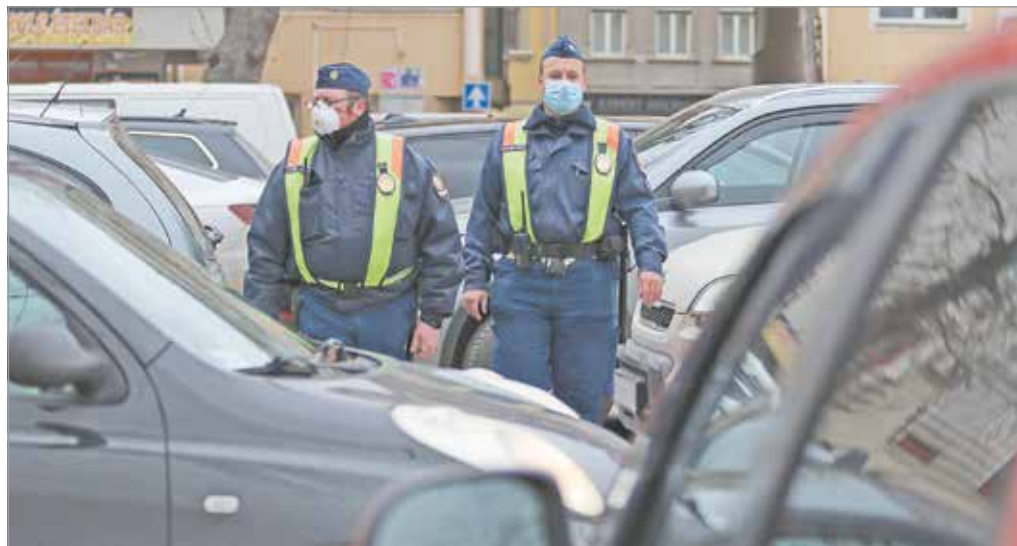
Most olyanok is autóba ülnek, akik egyébként ritkán szoktak vezetni.