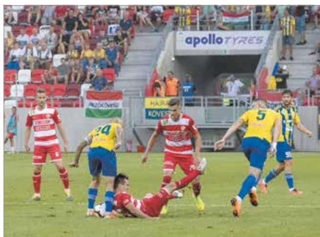
A két szomszédvár csapata korábban is nagy csatákat vívott.

A DVTK-nak is előre kellene lépnie, és ehhez ugyan csak javulniuk kell. Jelenleg 10 ponttal állnak a 9. helyen, igaz, egy mérkőzéssel kevesebbet játszottak, mert a Ferencváros nemzetközi kupaszereplése miatt elhalasztották a két csapat őszi mérkőzését. Mind védekezésben, mind támadásban fejlődni kell a gárdának, hiszen csak így lehetnek eredményesebbek. Ami viszont biztosnak látszik, szikrázóan kemény kiélezett küzdelemre van kilátás vasárnap délután.