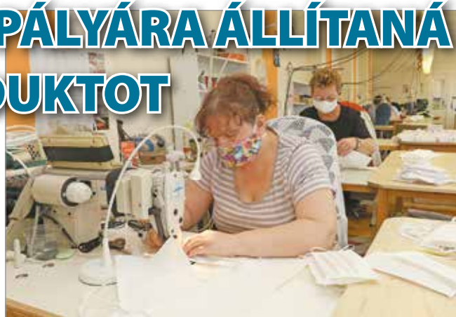
Átlagosan napi nyolcszáz-ezer maszkot készítenek.