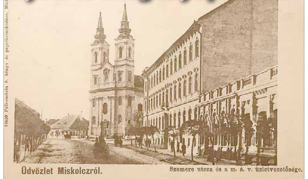
Mindszent 1900-ban. A templom mellett balra az egykori ispotály épülete

A kronológia szempontjából második ilyen intézménye a zsidó hitközségnek volt városunkban (1768). Az izraelita ispotály ingyenes orvosi kezelésben, ápolásban és segélyezésben részesítette hittársait. A Chevra Kadisa (Szent Egylet) tagjainak sajátos feladata volt a