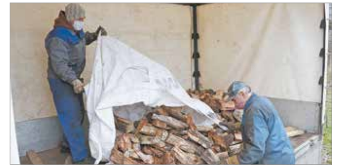
A családokhoz eljuttatott fa a Városgazda telephelyéről érkezett.

Idén öt helyszínen, összesen hat alkalommal osztottak tűzifát a rászorulóknak. A MESZEGYI diósgyőri telephelyén, szerdán húsz család részesült az adományból. A tűzifaosztási program pénteken a szervezet Szondi György utcai központjában zárult.