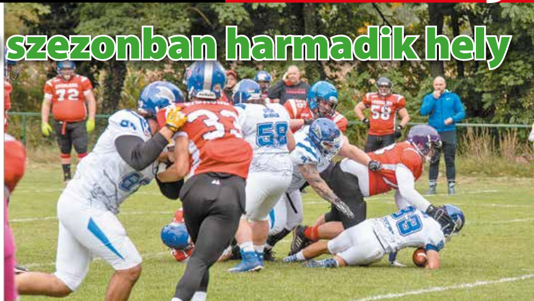
A küzdelemmel és az akarással nem volt gond az elődöntőben sem