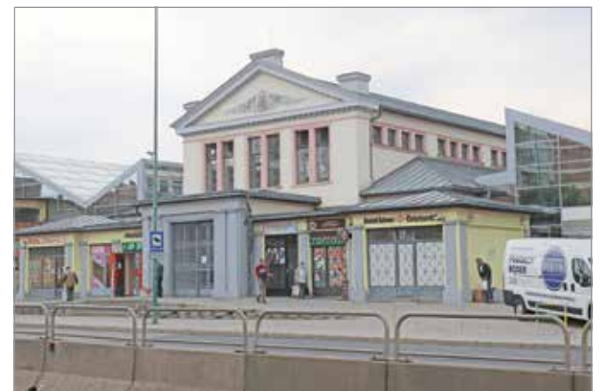
A Búza téri piac fejlesztése az elsődleges.

Jelenleg is négy eljárás van folyamatban a felek között. Mindezek az utóbbi négy esztendő során a városi önkormányzatnak több mint 58 millió forint költséget okoztak, amellyel, hogy a zrt.-nek további 63 millió forintnyit. A kettő összegként adódó 120 millió forintot lehetett