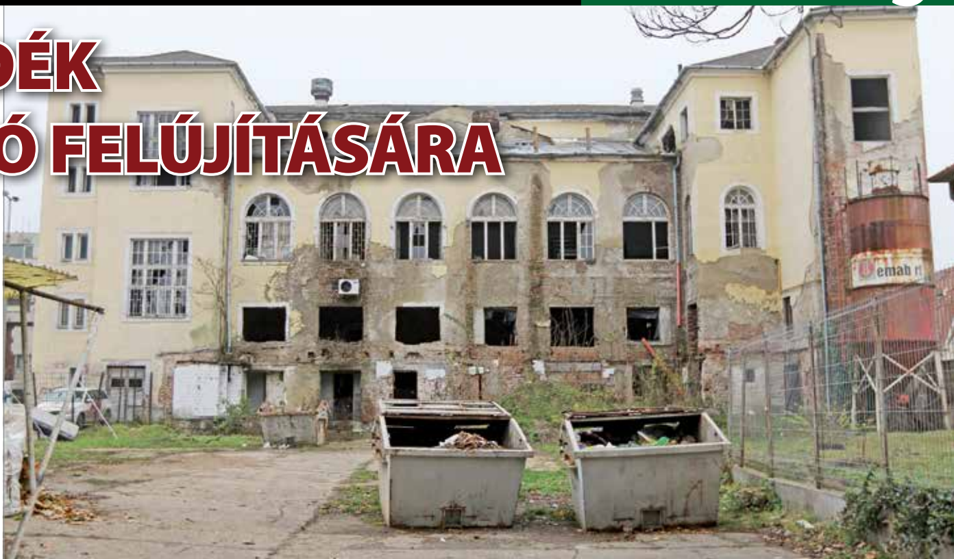
A szállodát 1987 decemberében zárták be.

Az Erzsébet térre néző szállodaépület helyén már az 1800-as évek második felében is hotel állt. Az akkor még Korona Szálló nevű épületet 1893-ban bontatta le a város, az újat, vagyis a jelenlegi pedig Adler Károly tervei alapján építették fel, a hotel 1894-ben nyitott meg. A létesítmény az államosítástól Kossuth nevet vette fel, 1953-tól hívják Avas Szállónak. Az országos műemléknek számító miskolci Avas Szálló sokáig a belváros büszkesége volt, kálváriája a nyolcvanas években kezdődött, és hosszú évtizedek óta tart. A szállodát 1987 decemberében zárták be, a privatizáció éveiben aztán bérlok adták egymásnak a kilincset: az üzemeltetéssel újra és újra megpróbálkoztak, jelentős felújítást viszont egyik sem végzett a szebb napokat is látott szállodán.