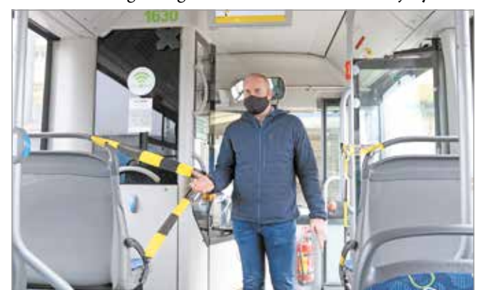
Az intézkedéseket december 1-jétől vezet be.