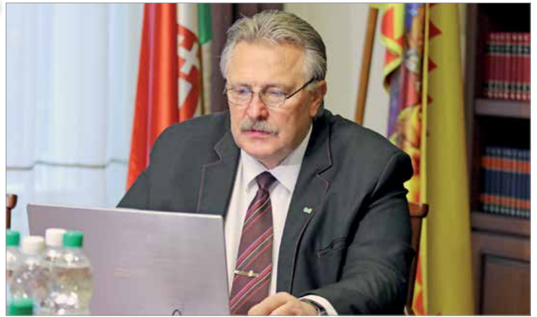
A veszélyhelyzet miatt online térben konzultált a polgármester a képviselőkkel.

A továbbiakban a Miskolci Piac Zrt. mint részlegesen önkormányzati tulajdonú cég témája került terítékre, amelynek működését pereskedések nehezítik. Itt is, mint az Avas Szálló eladása-felújítása-hasznosítása tekintetében többé-kevésbé