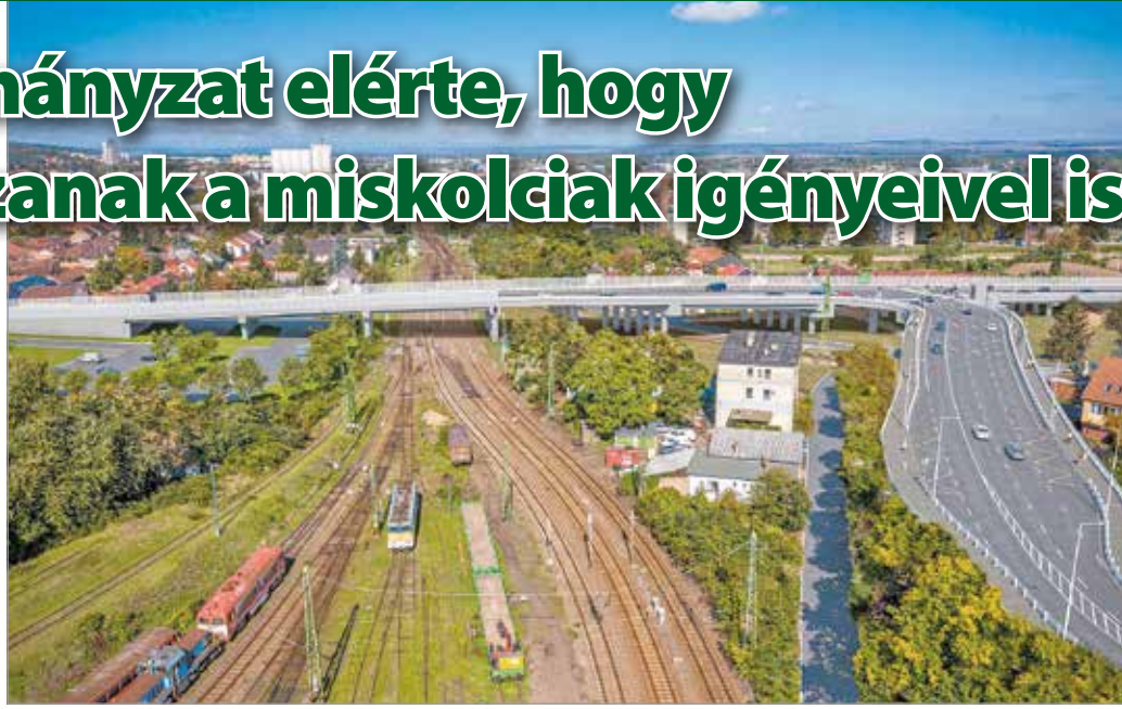
Az épülő Y-híd látványterve

Az építés, a hidak elbontása idejére nem volt alternatíva a Martinkertváros – Szirma, il-