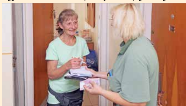
A támogatást decembertől 10-étől kézbesítik.