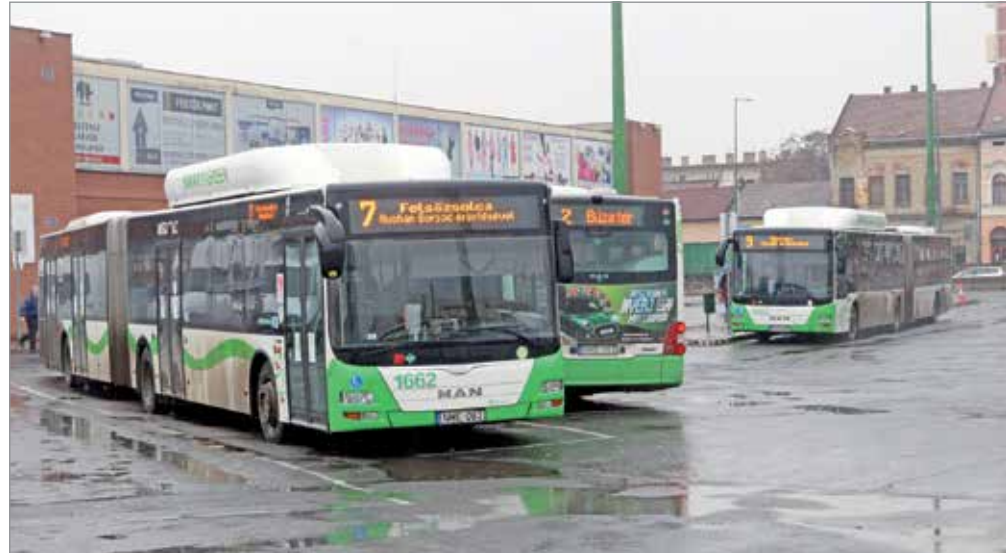
Folyamatosan ellenőrzik a járatok terheltségét.

„A Lillafüredi Sport és Turisztikai Nonprofit Kft. (3517 Miskolc, Erzsébet sétány 8.) kérelmére, a Miskolc, külterület 02053, 010043, 01042, 01044 hrsz. és belterület 38507/6, 38507/7, 38502, 38508 hrsz. alatti ingatlanokon tervezett kerékpáros park (és hozzá kapcsolódó létesítmények) megvalósítása kapcsán a területi környezetvédelmi hatóság (B-A-Z Megyei Kormányhivatal Környezetvédelmi és Természetvédelmi Főosztályán (Miskolc, Mindszent tér 4. sz.), valamint Miskolc Megyei Jogú Város Polgármesteri Hivatala Építési és Környezetvédelmi osztályán (3525 Miskolc, Városház tér 8. sz.) – ügyfélfogadási időben.”