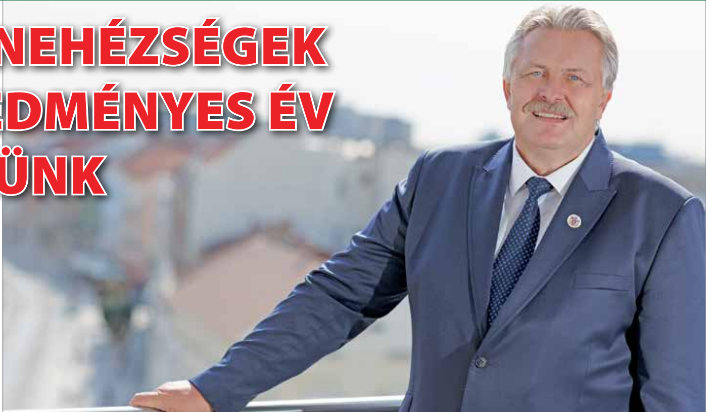
Soha nem tapasztalt körülmények, nehézségek és szabályok jellemezték az évet.

„Kihívásokkal teli egy év áll mögöttünk. Az októberi indulást követően megkezdődött az átadás-átvétel, majd folyamatosan derültek ki gazdasági, pénzügyi problémák. Az új költségvetéssel stabilizálni tudtuk a gazdálkodást, de a ránk maradt hiány és kötelezettség hatalmas. Majd jött a járvány, ami minden tervünket felborította. Kieső bevételek, központi elvonások, lelassult folyamatok, védekezési feladatok, soha nem tapasztalt körülmények, nehézségek és szabályok. Büszke vagyok arra, hogy mindezek ellenére több olyan intézkedést is tettünk, amelyeket célként megfogalmaztunk a Nagy-Miskolc programban.” Veres Pál polgármester az önkormányzati választás óta megvalósult célokat, az elért eredményeket összegzi.