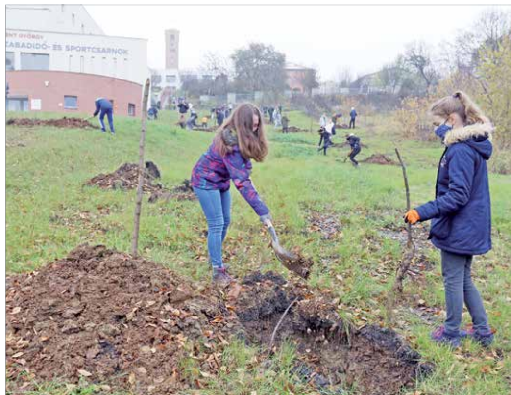
Faültetés a Fényi Gyula Jezuita Gimnázium udvarán.