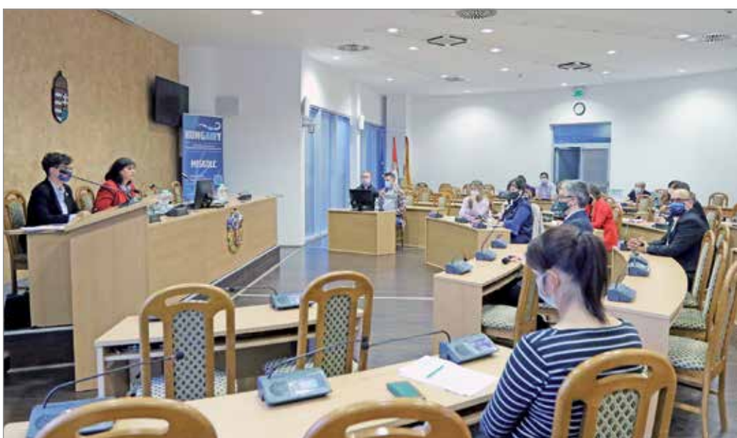
Az esélyegyenlőségi fórum októberi ülése.