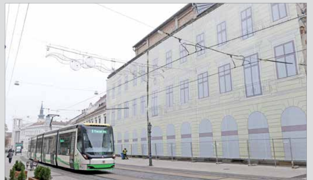
Bentlakásos kollégiumként és szállodaként működhet az újjáépítés után az egykori Avas Szálló.