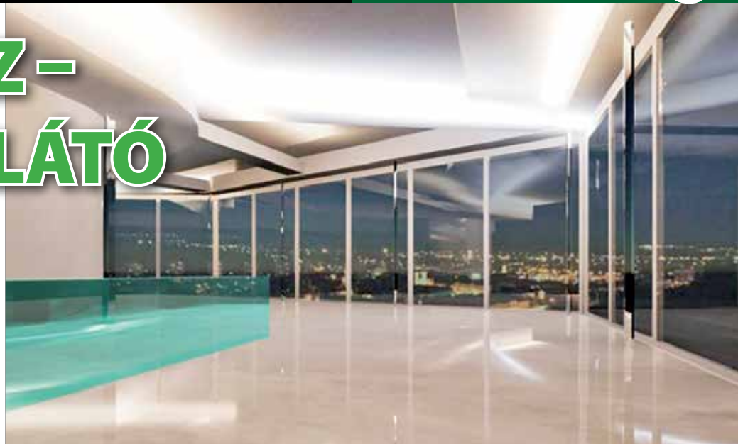
A tervek szerint padlógig üvegezik a presszószintet

A terveket települési és örökségvédelmi szinten is megvitatják és véleményezik. A remények szerint körülbelül három hónap múlva meglesznek a kivitelezési tervek, és egy sikeres kivitelezési pályázat után akár már