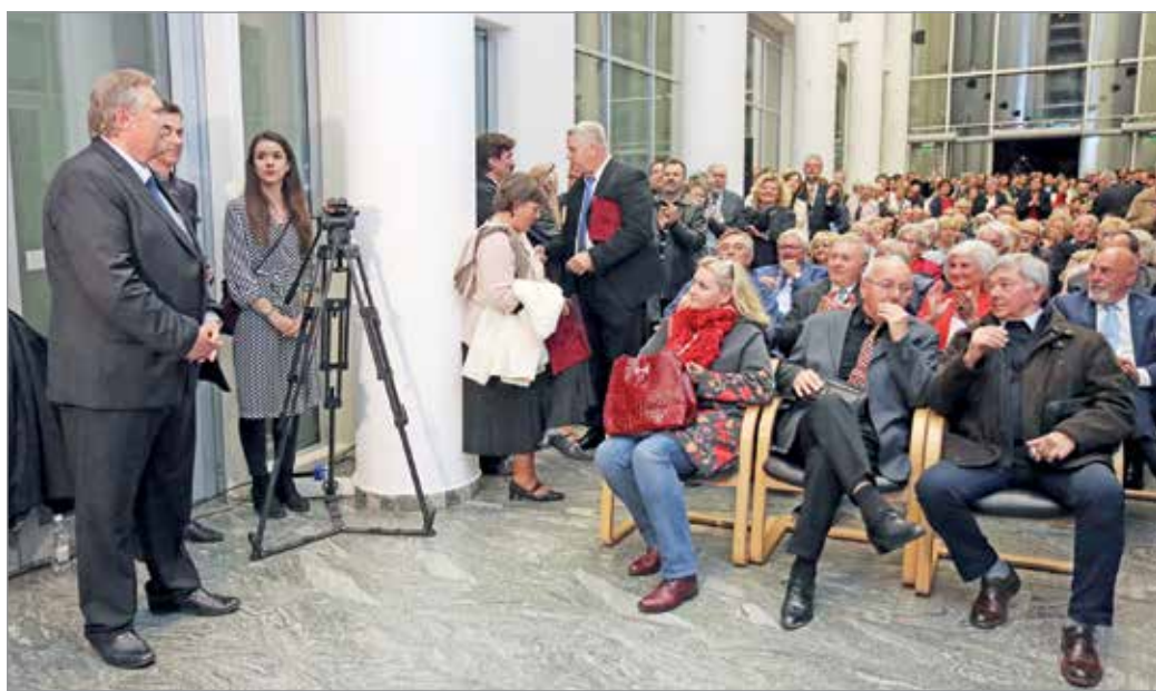
Megnyitották a városházát a városlakók előtt.