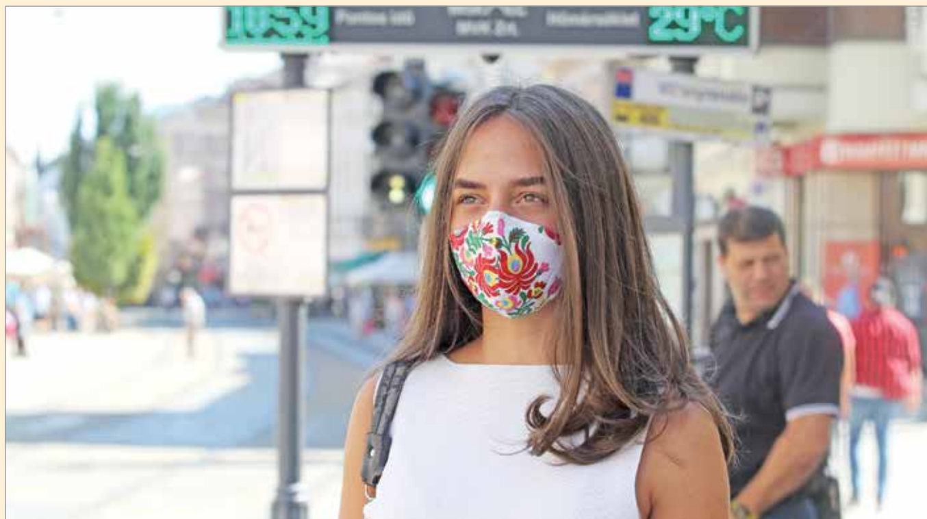
Az év legnagyobb kihívását a koronavírus-járvány jelenti.