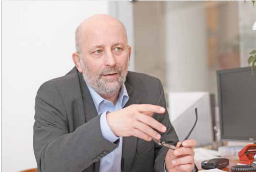
Miskolc város főépítészeként úgy érzi, hogy a helyén van, hiszen a városáért dolgozhat.

– Az osztályban én voltam a nagyothalló, de volt egy szívbeteg kislány, és az évfolyamon volt még egy paralízises fiú is, akivel jó barátságban voltam. Mi a többiekkel együtt tanultunk, együtt töltöttük az időt a szünetekben, és visszaemlékezve, az építész társaimnak teljesen természetes volt így az, hogy alkalmazkodtunk egymáshoz, nem kuriózumként néztek arra, aki más. Ez