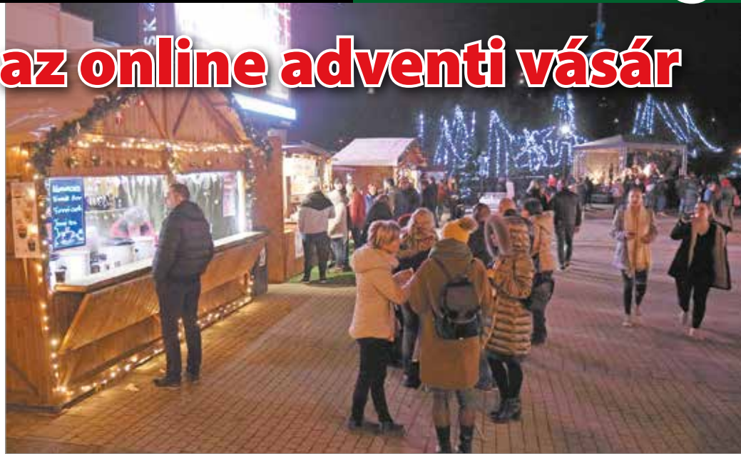
Adventi vásár 2019-ben a Szent István téren.

Nagy Katarina kézzel horgolt táskáit mutatja be a honlapon. „Töreksem az igényességre, praktikumra. Általában pólófonalból, illetve zsinórfonalból készülnek, különböző fém-, fa-, műbőr- kiegészítők-