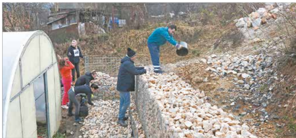
Pénteken az MSZC tanulóit mozgósították.