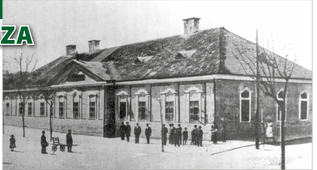
A Fáy-kúriában üzemelt a város első közkórháza

A megnyitást követő évben egy nem várt, impozáns vendége lett a kórháznak. Mikor Ferenc József 1857-ben Miskolcra látogatott, a fogadására igyekvő gróf Szirmay István hirtelen rosszullett következtében leest a lováról. A helyszínen tartózkodó Schnirch Emil gutaütést (agyvérzést) állapított meg nála, a gróft a tetemvári kórodába szállította. A hivatalos program végeztével a császár azonnal utánaesett a kórházba, ahol komoly kritikával illette a romos állapotban lévő épületet. Az uralkodó szomorúságát még az is fokozta, hogy a gróft nem sikerült megmenteni. Talán e fájó emlék lehetett az oka annak, hogy az uralkodó második, egyben utolsó miskolci látogatása alkalmával újfent felkereste a kórházat 1881-ben, ami ekkor már a mai Hősök tere 3. szám alatt található MÁK-épület elődjében, az ún. Fáy-kúriában volt elhelyezve. 1858-ban ugyanis a kórház kiköltözött a tetemvári romos épületből, hogy az új helyén a korábbinál jobb körülmények között folyjon a gyógyítás. Itt már 16 szobában összesen 60 ágy állt rendelkezésre, így négy év elteltével mintegy ezer fővel több beteget tudott a