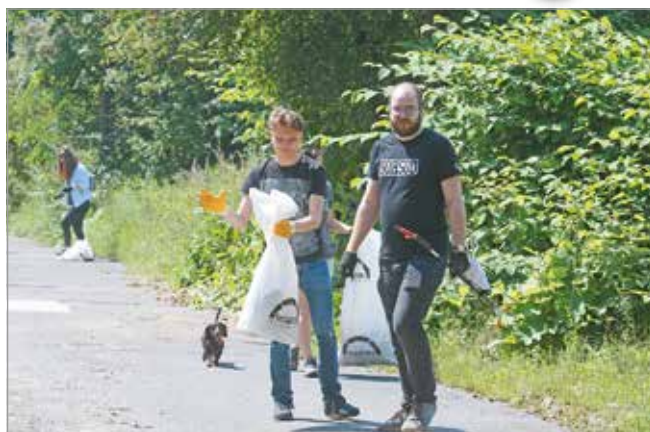
Közösségi szemétszedés az Avason.

Parkolóhelyeket festettünk fel az Áfonyás és a Gesztenyés