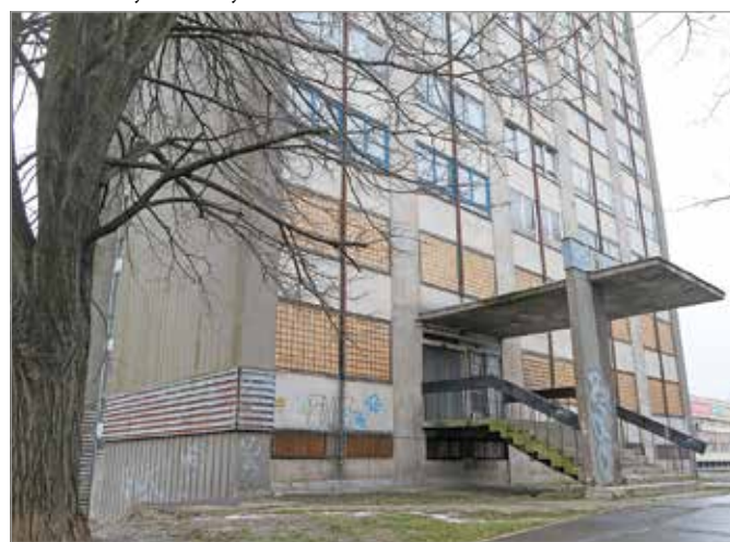
A húszemeletes ebben az állapotban nem maradhat.

ta Szeretet Misszió „Új Esély” Központjának kialakításához nyújtandó segítség ügyét, szó esett a 2019-es városi költségvetéshez kapcsolódó maradvány elszámolásrendjéről, a miskolctapolcai strandfürdő üzemeltetőjének kijelöléséről,