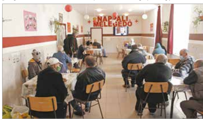
Három intézményben várják a bajba jutott embereket