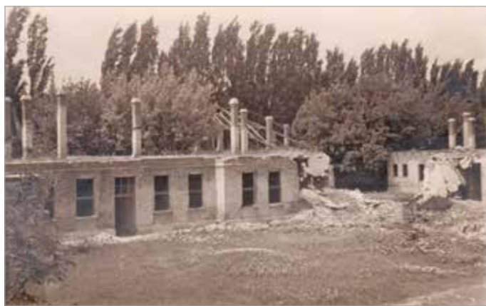
A miskolci Járványkórház a bombázások után

Míndezek ellenére az ügyvéd nem tudta megakadályozni pincéje kisajátítását, így november 16-án megkezdődhetett a költözés, amely 2-3 napig tartott. Mivel a németek a lovakat elvitték, így az egész hercehurcát ökrös szekerekkel hajtották végre. Az