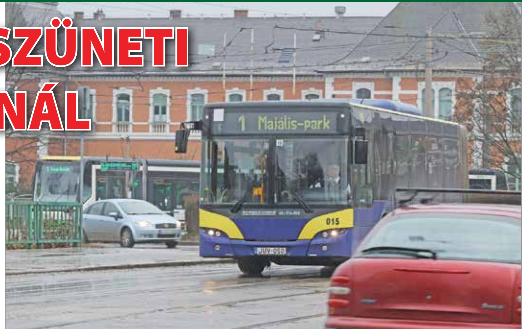
Az 1-es busz tovább közlekedik.

Amennyiben az adott járat kihasználtsága indokolja, úgy a törvényi előírásokat is szem előtt tartva a menetrenden felül további rászigetítőjáratot indít az MVK Zrt. A kormány által előírt járatsűrítés tehát tovább-