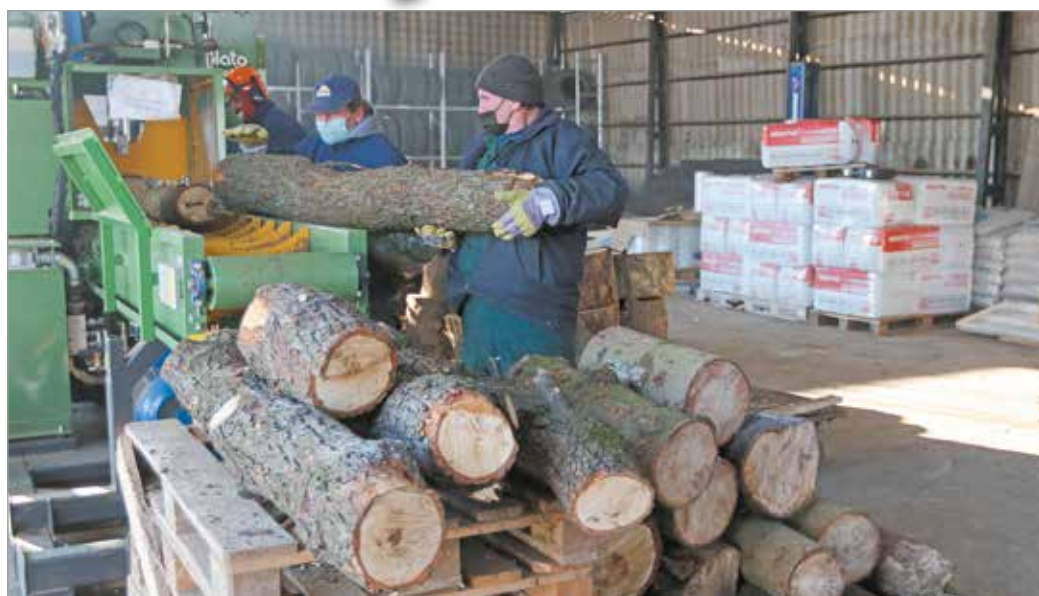
A Városgazda évente ötven hajléktalanszállón élőt foglalkoztat.

Ilyen például a Magyar Máltai Szeretetszolgálat, amely a krízisautó személyzetéről és felszereléséről is gondoskodik. Horkay István, a szervezet Észak-magyarországi Regionális Diszpécserszolgálatának koordinátora kijár a legveszélyeztetettebbekhez mint a krízisautó-szolgálat munkatársa. - Feladatunk eldönteni, hogy milyen segítségre van szükségük a bajba jutott embereknek, majd megszervez-