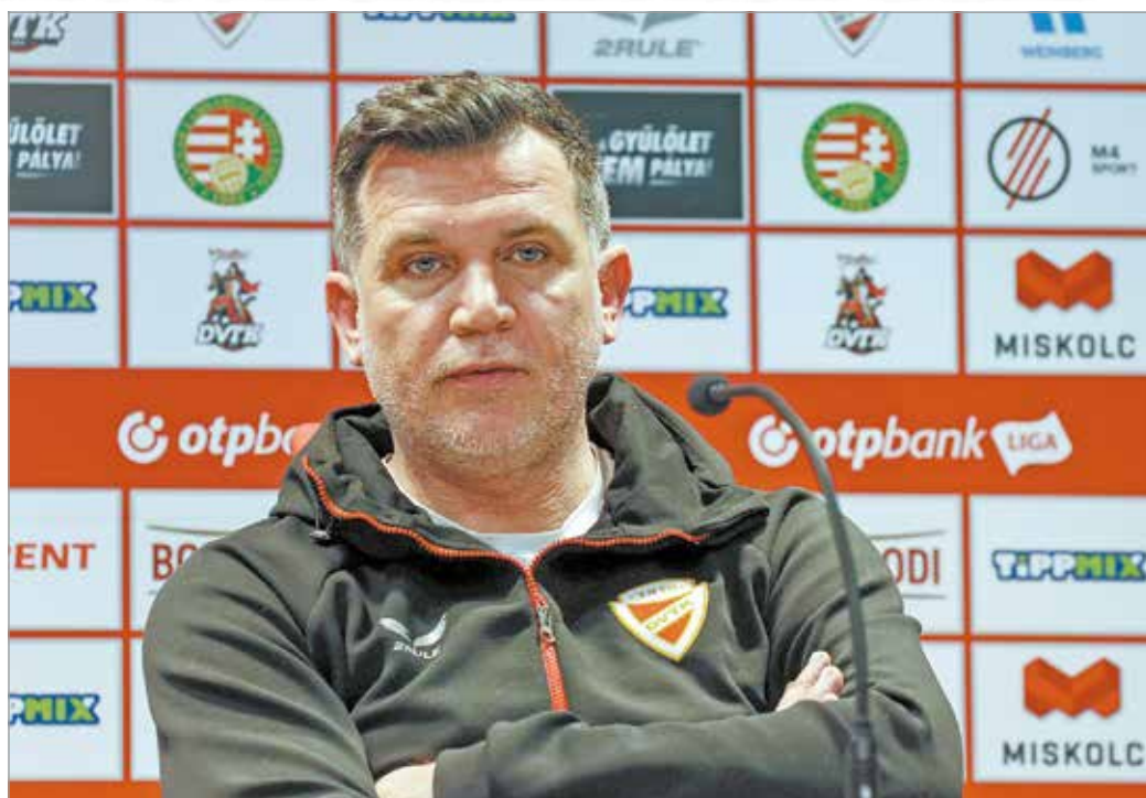
„Aki nem bírja a nyomást, keressen más munkát.”

Határozottan állítja: ha játékosai nem adnak bele mindent, akkor baj lehet, mert a magyar bajnokságban gyakorlatilag bárki legyőzhet bárkit. Ezért is fontos, hogy a DVTK hozza a hazai meccseit. Vasárnap ráadásul a szintén a kiesés elől menekülő Budafok érkezik Miskolcra. Tipikus hatpontos meccs, amin a