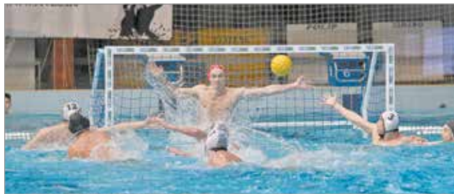
PVSK ellen aratott győzelmet az MVLC.

Az óriási csapatmunkának köszönheti a PVSK ellen aratott győzelmét a miskolci férfi vízilabdacsapat. A Kemény Dénes uszodában a hazaiak gyorsan kétgólos előnyre tettek szert, de ez nem tartott so-