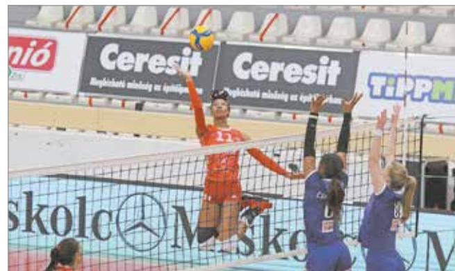
Nagyobb önbizalommal játszottak.

A jó szériában lévő diósgyőri röplabdások legközelebb idegenben, szombaton délután, az MTK csapata ellen lépnek pályára.