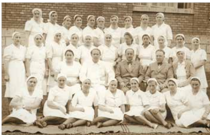
Az Erzsébet kórház szülészeti osztályának dolgozói egy évvel a költözés előtt

A város történetében akadnak olyan fejezetek, amikor a történelem vérzivataros eseményei szomorú ködfátyolként nehezedtek rá a miskolci lakosságra. Nem volt ez másként akkor sem, amikor 1944-ben a város lakossága már saját bőrén tapasztalhatta meg a második világháború borzalmaival, a légitámadástól való félelem pedig egy olyan nem mindennapi megoldást is követelt Miskolc egészségügyi dolgozóitól, ami a mai napig egyedülállóan mondható.