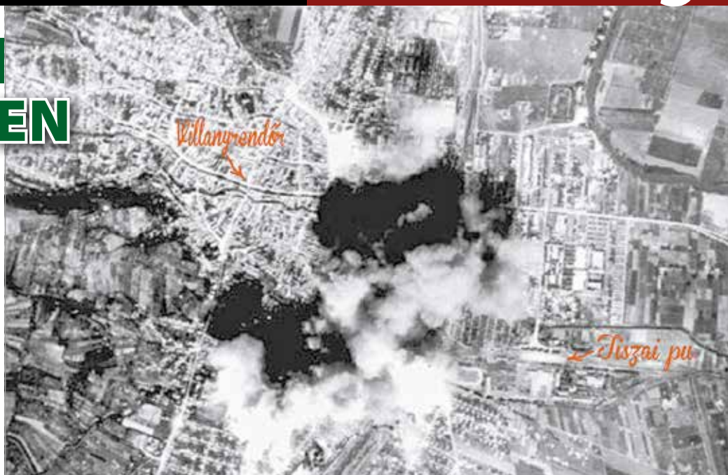
Szövetséges légifelvétel (kiegészítésekkel) a Miskolcot ért támadásról

Az avasi pincékben egy műtőt is berendeztek, ahol számos műtétet hajtottak később végre, az itt dolgozó orvosok közül