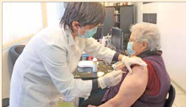
Csütörtökön Miskolcon is elkezdtek a regisztrált idősök oltását.

A miskolci harmincas számú háziorvosi körzetben rendben zajlott az idősök oltása – mondta el dr. Kázár Ágnes. A háziorvos kiemelte, a Moderna vakcina esetén negyedórán át kell megfigyelni a betegeket, de körzetében se-