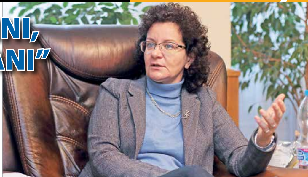
A rektor nagy reményeket fűz a 2020 ősztől indult technikumokhoz is.

A rektor nagy reményeket fűz a 2020 ősztől indult technikumokhoz is. Ezek a képzések – az ösztöndíjaknak is köszönhetően – sokkal vonzóbbak lettek a fiatalok számára. Az oktatás színvonalát sem érheti már vád, és mivel a technikus vizsga megfeleltethető egy emelt szintű érettséginek, így a továbbtanulás is könnyebbé vált. Az egyetem együttműködik a Miskolci Szakképző Centrummal, ennek keretében azokon a területeken, amelyek hagyományosan erősek a városban – informatika, turizmus-vendéglátás, gazdálkodás-menedzsment – összehangolják a képzéseiket. Az oktatóik ki-járhatnak a szakképző centrumokba órákat tartani, a diákokat pedig várják a campuson. – Azt reméljük, hogy a technikumról sokkal többen tudnak továbbtanulni az egyetemünkön, mint a korábbi szakképzési