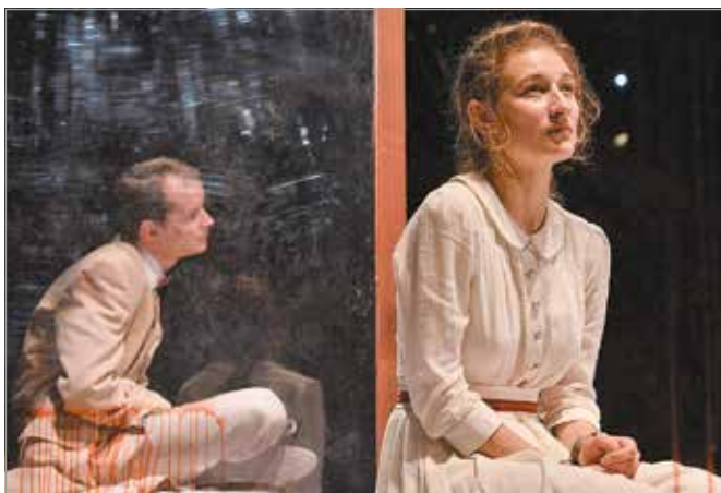
Az első előadás az Édes Anna lesz.

A Miskolci Nemzeti Színház művészei, a járványügyi előírásokat betartva, a kényszerzünet alatt is folytatták a munkát, hogy amint újra nyitnak a színházak, azonnal köszönthessék a közönséget. Elkészült a Producerek című musical, melyet Béres Attila rendezett, valamint két másik produkció próbái is elkezdődtek: Szomoró Dezső Hermelin című színművét Mohácsi János rendezte, a Miskolci Balett pedig Petőfi Sándor komikus eposztát. A helyszín kalapácsát ülteti át a táncnyelvére. Emellett, hogy ne hagyja színházélmény nélkül közönségét, a miskolci teátrum elindította A deszka népe – Történetek a színpalak mögött című videósorozatát, melyben a színház azon szegleteit mutatják meg, melyek a nézők előtt legtöbbször rejtve maradnak.