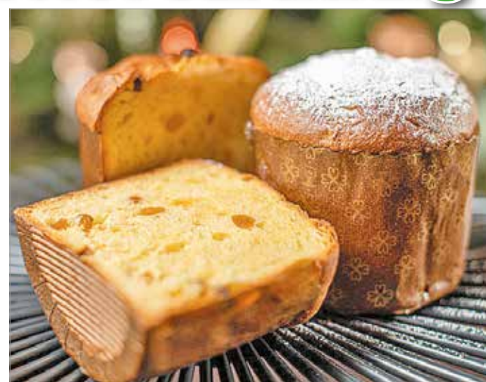
A pandoro a karácsonyi ünnepkörhöz köthető

– A panettone és a pandoro nevével már biztos többen találkoztak a hipermarketekben.