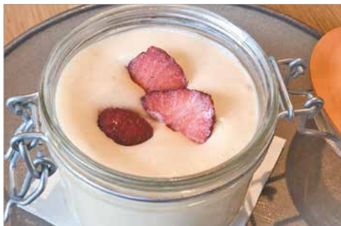
A panna cotta világszerte ismert olasz desszert