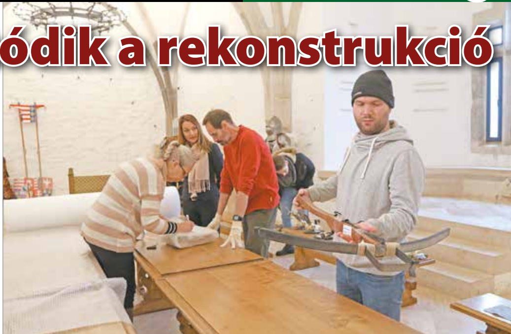
A kivitelezés ideje alatt a vár zárva tart.

A kivitelezés ideje alatt a vár zárva tart, az üzemeltető Miskolci Kulturális Központ munkatársai a héten megkezdtek a kiállítási terek bontását. Az