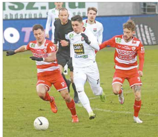
Döntetlenre mentette a mérkőzést a Budafok.

Szombaton újra hazai pályán lép pályára a DVTK, az élmezőnyhöz tartozó Kisvárdát fogadják 14:45-től a forduló nyitómérkőzésén – ez kötelező vagy bravúrjegyűnek minősül vajon?