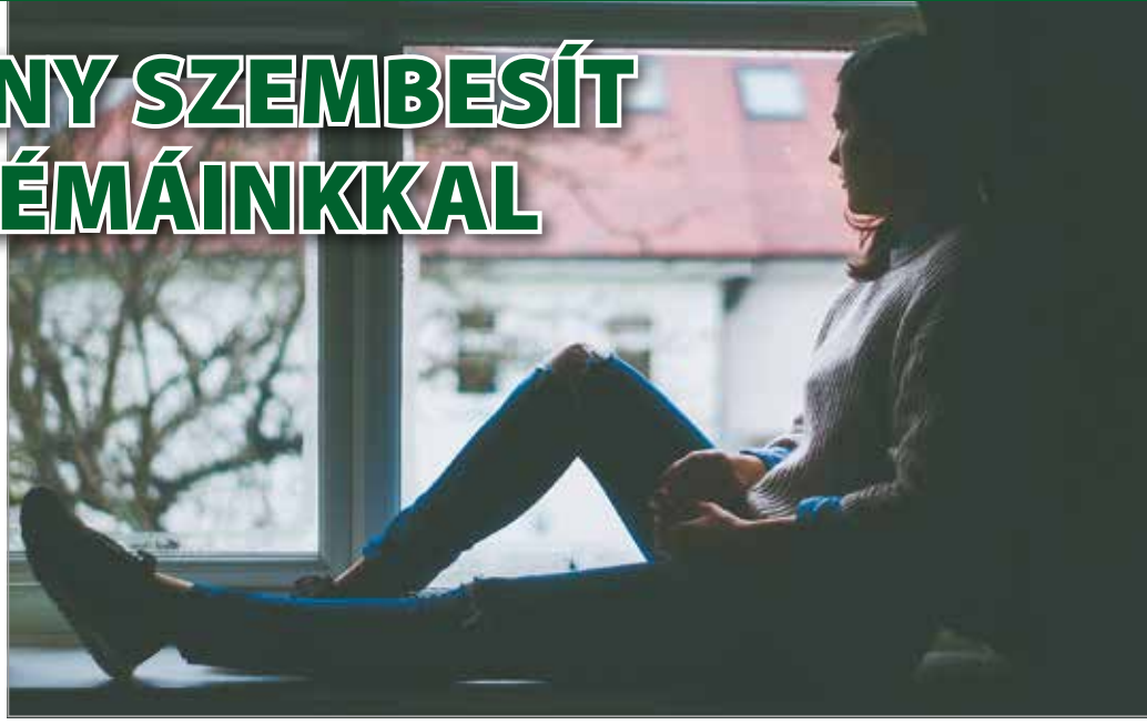
A koronavírus-járvány rosszul érinti az emberek többségét.

– Ilyen esetekben bizonyos ingerületátvivő anyagnak a