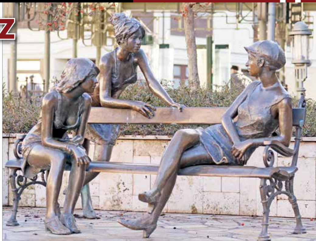
A szoborcsoport Miskolc egyik jelképévé vált.

A „Miért Miskolc?”-füzet megjelenése után három évvel, amikor már a lakosság birtokba vette és megszerette a város új terét, a Szinva teraszt, azon