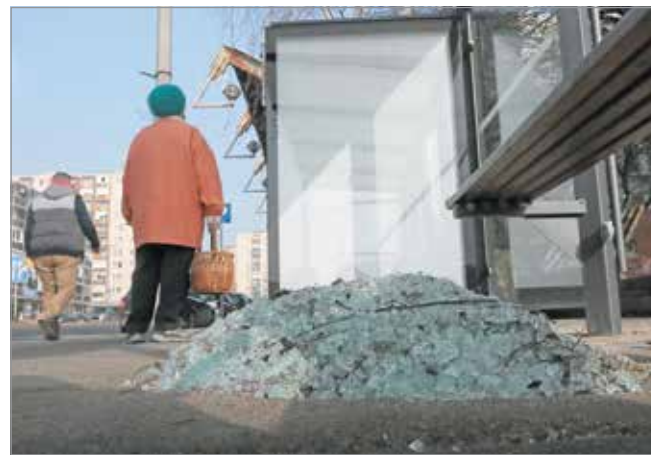
A pótlás költsége is a telepítőcégre hárul.

– Egy olyan cég telepítette az utasvárókat, amely például Párizsban is végez hasonló munkát. Számukra a minőség presztízs kérdése, ezt mutatja az is, hogy az első buszváró vitrinüvegét, ami néhány napja ment tönkre, mostanra már pótolták is.