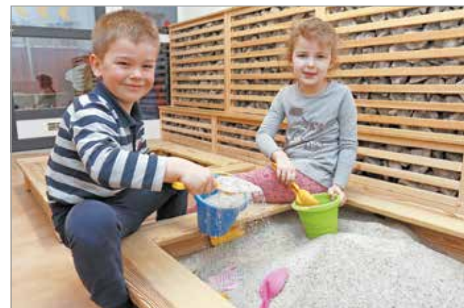
A gyerekek rendszeresen játszanak a sósobában