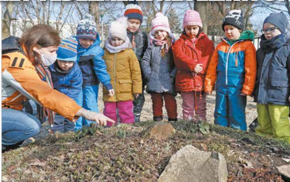
A gyerekek kíváncsián fedezik fel a természetet.

– Három évre rá újra sikeresen pályáztunk, majd 2017-