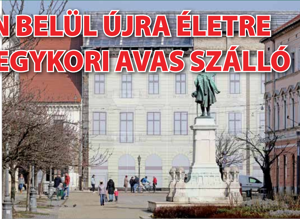
Az egykori szálloda hasznosítása minden miskolcinak fontos és örömteli hír.