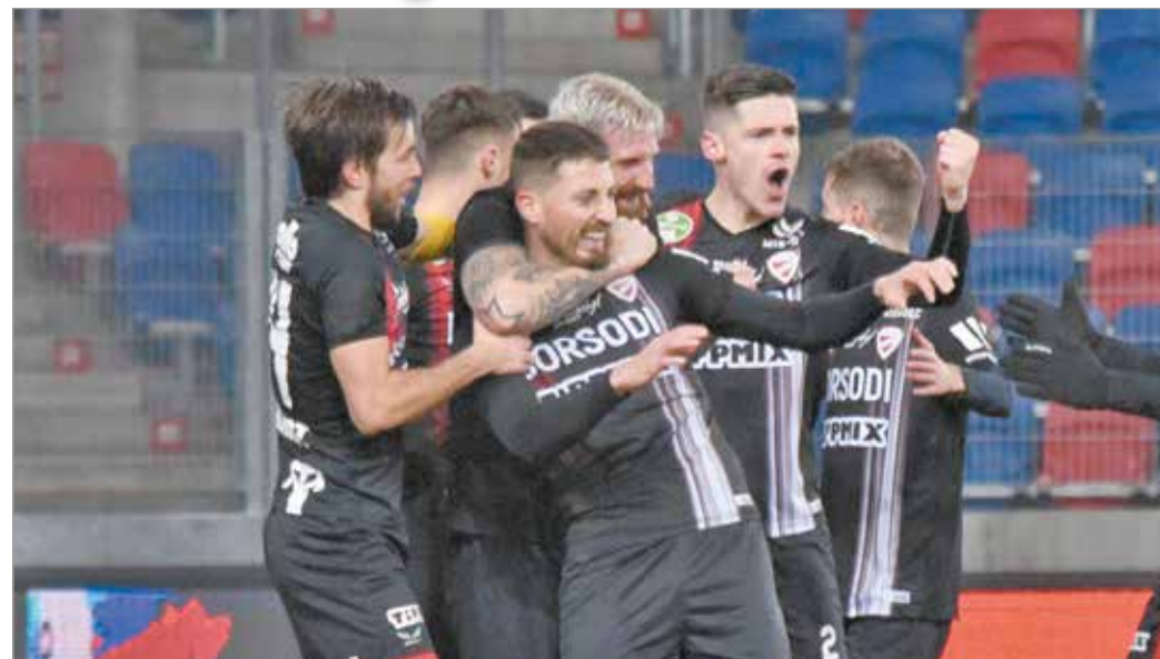
Hátrányból fordítva nyert a DVTK a Fehérvár ellen.

Nehéz helyzetbe hoztuk magunkat azzal, hogy korán hátrányba kerültünk, de utána talpra álltunk, és rengeteg helyzetet alakítottunk ki. Az első féldő közepén Hegedűs egy sorral előrébb lépett, mert a középpálya közepén nem voltunk kellőképpen kompakta. A féldőben azt mondtam a csapatnak, hogy ez az eddigi legjobb meccsünk, és azt kértem tőlük, hogy támadásban gyorsan járassák a labdát, a széleken kettő az egy elleni szituációkat alakítsanak ki, és végül ez vezetett eredményre. A cserék új erőt vittek a játékba. Gheorghe Grozavtől egészen kiváló dolgokat láttam az edzéseken, és amikor a hét során beszélgettem vele, mindig feltettem neki a kérdést, miért nem mutatja meg a tudását a meccseken is. Istennek hála, ma rengeteget profitált a csapat a képességeiből.”