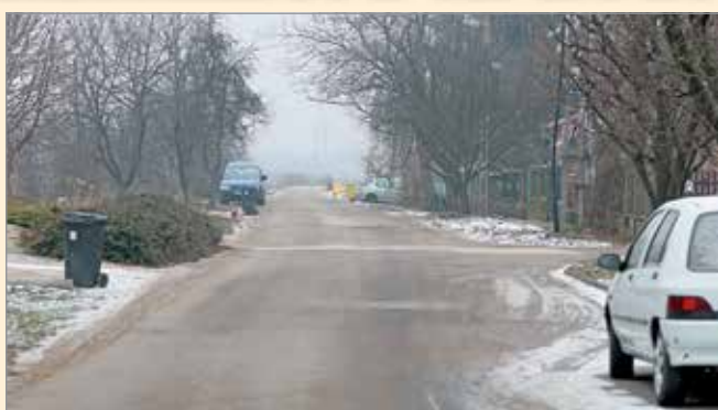
A terelőút megmarad az Y-híd megépülését követően is

– Egészen addig nem bontják el teljesen a hidat, amíg a kerülőút meg nem épül – hangsúlyozta a városvezető, aki a Csokonai utcában élők aggodalmaira is reagált: az utcában nem nő meg annyira a forgalom, hogy az a he-