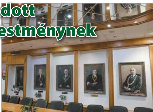
A rektor-festmények a Szenátusi teremben.

Azt is elmondta, hogy az emberábrázolást szereti a legjobban. – Komoly feladat megfogni az illető személyiségét, karakterét. Attól, hogy pontosan másolok le valamit, még nem teljes, csak akkor lesz az, ha belekerül valami több. Nézem az arcát, és lelket adok