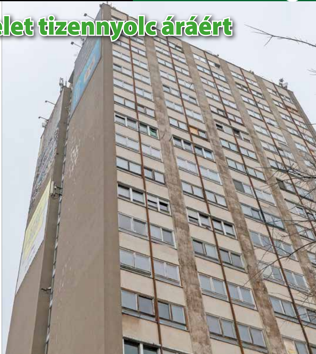
Március 1-jéig várják az ajánlatokat a húszemeletesre.

Ez azonban még a jövő kérdése. Jelenleg üresen árválkodik az épület a Szentpéteri kapuban, a Holding fizeti az őrzését, és igyekszik megőrizni az állapotát az új tulajdonos megérkezéséig.