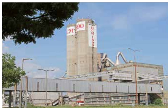
A HCM 1890 Zrt. tulajdonában lévő gyár jelenleg nem termel.

szalagpályát is, amely a tervek szerint a tapolcai kőbányából szállította volna a zúzott követ a cementgyárba. A HCM 1890 vezetői a Nemzetgazdasági Minisztériumhoz fordultak, hogy támogatás nélkül hitelkérelmüket engedélyezzék. Később a cég arról adott tájékoztatást, hogy a gyárban alkalmazott megoldások megfelelnek az ágazatban elérhető legjobb technológiai követelményeknek. A gyártás azonban továbbra sem kezdődött meg, és jelenleg is sok a bizonytalanság. Bár a bíróság a Zöld Kapcsolat Egyesület által kifogásoltakat megalapozatlannak nyilvánította, azonban az ítélet nem jogerős. A Zöld Kapcsolat Egyesület jelezte, a Kúriához fordul az ügyben. A pereskedéssel töltött idő alatt egyébként – 2020. november 30-án – lejárt a cementgyár üzemeltetésére kiadott egységes környezethasználati engedély. A HCM1890 Zrt. tavaly novemberben ennek felülvizsgálatát kérte a megyei kormányhivataltól. A Zöld Kapcsolat Egyesület ezzel egyetemben a felülvizsgálati kérelem elutasítását kérte.