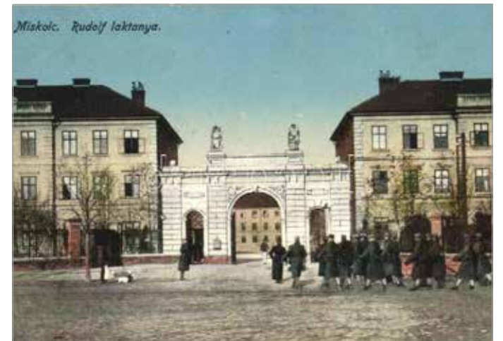
A Rudolf laktanya

a Petőfi laktanyában katonáskodtam a múlt század hetvenes éveinek végén. A Cserépfalun mintegy hónapig tartó kiképzést követően a katonai eskü ünnepélyes pillanataira már itt ke-