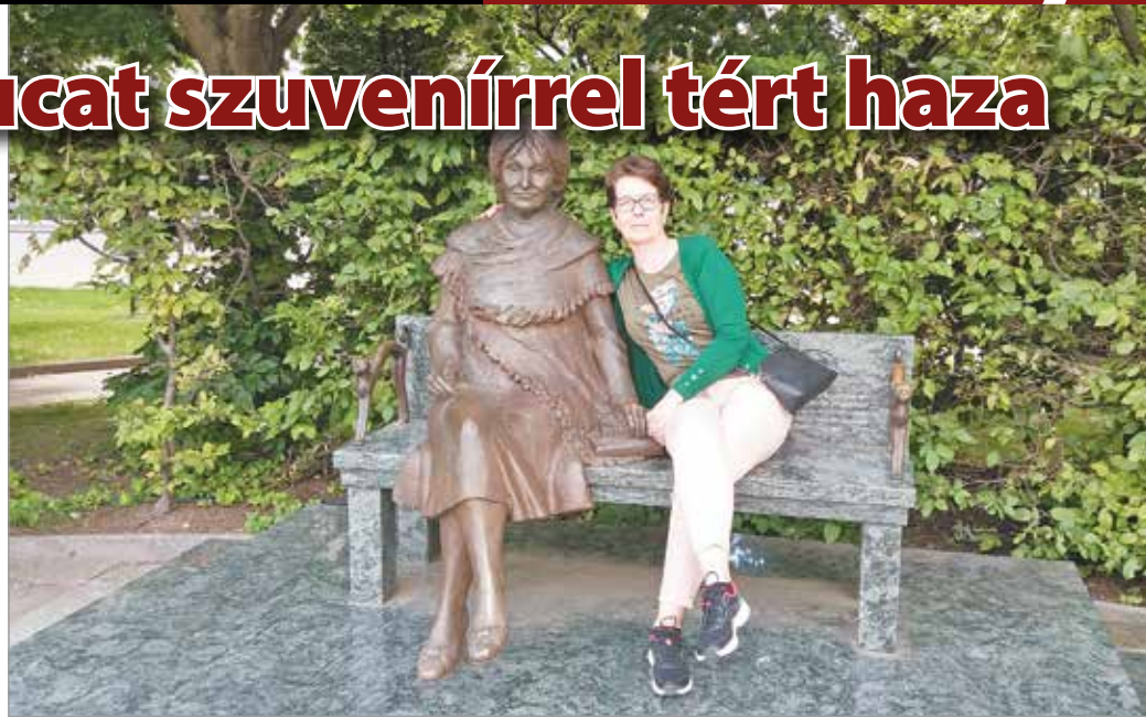
Szabó Magda szobrával Debrecenben.

– Kisiskolás koromban írtam verseket és meséket, ezeket sajnos nem őriztem meg. Egyetemista koromban fordultam ismét az irodalom felé.