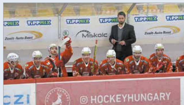
Rendezték a soraikat a válogatott szünetben.

Egyszerűnek és hatékonyak kell lenni a jégen – így határozta meg a csapata előtt álló legfontosabb feladatot a DVTK Jegesmedvék vezetőedzője.