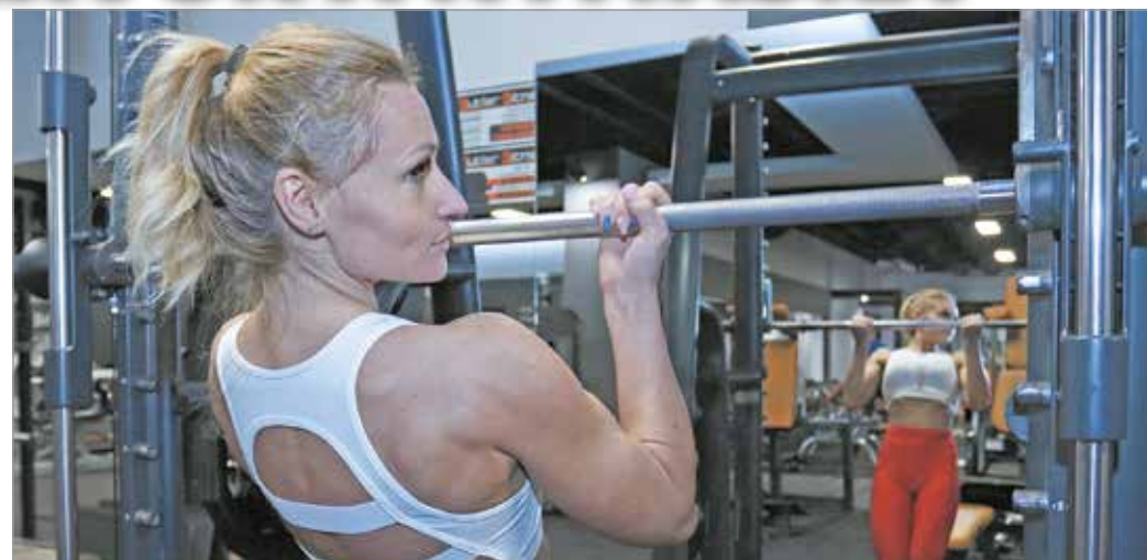
Akár már márciusban újrainyitnák az edzőtermek.