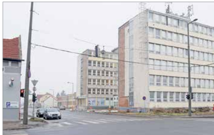
A Zsigmondy utcán épülhet meg az irodaház.

– A Szent István tér szomszédságában, az egykori fürdő medenceterének helyén létrejött