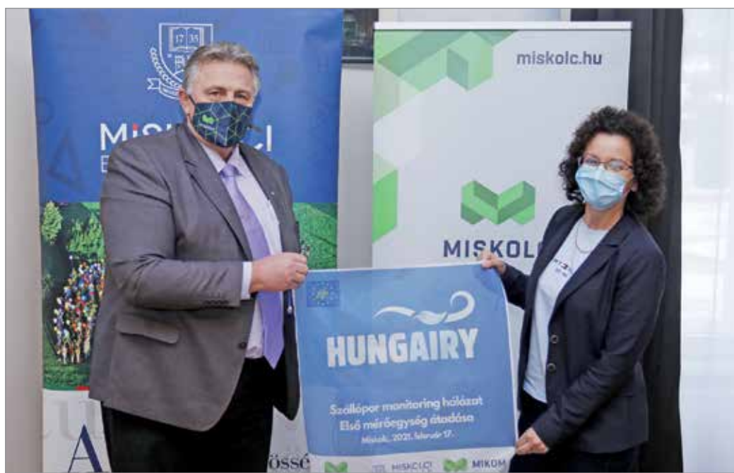
A programban az önkormányzat a Miskolci Egyetemmel közösen vesz részt.

A Miskolci Egyetem rektora köszönetet mondott a városnak azért, hogy bízott a felsőoktatási intézményben dolgozó kutatók munkájában. Mint hozzátette, a Miskolci Egyetem minden olyan