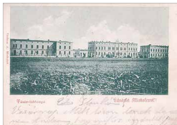
Képeslap a Tüzér laktanyáról