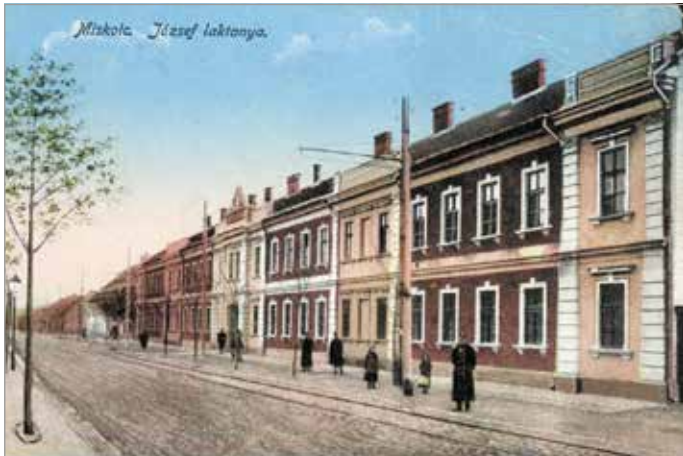
Az egykori József laktanya a Tizeshonvéd utcában

„Túl sok az árnyék ebben a városban, ezért döntöttem úgy, hogy a fényről fogok írni. Miskolc ezernyi titkát csak elhulajtott az emlékezet, hogy egyszer újra megtaláljuk őket. Amint felemeljük és markunkban tartjuk, máris fényesedni kezdenek” – írja Miért Miskolc? című kötetében Fedor Vilmos. A lokálpatrióta 63 válaszban indokolja meg, hogy miért szereti Miskolcot.