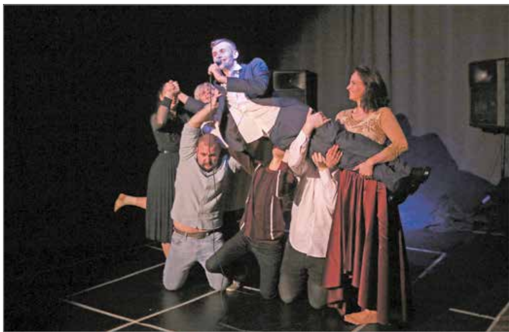
A színésznövendékek hétfőn tartották bemutatóvizsgát.

A pályázat benyújtásának módja: elektronikusan a titkarsag@mnsz.hu e-mail-címen, határideje: 2021. december 31. Eredményhirdetés: 2022. március 1-jén.