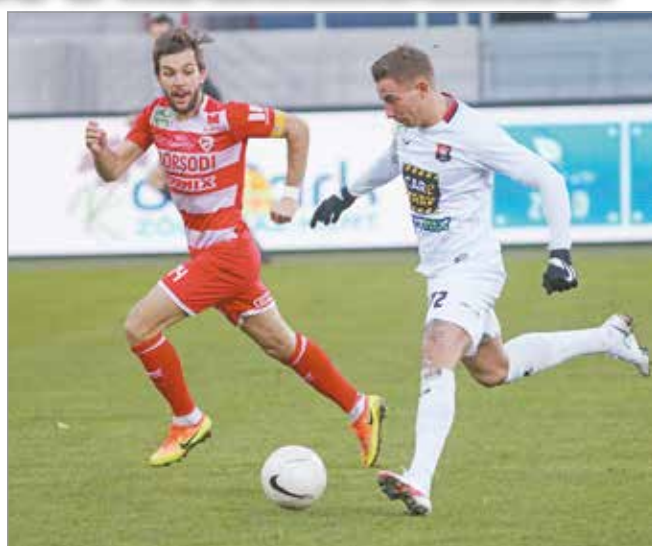
Újra betalálna a Videoton ellen.