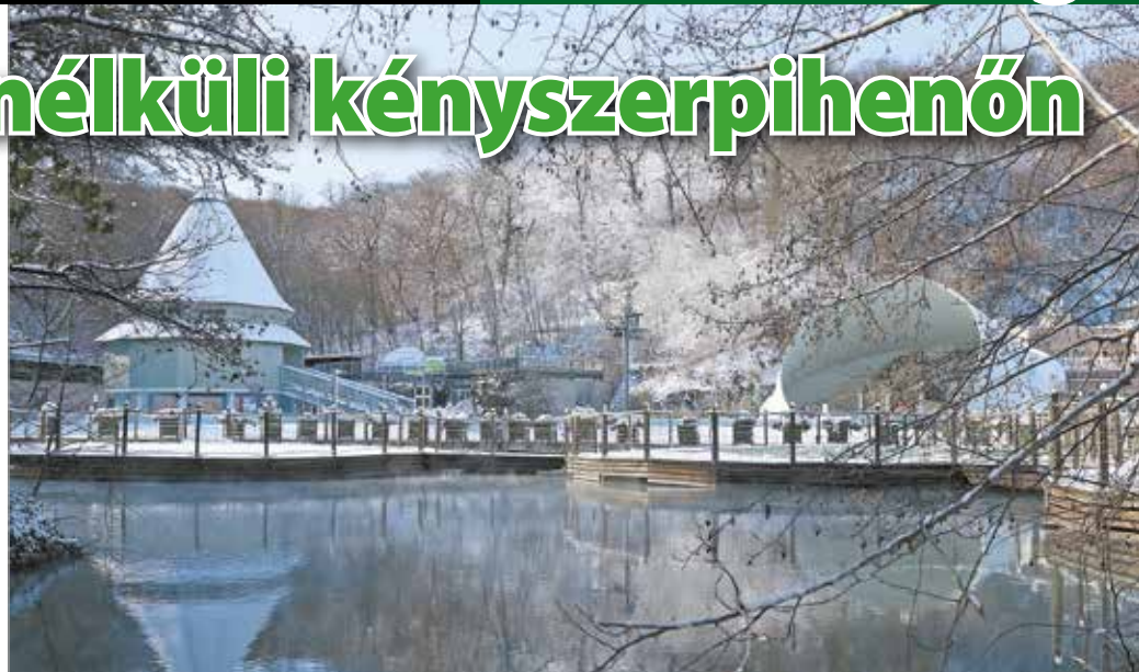
Az épületeket fűteni, a medencéket fagymentesen kell tartani.

Ezért voltak kénytelenek fizetés nélküli állásidőt elrendelni február elejétől, ami a 144 alkalmazott közül 79 embert érint. A cég jogosult a kormány által biztosított 50 százalékos bértámogatásra, de a segítség nehezen érkezett meg. – Február elején, hosszas huzavona után kaptuk meg végül. Novemberre és decemberre is időben megigényeltük – az utólagos finanszírozásnak induló – támogatást, ám adminisztratív huzavona után csak februárban kaptuk meg. Sajnos a késlekedés miatt kellett úgy döntenünk, hogy a kollégáinkat állásidőre küldjük. A kormány döntése alapján február elején a novemberi és a decemberi támogatásigénylésünk dupláját utalták át a számlánkra. Gyakorlatilag megelőlegez-