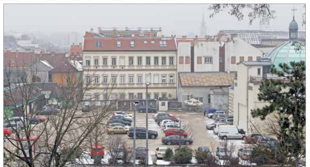
A Hell-célcsoport építheti meg a Szent István tér jelenleg hiányzó, délkeleti térfalát