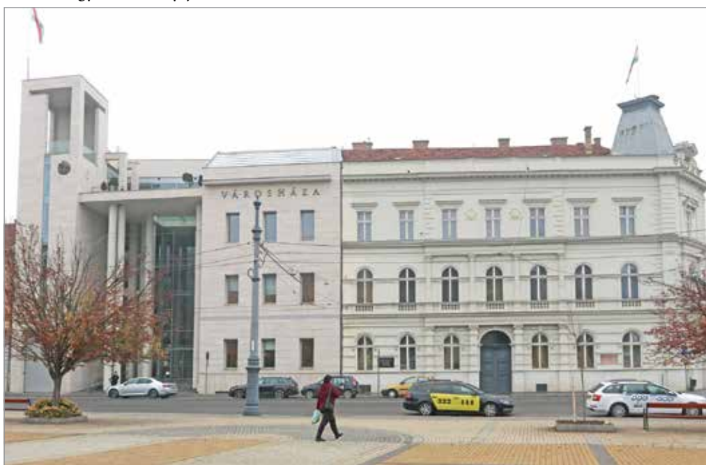
Miskolc költségvetését is takarékosabbra tervezik.