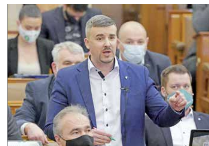
Jakab Péter nem adja voksát az újabb felhatalmazáshoz