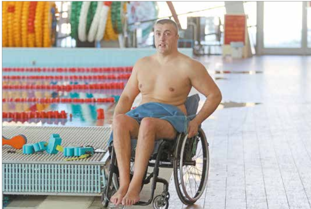
„A vívás olyan szerelem számomra, ami nagy világeseményen való részvétellel kecsegtet”