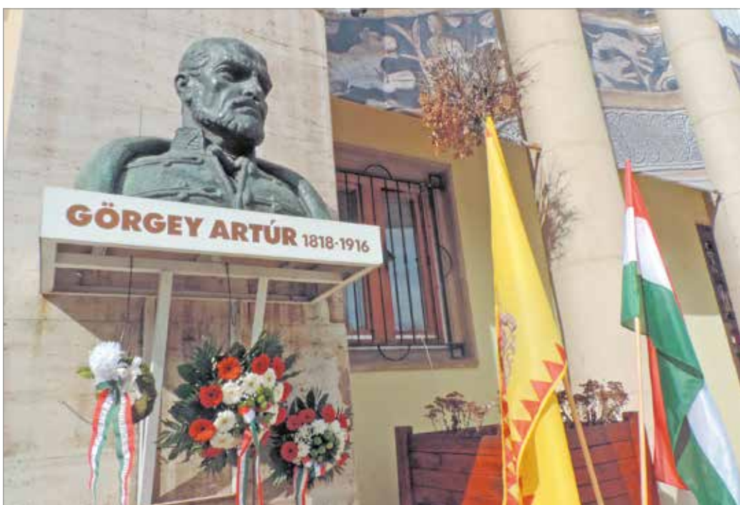
Görgey Artúr szobra a Herman Ottó Múzeumnál.