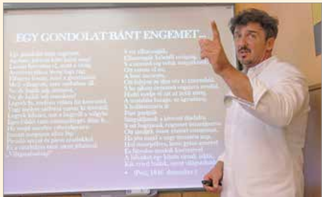
Kiváló miskolci pedagógusoktól tanulhatnak a műsort követő érettségizők.

A #érettségit minden hétköznap 16:50-től sugározza a Miskolc Televízió. Az adások a minap.hu facebook oldalán is követhetők lesznek.