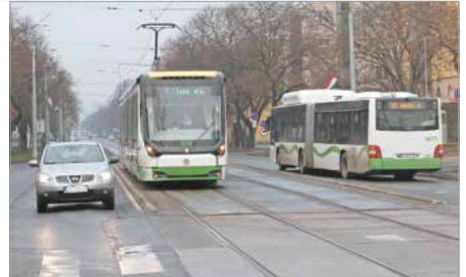
A reggeli órákban átlagosan nyolc, délután pedig négy ráségítő villamost kell indítani.

Szerdán aztán újabb közlemény érkezett a közlekedési cégtől, melyben közölték, március 18-ától több vonalon is többlétjáratokat indítanak. Az MVK villamosközlekedési igazgatója lapunknak elmondta, a cég szakemberei napi szinten nyomon követik az utasszámot, az adatokat feldolgozzák, majd ez alapján döntenek arról, hogy melyik járatnál, illetve milyen időszakban van szükség a ráségítőjáratokra.