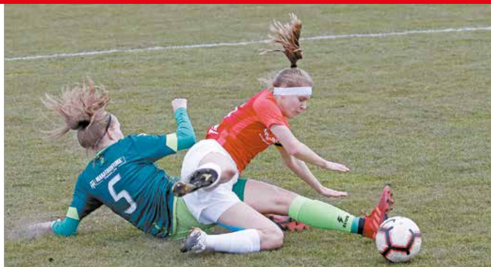
Küzdelmes mérkőzés lesz a Fradi ellen is.

A női röplabda Extraliga rájátszásában az 5-8. helyért vívott párharc következő for-