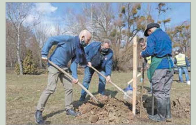
A fák ültetésekor a későbbi parkfenntartásra is gondoltak.

A Nagy-Miskolc programban elültetett fákkal nem csupán a kidőlt, kivágott fákat pótolják, hanem új fasorok és ligetek is lesznek a város közterületein. Az egészségesebb és zöldebb környezet kialakításához továbbra is várják a civilek, vállalkozók, alapítványok és magánszemélyek felajánlásait.