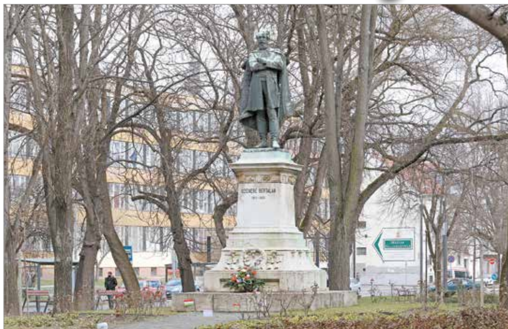
Szemere Bertalan szobra a Szemere-kertben.

A '48-as forradalom ötvenedik évfordulóján, 1898. március