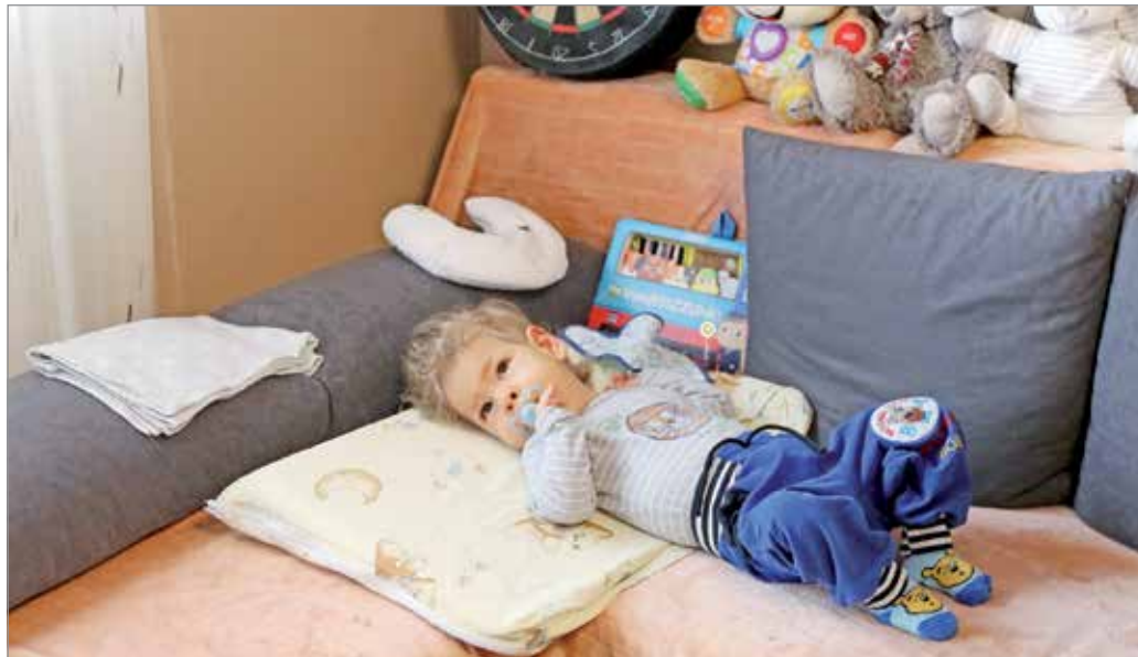
A következő három hónap a pihenésről fog szólni.