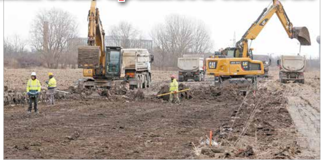
Rövidesen megkezdődhetnek a látványos útépítési munkálatok is.