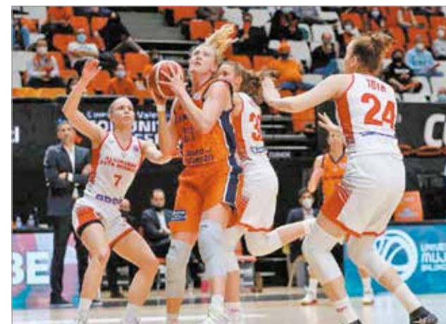
Klasszissal ellen is helyt álltak.

mindaddig, amíg lányai bírták erővel és koncentrációval. – Egészen sokáig, a harmadik negyed végéig partiban tudtunk lenni. Sajnos ezután minden téren elfáradtunk, rossz döntéseket hoztunk, és felőrölt minket a Valencia. Ellenfelünk nagyon erős csapat, hozta a papírfórmát. Annyit sajnálok csak, hogy ilyen nagy különbség alakult ki a végére. Azt gondolom, annál nagyobbat harcoltunk, mint amit a végeredmény tükröz – nyilatkozta a klub hivatalos honlapjának.