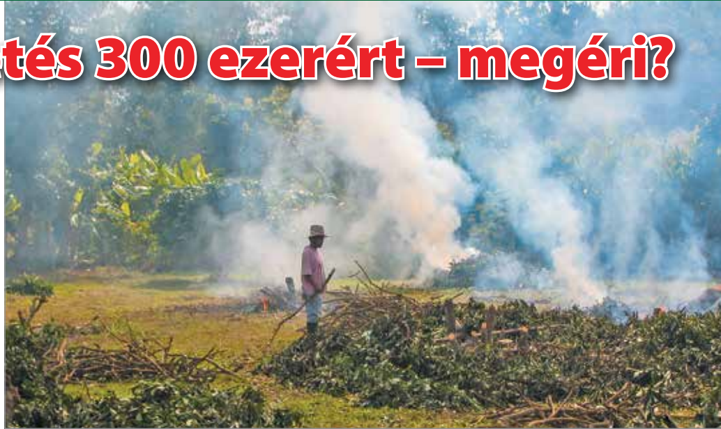
Az égetés nagyban hozzájárul ahhoz, hogy időszakonként kifogásolt Miskolc levegőminősége.

A fűtési szezonban rendkívül magas a levegő minősége Miskolcon, ez a magas szállópor-koncentráció miatt van. Az önkormányzat több intézkedést is hozott a tisztább levegő érdekében, de komoly a lakosság felelőssége is. A rendészet igazgatója figyelmeztet: akár 300 ezer forintba is büntethetik azt, aki kazánjában, kályhájában gumit, kábelt, műanyagot éget.