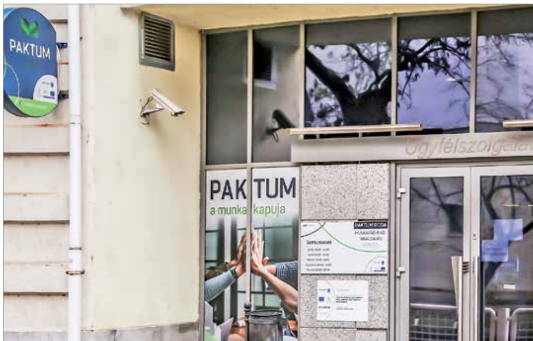
A Paktum ügyfélszolgálati irodájában a munkaerőpiaci tanácsadó kollégák az álláskereső ügyfeleknek személyre szabott szolgáltatásokat biztosítanak

A Paktum ügyfélszolgálati irodájában a munkaerőpiaci tanácsadó kollégák az álláskereső ügyfeleknek személyre szabott szolgáltatásokat biztosítanak annak érdekében, hogy megtalálják a számukra megfelelő munkahelyet. Ilyen szolgáltatások a munkaerő-piaci és foglalkoztatási információk nyújtása, mentorálás, egyéni fejlesztés és álláskeresési tanácsadás, önéletrajz- és motivációs levél írás, álláskeresési technikák átadása, pályaválasztási- és módosítási tanácsadás. Ezen kívül ingyenesen igénybevehető pszichológusi tanácsadást is biztosítani tudnak. A tanácsadó kollégákat a Paktum partnereitől folyamatosan tájékoztatják a megpályázható üres pozíciókról.