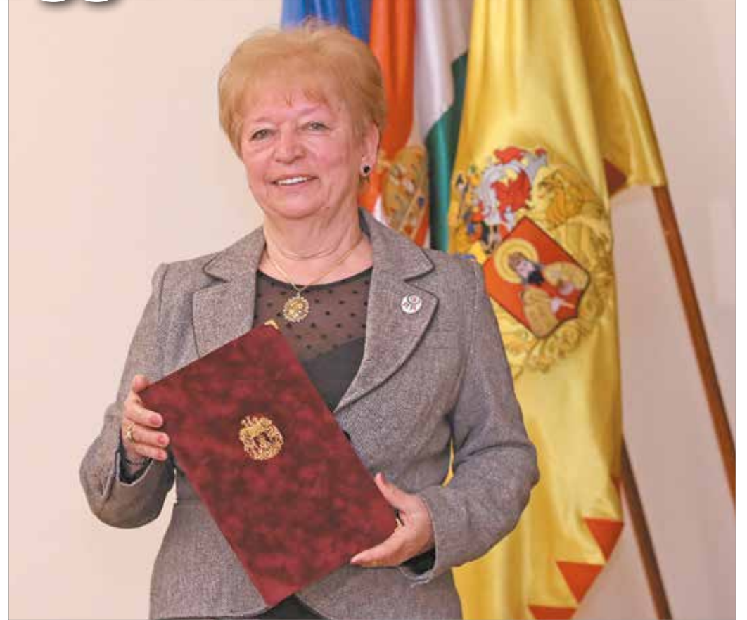
Monos Márta lett az Év Újságírója Miskolcon.

Munkája során többször kapott oklevelet különféle civilszervezetektől (legutóbb