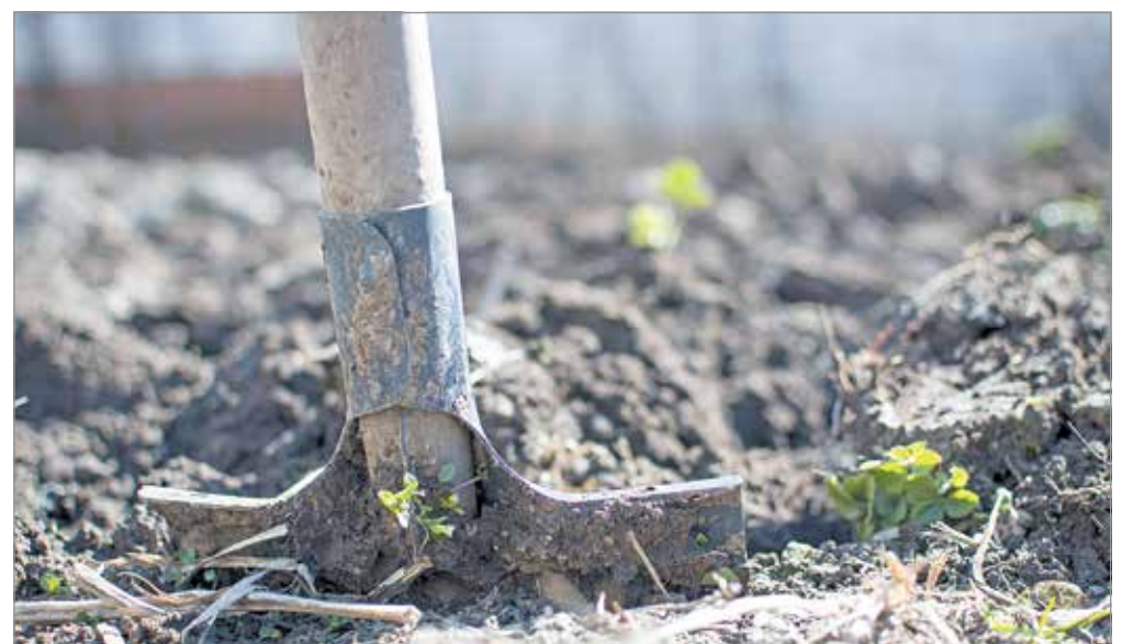
Már előkészíthetjük a talajt a konyhakert majdani beültetésére.