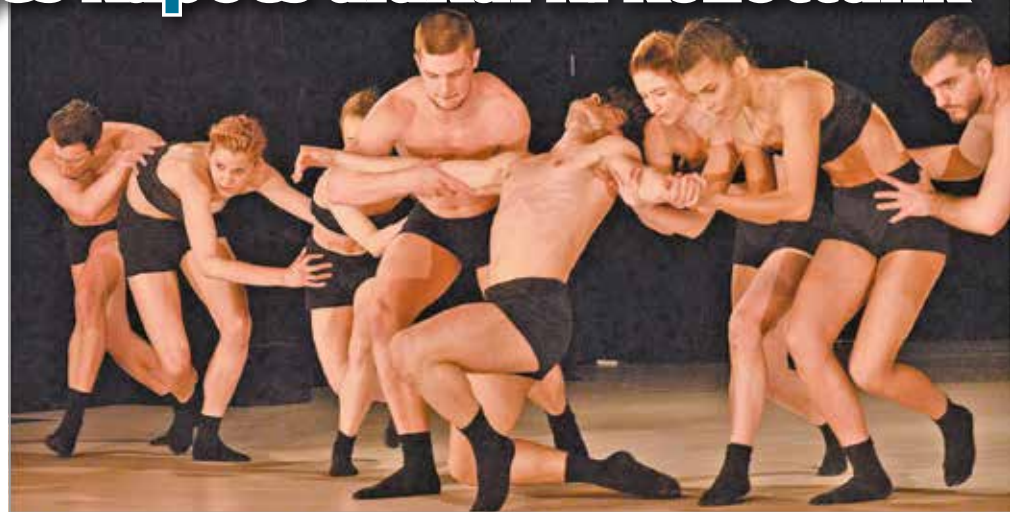
A Miskolci Balett művészei nagy szenvedéllyel fordulnak a tánc felé.

– A dallasi Bruce Wood Dance táncgyűlésnek készítettem el először a „Forbidden Paths”, azaz Tiltott ösvények című produkciót, Európában pedig a Miskolci Balett az első társulat, aminek átadom ezt a koreográfiát. Remélem, hogy még sok más táncgyűlés is elsajátít-