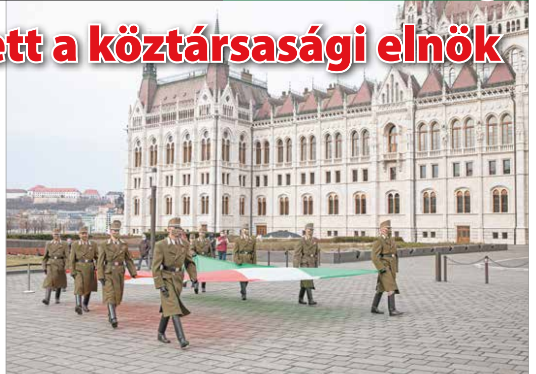
A honvédség díszegysége a Kossuth Lajos téren, ahol felvonták Magyarország lobogóját az 1848-49-es forradalom és szabadságharc kitörésének 173. évfordulóján, március 15-én.