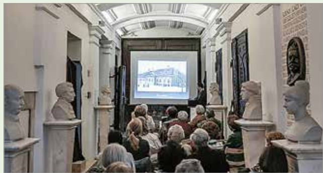
A közönség számos érdekességet hallhat a sorozatban