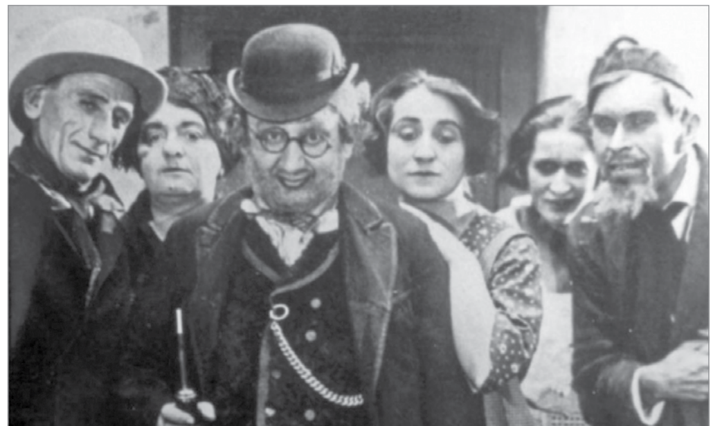
Részlet a Város zsidók nélkül című filmből

Nagyszerű színészekkel is dolgoztam. Emlékszem arra, amikor az abban az időben legnépszerűbb színésznőnek számító Carmen Castellierinek írtam forgatókönyvet. Olyan jó barátnők lettünk, hogy eljött hozzám megnézni, hol lakom, és hosszú órákat