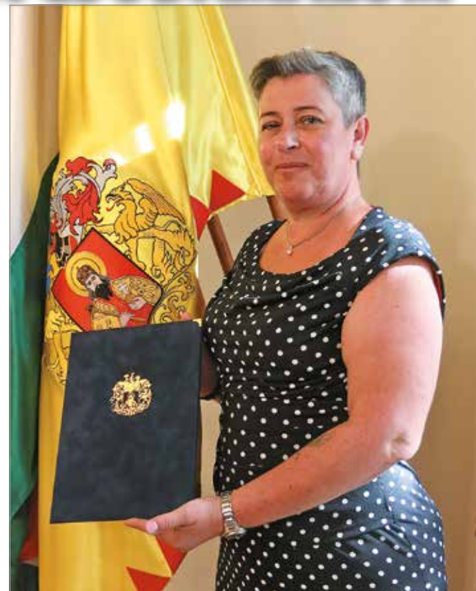
Átvette megbízólevelét az új direktor.

– A következő öt évet a jelenlegi gárdára építem, mindenkire egyformán szükség van. Nagyon szeretném, ha a Csodamalom ismét bekerülne a város vérkeringésére, ezért célom, hogy a hagyományos színházi előadásokon túl a korábbinál jobban megjelenjünk a városi rendezvényeken akár gólyalábasokkal, óriásbábokkal. Szeretném, ha a korábbinál többen ismernének