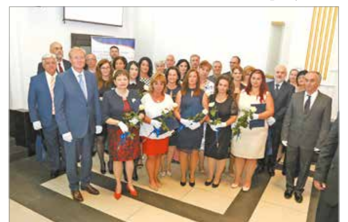
Elismeréseket is átadtak a hősöknek.

Hárman kaptak Semmelweis-díjat, főigazgatói dicséretet huszonkilencen, főigazgatói elismerést öten vehettek át, szintén öten kaptak Kiváló Egészségügyi Szakdolgozó, öten Kiváló Kórházi Dolgozó és két kollektíva Kiváló Kórházi Munkacsoport címet. Főorvosi kinevezésben hatan részesültek, adjunktusban pedig tizenketten. Répássy Olívia