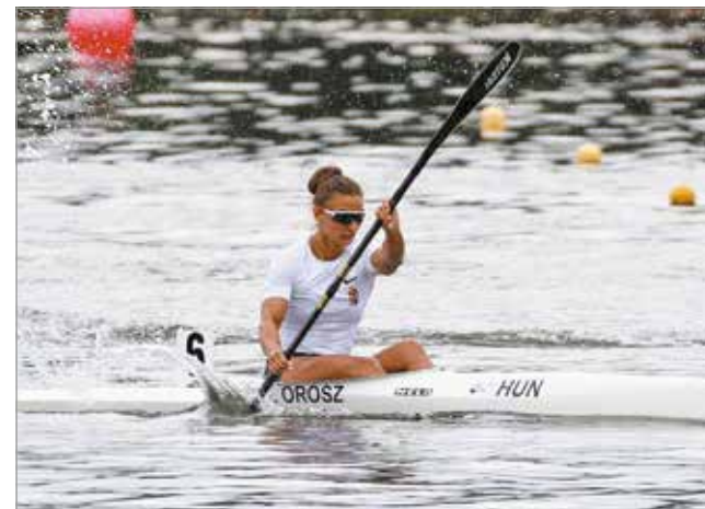
Nem engedte ki a kezéből a győzelmet.

A szakemberek szerint igazi sprinteralkatú kajakos az első Eb-címét 2017-ben szerezte Belgrádban, ahol az ifjúságiak mezőnyében nagy fölényrel győzött szintén K-1 200 méteren.