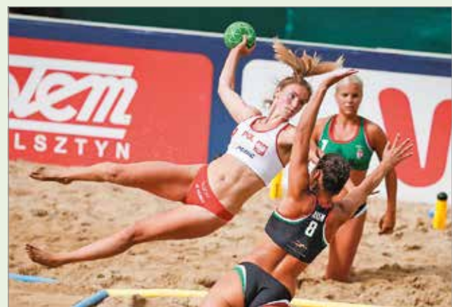
Látványos megoldásokban nem lesz hiány

A strand tájékoztatása szerint a hétvégén kedvezményesen válhatnak majd jegyet felnőttek és gyerekek egyaránt a tapolcai strandra. A bajnokság időtartama alatt az úszómedence fürdőzésre nem használható – a lelátóról viszont élvezhetjük a mérkőzéseket, és a családi medence is zavartalanul üzemel majd. Sőt szombaton már reggel 8 órakor, vasárnap pedig 9-kor nyitnak, és szombaton az este fél 8-as medencezárást követően is maradhatnak az érdeklődők, hogy végig tudják nézni a mérkőzéseket.