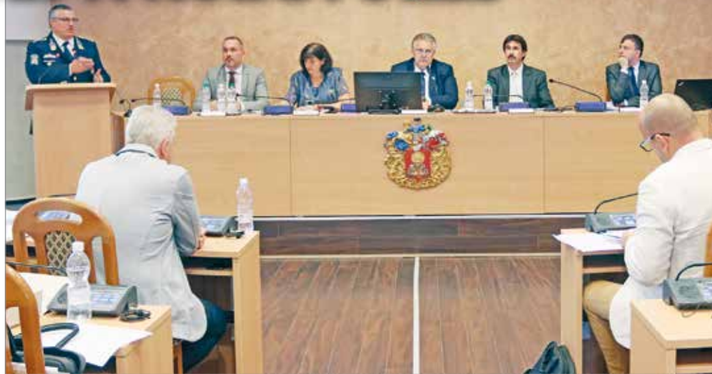
Hosszú kihagyás után üléseztek.