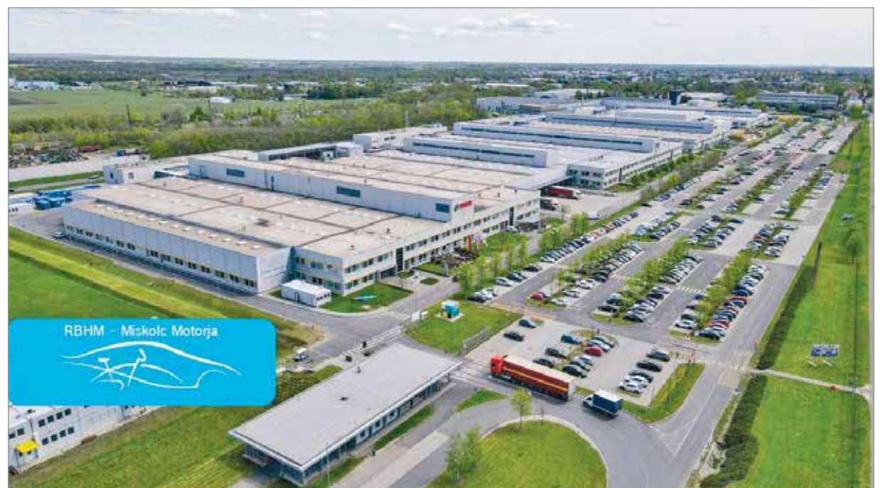
RBHM – Miskolc Motorja