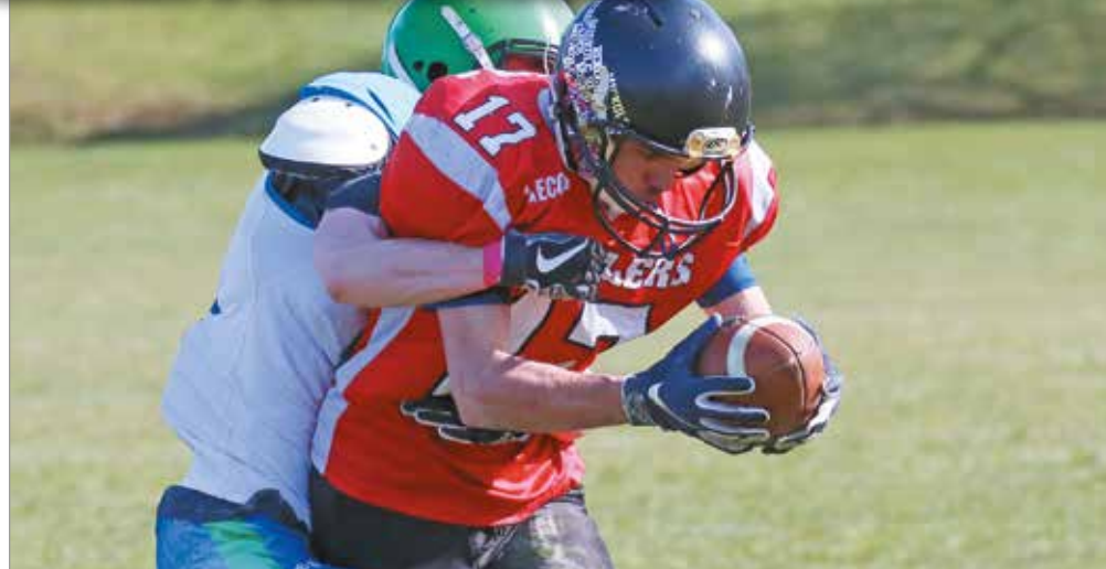
Elbírák a terhet.

A szakember korábban irányítóposzton játszott, edzőként is a passzjáték híve. – Levegőben támadunk, ilyen stratégiát alakítottam ki a szezon elején. Ehhez adott a játékoskeret is, hiszen a klasszisirányítónk (Quarterback, QB) mellett a négy elkapó és a futónk is nagyszerűen mozog, gyorsak és agilisak, ráadásul a támadófalunk is kiválóan védi a QB-t. Passzorientált csapat vagyunk, szeretjük oldalirány-