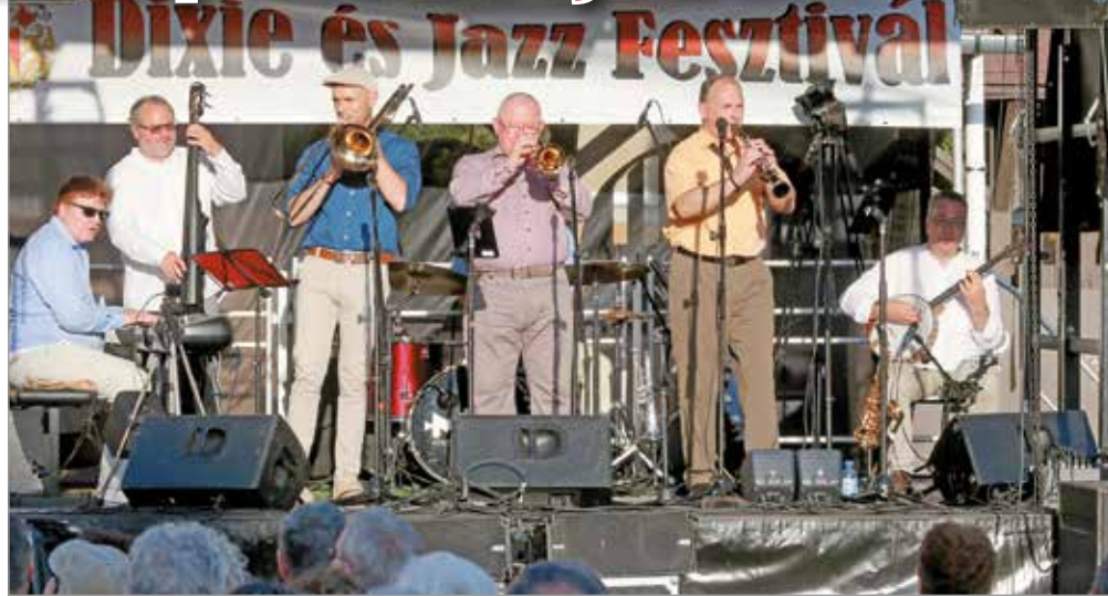
Közönséget is nevelnek.