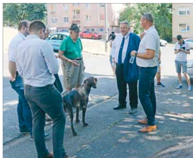
A problémák mellett jó megoldásokat is látnak.