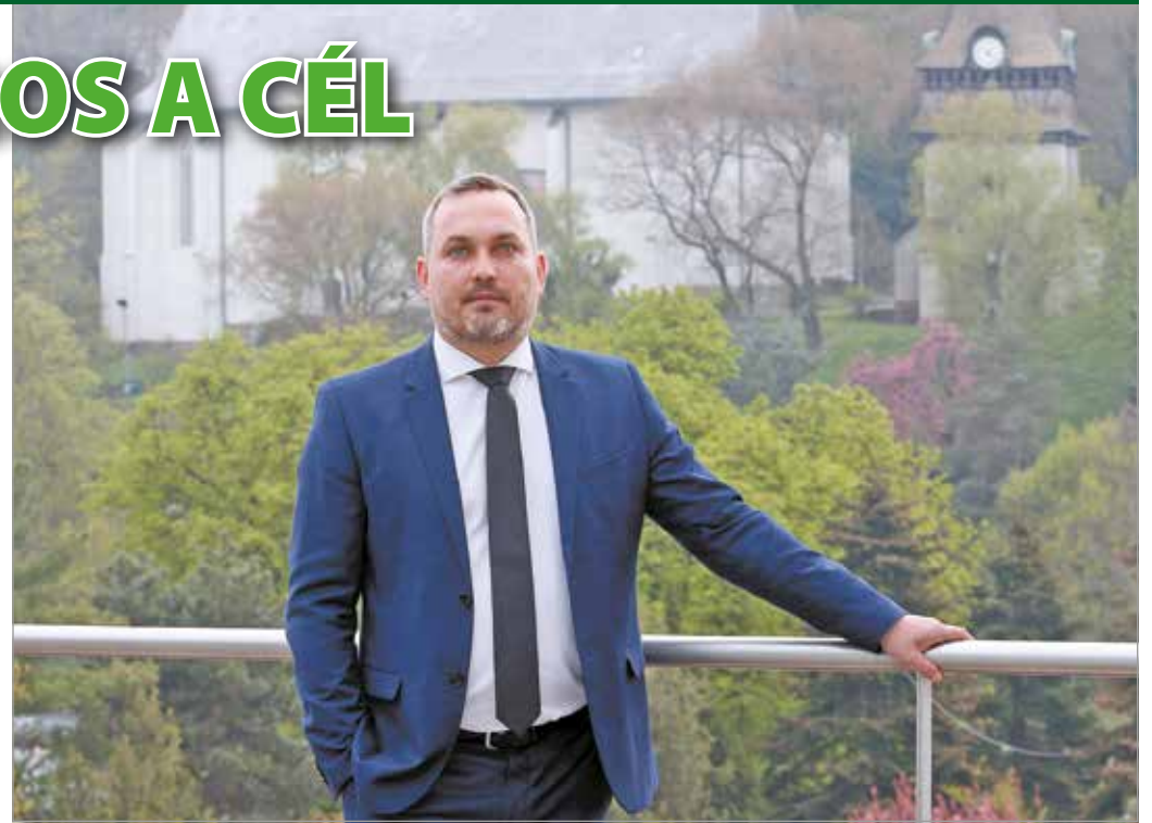
Szemléletváltásra és nyitottságra van szükség, de eltökéltek vagyunk.

– A városnak városfejlesztési szempontból is értékelnie kell egy-egy beruházási tervet, mérlegelni kell, hogy a pénzügyi megtérülés mellett milyen, a miskolciak szempontjából fontos haszna lehet egy-egy fejlesztésnek. Cél épp ezért az, hogy jól fejlett környezetet teremtsünk az ipari területeken, azért, hogy akik Miskolcon dolgozni akarnak, megfelelő munkakörülmények között, sokféle szolgáltatással körbevéve tehessék, úgy, hogy könnyen lakáshoz is juthassanak a városban. Hasonlóan ehhez, a környezetünk rendezése is olyan cél, amelyre a városnak mint fejlesztőnek figyelemmel kell lennie – az új ipari területek mellett életre keltjük az elhanyagolt rozsdaovezeteket.