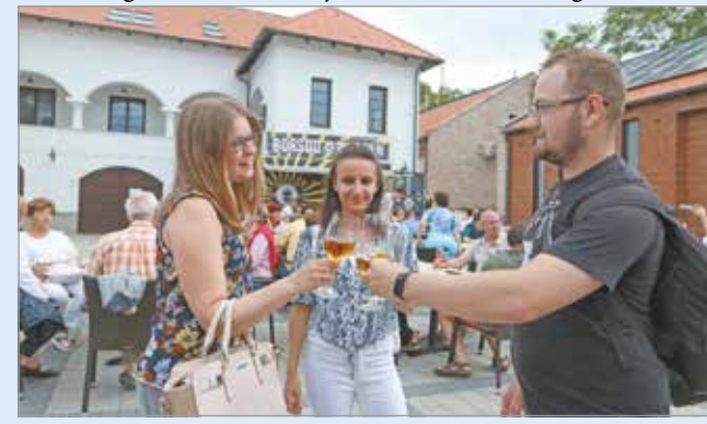
Koccanhatnak a poharak.

A rendezvény minden programja ingyenes és szabadon látogatható. A belső terekben történő fogyasztáshoz és benntartózkodáshoz az érvényben lévő járványügyi szabályozások betartása szükséges.