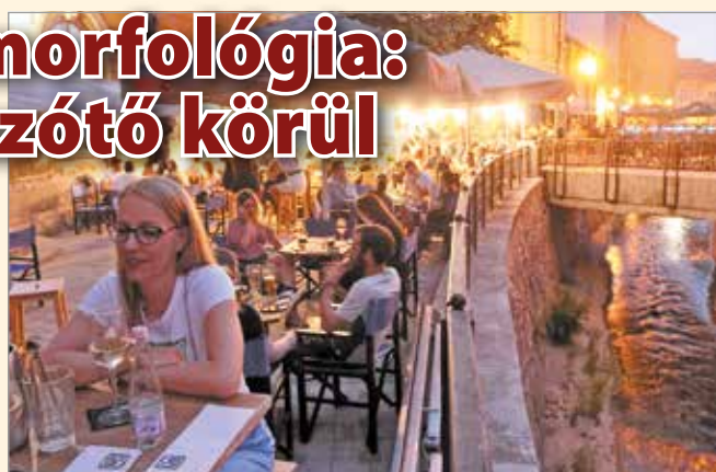
Kulturált szórakozás.

Igyekeztünk bejárni azokat a helyszíneket, amik hétfévente a belváros neuralgikus