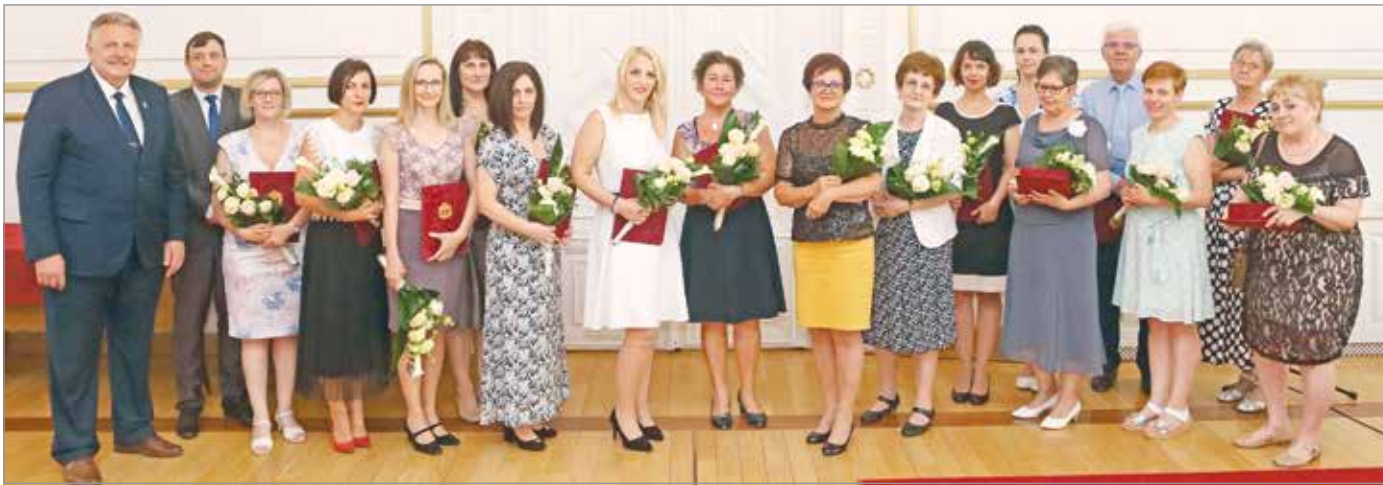
Nehéz és felelősségteljes hivatást választottak.

A miskolci polgármesteri hivatalban dolgozó köztisztviselőket köszöntötték szerdán a városházán.