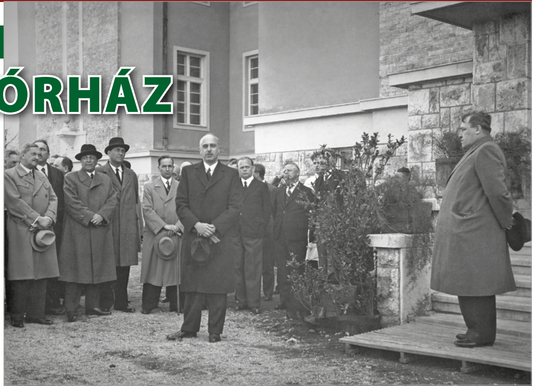
A vasgyári kórház belgyógyászati osztályának felavatása 1939-ben