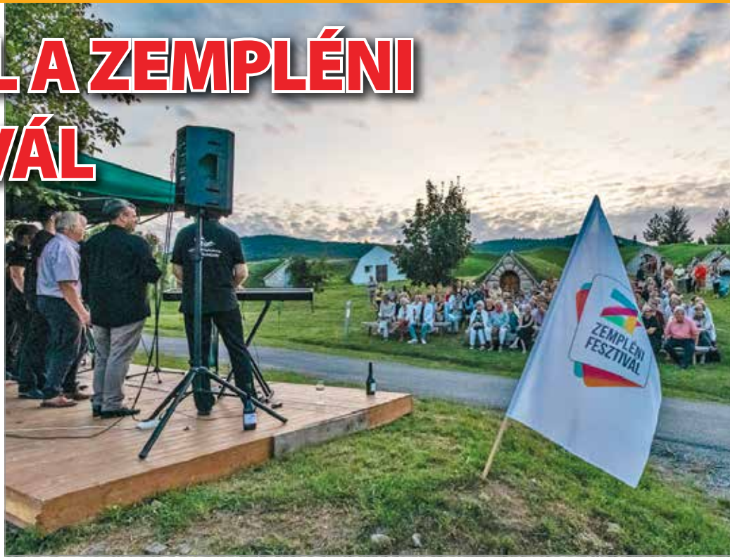
A fesztivál gyönyörű természeti környezet várja a látogatókat

Sárospatak mellett Sátoraljaújhely, Szerencs és Tokaj, továbbá egy tucat más zempléni település szabadterei helyszínei