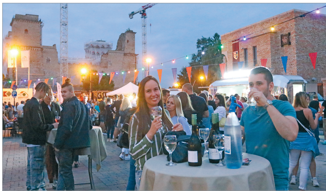
Rendkívüli népszerűségnek örvendett július első szombatján a GasztroPLACC.

A népszerű gasztroesemény idén három alkalommal várja az érdeklődőket a Lovagi Tornák Tere előtti vásártéren, a július 3-ai volt az első. Street food alkotások, finomabbnál finomabb borok, zene és kiváló hangulat – így várta a gasztronómia szerelmeit július első szombatján a GasztroPlacc Extra. Az esemény továbbra is nagy népszerűségnek örvend, a Lovagi Tornák Tere előtti tér rövid idő alatt megtelt a járvány miatti lezárásokat feledni és végre szórakozni vágyó, jókedvű emberekkel. A finom falatokat ezúttal az Anyukám Mondta Étterem, a Végállomás bistro&wine, a Vendéglő a Pisztrángoshoz vagy a DZ Burgers, a csodás nedűket pedig a Gally Kézműves Pince, Csáter Apó Pincéje, a Palmetta Pincészet és a Palkó Borok szállította. A jó hangulatról most is a GasztroPLACC rezidens dj-je, LuiBig gondoskodott. Az ízek szerelmeit legközelebb július