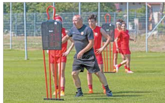
A régi DVTK szellemiségéhez nyúlna vissza Bém Gábor.

A jövő héttől napi két edzéssel készülnek majd a lányok, utána pedig következnek a felkészülési mérkőzések. A bajnokság az augusztus 14-ei hétfőig indul.