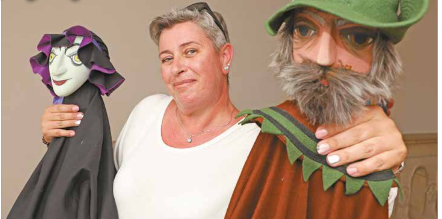
„Félig gyerekként bekerülni a nagy művészek világába maga volt a csoda.”

– Indult akkoriban egy tanfolyam is a Budapest Bábszínház közreműködésével. Itt megtanultunk mindent: bábmozgatás, színészmesterség, művészettörténet, gyermekpszichológia, bábtörténet, árnyjáték, marionett, kesztyűs bábok és még sok más dolog szerepelt a tananyagban. 1996-ban ért véget a tanfolyam, ekkorra a következő végzettséget