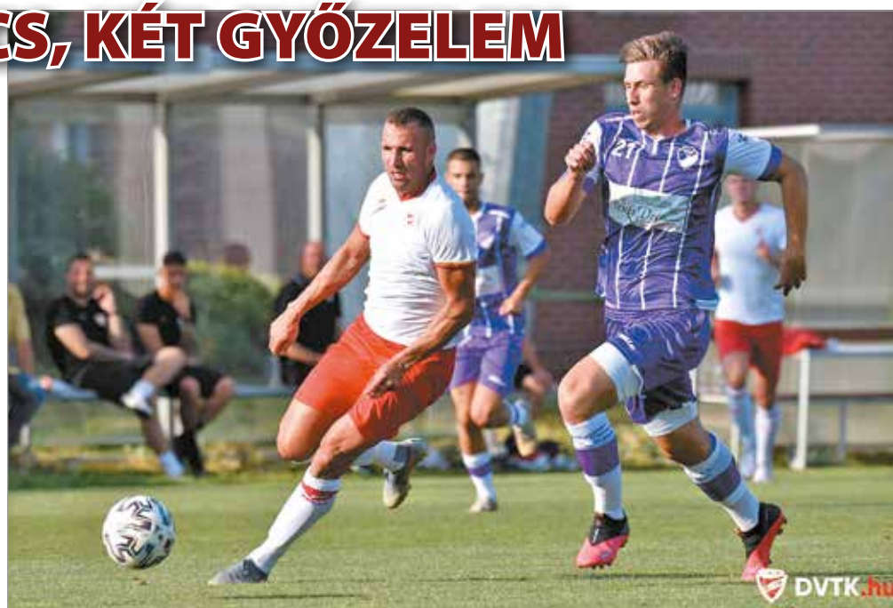
Könyvesre nagy szükség lesz a bajnokságban.

Kondás Elemér elsősorban a játékot tartja ilyenkor szem előtt,