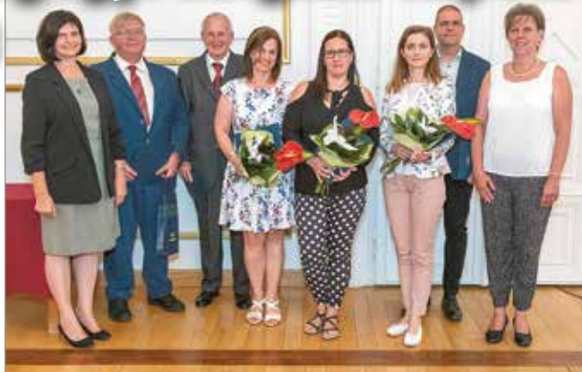
Az egészségügyi dolgozók kiemelten fontos feladatot látnak el

A tavalyi év rendhagyónak számított sok szempontból, az egészségügyi dolgozók számára ez az időszak azonban olyan volt, mint egy 365 napig nyújtott második műszak. Az idei Semmelweis-napon – az oklevelek kiosztása mellett – ezt a munkát is megköszönte a város.