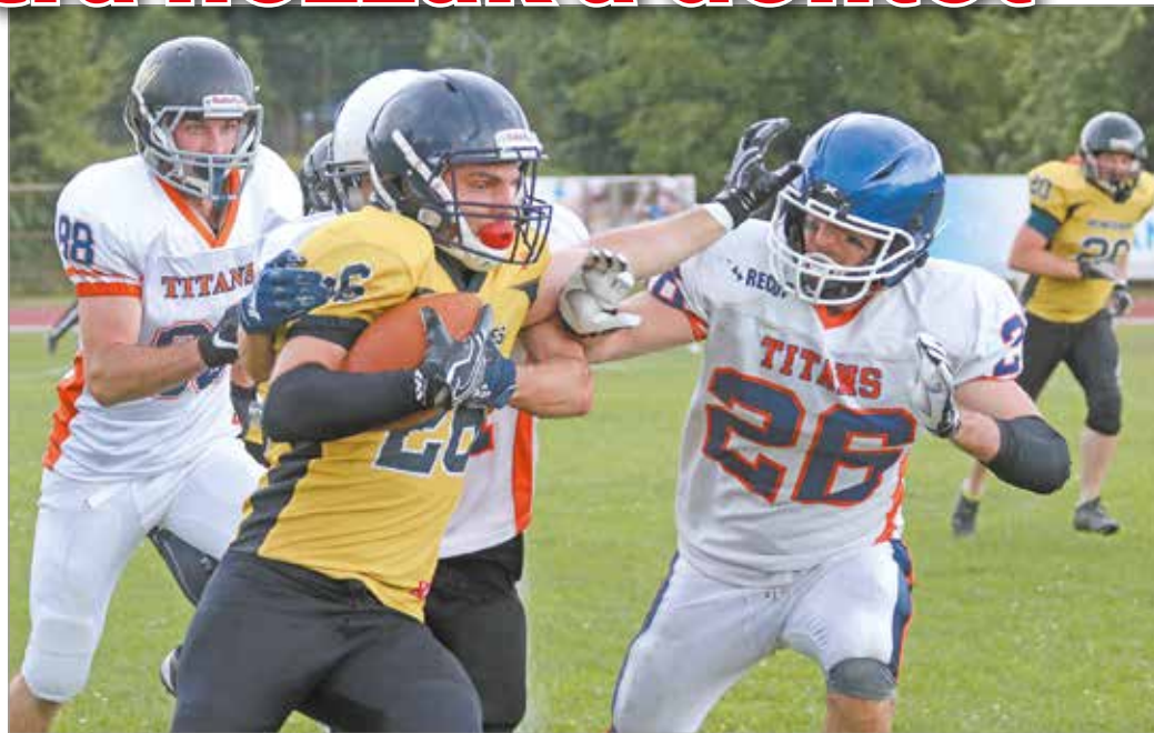
A Titánok védelmét is feltörték.