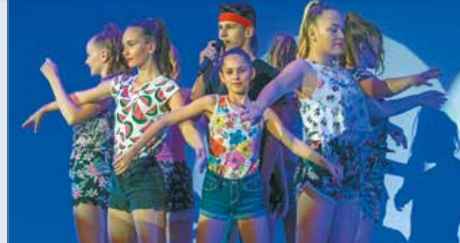
Legutóbb 2019 októberében tartották Musical és Miskolc gálát.

A Zenita Alapítvány művészeti vezetője elmondta, borsodi származású fellépők és tisztelt miskolciak együtt állnak színpadra olyan fiatal tehetségekkel, akik tavaly például a Hangok varázsa tehetségkutatón elnyerték a fellépési lehetőséget. – A koncert előtt, délután egy úgynevezett hálagálát is tart a Zenita Alapítvány, azért, hogy megköszönjük az egészségügyi dolgozók járványhelyzet idején végzett munkáját – mondta Cselepek Balázs.