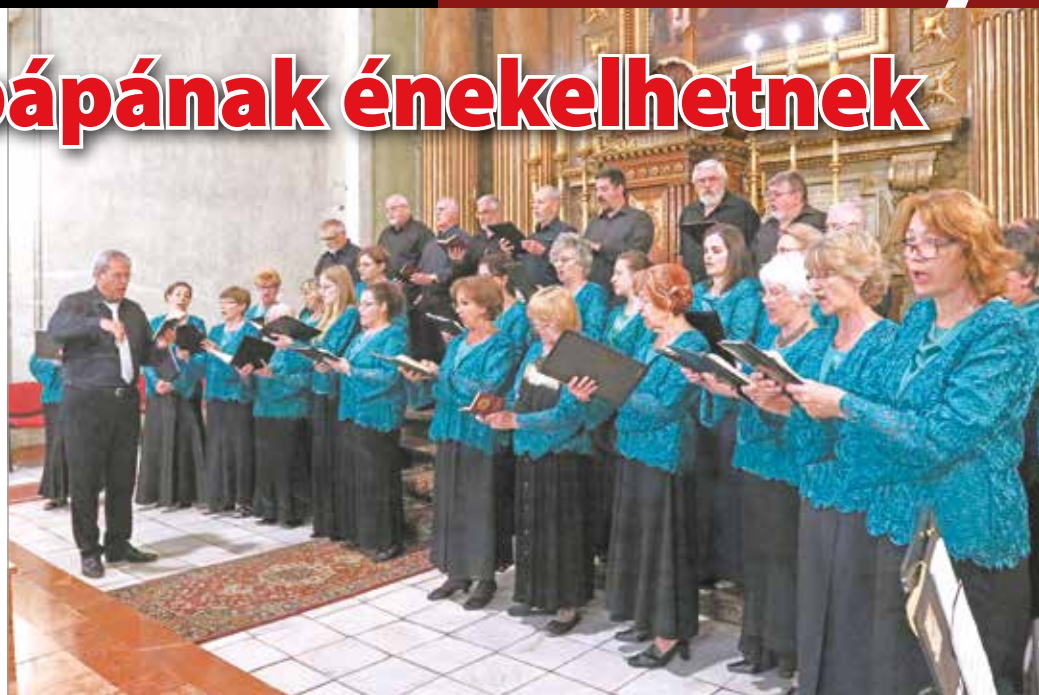
A miskolci Cardinal Mindszenty kórus is fellépett a Szürkebarát koncerten.