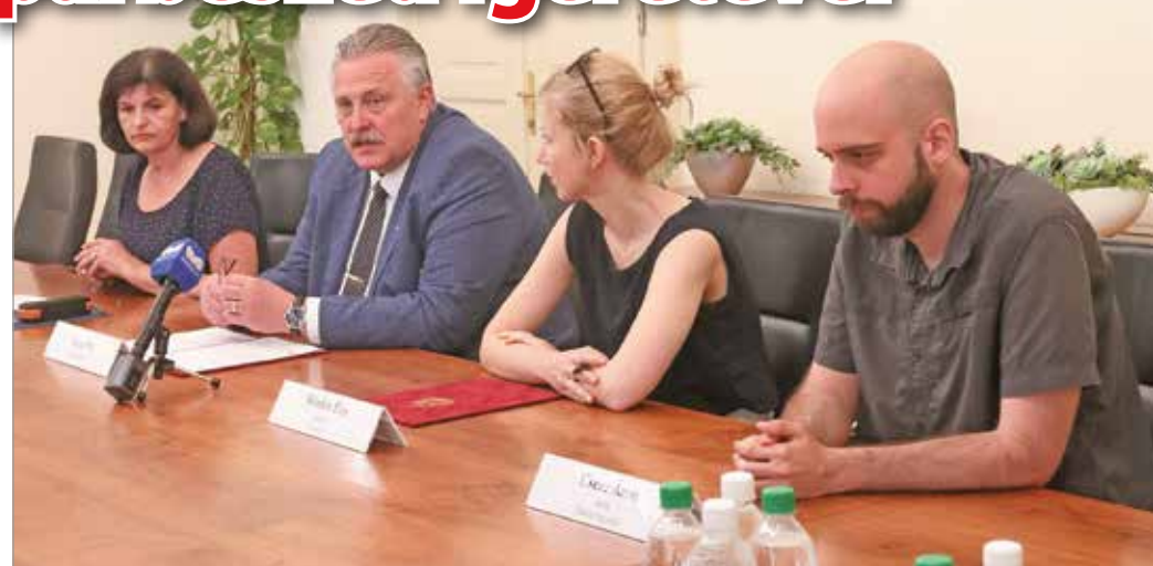
Az együttműködésről szóló megállapodást a közleményben írták alá a felek.

A közösségi gyűlés megszervezését azzal indokolta az igazgató, hogy hazánkban válságba került a demokrácia, egymással