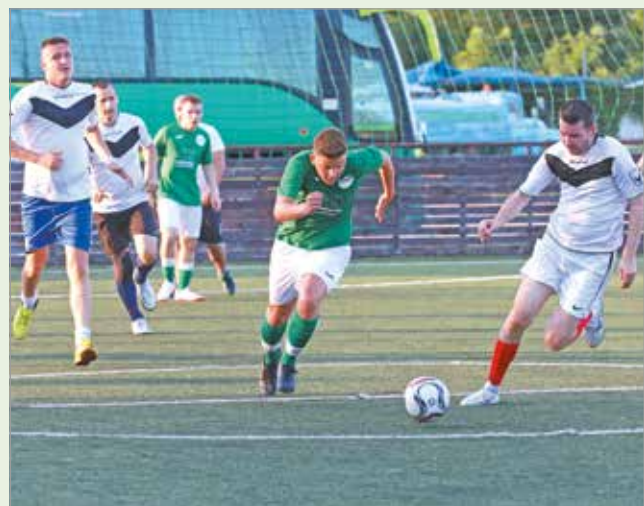
Több mint ezren rúgják a bőrt városszerte.

Ferenc Tibor hozzátette, a fiatalabbak három, míg az Old Boys két osztályban méri össze tudását. A bajnokok feljebb kerülnek egy osztályba, míg az utolsók kiesnek az alsóbb szintre.