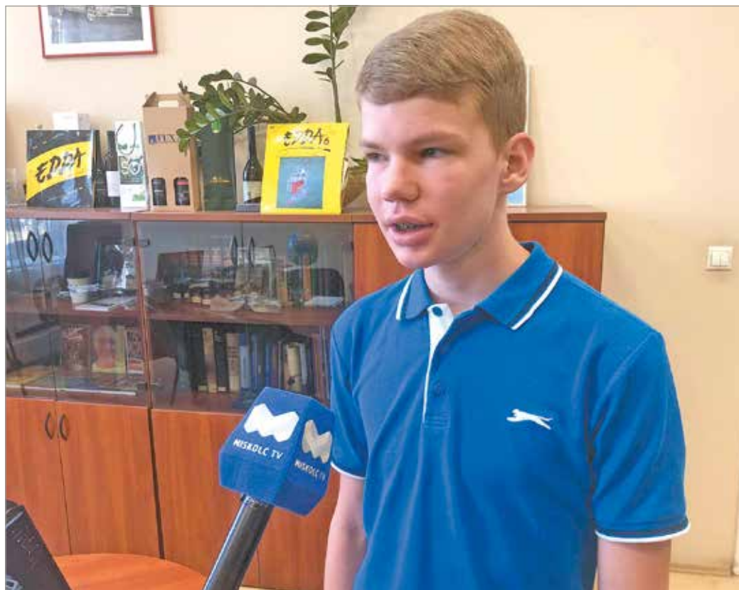
A legó iránti szeretete egészen kisgyerekkora óta megvan

A Lego Ideas olyan kezdeményezés, amelyben az érdeklődőknek is lehetőségük van beküldeni saját kockákból megépített ötletüket, így esélyt kapnak arra, hogy a játék tervezőivel életre keltsék azt. A csocsóasztal ötletét még februárban töltötték fel az Ideas weboldalára. Az új készletet Dániában a napokban jelentették be.