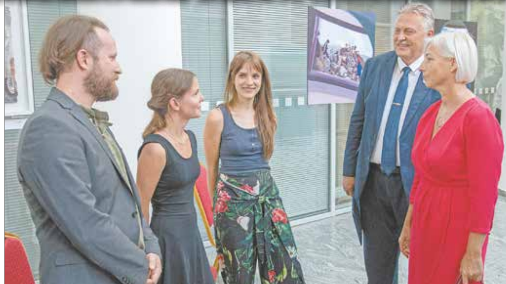
A kiállítást csütörtökön nyitották meg a városháza aulájában.

Veres Pál , Miskolc polgármestere megnyitóbeszédében elmondta, a művészet arra válogat, hogy egy-egy esemény kapcsán gondolatokat, üzeneteket közvetítsen a befogadó nézők, hallgatók felé. – Fontos, hogy az ilyen kiállításokon megismerheti a közönség a kortárs művészek gondolatait és látásmódját. Nagy megtiszteltetésnek tartom, hogy vidéki vá-