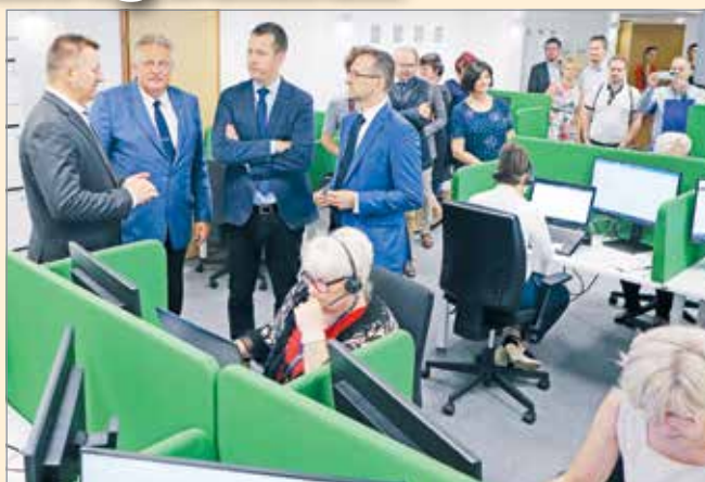
A Prohuman callcenterét hétfőn adták át.

A megváltozott munkaképességű dolgozók foglalkoztatásával a munkaerőpiac rejtett tartalékait lehet kiaknázni. Ennek az elvnek a jegyében nyitotta meg a dolgozók igényeihez alakított callcenterét hétfőn Miskolcon a Prohuman Magyarország.