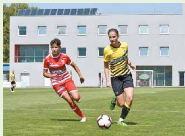
Behúzták a piros-fehérek a három pontot.

Szombaton, 16 órától Felcsúton, a Pancho Arénában a Puskás Akadémia vendége lesz a DVTK a Simple Liga 2. fordulójában.