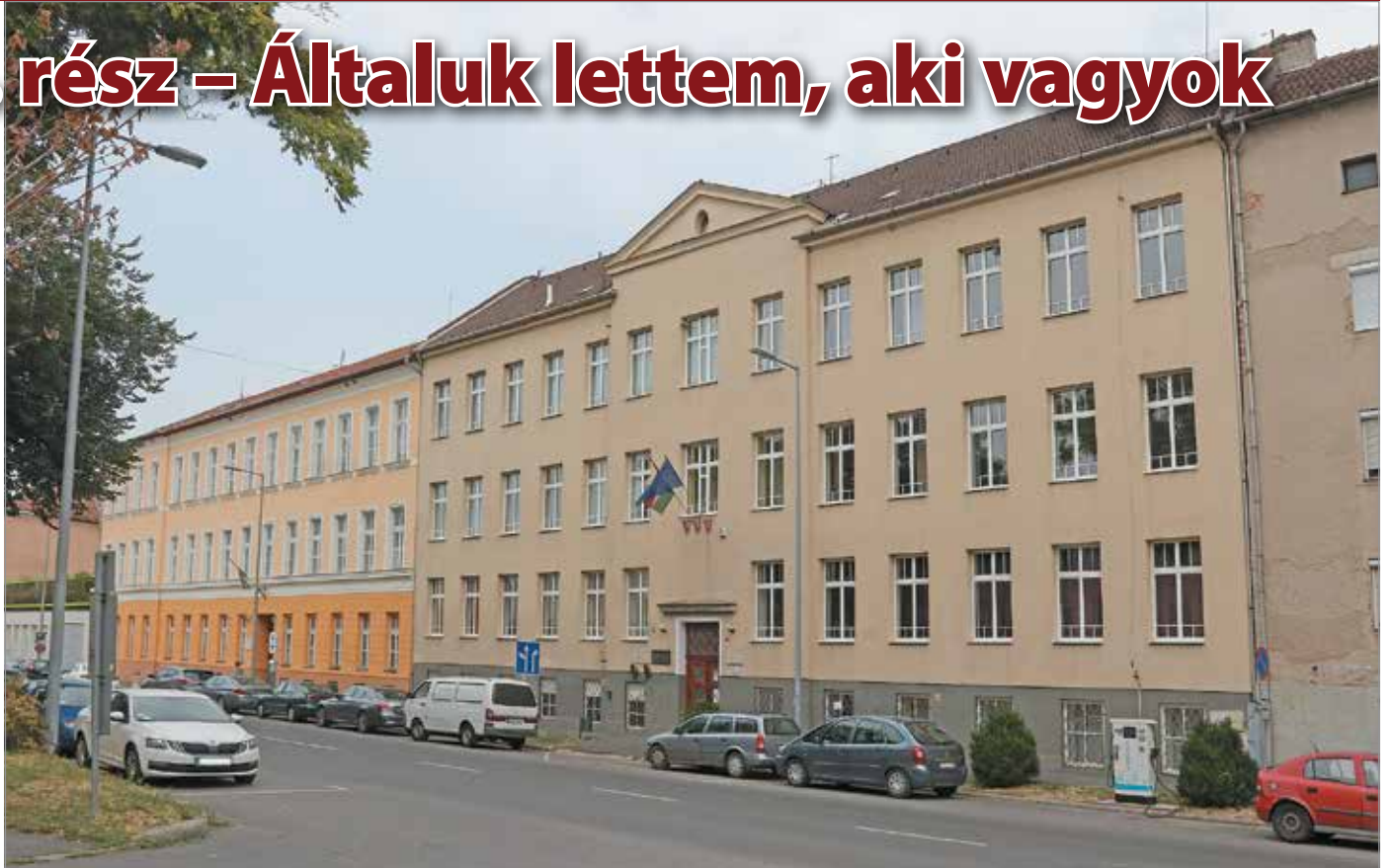
A Kossuth Lajos Evangélikus Óvoda, Általános Iskola, Gimnázium homlokzata napjainkban.

Nagyon szerettem német nyelvtanáromat, Sír Lászlót , aki órákon nagyon szigorú volt, azon kívül pedig „majd-