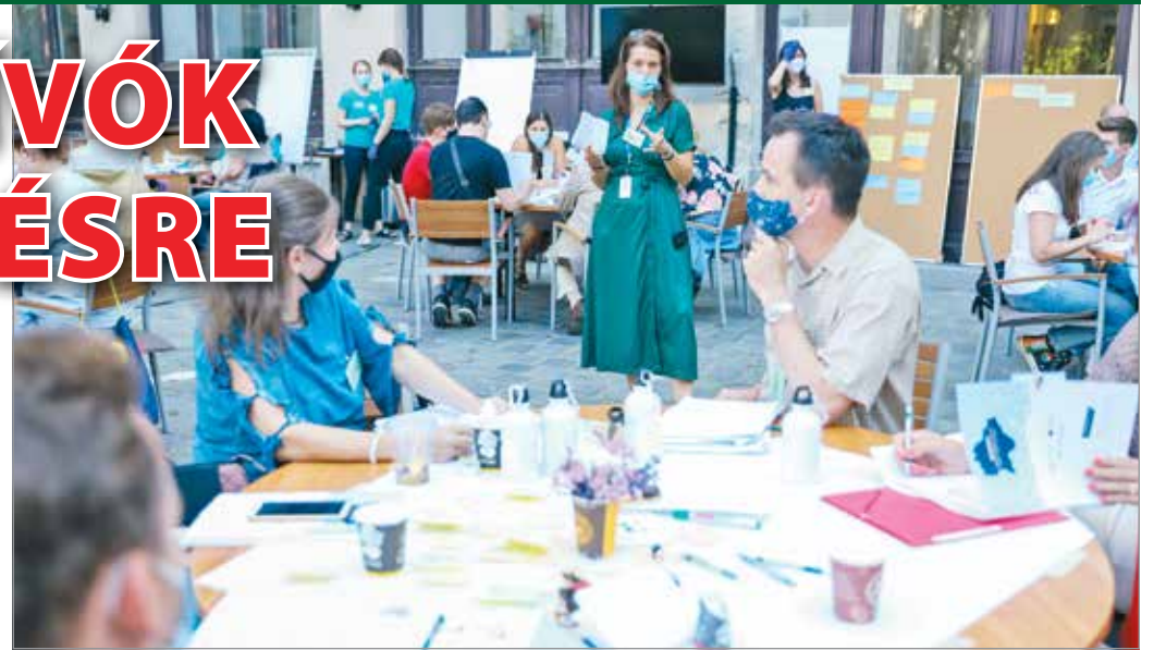
Közösségi gyűlés Budapesten, 2020 nyarán.

a miskolciak is! Legyen végre egy fontos ügy, amiben idejében kikérjük a véleményünket! A városlakók erre irányuló vágyát felkarolva állt az önkormányzat vezetése a kezdeményez mellé. A miskolci Közösségi Gyűlést szeptember 18-19-ére, illetve október 2-3-ára hirdetjük meg. Természetes, hogy „mindenki” nem lehet jelen rajta – százhatvan ezer ember semmilyen gyűlés-terembe nem férne be. Nem is lehetne ekkora tömeget kellően tájékoztatni, nem is lehetne köztük szabad és érdemi párbeszédet indítani, és nem is