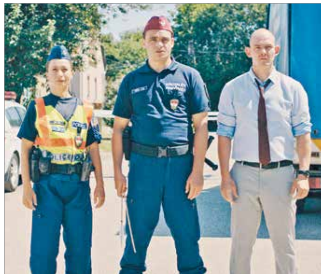
A Kilakoltatás című dramedy világpremierként érkezik a fesztiválra

való alkat, erőszakos természete miatt állandó harcban áll a környezetével. Sötét múltja és egy családi titok miatt kerüli a lányával való találkozást, de Nikit nehezebb lerázni, mint gondolta. A két kívülálló lassan közeledni kezd egymáshoz, de minden az ellen szól, hogy a család egyesülhessen.