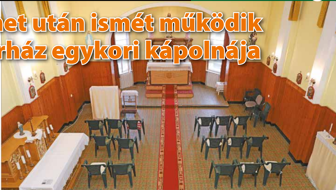
A kis kápolnát az elmúlt években a hívek rendezték be újra.

Ezzel egy időben a kápolnában megszüntették a szentmisét, az oltárt, a szobrokat, a padosorokat, a harmóniumot és a többi berendezési tárgyat