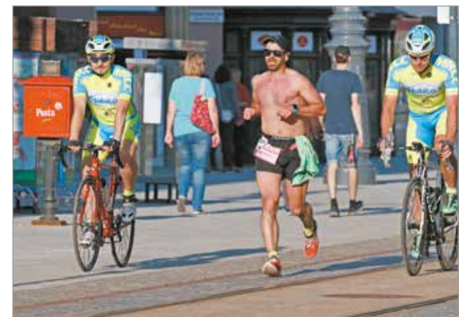
Legutóbb 2019 májusában rendezték meg az ultramaraton

A verseny technikai részleteivel kapcsolatban megosztotta, hogy szlovák és magyar nevezők mellett cseh, illetve lengyel versenyzők is regisztráltak. A legutóbbi verseny 2019-ben Kassáról indult és Miskolcon végződött, ezúttal megcserélődnek a rajt-cél szerepek. Maga az útvonal további 9 helyszínt érint: Sajóvamos; Szikszó; Hernádkércs; Abaújszántó; Vizsoly; Gönc; Kéked; Nyirna Mysla, Siroka; Kassa, Gollanova. A szervező ezúton is köszönetét fejezte ki a településeknek, hogy frissítőpontként csatlakoztak az eseményhez.