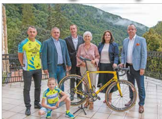
A 2021-es ünnepi program részleteit sajtótájékoztatón ismertették a szervezők.