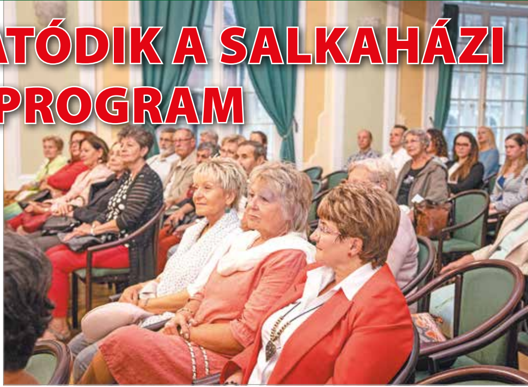
Kellemes kikapcsolódást ígér a Miskolci Kamarazenei Nyár is.

Az elmúlt egy-másfél évben a világiárvány miatti szigorítások nehezítették a Salkaházi programok megrendezését is, de amint a városnak lehetősége nyílt, újra rendezvényekkel kedveskedett az időseknek. Ilyen például a Dr. Hilscher Rezső Szociális Közalapítvány által szervezett Szépkorúak Filmklubja, ami júliusban indult el, és egészen novemberig várja a filmkedvelő nyugdíjasokat minden hónap utolsó hétféjéig. A rendezvénynek a Művészetek Háza Uránia Art moziterme ad otthont. A soron következő vetítések augusztus