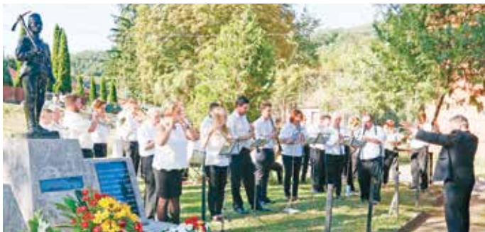
Szeptember 4-én tartják a bányásznap megemlékezést

Miskolc város csökkenő bevételeinek ellensúlyozása és növekvő kiadásainak csökkentése érdekében a bevétellel nem fedezett, indokolt költségeket az MVK Zrt. úgy kívánta mérsékelni, hogy többször módosított menetrendet, és a járványügyi intézkedésekkel és korlátozásokkal arányos intézkedéseket vezetett be. Ezen intézkedések mellett is azonban 2021 folyamán további 700 millió forint bevétel nem fedezett, indokolt költsége keletkezik, amelynek megtérítése a vonatkozó törvényi előírások alapján az önkormányzat feladatát képezi. Tekintettel arra, hogy az önkormányzat erre saját erőből nem képes, ezért a hiányzó összeget, támogatás formájában a kormánytól várja.