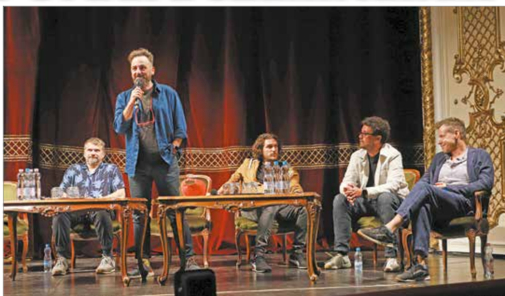
Egy kéthetes „nyári szünet” után nyitották meg az új évadot kedden.

– Reméljük, nem kell bezárni a művészeti intézményeinket, így a színházat sem az őszi folyamán. A hétvégén lesz Borangolás is, és ennek kapcsán eszembe jutott a híres mondat: „az nem is miskolci polgár, akinek nincsen pincéje az Avason”. Úgy vélem, ez mára megfordult: nincsen olyan miskolci polgár, akinek legalább egy meghatározó élménye ne lenne a Miskolci Nemzeti Színházzal.