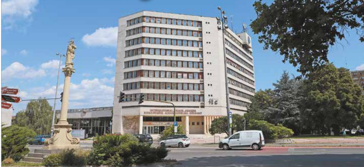
A mérnökök álláspontja szerint az ITC szerkezetével semmi olyan probléma nem lehet, ami a bontást indokolná.

Volt, aki szerint Dósa Károly 1977-es épülete jelentős építészeti értékkel bír. Kiemelték, funkcionális épületről van szó, ami szerkezetileg kiváló, könnyen átépíthető. Egy felszólaló megjegyezte, a belső tér az alsó előadóteremmel, illetve a galériával a mai napig esztétikai értéket képvisel. Akadt, aki határozottan úgy vélte, egy olyan nagyvárosias léptékű épületnek, mint az ITC, van helye Miskolc központjában. Hozzátette, a székházhoz hasonló, 500 fő befogadására alkalmas rendezvényközpontja nincsen jelenleg Miskolcban. A mérnökök véleménye szerint nincs akadálya a funkcióváltásnak, mert az irodából lakóépületté, vagy rendezvényközponttá tör-