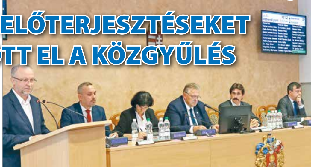
Az önkormányzati lakásrendszer reformját az előző közgyűlésen nem sikerült „átvinni”, most újratárgyalták a képviselők.

Első napirendi pontként máris az egyik legfontosabb rendelettervezet került terítékre: az önkormányzati lakásrendszer reformját az előző közgyűlésen nem sikerült „átvinni”, most újratárgyalták a képviselők. A többség támogatta (a Fidesz-KDNP nemmel szavazott), így szeptember második felétől új, speciális pályázati formákkal indulhatnak a lakáspályázatok. Az új szabályozásnak köszönhetően – a már megszokott piaci és költségvetési pályázatok mellett – külön pályázhatnak a fiatalok és a nyugdíjasok. A város vezetése elkötelezett a magasan kvalifikált, szakképzett fiatalok támogatásában, és az elvándorlás megállításában jelentős tényező lehet a megfizethető lakhatás biztosítása. Szakemberekkel kidolgoztak egy részletes értékelési szempontrendszer is, ami objektív mutatók segítségével segít kiválasztani a megfelelő bérlet. Szintén rendelkezik a rendelettervezet az óvadéki díjról: csak az új bérletknek kellene egy összegben befizetniük a hathavi kauciót. Heves vita alakult ki az előterjesztés kapcsán: a Velünk a Város képviselői modellértéki