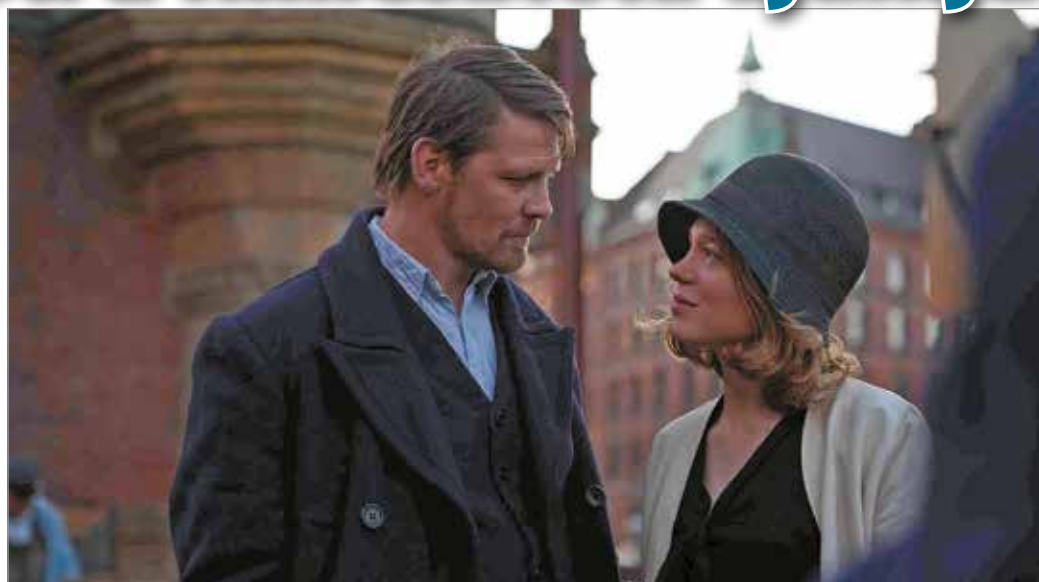
A feleségem története – kötelező darab a filmesztéta szerint is