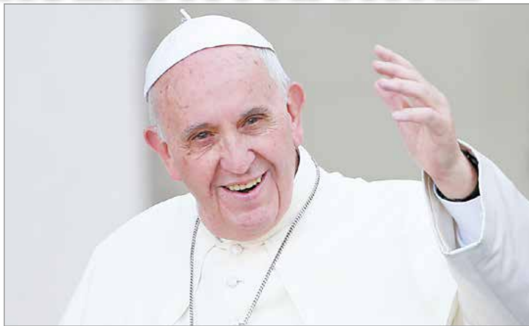
Ferenc pápa erősíteni jön az Istennel és az egyházzal való kapcsolatot

A kongresszust háromévente rendezik meg, tavaly lett volna, de a pandémia közbeszólt. Mikolai Vince elmondta, idén is sokan maradnak otthon emiatt. – A legtöbb plébánia szervezett csoportokat a felutazásra, a diósgyőri is. Pénteken két busz is útnak indult fiatalokkal, mi szombaton megyünk Budapestre, hogy Erdő Péter bíboros szentmiséjét hallgassuk meg, vasárnap pedig újabb zarándokok kelnek útra, hogy megnézhessék magát a pápát a Hősök terén, erre jelentkeztek a legtöbben. Összesen mintegy három-negy-