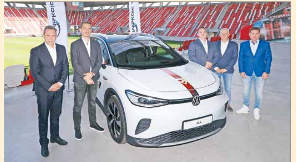
Egymást támogatva érik el sikereiket.

– Régóta hangsúlyozzuk, hogy a DVTK csak régiós összefogással lehet igazán sikeres – emelte ki.