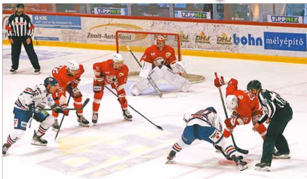
Izelítőt kaptak abból, mi vár rájuk a szezonban.

– Szeretnénk volna, ha a remek, Fehérvár elleni találkozó után ugyanazzal a tempóval kezdjük a meccset, de nem találtuk a ritmust. Rávilágított a gyenge pontokra a találkozó. A folyamatos, a folyamatos jóra törekvés lesz az út, amit szeretnénk bejárni az egész szezonban. Továbbá a lehető legkisebb kilengéseket kell produkálnunk teljesítményben és energiaszintben. Most a srácok kaptak egy kis izelítőt abból, hogy fog ez történni majd a szezon folyamán a szerda-szombat ritmusban, ebből próbálunk megépítkezni. Jó a munkamorál, az öltözői hangulat, játékban van némi elmaradásunk,