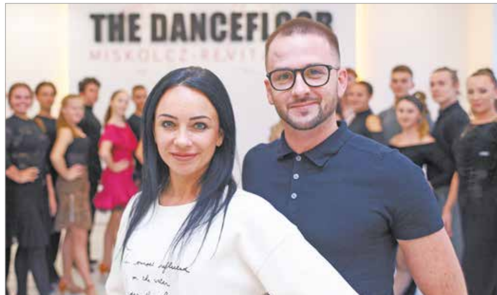
Ahol minden a táncról szól.

A díjazottak alkotásain kívül számos további művész munkáját állították ki, melyeket az érdeklődők szeptember 24-éig tekinthetnek meg. Bódogh Dávid