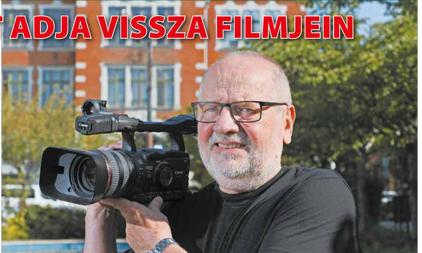
A Nagy az én családom – Földes című film megalkotója is családtagnak érzi magát.

1991-től a Miskolc TV-nél műszaki igazgató volt, főmunkatárs, reklám- és dokumentumstúdió-vezető, szerkesztő, operatőr, de produceri munkát is végzett. Ő költöztette le a televíziót az Avasról a belvárosba, ahol már nem heti egy