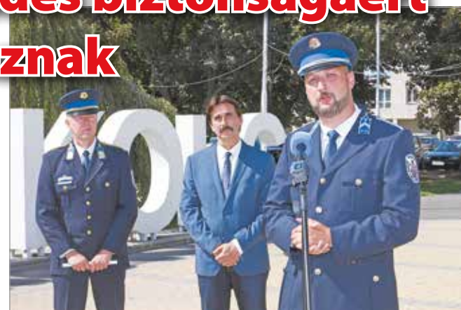
Az esemény részleteit szerdán sajtótájékoztatón ismertették.

Közlekedési bemutatókkal, családi programokkal és koncertekkel várja az érdeklődőket a Széchenyi utcán szeptember 18-án a megyei rendőr-főkapitányság.