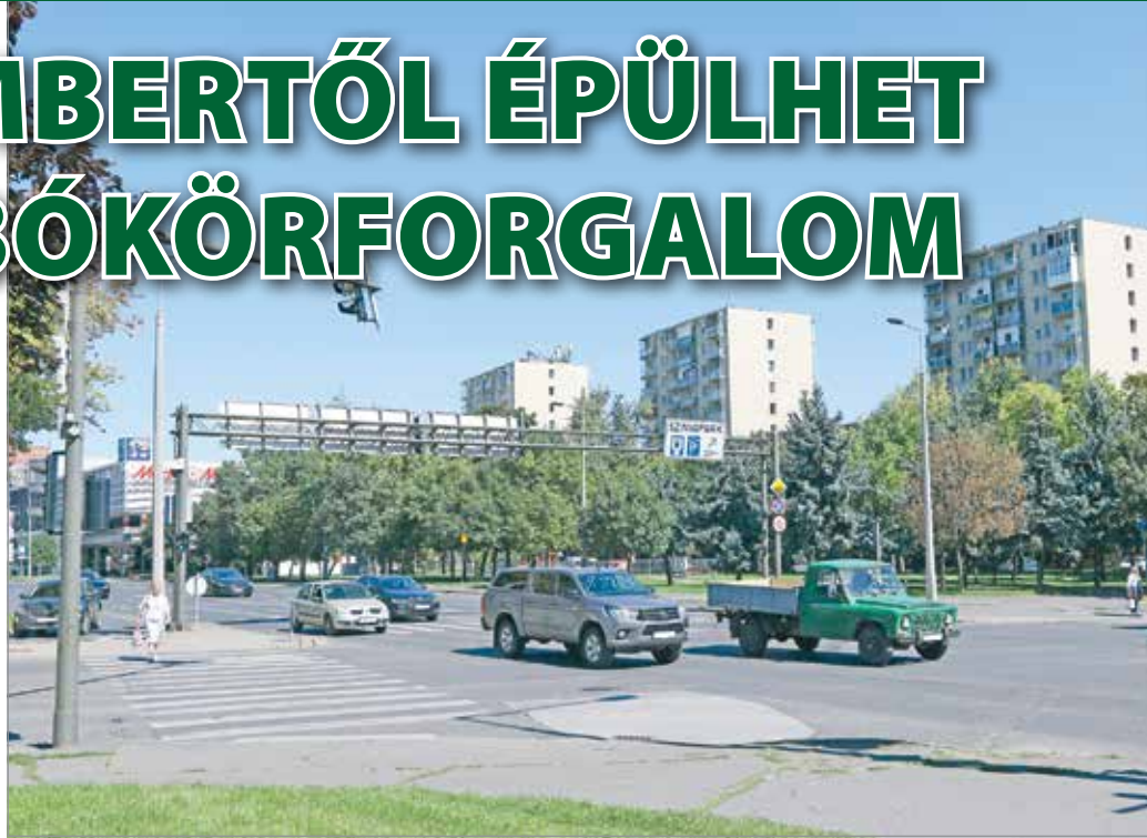
Háromsávos, jelzőlámpával szabályozott turbó rendszerű körforgalom épül a kereszteződésben.

A beruházást koordináló Nemzeti Infrastruktúra Fejlesztő Zrt. (NIF) kérdéseinkre elmondta: a tényleges útépitési munkák csak novemberben kezdődnek, a közműkiváltásokat viszont már szeptember második felében megkezdik. Emiatt a Vörösmarty utca Király utca – Soltész Nagy Kálmán utca