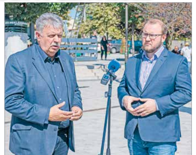
Kiemelt feladat a közbiztonság fejlesztése.

A rendészeti bizottság elnöke fontos tényezőként jelölte meg az önkormányzatot sújtó folyamatos központi elvonásokat, illetve azt, hogy a kormányzat érdemben nem foglalkozik a miskolci közbiztonság kérdésével. Elmondása szerint a városnak mindezen fejlesztéseket egy-