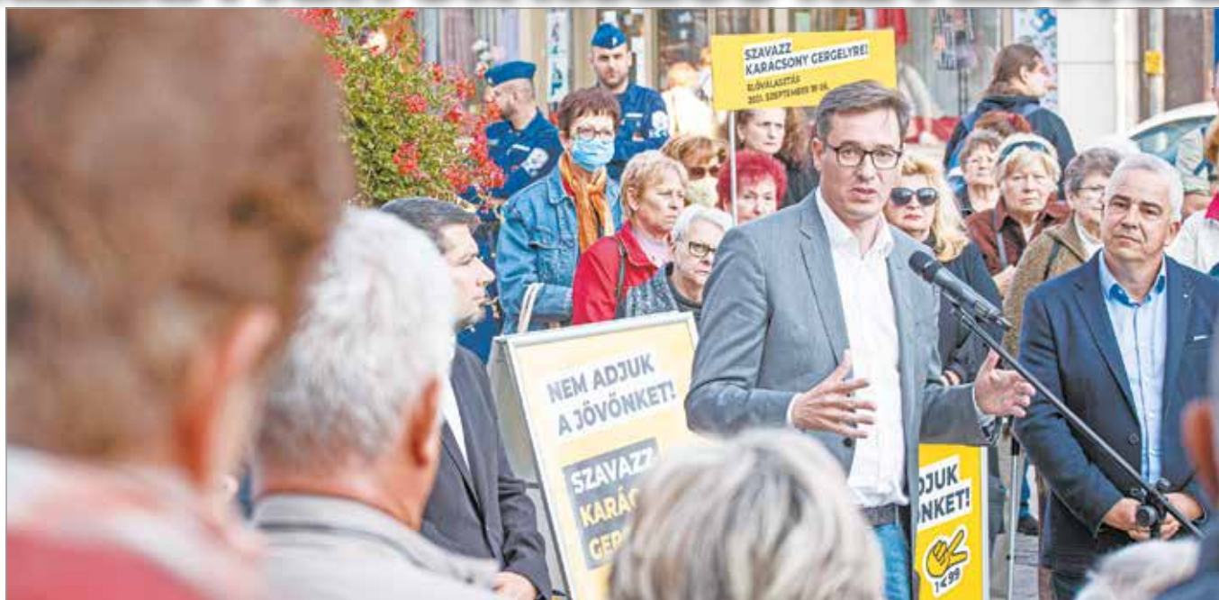
„Vissza szeretnénk adni a demokrácia eredeti értelmét”.