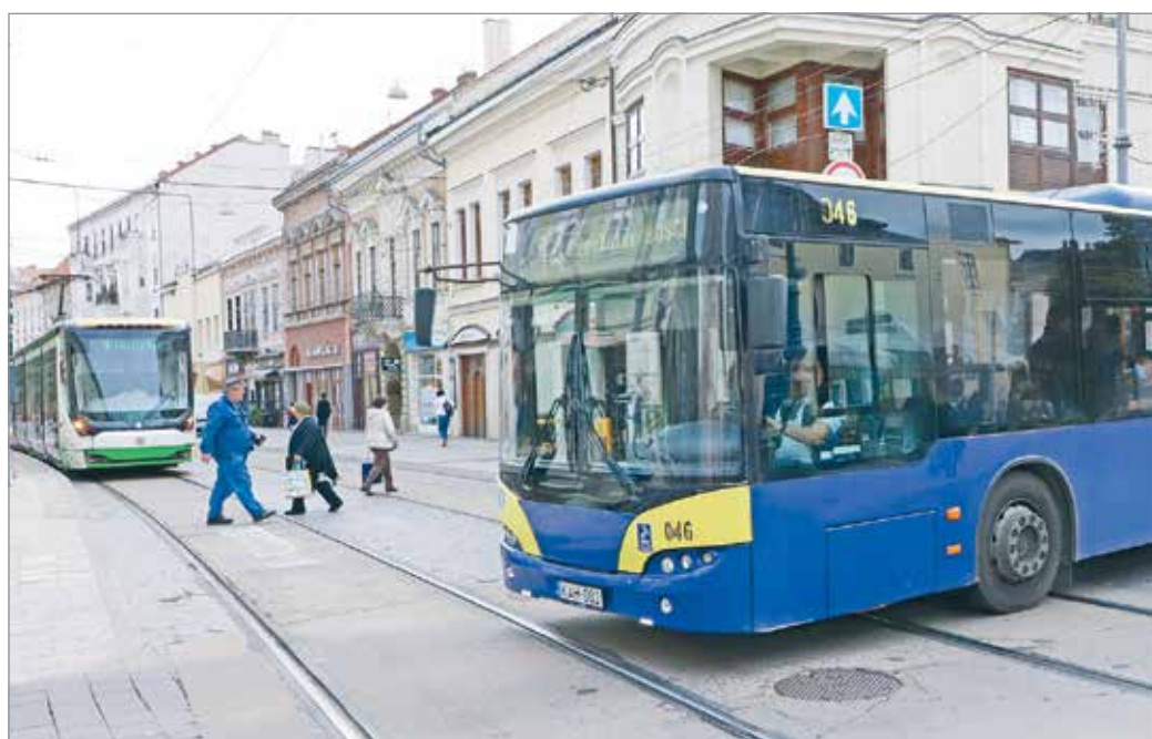
Csökkenő bevételek, növekvő költségek nehezítik az MVK működését.

– A világvárvány és a korlátozó intézkedések miatt 2020-ban 900, 2021-ben 550 millió forint bevételkiesés keletkezett Miskolcon. A veszélyhelyzet kapcsán bizonyos utasok számára biztosított ingyenes utazási kedvezmények állami ellentételezése nem történt meg, az MVK esetében Miskolcon ez meghaladja az ötezer főt, ami