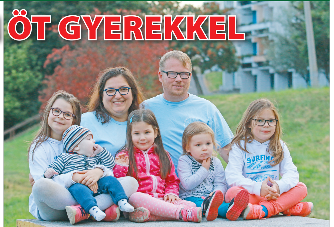
„A nagy család szép, a nagy család jó”

– A gyerekek egymás ruháit megöröklék, sőt, már kéri is. Üzemanyagköltségben számolva egy vagy öt gyermeket ugyanannyiba kerül elvinni az iskolába. Minél nagyobb a család, annál alacsonyabb a fajlagos költség. Ha több testvér jár egy sportegyesülethez, a másodikra, harmadikra már kedvezményt kap a szülő. Ugyancsak olcsóbb az intézményi étkezésük és a be-