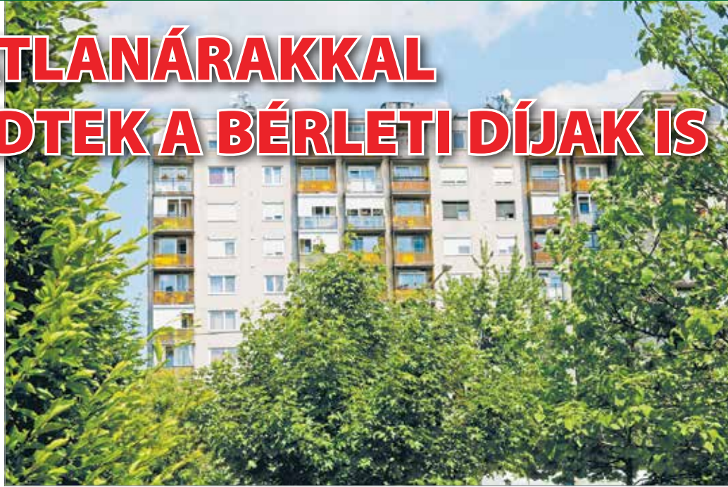
A piaci ár töredékéért lehet önkormányzati lakáshoz jutni.

– Jelenleg, aki 50-60 négyzetméteres lakást tervez vásárolni, és nem feltétlenül a belvárosban, az 280-350 ezer forintos négyzetméterár között tudja ezt megtenni. Hangsúlyozom viszont, hogy ez állapot- és környékfüggő. A fentiek szerint 15 400 000 – 19 250 000 forintba kerül átlagosan egy 55 négyzetméteres lakás Miskolcon.