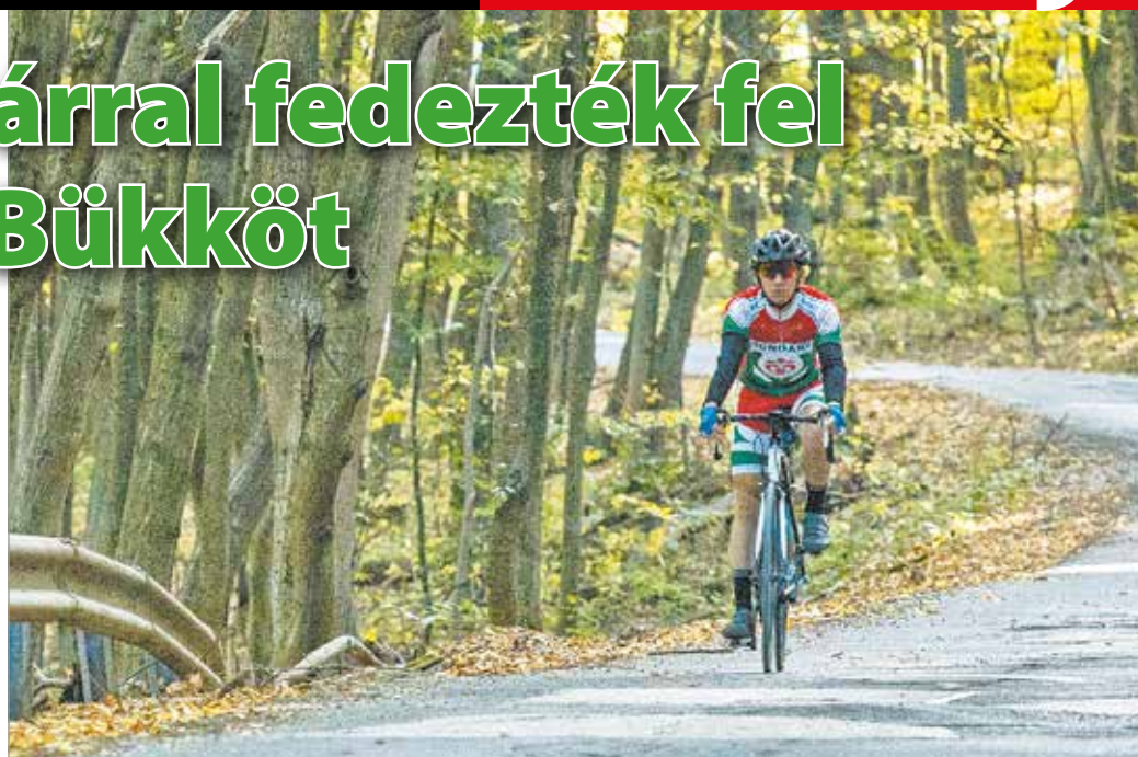
Csodás környezetben, kellemes időben tekertek a Bükkben.

A teljesítménytúrára – ahogy mindig – az ország minden tájáról, több mint húsz városból érkeztek kerékpárosok, azonban az egyesület tapasztalatai szerint a miskolciak körében is rendkívül népszerű a program, amit jól mutat a tény: a nevezők közel fele a borsodi megyeszékhelyről