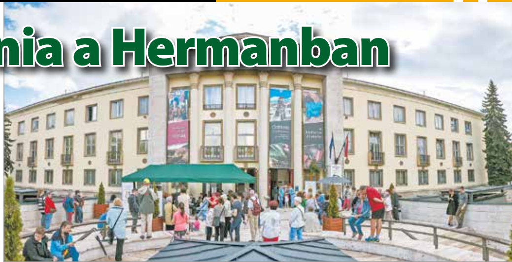
A múzeum programpalettáján kiemelt szerepet kap a zene

A fesztivál ideje alatt az intézmény kulisszatitkaiba is betekintést nyújtanak. A „Tiétek is a múzeum!” mottó jegyében a rendvédelmi dolgozók és a fel-