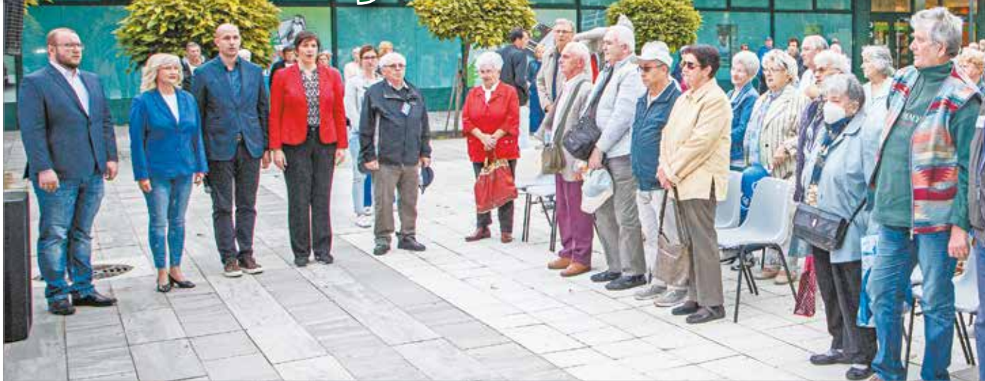
A kormányváltás után is kéri a támogatást.

A DK a megye I-es választókerületében a Jobbik jelöltjét, Szilágyi Szabolcsot támogatja, így ő szintén jelen volt az utcafórumon. A politikus azt emelte ki, hogy több olyan helyi