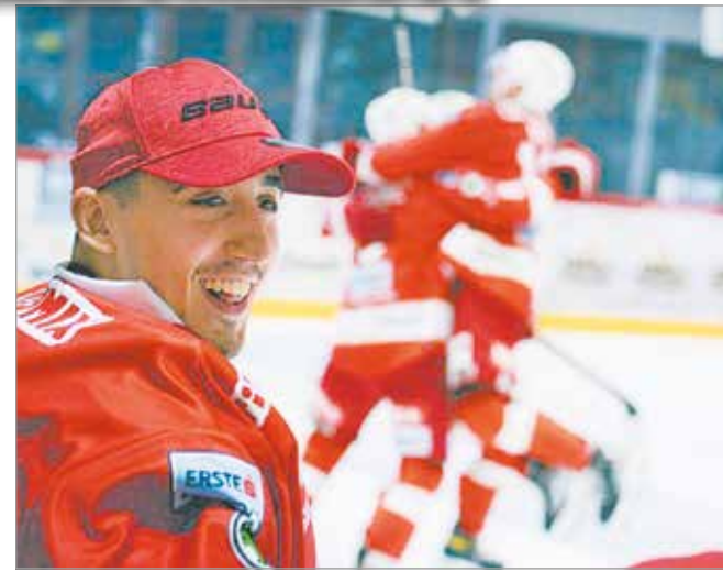
Volt azért ok öröme is.

Jó játékkal debütált az Erste Ligában a DVTK Jegesmedvék csapata, a Győr elleni győzelmet azonban nem sikerült megismételni a MAC ellen.