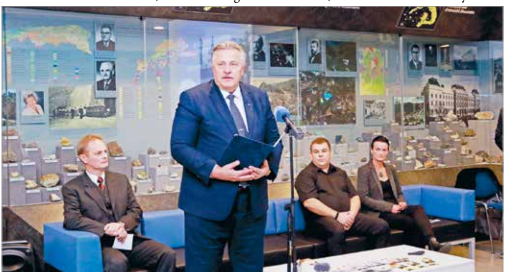
A lehető legtöbb forrást biztosítják a kultúra számára.

Zárásként egy – Winston Churchill angol miniszterelnökhöz kapcsolódó – anekdotát idézett fel: amikor a II. világháború idején azt javasolták neki, hogy a hadiköltségeket a kulturális kiadásokból fedezzék, felháborodva visszakérdezett: akkor minek indulunk háborúba?! „Én is úgy gondolom, hogy a lehető legtöbb forrást próbáljuk odaadni a kultúra fenntartására és fejlesztésére. Még ha szűkösek is a lehetőségeink” – zárta beszédét Veres Pál . Király Csaba