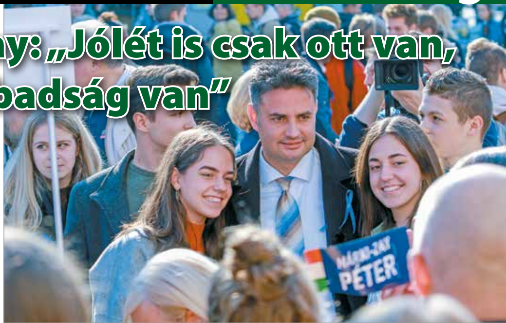
Márki-Zay Péter miniszterelnök-jelölt: szabadságot akarunk elsősorban.

A rendezvény egyébként egy valódi „polgármester cuna-