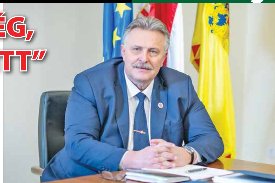
Veres Pál polgármester: Miskolc működik – tisztességesen, becsületesen, átláthatóan és szabadon

Ráadásul mi, miskolciak, mindig megtaláljuk azt, aminek örülni lehet, ami mellett ki lehet tartani. Csak meg kell nézni például a Tündérkert