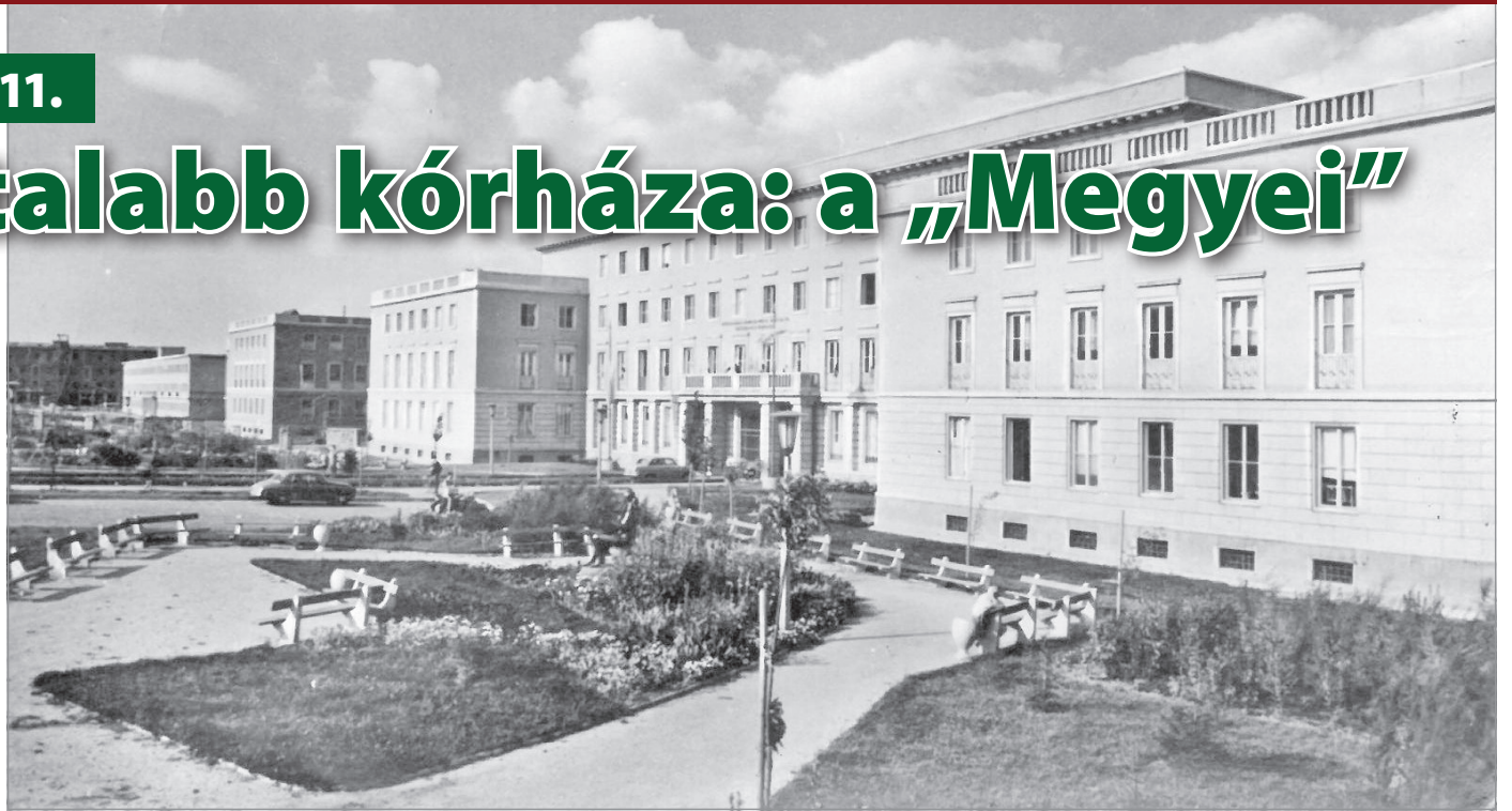
Eredetileg katonai iskolának szánták az épületegyüttest

1961-ben jött létre a koraszülött és a bőrgyógyászati osztály, valamint a traumatológia. 1962-től szerveződött szintén osztályos a patológia és a laboratóriumi háttér. A betegek által ma csak „idegépületnek” nevezett létesítményben az ideggyógyászati ellátás mellett – előbb részlegként, majd osztályként – idegsebészeti egység alakult, amely – bizonyítva létjogosultságát – 1965. február 5-én el is végezte az első