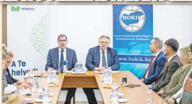
Minőségi munkahelyekkel állítanák meg az elvándorlást

– Abban hiszünk, ha minőségi munkahelyeket tudunk teremteni, amelyek bérekben, munkakörülményekben és juttatásokban egyaránt megfelelőek, és a munkavállalók életkörülményeit a megfele-