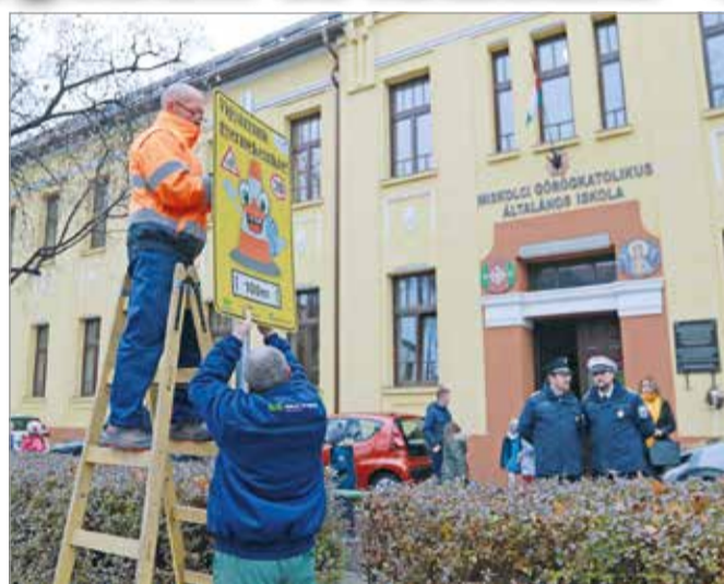
Vigyáznak a gyerekekre.

A kampány zárásaként a szakemberek fényvisszaverő jelzőtáblákat helyeznek ki miskolci iskoláknál, melyek a sebességkorlátozásra, a gyalogátkelőhelyre és az arra közlekedő gyerekekre hívják fel a figyelmet. Elsőként a Miskolci Görögkatolikus Általános Iskolánál kerültek ki a táblák.