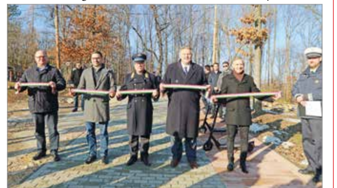
Átadták a tanösvényt.