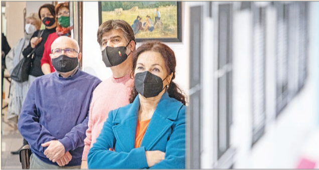
A Reinecker kiállítás a MŰHÁ-ban.