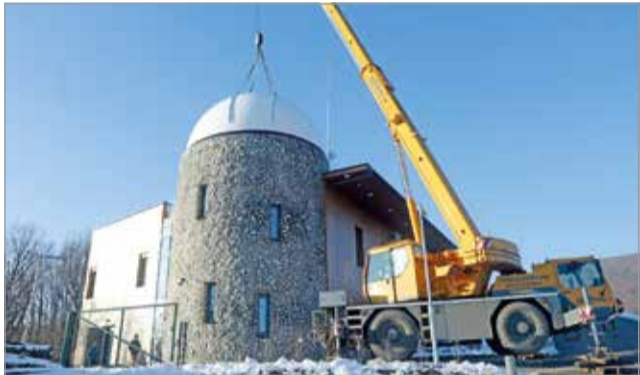
Az új kupola több különleges távcsövet rejt.