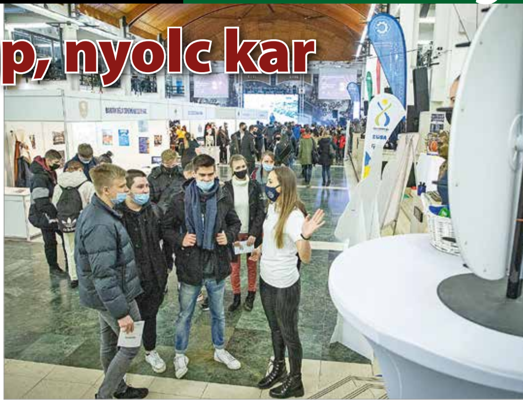
A résztvevők tájékozódhattak az induló képzésekről, és az egyetem által biztosított további lehetőségekről is.

Nyolc kart és az azokon induló számtalan képzést ismerhették meg a diákok ebben a két napban. Egy-egy ilyen érintkezés során – még ha nem is derül ki, de – körvonalazódhat, mely terület szakembereivé válhatnak majd az érettségéhez közeledő középiskolások. Az egyetemmel szoros együttműködésben álló, többnyire duális képzést indító vállalatok standjai is ennek szolgálatában települtek ki a nyílt napokra.