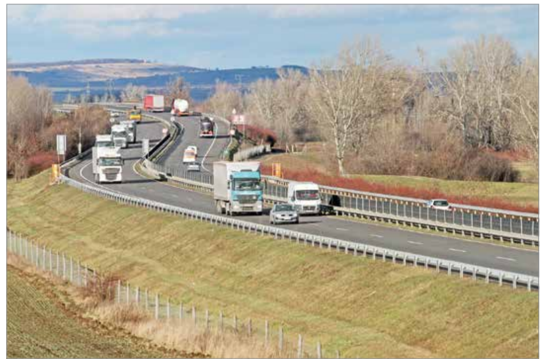
Az elkerülő út egy szakasza.

Az elkerülő fizetősé tétele ellen tiltakozott több miskolci politikus is. Simon Gábor és Szilágyi Szabolcs még múlt