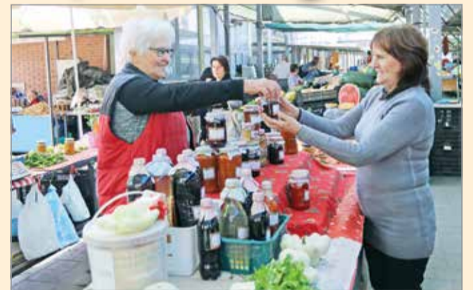
A Búza téri piac a város éléskamrája.

– A mi feladatunk a működőképesség megteremtése volt. Ennek első lépéseként