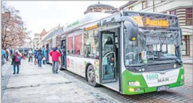
Az elvonásoknak a tömegközlekedés az egyik legnagyobb vesztese.