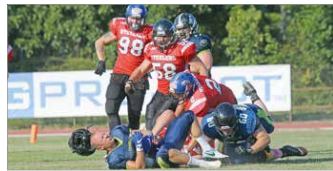
Uralták a mezőnyt a Divízió I-ben.

zaléka itteni lesz. Hozzájuk csatlakozhatnak magyar és import játékosok is. A lé-