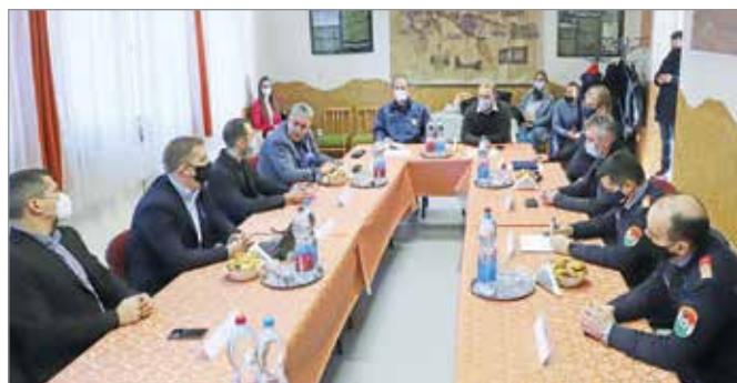
Perecesen tartottak közbiztonsági fórumot.