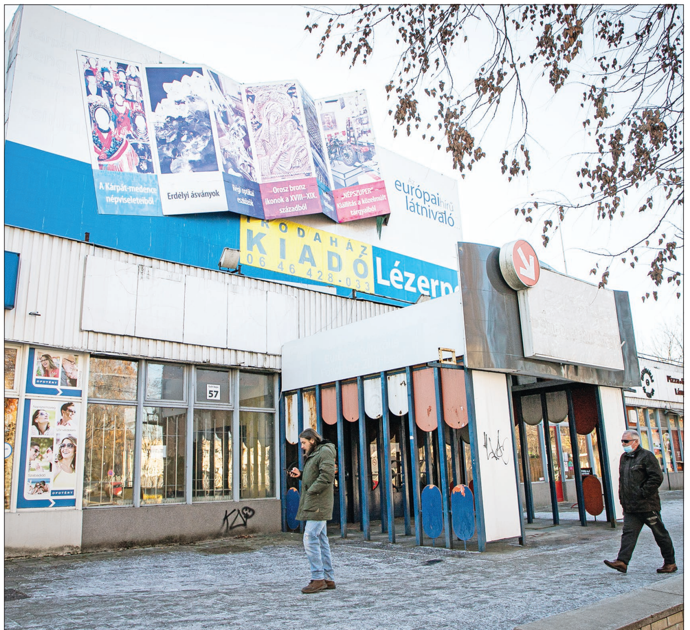
A Győri kapu közösségi központjaként is funkcionálhat a Tokaj szolgáltatóház részét képező egykori Lézerpont Látványtár.