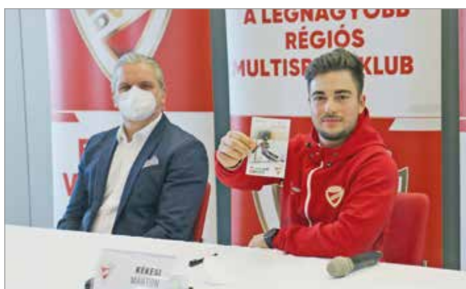
„Most már egy egész klubot képviselhetek az olimpián”.

– Hosszú évek során felépített munka, aminek ezt a sikert köszönhetem; ebben a szeren-