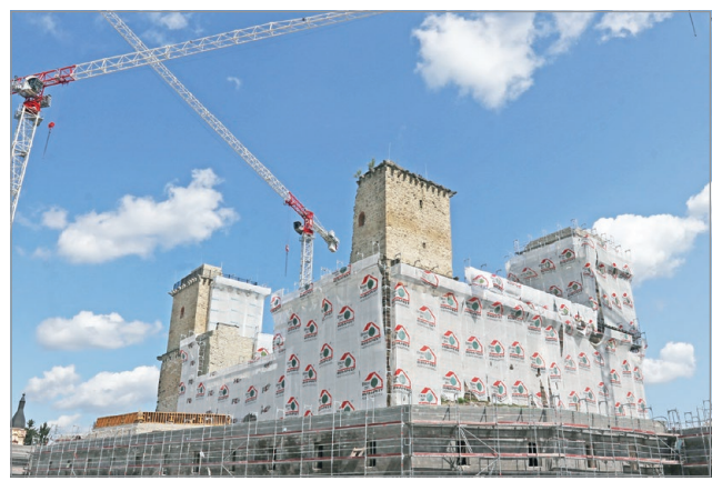
A problémák megoldása pluszköltséget jelent Miskolcnak.