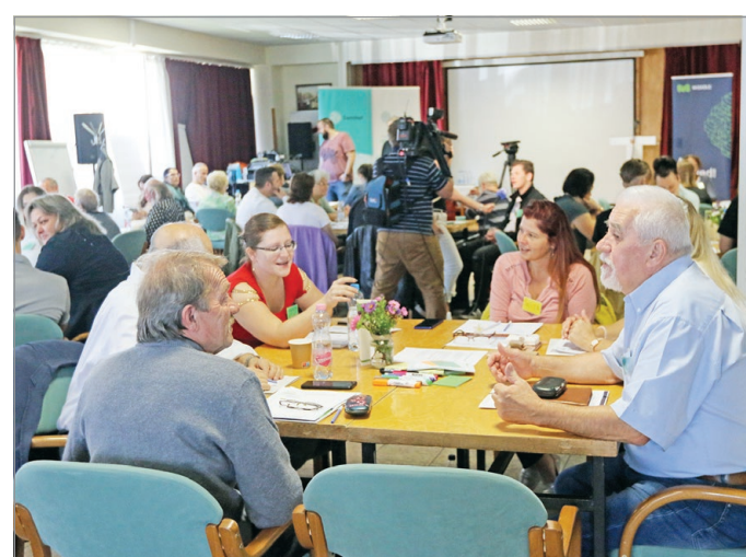
Tavaly szeptemberben rendezték meg a város első közösségi gyűlését.

Mivel Magyarországon előzmények nélküli az elképzelés, már az is kihívás, hogyan lehet ezt beépíteni a hétköznapi működésbe. Az elfogadott Részvételi koncepció – ami közös állampolgári, civilszervezeti és