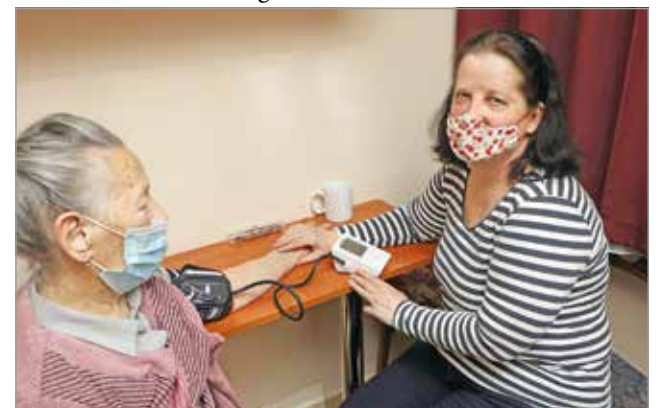
Mindig is tudta, hogy emberekkel szeretne foglalkozni.