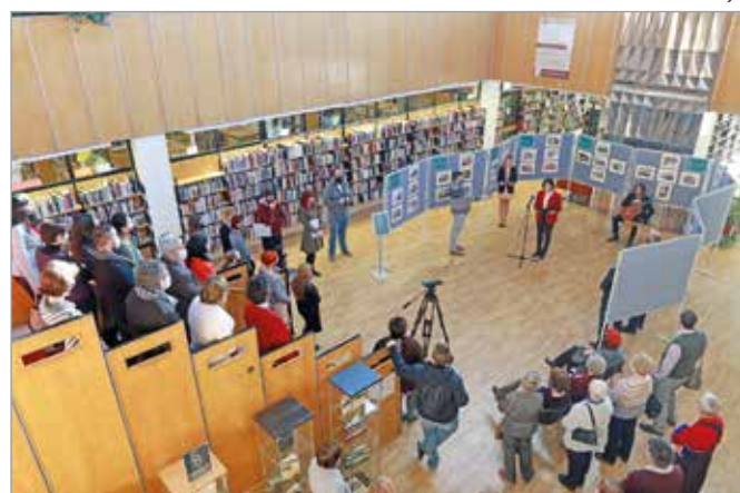
A dupla évforduló alkalmából nyílt kiállítás.