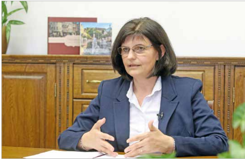
„Hogy tartalommal tudjuk megtölteni ezt a koncepciót, ahhoz a városlakókra van szükségünk.”

Mindez azt jelenti, hogy rengeteg tanulás is társult az előzményekhez. Az egyik első mérföldkő a részvételi munkacsoport létrejötte volt. Ebbe a szakmai előkészítő szervezet-