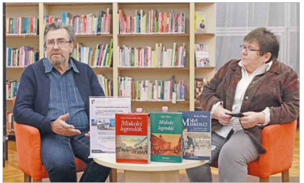
A beszélgetésen a formálódó kulturális koncepció is szóba került.

Óriási dolog, hogy megállapodás született, ez a kincs oda kerül, ahová való, a városé lesz, minden miskolci emberé, a megőrzéséről pedig a legavatottabbak, a Miskolci Herman