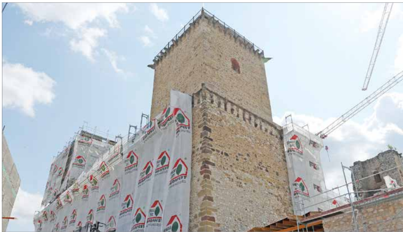
A régi kőfalak állékonyságát és tartószerkezeti teherbíró képességét meg kell erősíteni.

Lapunk megtudta: a régi kőfalak állékonyságát és tartószerkezeti teherbíró képességét meg kell erősíteni. Mindezt úgy, hogy a problémás falszakaszokon, falrészekben – beleértve a falmagokat, a falfelületeket és a falrétteget egyaránt – tartós, időálló