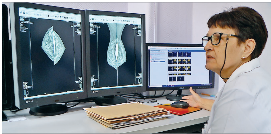
A laboratóriumban akkreditált készülékekkel dolgoznak

Az AA-MED Lithoterápiás és Radiológiai Intézet közel két évtizede foglalkozik magánképződiagnosztikával. Tevékenységüket kibővítették térítéses klinikai laboratóriumi diagnosztikával, ahová szeretettel várják meglévő és új pácienseiket. A vizsgálatok szakorvosi beutaló nélkül kérhetőek, a vérvétel sorban állás nélkül, időpont-egyeztetéssel történik. Laboratóriumban akkreditált készülékekkel dolgoznak, az AA-MED szerepel az NNK hivatalos listáján.