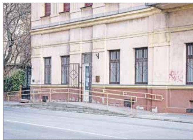
A felújítás alatt az orvosok máshol rendelnek.

A beruházás decemberre készülhet el, de ez idő alatt sem szünetel a háziorvosi ellátás: a Kazinczy utca 18. alól a Fábíán utca 4. alatt található épületbe költöztek át a rendelések, amelyeknek a telefonos elérhetőségei változatlanok.