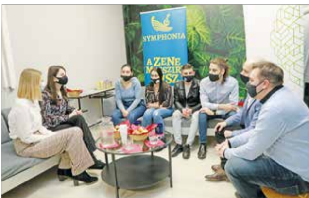
A miskolci tehetségeket köszöntötték.