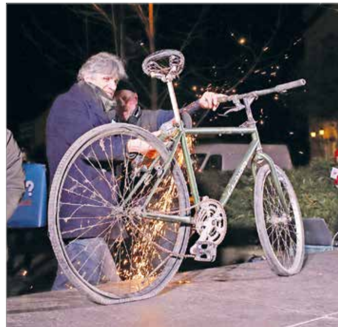
„Ezt a kerékpárt már tolni sem lehet.”

– Amelyik kerékpárt már tolni sem lehet, azt nem is érdemes toldozni-foltozni; azt szét kell szedni. Új oktatási rendszert kell építeni – summázta a miskolci tüntetés fő üzenetét a PDSZ regionális ügyvivője.