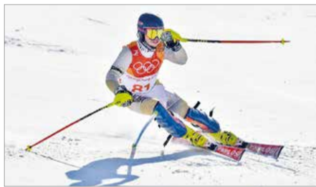
Nagy álma teljesült a miskolci sízőnek.