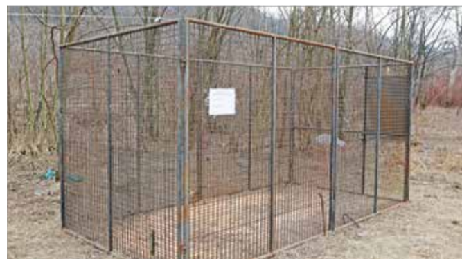
A csapda az egérfogó módszerrel működik.

„Nem keressük különösebben az ember társaságát, és nekünk sem kell közelíteni hozzájuk” – mondta, hozzátéve: ha bármilyen problémát okoznak, akkor a területileg illetékes vadászársággal érdemes felvenni a kapcsolatot. K. CS.