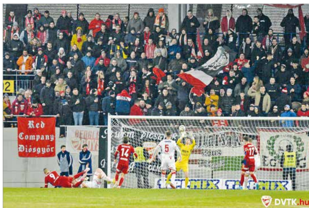
A fővárosba is sokan elkísérték az élvonalas diósgyőri csapatot.