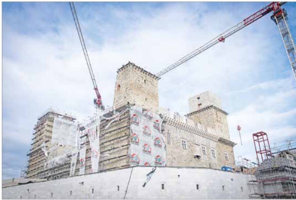
Statikai problémák léptek fel a Diósgyőri vár rekonstrukciója közben.

Minden több száz éves épület felújításánál és továbbépítésénél adódhatnak