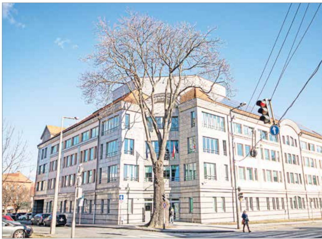
A fa már három éve is rossz állapotban volt.

– Három éve a Városgazda végzett rajta FAKOPP műszeres vizsgálatot, aminek eredményéből tudható: a bálványfa már akkor is nagyon rossz állapotban volt. Idén októberben külső, független faápoló végezte el ugyanezt a vizsgálatot, ami kimutatta, az odvas, korhadt fa mára balesetveszélyes állapotban van, a helyzet megszüntetése érdekében szükséges a kivágás. A dokumentumok alapján