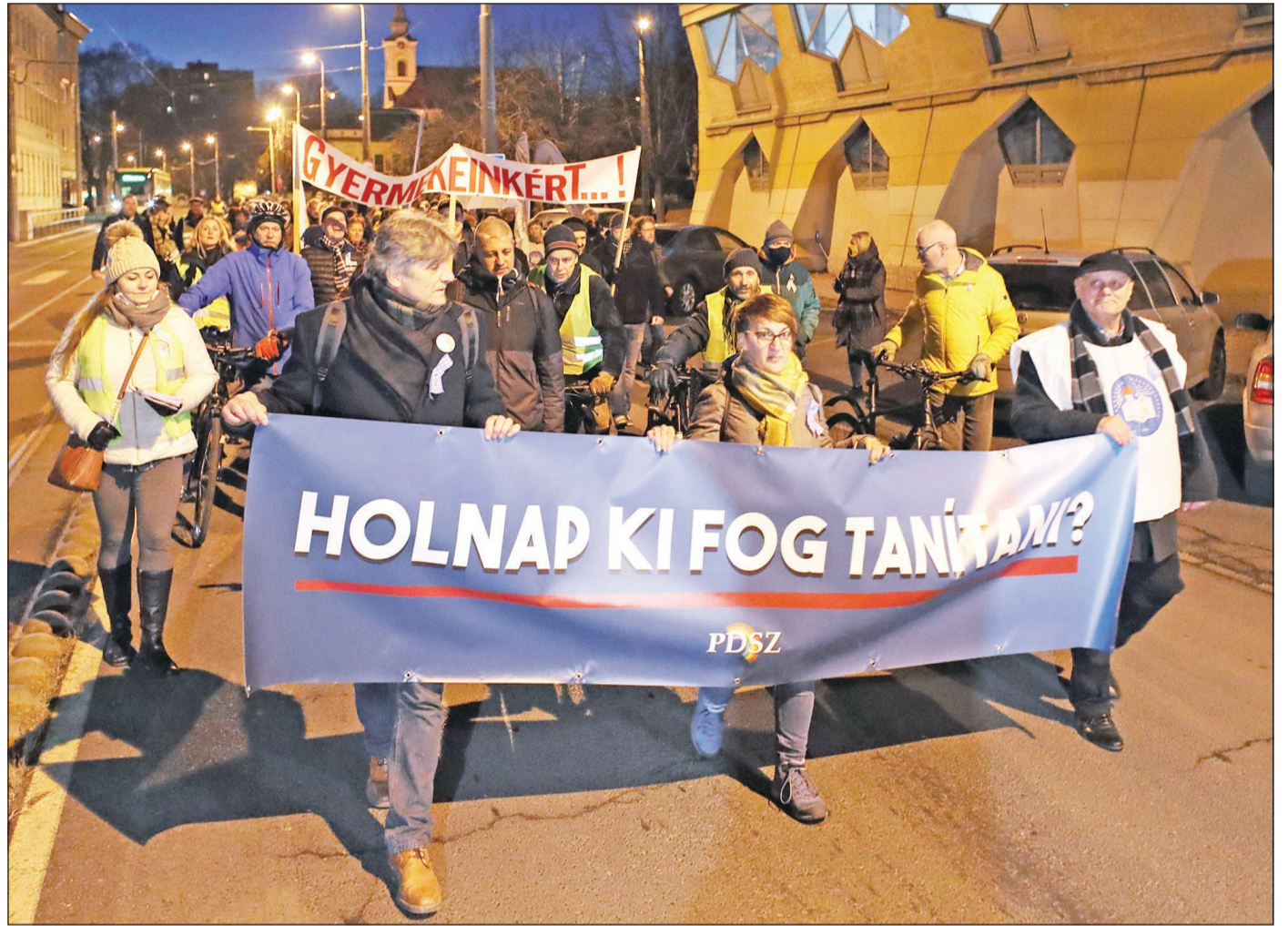
Aggódnak a tanárok a gyermekek jövőjéért.