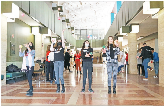
Játékos formában vezették rá a diákokat arra, hogyan érdemes tanulni.

A hallgatók szabadidejükben kilátogatnak az osztályokhoz, segítenek a mentoráltaknak a