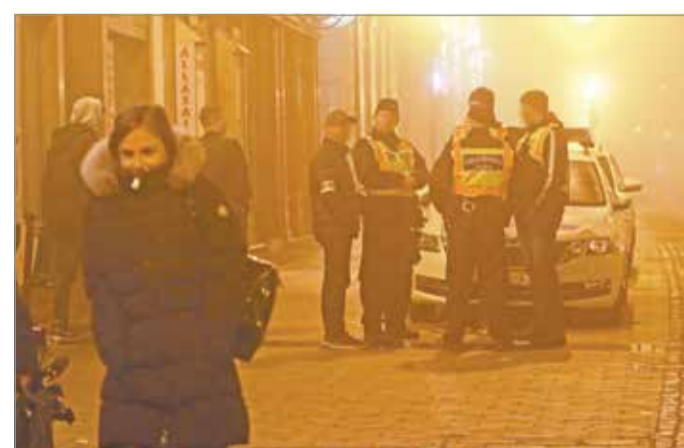
A belváros visszatérő helyszínén.

társadalmi együttélés szabályait nem képesek betartani. A pénteki akció során öt körözött személyt fogtak el a rend-