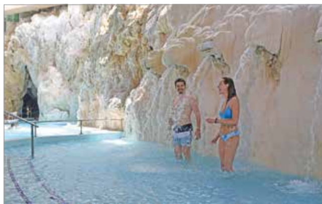
A leállás alatt elvégezték a szükséges karbantartásokat