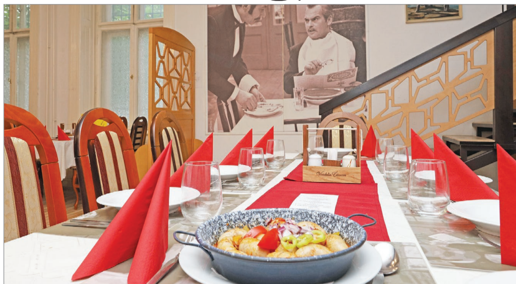
A Vendelinben a filmművészet és a gasztronómia találkozik.

– A filmművészet és a gasztronómia csodálatos fúziója a jelenet, ahol Vendelin felszolgálja a fogásokat Szindbádnak. Édesapám álma egy ilyen me-