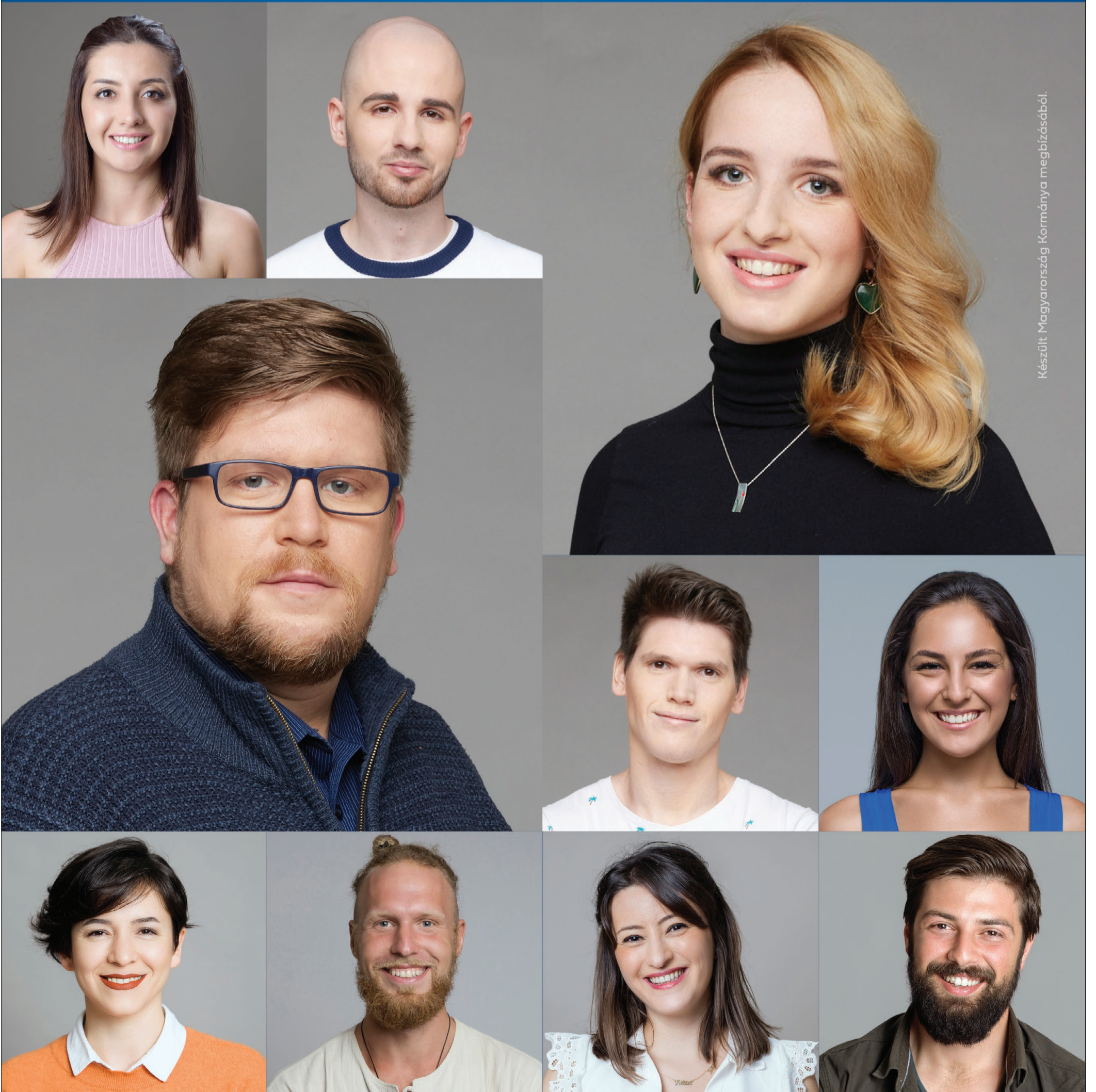
Készült Magyarország Kormányának megbízásából.