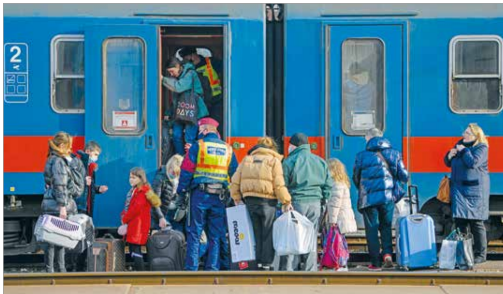
Péntek délelőttig már több mint 140 ezren érkeztek Magyarországra.

Az, hogy hosszán tartó krízisről van szó a kormány számára is hamar nyilvánvalóvá vált, ezért néhány nap alatt megszervezték a Híd Kárpátaljaiért segélyakciót. Szerdán aztán Miskolcon tanácskoztak a megye, a város, a legna-