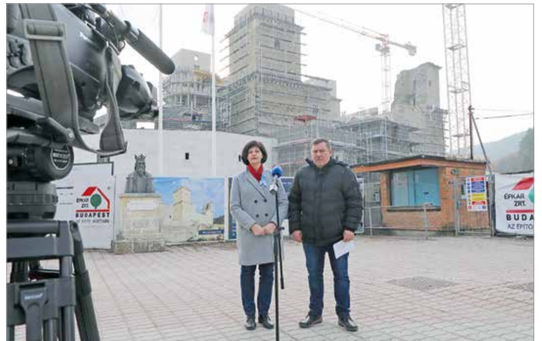
A munka ugyan nem áll, de a vár meddig fog?