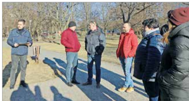
A tér műszaki átadására kedden került sor.