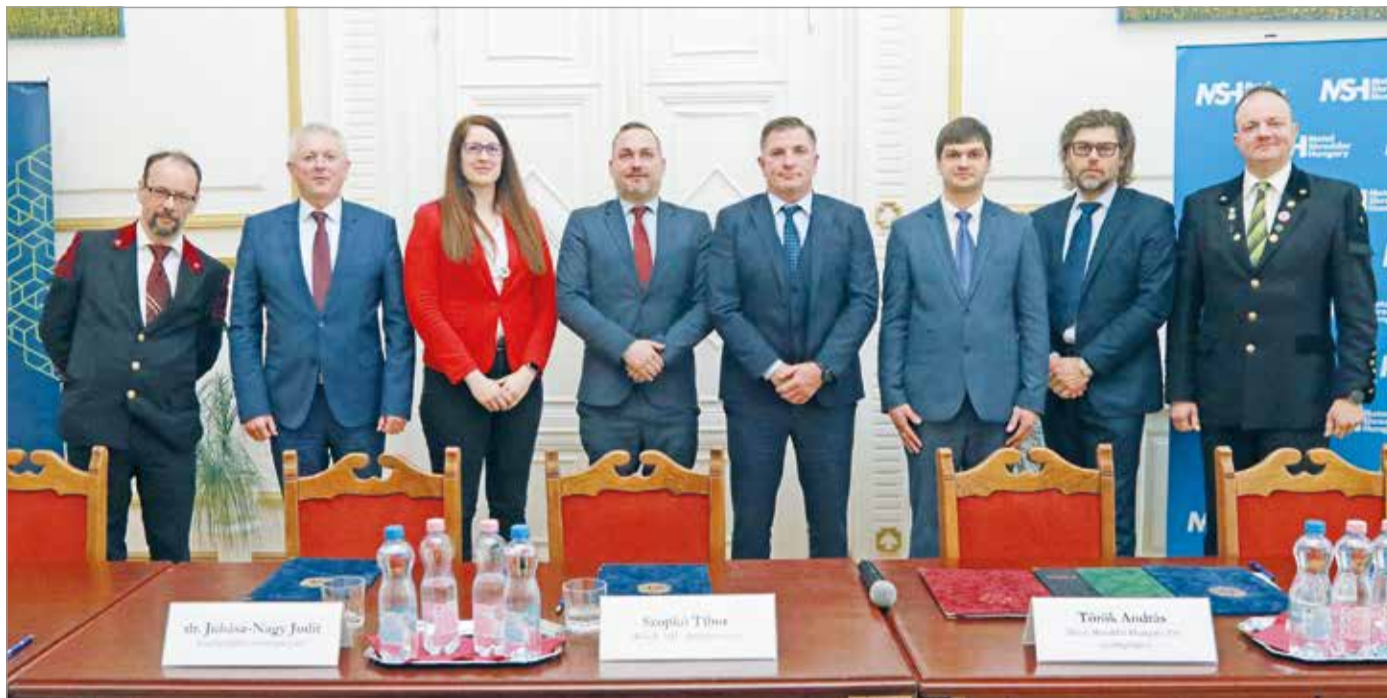
A beruházásról szóló szerződést csütörtökön írták alá.

A Metal Shredder Hungary Zrt. bővíti kapacitását, és Miskolcban, a Déli Technológiai Parkban hozza létre új telephelyét. A beruházásról szóló szerződést csütörtökön írták alá a város, a Holding, valamint a cég képviselői.