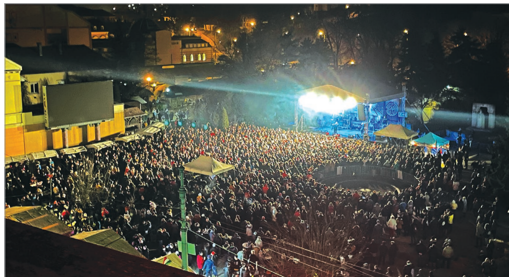
A Szent István tér megtelt a bulizókkal.