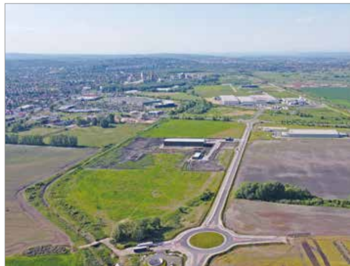
Az iparterületek fejlesztésével a város adóbevételei is növekedhetnek