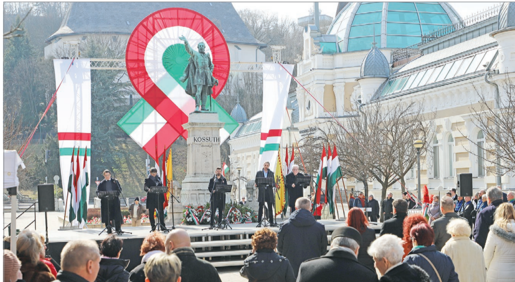
A Miskolci Nemzeti Színház ünnepi műsorával zárult a rendezvény.

Tegyünk most együtt hitet a szabadság és a közös akarat, az egyenlőségen nyugvó béke mellett, mert ezek az eszmék ma még aktuálisabbak, mint azt szeretnénk volna határon innen és ha-