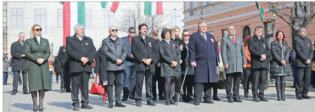
Miskolc város vezetése is megemlékezett a forradalom és szabadságharc hőseiről.