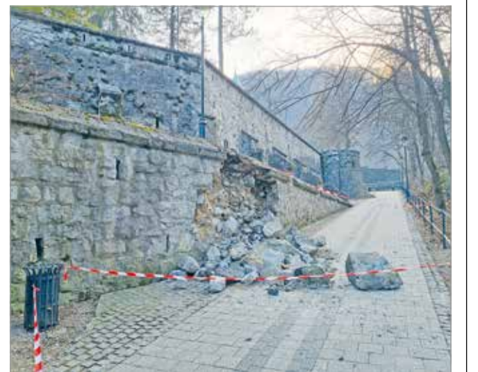
A helyreállítás több tízmillió forintot emészt majd fel.