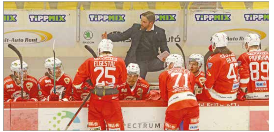
Megőrizték a csapat egységét, a következő szezonban továbbépítkeznek.

Ha a szezon egészét nézzük, akkor nagy fejlődésen ment át a csapat. A fiatal játékosok közül