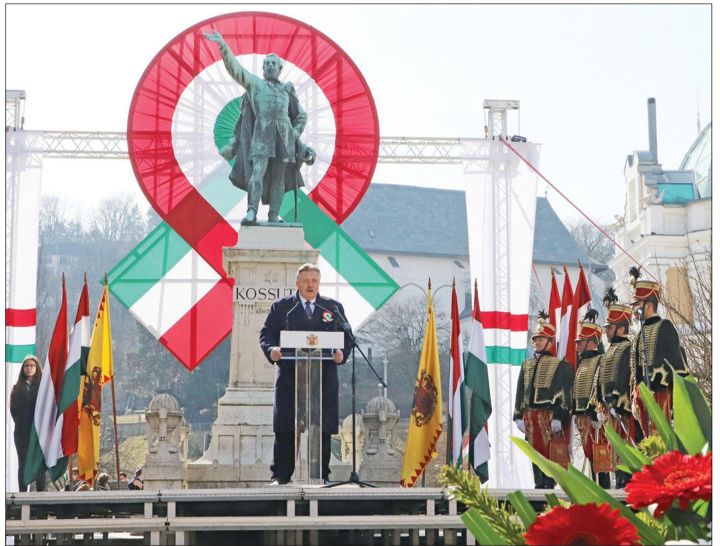
A városvezető beszédében a szomszédban zajló orosz-ukrán háborúról is szólt.

Miskolc polgármestere március 15-ei beszédében úgy fogalmazott, a béke és a szabadság olyan közös értékeink, melyek mindannyiunkban ott élnek születésünktől fogva.