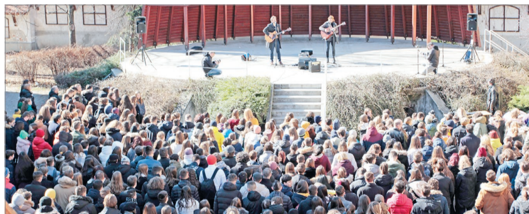
Mintegy nyolcszáz tanuló gyűlt össze az udvaron.

A Diósgyőri Papírgyár 1782-ben alapított magyar papíripari cég, amely az ország egyetlen bankjegy- és biztonságipapír-gyártó vállalata. Miskolc-Diósgyőrben található, és Papíripari Múzeumot is működtet. Diósgyőrben Martinyi Sámuel 1782-ben alapította a papírmalmot, és 1836-ig vezette. 1842-ben Fiedler Károly kassai kereskedő és társai vették át, akik már működésük elején komoly sikert értek el a papírgyár termékeivel az 1846-os ipari kiállításon (elnyerték a kiállítás nagy ezüstérmét). A gyárban a századfordulón komoly fejlesztésekbe kezdtek, megvásárolták a környező telket, új gyártelepet építettek, műszaki fejlesztéseket hajtottak végre. Az ötvenes években újabb technikai korszerűsítések sora valósult meg. 1963-ban beindult a tömegtermelés, és megkezdődött a papírfeldolgozás is. 1993-ban a Pénzjegynyomda tulajdonában került, és azóta állandó tevékenysége a bankjegy-, okmány-, érték-, jegyalappapírok, vízjeles nyomópapírok, illetve biztonsági kartonok gyártása.