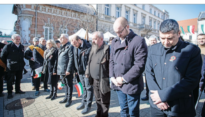
A Velünk a Város frakciótagjai is megkoszorúzták a Kossuth-szobrot.

Így fogtunk hozzá az esti koncertekhez, amelyek ismét sok érdeklődőt vonzottak: a Szent István tér teljesen meg-