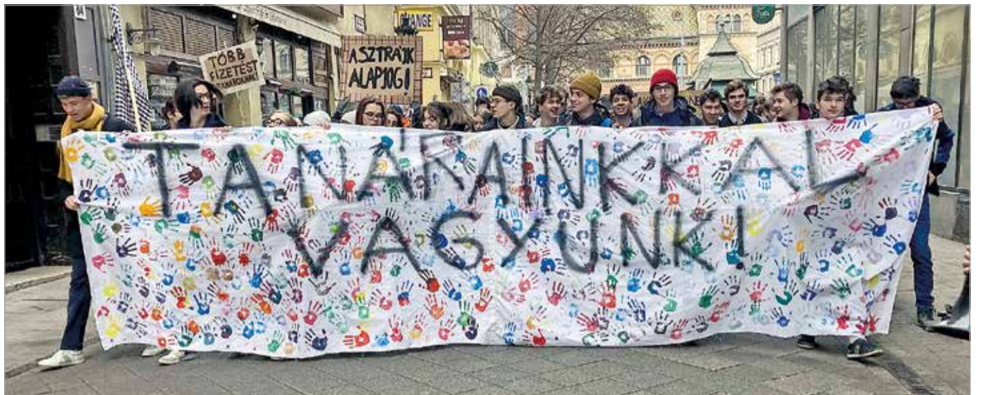
A tanulók szerdára tüntetést szerveztek a Kossuth téren.