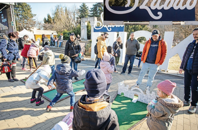
Napközben színes programokkal várták a családokat.