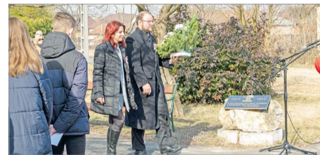
Cseléné Figula Edina és Szilágyi Szabolcs is megkoszorúzták az emlékművet.