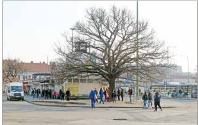
Az elvégzendők munkálatokról csütörtökön egyeztettek.