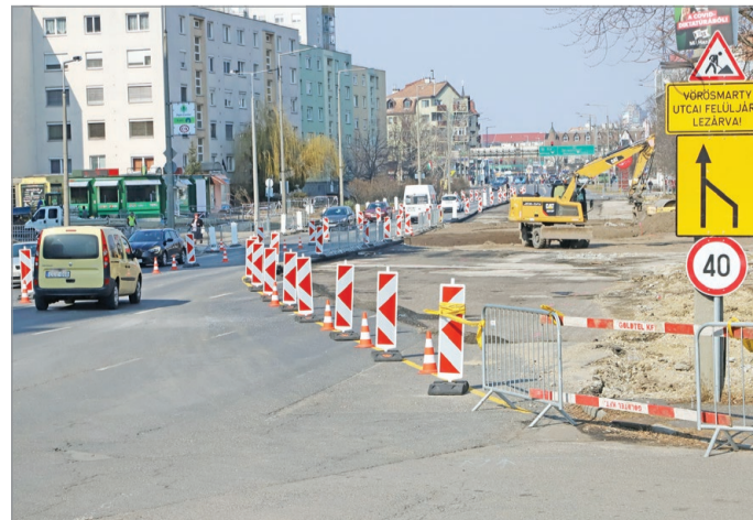
A közlekedők alkalmazkodtak a néhány hónapos kényelmetlenséghez.