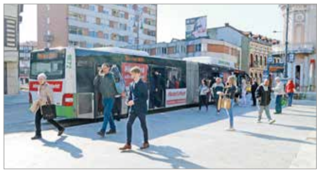
A kordonokat péntek reggel elbontották.