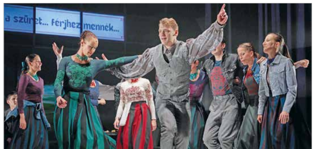
Az előadás korszakokon átívelő táncművet ígér