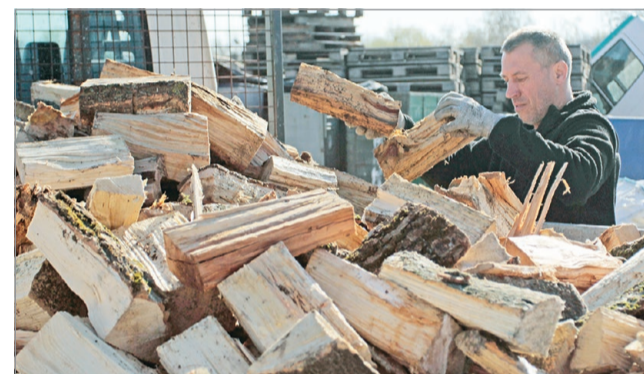
Az elmúlt fél évben kétezer köbméter fa melegítette a város rászorulóinak otthonát.