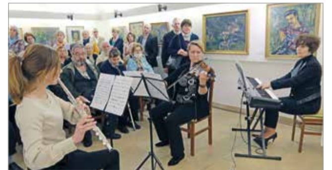
A megnyitón a művészeti iskola növendékei is közreműködtek.