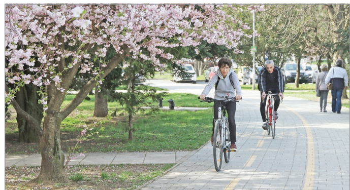
A program jelentős fejlesztési lehetőség Miskolcnak.

tel a hulladékgazdálkodásra, a közlekedésre, valamint az épületek szigetelésére és az energiafelhasználásra. A különböző programok megvalósításához szükséges a lakosság és a kutatási szervezetek bevonása, ezzel is segítve a minél szélesebb körű részvételt és a kísérleti program céljainak minél hatékonyabb megvalósítását. MN