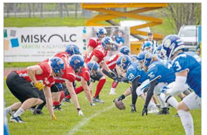
Felvették a HFL ritmusát.