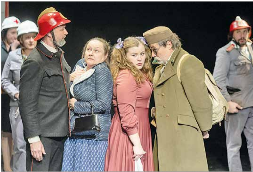
Miskolcra érkezett a beregszászi Illyés Gyula Magyar Nemzeti Színház emblematikus előadása

– A hadiállapot miatt nehéz helyzetbe került a színház, hiszen a megszokott játszóhelyen nem tudunk előadásokat bemutatni; nem csak azért,