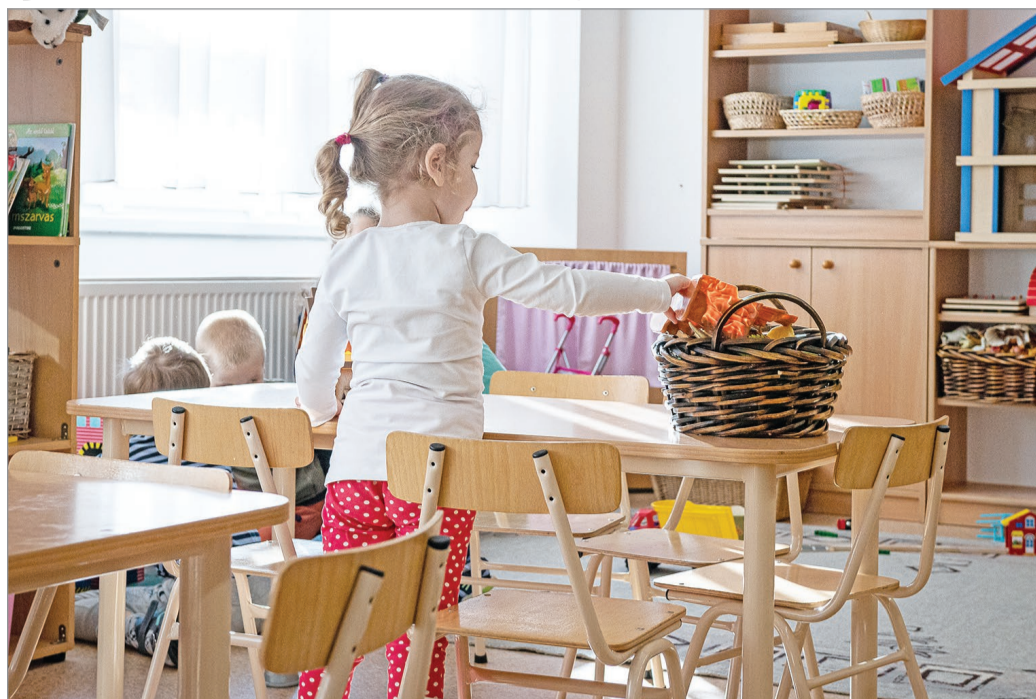
Ezzel a jelenleg működő 173 csoport száma 159-re csökken, és a csoportok átlagléttszáma így 20-22 fő lesz.

– Ezt több ok teszi szükségessé: a várhatóan csökkenő gyermeklétszám, a nyugdíjba vonuló óvodapedagógusok nagy száma, a más nagyvárosokhoz hasonlóan, Miskolcon is tapasztalható óvodapedagógushiány. A racionalizálás mellett szól az is, hogy az óvodák csoportjai között egyenlőtlenségek tapasztalhatók: míg egyes helyeken az átlag csoportlétszám 16-18, addig máshol 26-29 fővel működnek csoportok – írják.