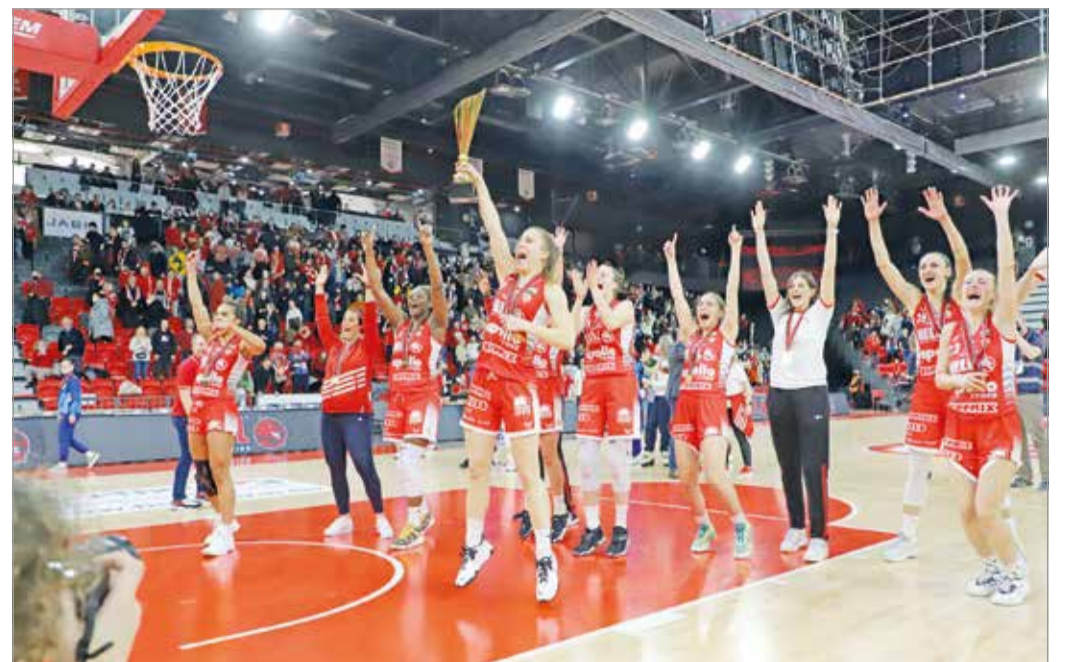
Kupagyőzelmet és bajnoki bronzot is ünnepelhetett a DVTK kosárlabdacsapata.

– Kellő módon megünnepeltük a sikert. Azt mondtam a lányoknak is, hogy ezt a sze-