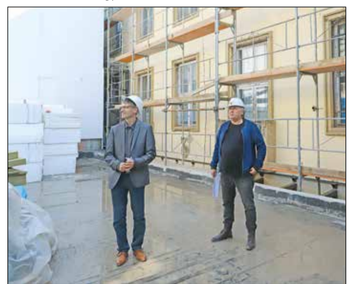
Összesen 1350 négyzetmétert tesz ki az újonnan kialakított hasznos tér.