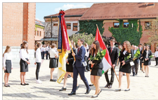
A Fényi Gyula Jezsuita Gimnáziumból pénteken ballagtak a diákok. Fotó: Juhász Ákos