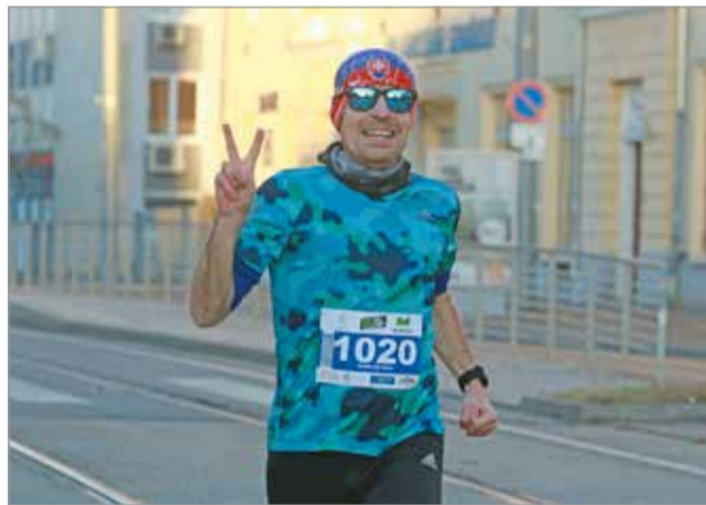
A maraton testvérvárosokat köt össze.