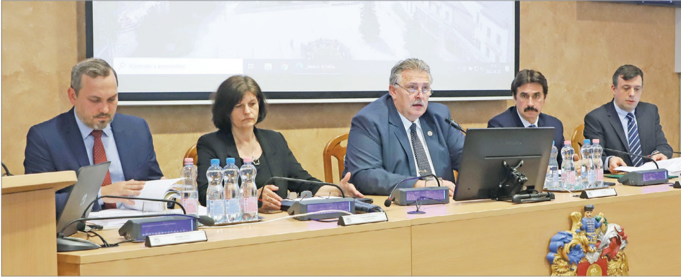
Összesen tizenegy napirendi pontot tárgyalta a városatyák az április közgyűlésen.