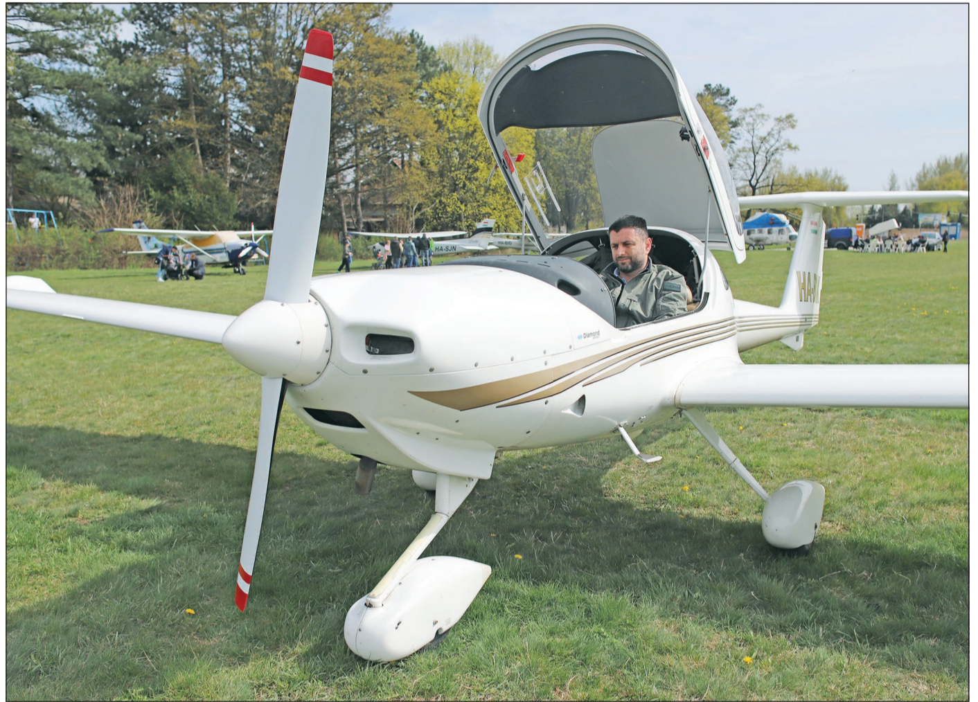
A Legendák a Levegőben utazóprodukció érkezett Miskolcra múlt hétfvégén.