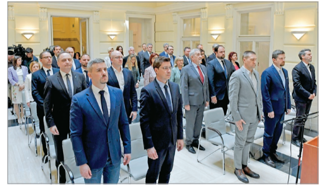
A rendezvényen huszonnégy képviselő vette át megbízólevelét.