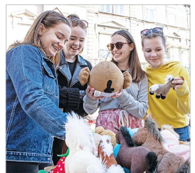
Márciusban kirakodóvásárt szervezett a MIDÖK.

Május 11-én, Miskolc városnapján ünnepi közgyűlésre készülnek, hogy újból gyakorolhassák képviselői jogukat az oktatási intézmények diákjainak nevében a tagok. Egyebek