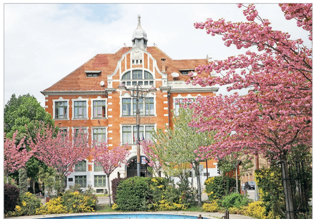
A Földes a lista hetvenötödik helyén végzett.

– Jelenleg mindig egy-egy évfolyam aktuális pillanatképet mutatja a lista. Sokkal sze-