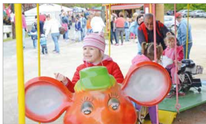
Vidámpark és ugrálóvár is várja a legkisebbeket.

• Az Avas kilátó végállomásról indulva: 09:10, 09:40, 10:10, 10:40, 11:10, 11:40, 12:10,