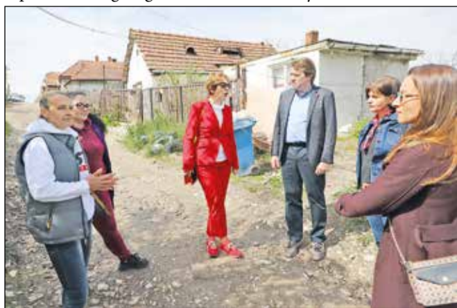
A Bábonyibércen helyszíni bejárást tartottak.