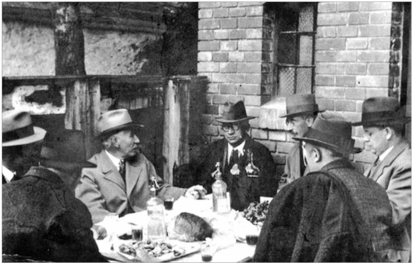
Móra Ferenc miskolci barátai között