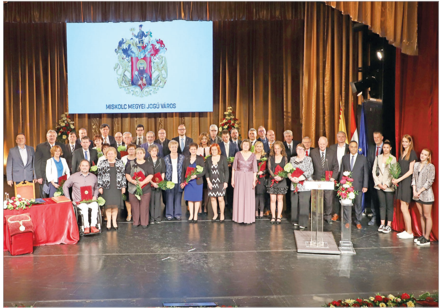
Az ünnepi díszközgyűlést a Miskolci Nemzeti Színházban tartották, ahol harmincheten vettek át városi elismerést.