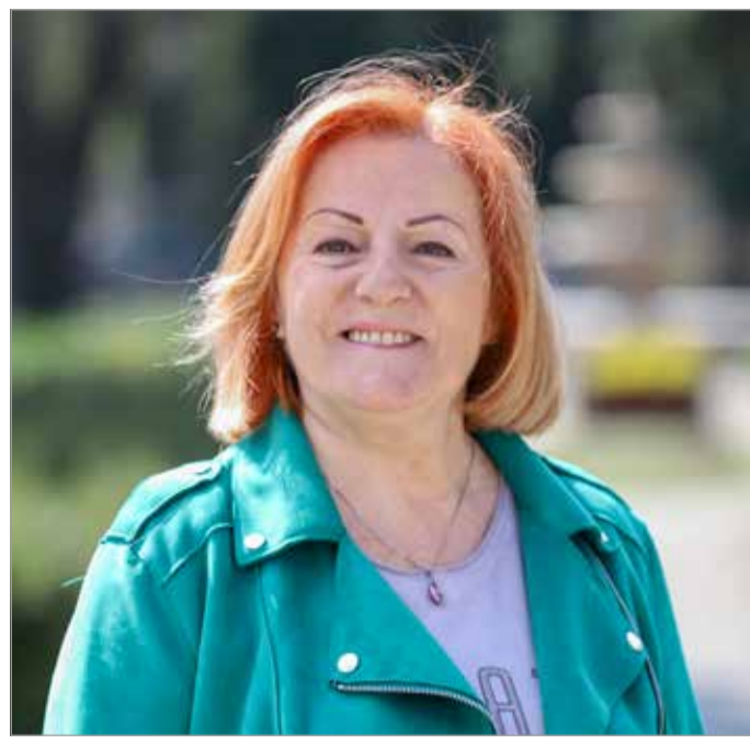
A világ- és Európa-bajnokságok érmeit még mindig nagy becsben tartja

– Hogy miért éppen az asztaliteniszt választottam? Erre a kérdésre mondhatnám: ez volt a természetes, mivel ennek már családi hagyományai is voltak. De nem így kezdődött. Fogalmam sincs, hogy miért, de édesapám úgy gondolta, jó lesz, ha vívni járok. Tízéves voltam, amikor elvitt a MMTE-be, akkor még volt ott vívószakosztály. Talán ha három hónapig jártam edzésekre, de bevallom,