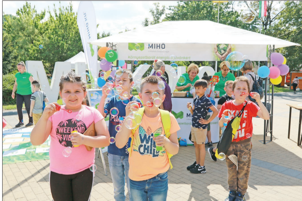
A legkisebbeket is változatos programok várták a Szent István téren.