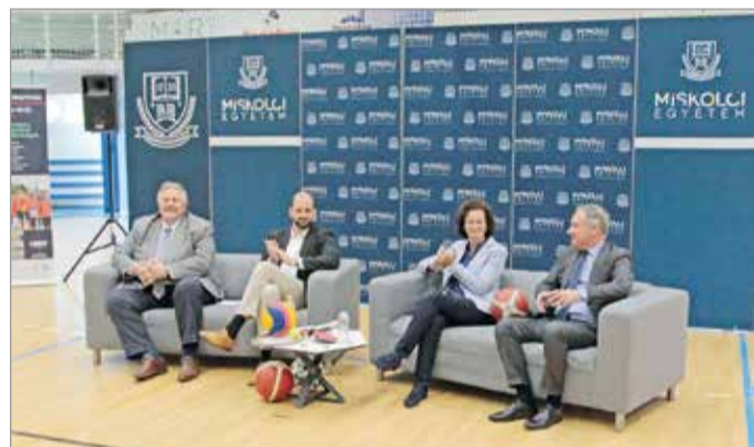
Ezer sportolót várnak Miskolcra a jövő héten.

– A sport szerves része az egyetem egészségfejlesztési stratégiájának – szögezte le Horváth Zita rektor, rámutatva: a testnevelésórak színvonalának javítását és a szabadidő-sport támogatását is célul tűzték ki az egyetemen. – Igyekszünk egyéb tanulási lehetőségeket és mentorprogramokat biztosítani azon fiataloknak, akik egyesületben sportolnak, hogy a két tevékenységet párhuzamosan tudják művelni.