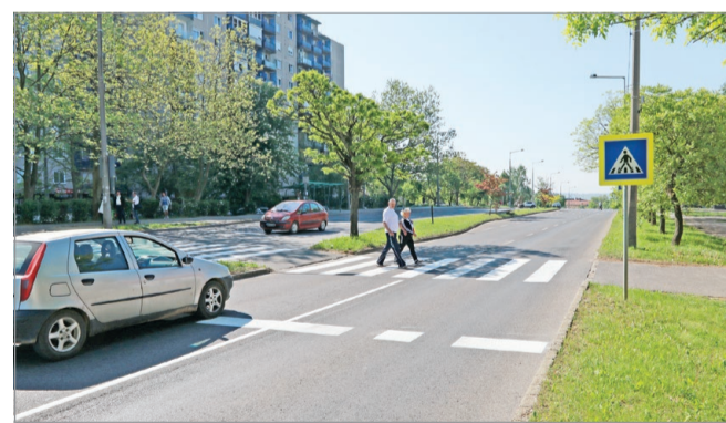
További tizenkét gyalogátkelőhely átalakítását tervezik.

Az újfajta felfestések alkalmazását a Kerékpáros Mis-