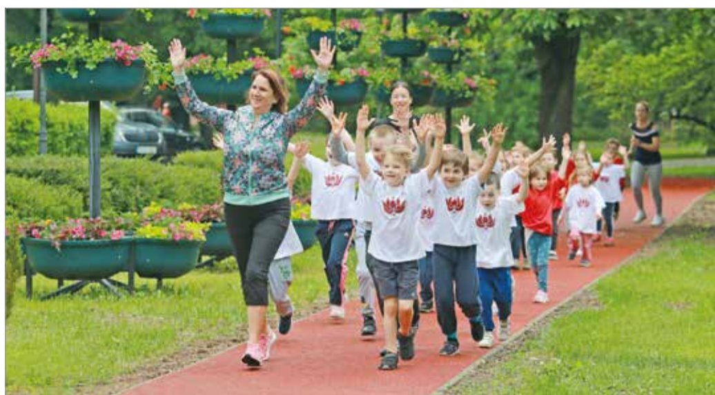
A futókör az első lépése a Népkert komplex megújításának.

„Úgy tekintünk a futókörre, mint ennek a komplex