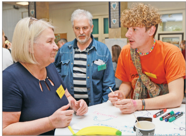
Rögtönzött csapatok dolgozták ki az ötleteket.