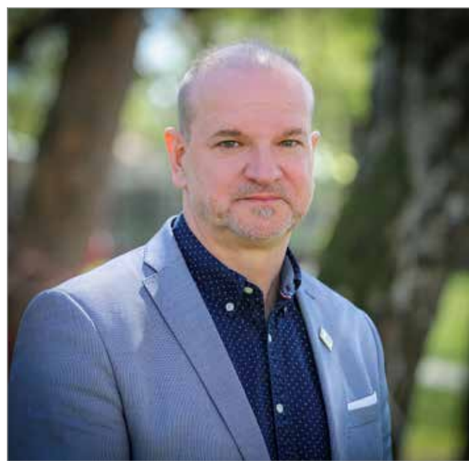
A városért végzett közösségi munkájának fontos színterei: a kultúra és a sport

A tágabb környezetért érzett felelősségének szép példája a Tudomány és Technika Háza melletti, korábban elhanyagolt park felújítása és örökbecsűvé tétele. A népkerti futókör építésének ügyét is ő indította el az első népkerti futónap megren-