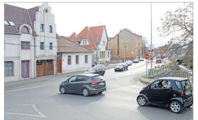
A nyár során a Petőfi és a Meggyesalja utcákon lesznek részleges útlezárások.

A projekt keretében a következő 14 hónap során megnyitják a Petőfi és Meggyesalja utcák közötti tömböt a Dayka utca meghosszabbításaként kiépítendő új, kétsávos útszakasz számára. Ha elkészül, a tervek szerint 2023 tavaszától ez fogja kiváltani a Rác utcai közlekedést. A cél a belváros, a Szent István tér környezetének forgalmi terhelését csökkenteni, optimalizálni. Rövid ideig tartó, részleges sávlezárásokra kell számítaniuk az autósoknak a következő