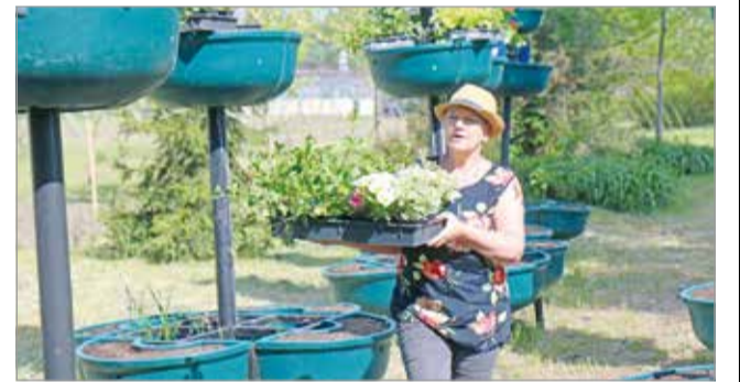
Már elkezdtek a virágfák előkészítését a kertészetben.