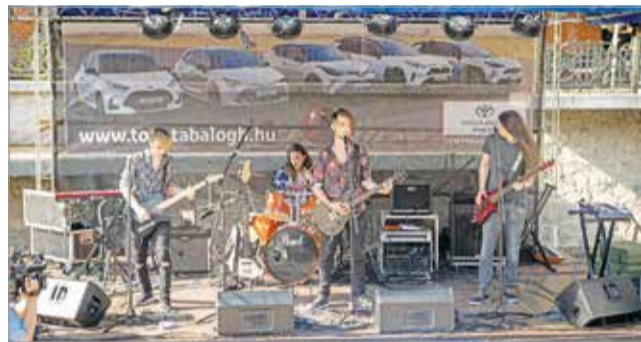
A Tiszta Kosz nyerte meg a tehetségkutatót.

Pénteken a már tapasztaltabb zenekarok számára kiírt, kétnapos tehetségkutatóval folytatódott a zenés programsorozat. K. I.