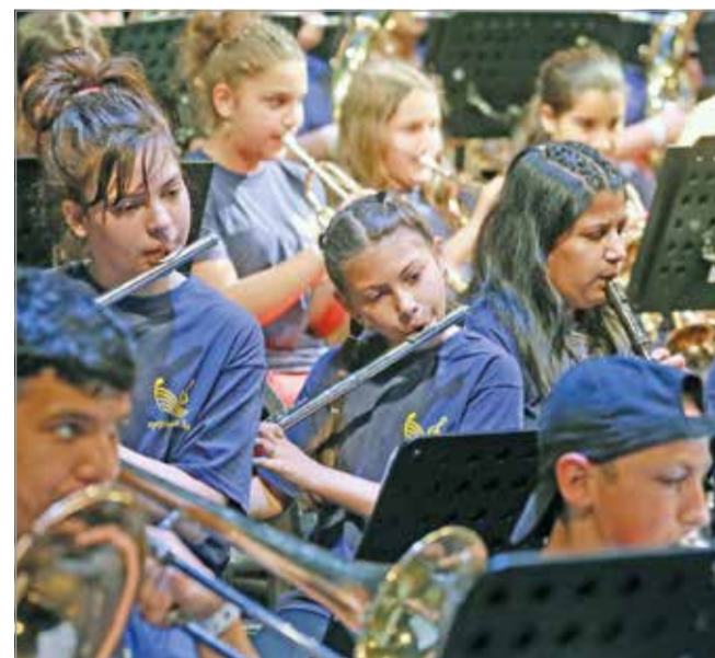
A gálakoncert során közel félezer diák lépett fel a Miskolci Nemzeti Színházban.