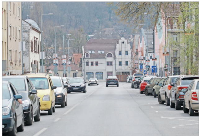
A leendő új útszakasz kiépítéséhez szükséges bontási munkák zajlanak a nyár folyamán.

A beruházás harmadik és negyedik üteme idén ősszel és jövő tavasszal esedékes, az már a Rác utcát és a Kálvin utcát is érinti. A lezárásokról folyamatosan tájékoztatjuk olvasóinkat. MN