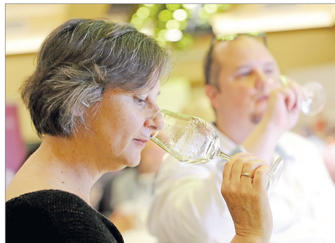
Több mint 40 bort neveztek a versenyre.