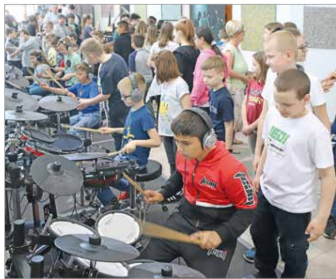
A legnagyobb sikere a doboknak és a különböző vibráfonoknak van.