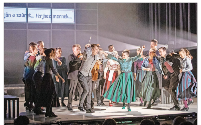
A Magyar Állami Népi Együttes az Idesereglik, ami tovatűnt című darabot adta elő a színházban.