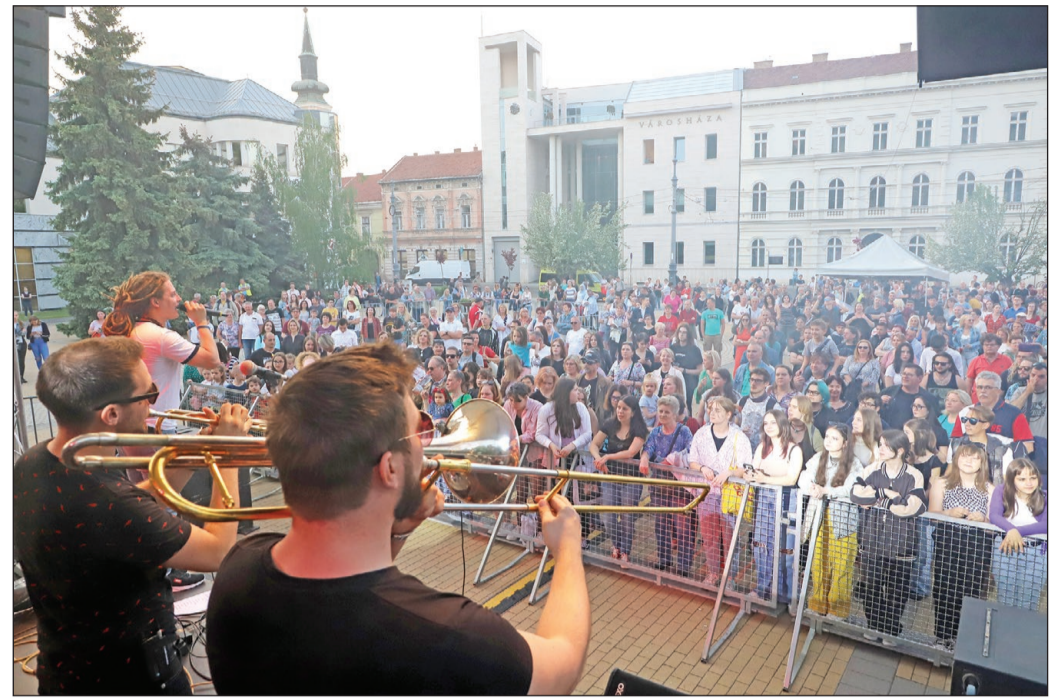
Késő délutántól a zené volt a főszerep a téren.

– Hodobay nagy álma Nagy-Miskolc megteremtése volt, ezt az álmot szeretnénk végre valóra váltani. De nem új településrészekkel, hanem szívvel, lélekkel, kultúrával és odafigyeléssel megtöltve a Szinva városának mindennapjait. Hodobay letette az alapjait annak a városnak, amiben ma is élünk. Miskolc akkor lesz igazán nagy és erős, ha integrálni képes. Ha képes lesz összefogni és egy irányba állítani