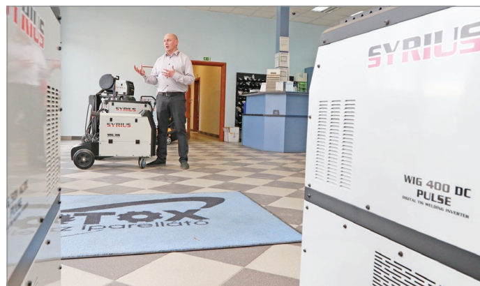
Több mint 20 éve vannak jelen a nehéziparban.

– Mi vagyunk az első digitális szolgáltatók, akik befektetés-célú közösségi finanszírozással foglalkozunk. Ez mind a régióban, mind Nyugat-Európában egyre bővülő iparág, idén megteremtették az egységes uniós jogszabályi környezetet is hozzá. A legnagyobb előnye, hogy nemcsak befektetőket, de ügyfeleket is lehet szerezni általa. Egy jól működő, sok ügyféllel és megrendeléssel rendelkező vállalkozás ezáltal könnyebben tud forráshoz jutni – és ezzel párhuzamosan építeni saját brandjét és a közösséget.