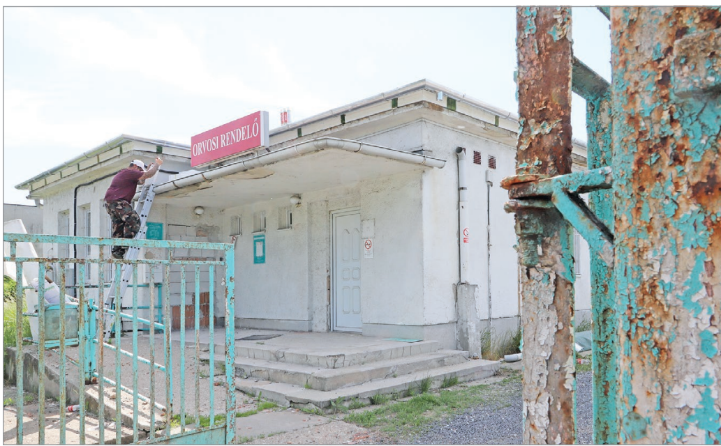
A Kiss Ernő utcai háziorvosi rendelőt is felújítják.

„Az gondolom, hogy jó kisugárzása és jó hatása lesz a városrész jövőbeni életére” – jegyezte meg a beruházás kapcsán, amelynek részeként – egyebek mellett – nagyobb előteret kap az épület a gyermekrendelés javára, illetve szociális blokkokká is bővül az épület.