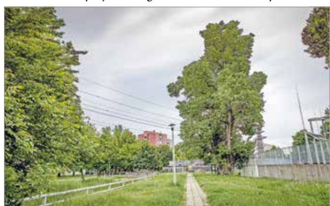
Közel 250 éves lehet a matuzsálem.