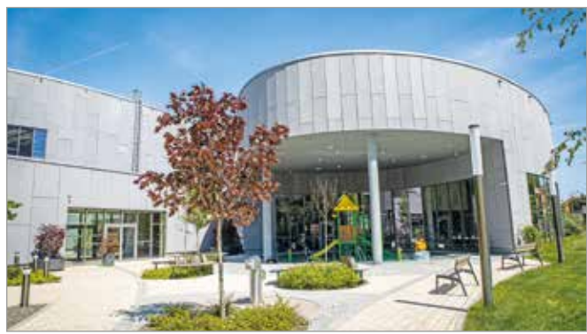
Folyamatosan szépítik a fürdők zöld felületeit.

– Valamennyi fürdő esetében folyamatosan szépítjük azok területeit. Az Elliptum frissen telepített, növényekkel teli parkrészt csak szigorú szabályok betartásával tudjuk kezelni.