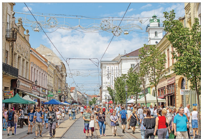
A vendégek olyan élményekre vágyanak, melyekkel akár fényképalbumukat is megtölthetik