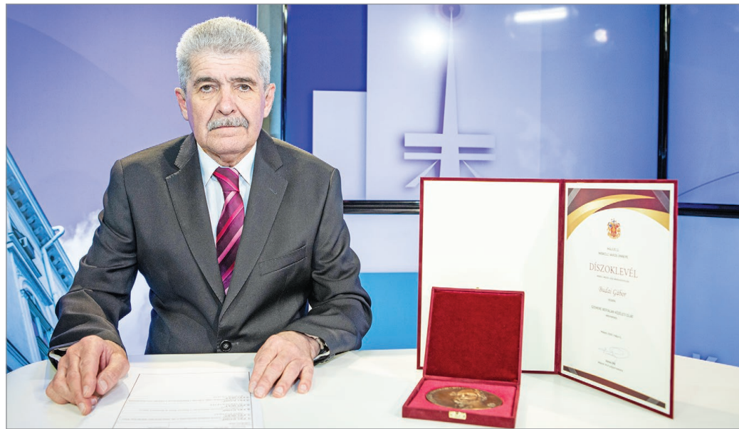
A városi tévének éppen harminc esztendeje oszlopos tagja.

Saját bevallása szerint mindig az olyan munkát szerette, ahol az emberek közelében lehetett: szeretett riporterként dolgozni, műsort vezetni, de reklámok, referencia- illetve más filmek nar-