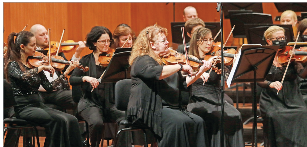
A magyar klasszikus zene napján is fellépnek a szimfonikusok.