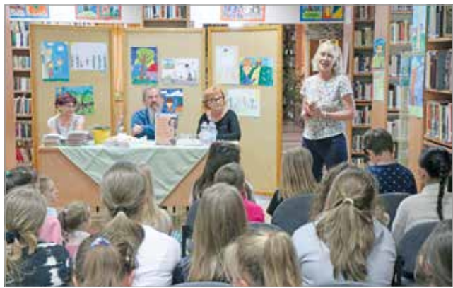
A kiállítást Móra Ferenc dédunokája nyitotta meg.