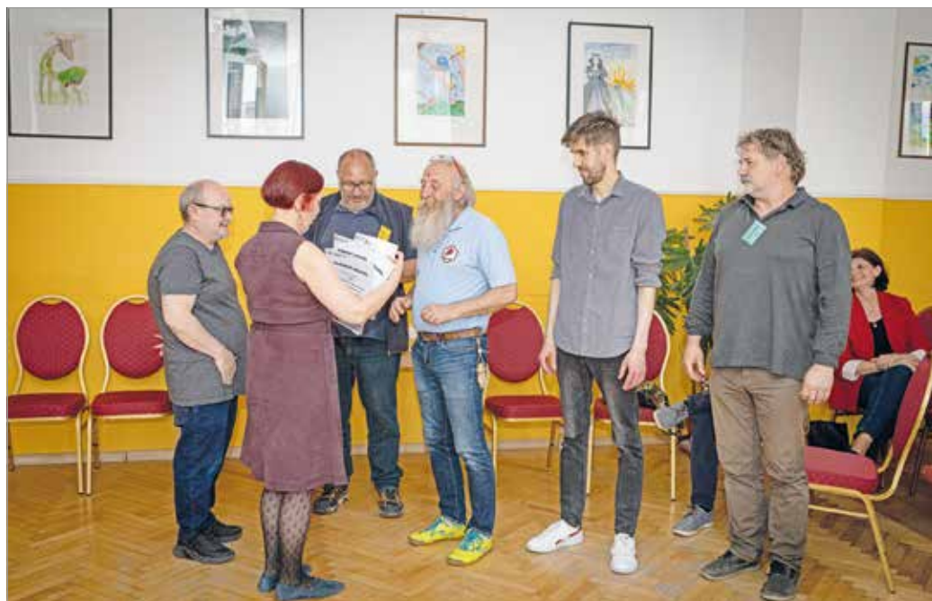
A Miskolci Erőleves csapat és mentoruk.

A munkafolyamatra úgy emlékezett vissza Zoltán, hogy az jól működött. Alapjárton azért, mert „erős jobbitó szándékkal bíró emberek áldozták erre a hétvégéjüket” – mint fogalmazott. Emellett kiemelte, hogy „egy félreérthető mondat, egy hangos szó vagy pikírt megjegyzés nem volt. Teljes harmóniában és békességben ment a dolog”.