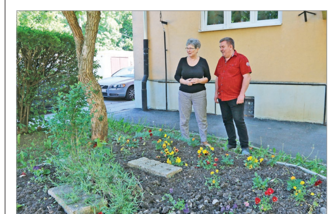
A lakók igénylik a zöld környezetet.