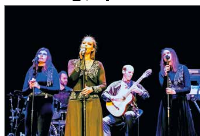
A Művészetek Háza ad otthont a jótékonyági koncertnek

Elmondta azt is, nagyon készülnek a június eleji kon-