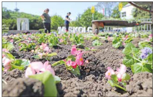
A projekt egyik célja a zöldterületek ápolása.