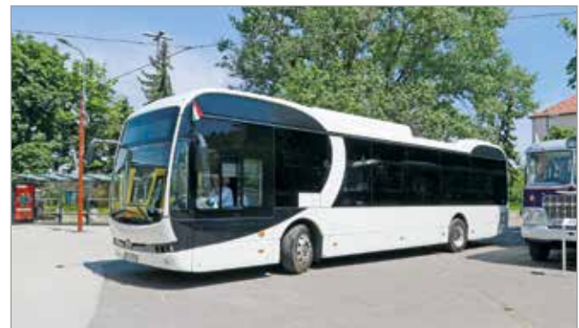
A sofőrök már elkezdték gyakorolni a tesztbuszon.