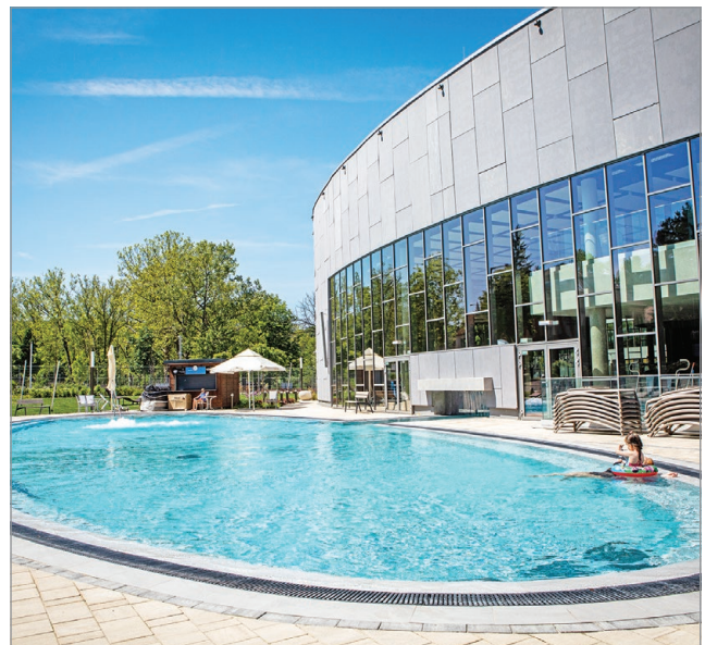
Szombattól várja a strandolókat az Elliptum Élményfürdő külső medencéje.