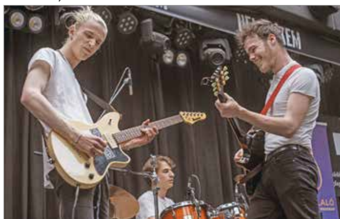
A Helynekem színpadán a Microwaves.

– Szépen tudunk fejlődni, most is építő jellegű kritikákat kaptunk. Igyekszünk újítani a műfajban. És szeretnénk