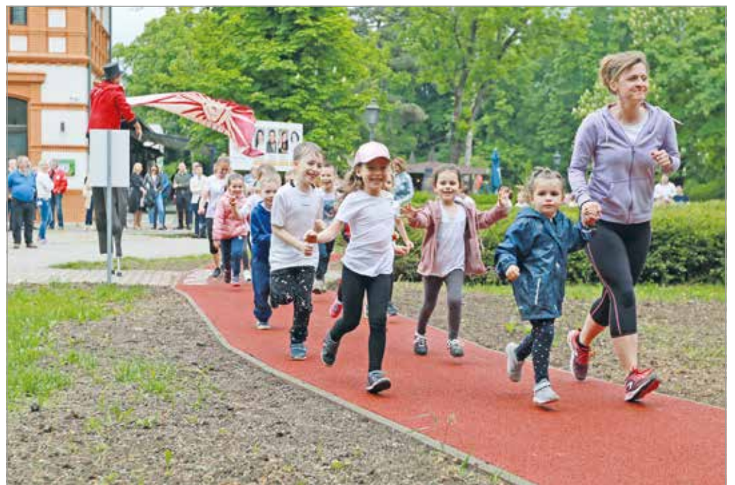
A verseny célja, hogy a résztvevők minél több kilométert megtegyenek a futókörön.

Miskolcon a nemrégiben átadott népkerti futókör lesz a házigazdája a sportversenynek 9 és 17 óra között. A cél, hogy az eseményre regisztráltak minél több kilométert megtegyenek bármilyen segédeszköz igénybevétele nélkül, jellemzően futva vagy gyalogolva a verseny útvonalát jelentő reortánborítású futókörön. A sportverseny ingyenes, azon bárki részt vehet, nevezni kizárólag a helyszínen lehet. Egy nevező bármennyit futhat vagy gyalogolhat, többször is visszatérhet a nap folyamán. A verseny napján a rajt előtt egy órával, 8 órakor nyit ki a versenyközpont a futópálya rajtcél zónájában, ahol nevezni, illetve a rajtszámokat átvenni lehet. Egyszerre legfeljebb 150 futó tartózkodhat a futókörön, ezért a szervezők 150 darab időmérő chippel felszerelt gumis rajtszámot tudnak biztosítani. A legtöbb kilométert