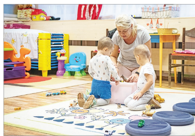
Jelenleg nyolcvannégy férőhellyel rendelkezik az intézmény.

met múlt heti közleményében a városvezetés, amiben azt is leszögezték: az önkormányzat elkötelezett a város fejlesztése mellett, ezért a jövőben is törekszik a pályázati lehetőségek kihasználására, „hiszen mindannyiunk közös érdeke, hogy Miskolc gyarapodhasson, fejlődhessen.”