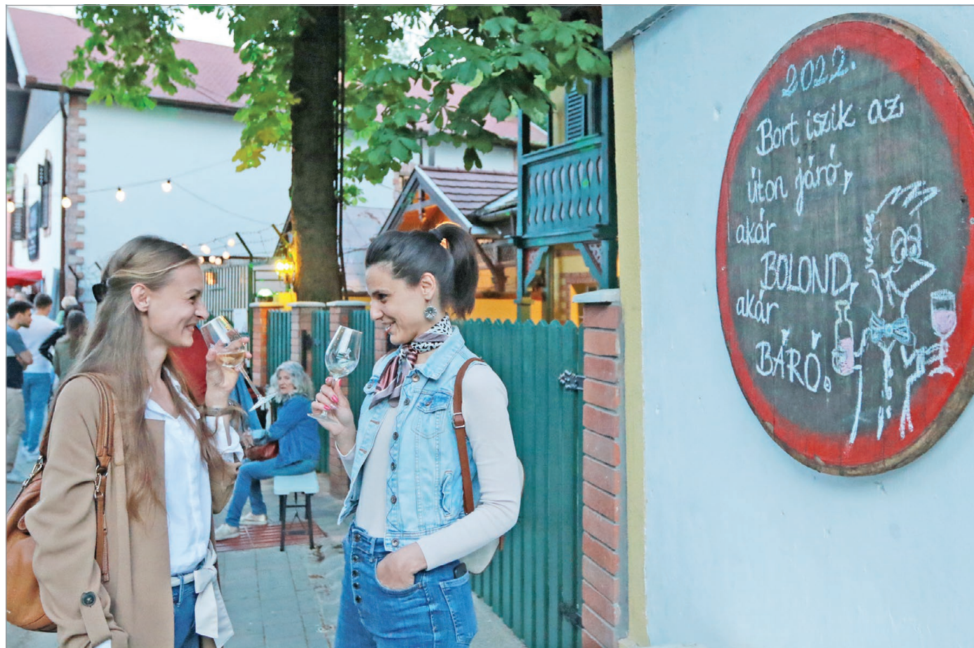
Hegyről le és hegyre fel – két napig nem volt megállás a történelmi Avason.

A jubileumi Borangolás minden várakozást felülmúlt: több mint húszezren látogatták meg a történelmi borospincéket az elmúlt hétvégén.