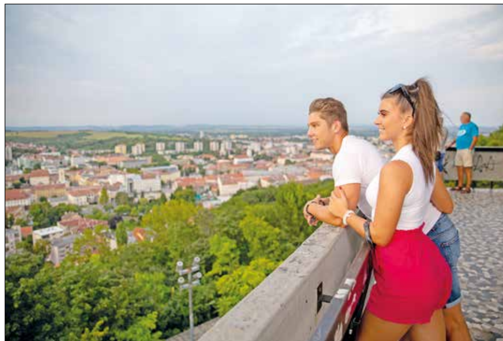
Főként a többnapos ajánlatoknál van jelentősége annak, hogy a Miskolc határain túli látóival is ráirányítsák a figyelmet

A rövidesen elrajtoló kampány főként Budapestet, a szomszédos megyéket és a térség településeit célozza majd. Ezzel párhuzamosan a hello-miskolc.hu oldal is megújul majd: a ráncfelvarrás nemcsak külsőségében, tartalmában is szembeötlő lesz – a fejlesztők szándéka szerint az információkat így még gördülékenyebben találhatják meg az érdeklődők. Továbbá kisfilmet is forgatnak a kampányhoz, mely komplett fotósorozattal és kreatív koncepcióval egészül ki.