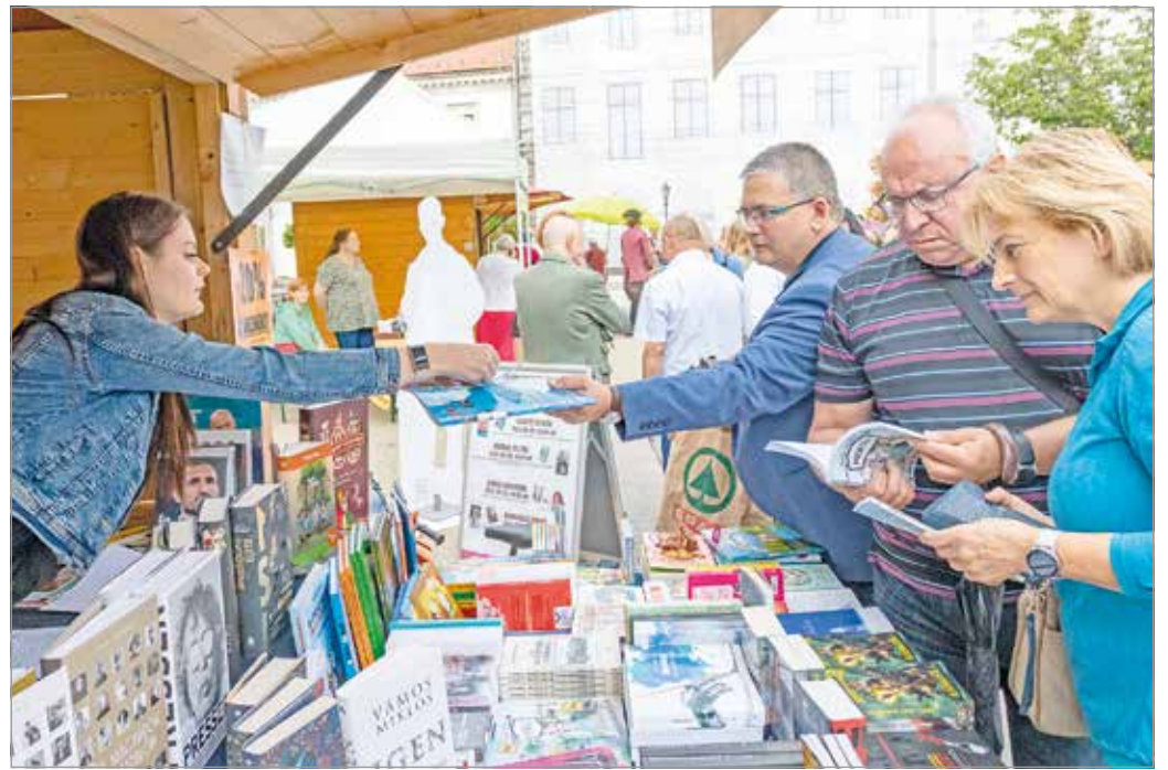
Számos könyves és szórakoztató programmal készülnek a szervezők.

– Ők azok, akik táplálják bennünk a könyvelmények utáni vágyakozást, ugyanakkor mindig nyitottak azokra a rendezvényekre, versenyekre, amelye-