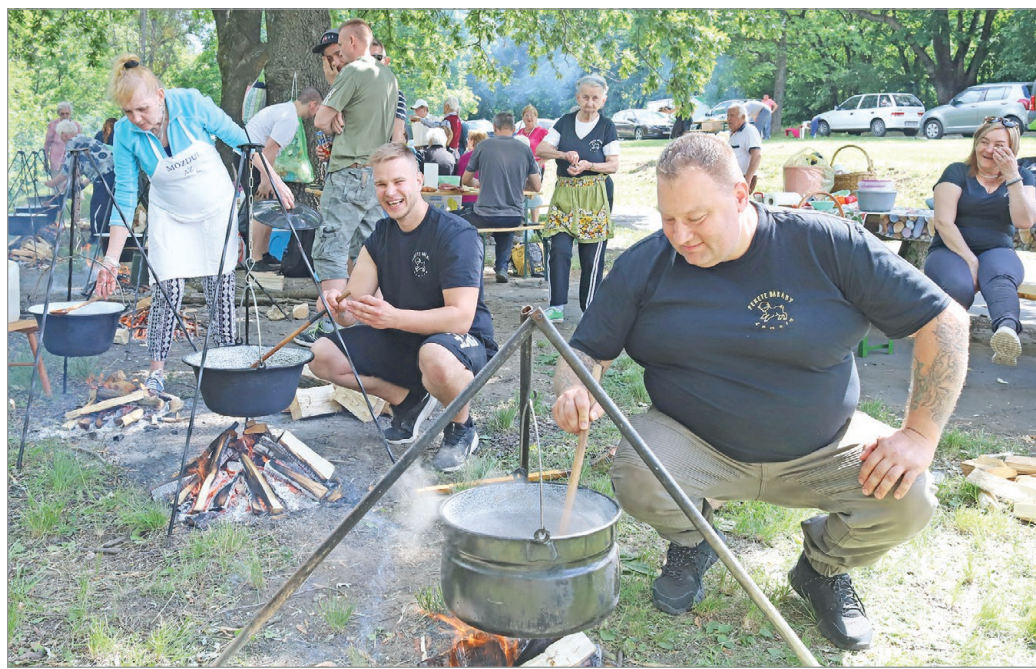
Tizenhetedik alkalommal rendezték meg gyereknapal egybekötött főzőversenyt az avastetői sportpálya szomszédságában.

a főzőversenyt, és Miskolcra is nagyon jó véleménnyel vagyok: a város szép, az emberek kedvesek, mindig jól érzem itt magam” – árulta el.