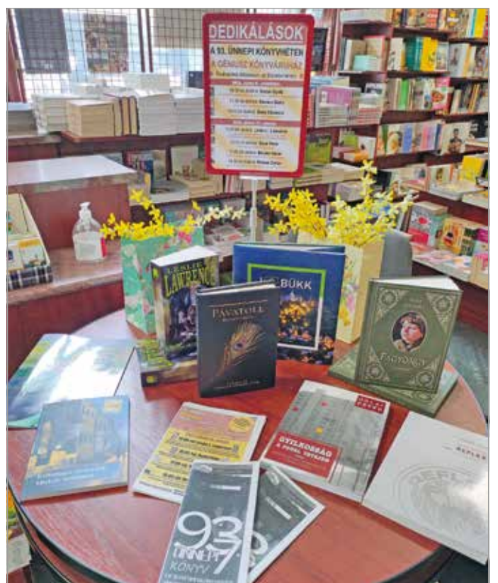
A régió legkedveltebb szerzőit hozza Miskolcra a Génusz