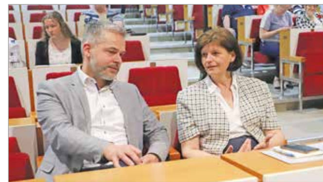
A szegregátumokban élők helyzetét szeretnék javítani.

A kísérleti mintaprogram 2024-ben zárul, ezt követően a Tetemvár és a Bábonyibérc után újabb miskolci helységeket és újabb lakosokat vonnának be a programba. T.Á.