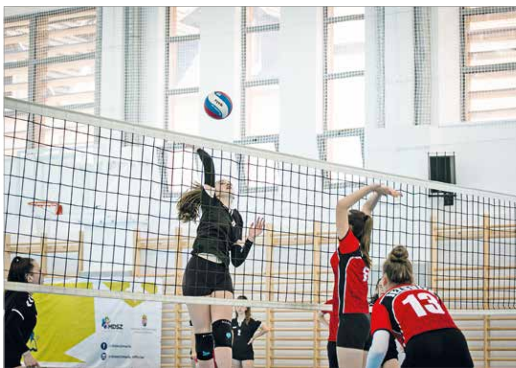
A jezsuita gimnázium röplabdázói (piros mezben) is megkezdték a versenyt pénteken.

A lányoknál a Fényi Gyula Jezsuita Gimnázium, Kollégium és Óvoda, a fiúknál a Ka-