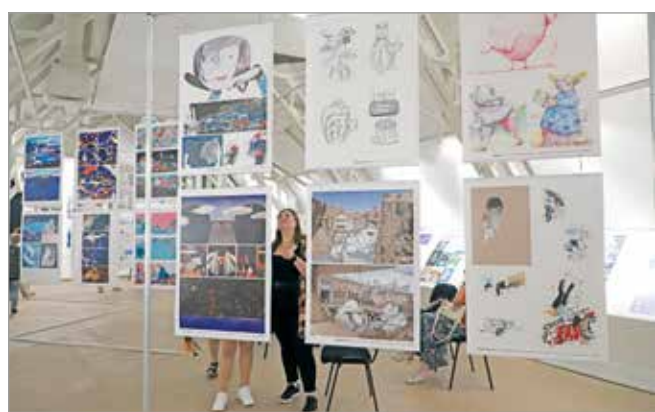
A tárlatnak a galéria Kondor-terme ad helyet.

A fesztiválra négy kategóriában lehetett pályázni. A szervezők várták a különböző szépirodalmi kötetek, tudományos művek illusztrációit, emellett szöveg nélküli lapozókkal, narratív képkönyvekkel is nevezettek a grafikusok. A negyedik kategóriában pályázók idén évfordulós alkotók