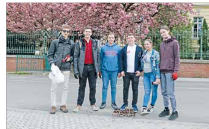
Korábban a Lévy-gimnázium környékére szerveztek akciót.