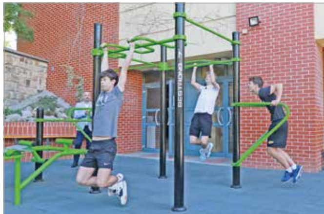
Beleerősítenek a gimnáziumban.

A gimnáziumban komoly hagyományai vannak a sport-