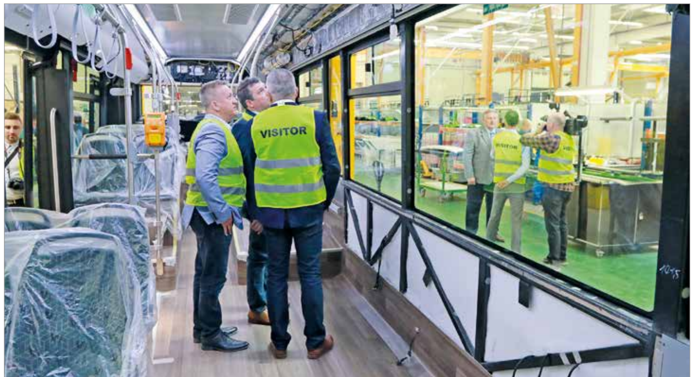
A járművek beszerzésére korábban 1,5 milliárd forintnyi támogatást nyert a város.

Augusztus elejére megérhetnek azok az új, teljesen elektromos autóbuszok, amelyek az MVK Zrt. buszflottájának részeként közlekednek majd Miskolcon.