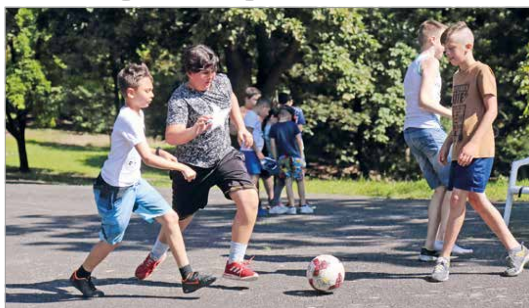
A perecesi napközi tábor július 4-én nyitja meg kapuit.

A Balatonmáriafürdői Gyerektábor június 16-ától augusztus 31-éig fogadja a diákokat, turnusonként közel 120 gyermekkel. A táborban 10-16