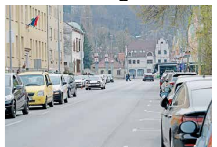
A projekt keretében felújítják a Kálvin János, a Rácz György és a Petőfi utcát.

– Az ilyen beruházások, amik ha kis lépésekkel is, de segítik a klímasemlegesség elérését, a széndioxid-kibocsátás csökkentését – zárta mondanóját a polgármester.