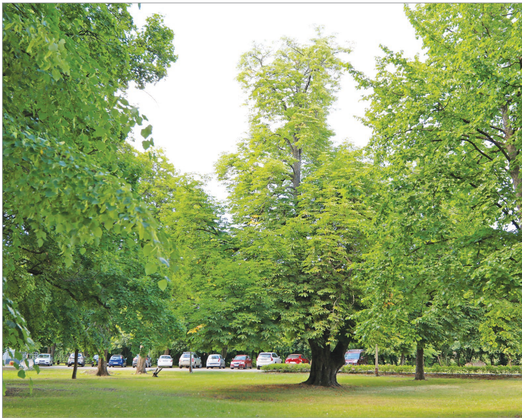
A park több mint harmincöt éve védettséget élvez.

Arra vonatkozóan nincsenek hivatalos információk, hogy az évek alatt milyen vál-