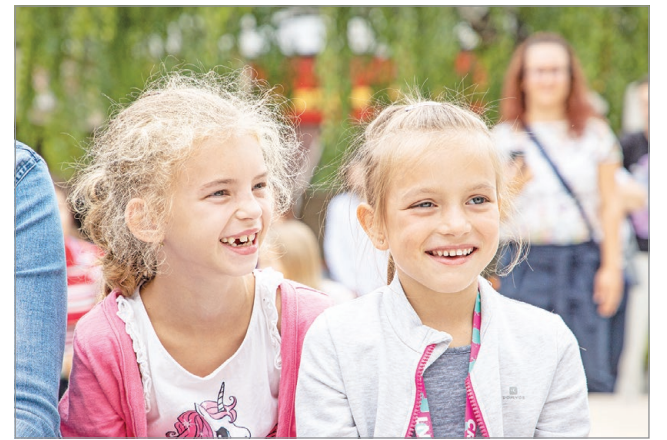
A legkisebbeket is izgalmas programokkal várták.