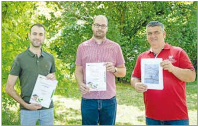
A képviselők is csatlakoztak a programhoz.