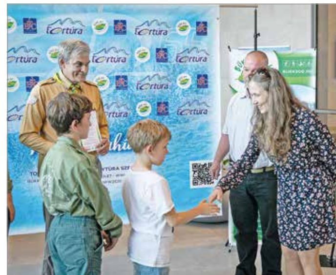
Szerdán tartották az ünnepélyes díjátadót.