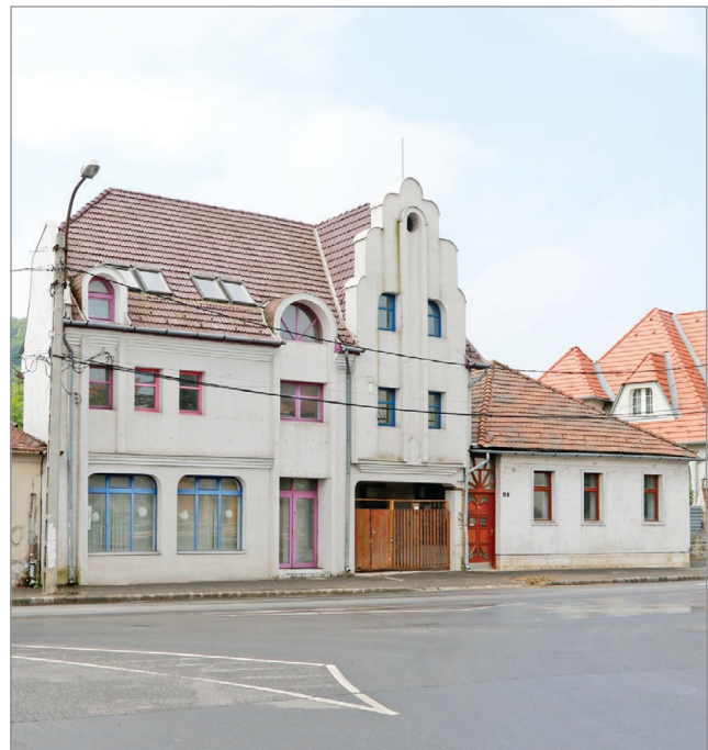
A bontásra váró házakat évekkel ezelőtt kisajátították, és azóta üresen állnak.