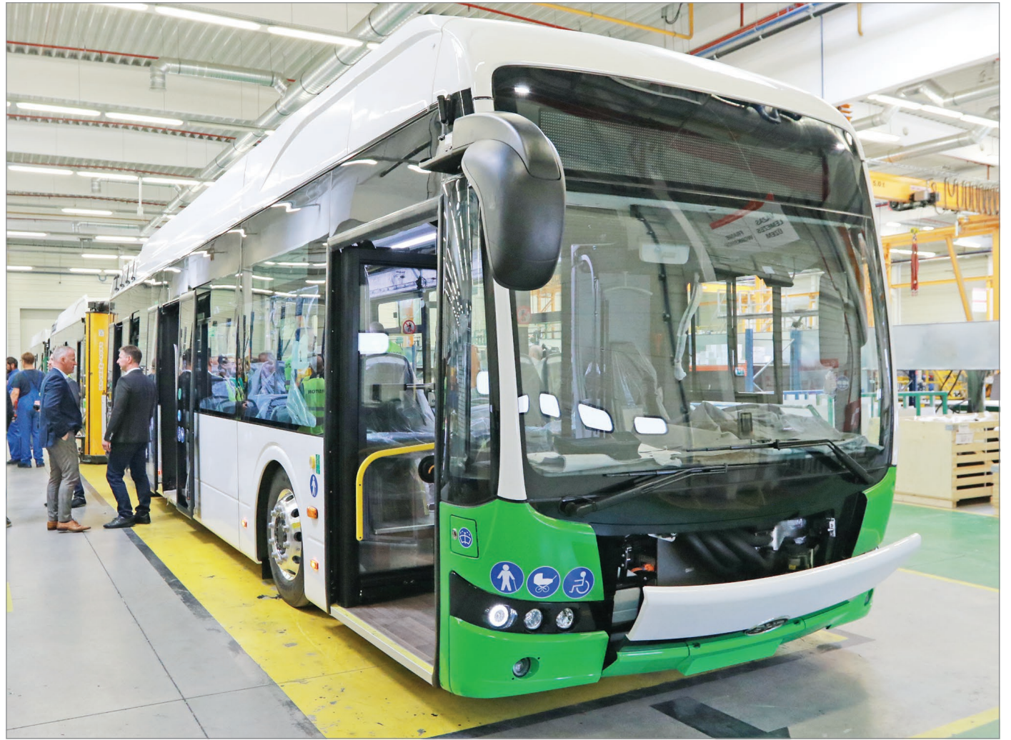
A környezetkímélő, kényelmes, biztonságos és intelligens autóbuszok befogadóképessége eléri a 82 főt.