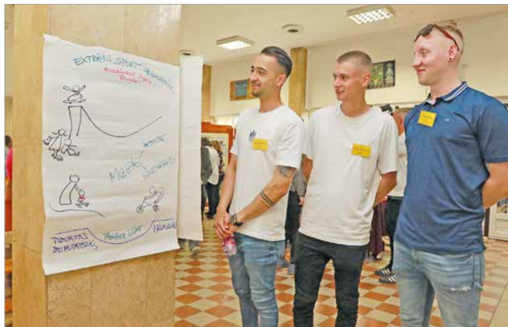
Egyeztetések közepette az Ötletmaratonon.

A közös gondolkodás során Róbert szerint nem éltek meg különösebb mélypontokat, gördülékenyen tudtak együtt dolgozni. „Ha nyitottan állsz hozzá a másikhoz és rugalmas vagy, akkor többet is ki tudsz hozni a történetből a vitánál” – mondta.