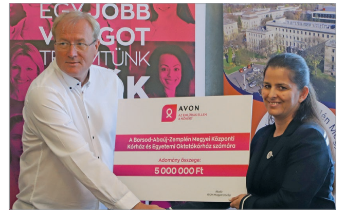
A vásárolandó készülék huszonegyedik századi technológiát képvisel.