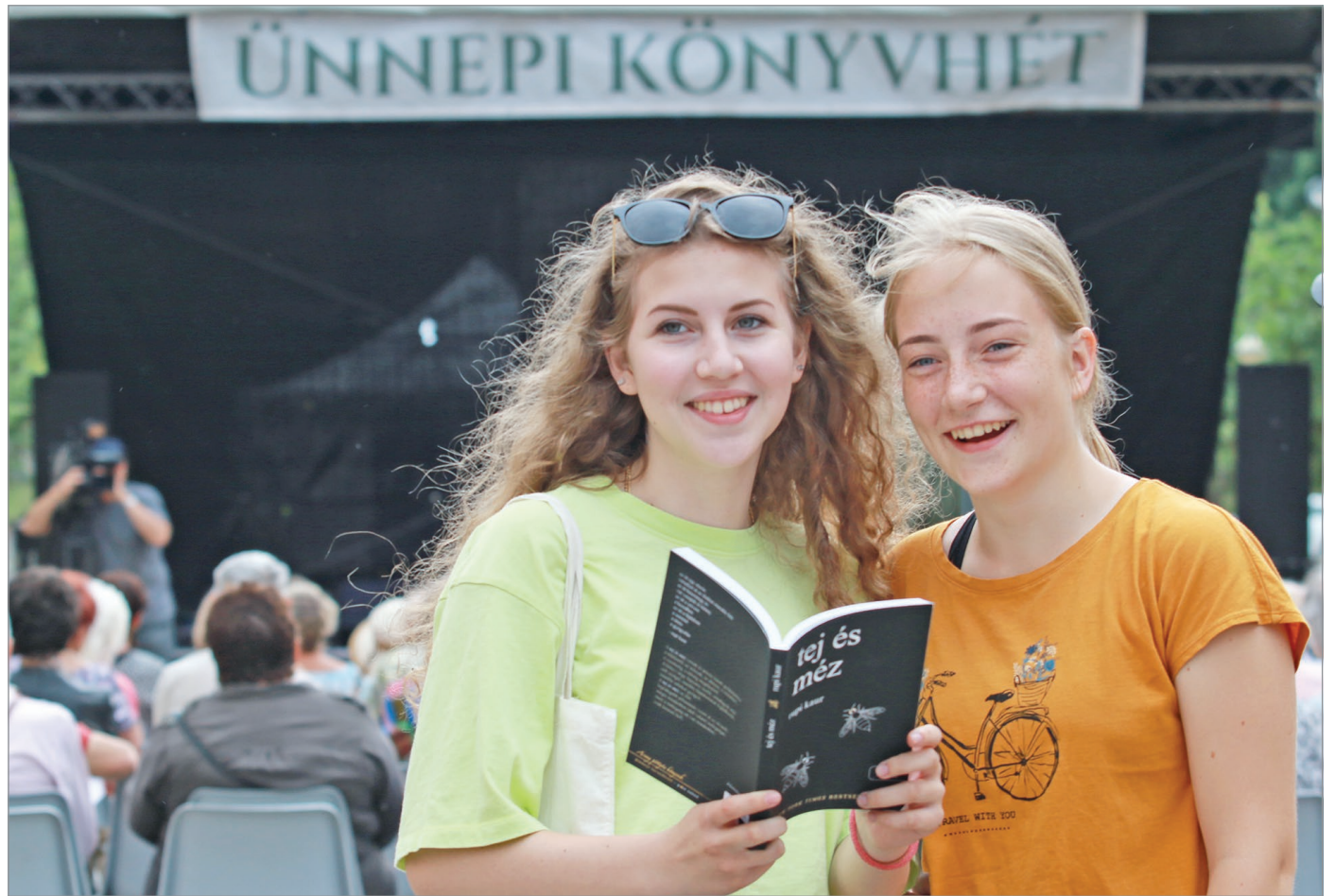
Az olvasókat számos programmal invitálták a szervezők közös ünneplésre.

Csütörtökön elkezdődött a 93. Ünnepi Könyvhét és 21. Gyermekkönyvnapok: pavilonok költöztek az Erzsébet térre és hegyes tetejű sátrak mint könyvkastélyok emelkedtek a térföveken.