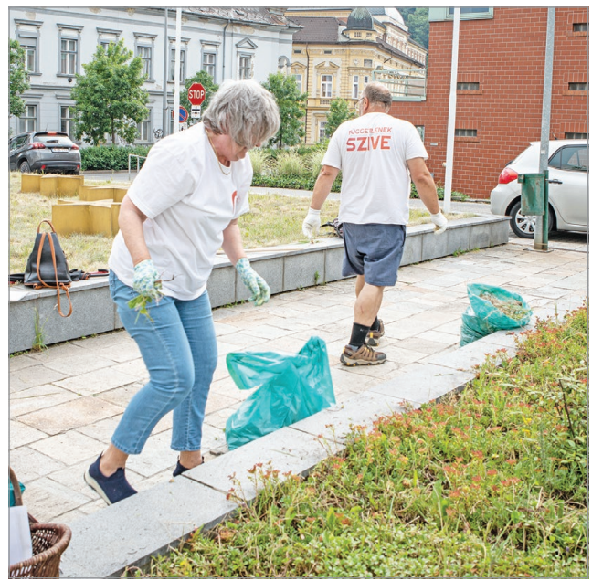
A munka a virággyások gyomlálásával kezdődött.