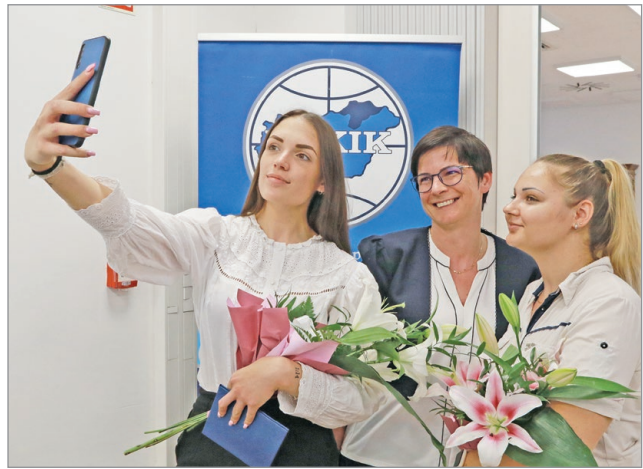
Biztosított a szakmai utánpótlás.