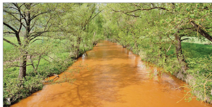
Február közepe óta tart az ökológiai katasztrófa a Sajón