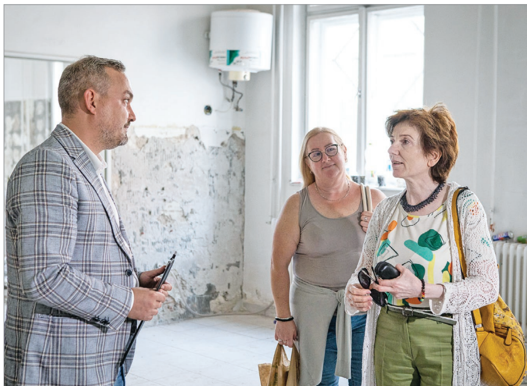
Csütörtökön helyszíni bejárásról tájékoztatták az érintett orvosok képviselőjét.