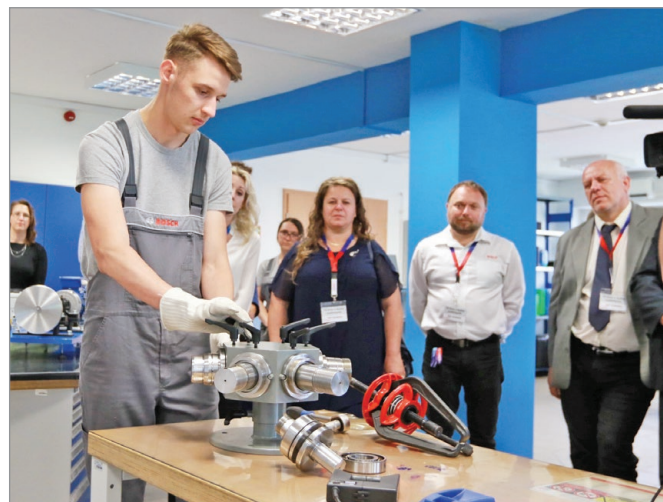
A diákok az iskola mellett a tanműhelyekben is tanulnak.