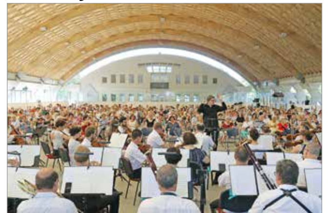
A jégpályának kiváló az akusztikája.

Amiként az Aperitif koncerttel megnyitja, úgy a Promenáda koncertekkel zárja az évadot a Miskolci Szimfonikus Zenekar.