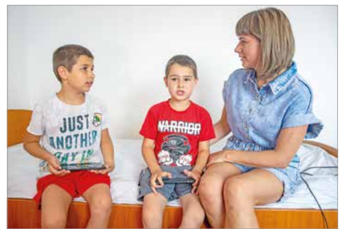
Tavasz óta mintegy száznyolcvan ukrain menekült édesanyja, nagymama és gyermek él a Károly Hotelben.

Eszerint az otthonuktól több száz kilométerre, idegen környezetben élő kicsik – akár-