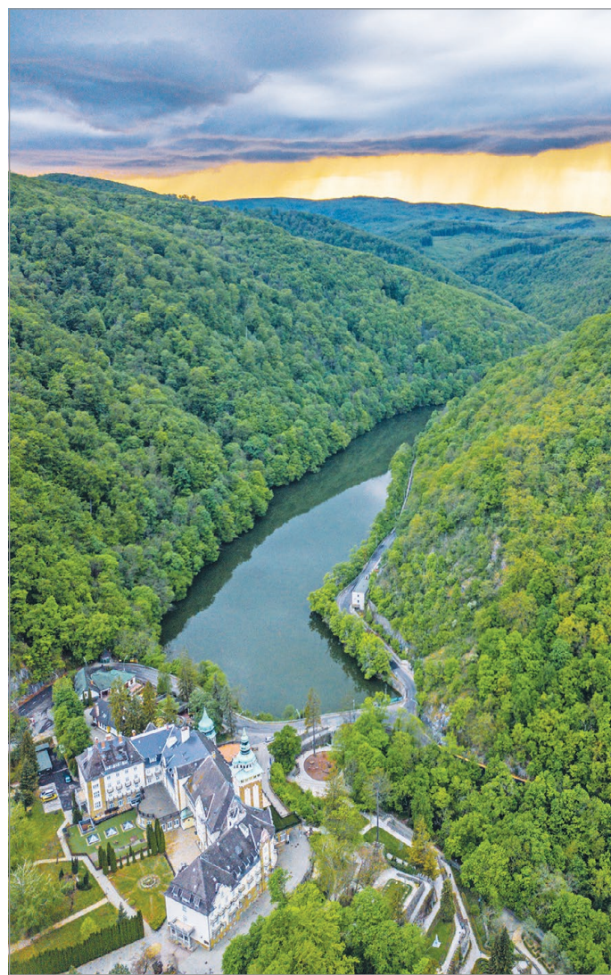
Mesebéli táj a hegyek ölelésében.

Hát így indult az én első nagy utazásom a messzi kék hegyek közé. Kétszer kellett átszállnunk olyan buszokba, melyek tömve voltak gyerekekkel meg felnőttekkel, de végül megérkeztünk. Ott, ahol most a kisvasút megállója melletti, szépen gondozott park van, akkor még nagy füves terület, családi piknikezőhely volt. Nővéreim leterítették a pokrócokat, és a család leheveredve élvezte a napsütést. Én a patakpartra telepedtem, és a vízben cikázva úszó halakat figyeltem, meg a dinnyénket, amit egy akkor divatos, fonott műanyag szatyorban ide-oda sodort a víz. Nem messze állt egy ház – azt hiszem, ma panzió –, aminek kertjében víz hajtotta fűrészelő törpék meg mindenféle mesefigurák vol-