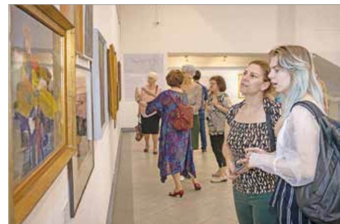
A kiállítás csütörtökön nyílt meg a Rákóczi-házban.