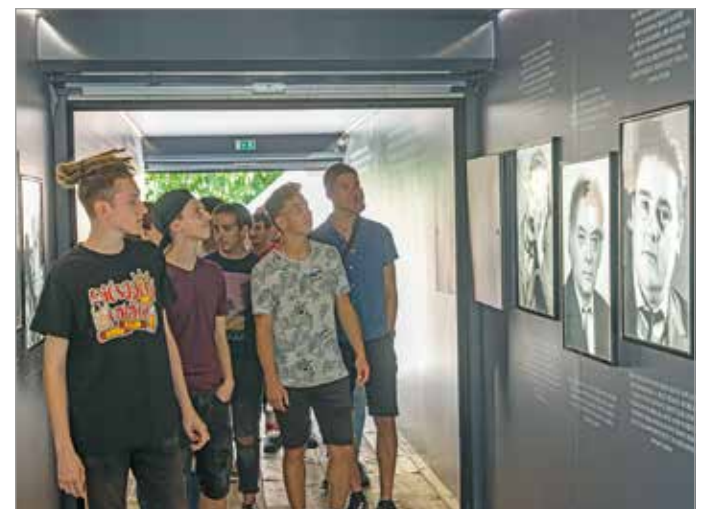
A vándorkiállítás június 21-éig tekinthető meg a Hősök terén.

A Trianon 100 kiállítás részeként négy nagy, teljesen átalakított és berendezett kon-