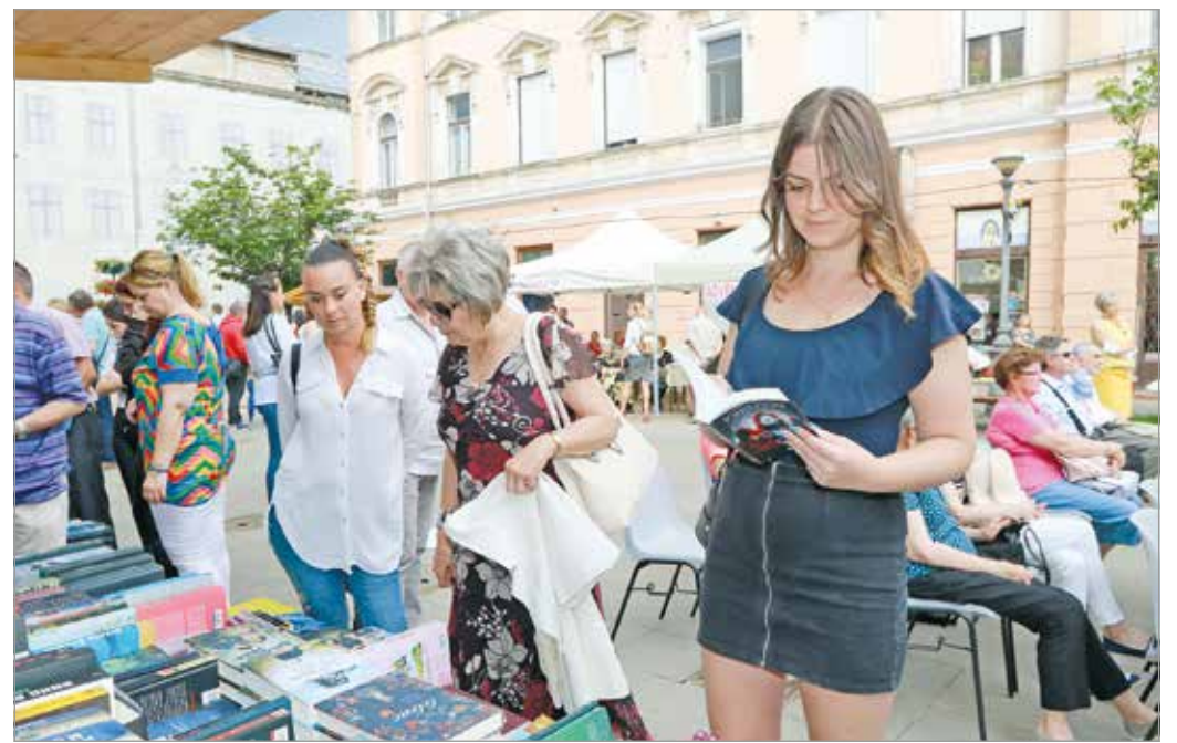
Csütörtökön és pénteken is megvásárolhatták a könyvhét slágereit az olvasók.