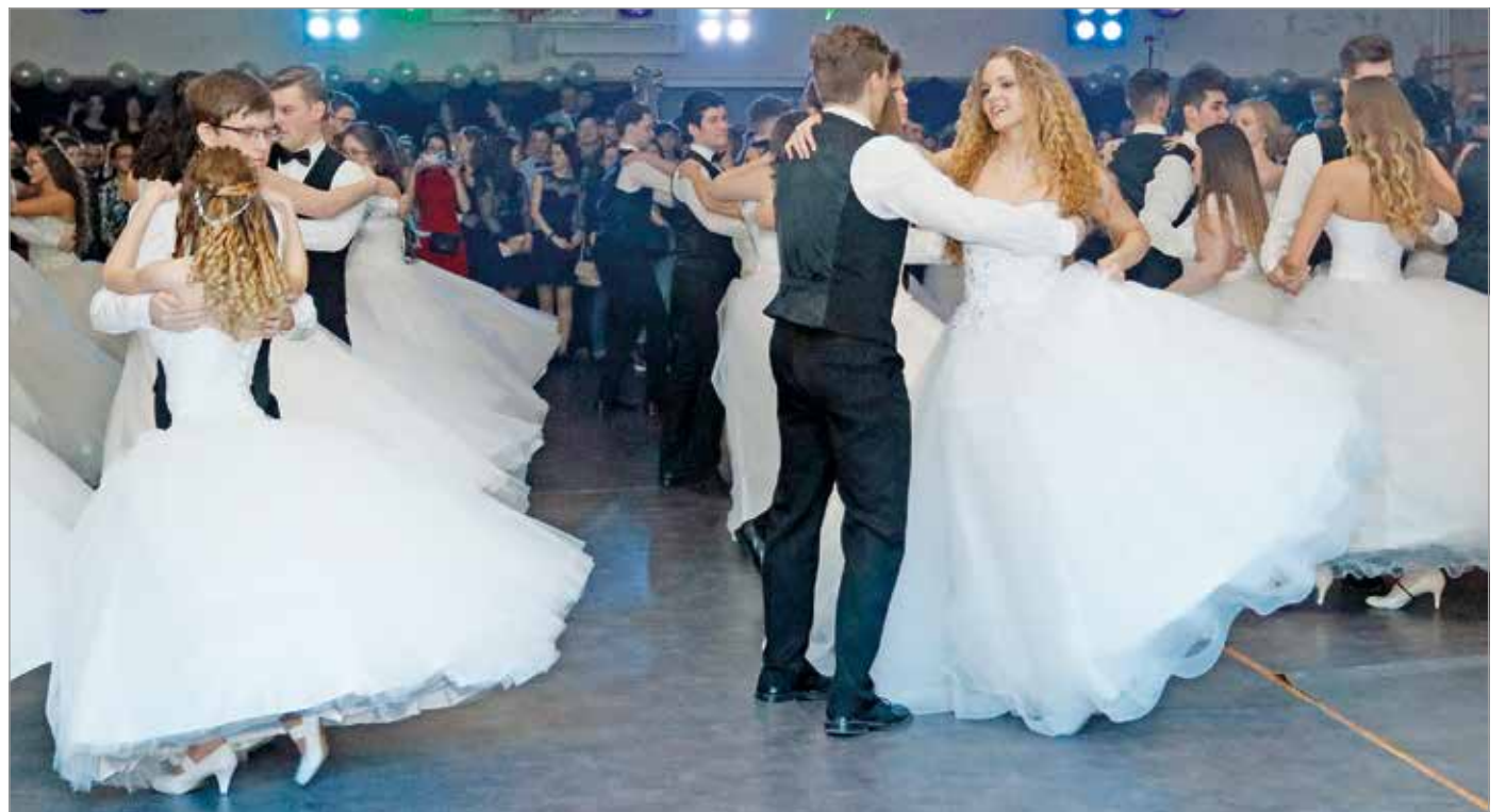
Szép ruhák, komoly táncok és vacsora is várja a bálzókat.

A város teljes ifjúságát bálozni hívja a diákönkormányzat június 24-én.