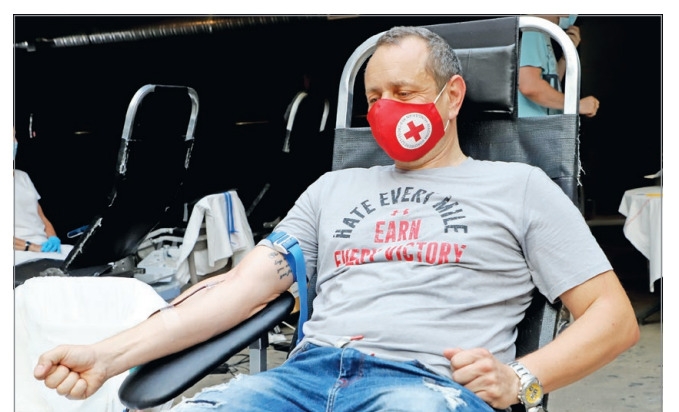
A hagyományos nyáriindító véradást idén negyedik alkalommal rendezték meg.

Tavasz óta mintegy kilencven gyermek él Miskolcon, az otthonuktól távol, sokkal szerényebb körülmények között és idegen környezetben. Ezek a gyermekek a nyarat is ideiglenes szállásukon, a négy fal között töltik majd. A Vöröskereszt vezető szerepet vállalt a családok mindennapi ellátásában. A nyári időszakban a gyermekek szabadidős programjainak megszervezése pedig kiemelten fontos, ebben kérték most a miskolciak segítségét. Az adománygyűjtés mellett pénteken véradást