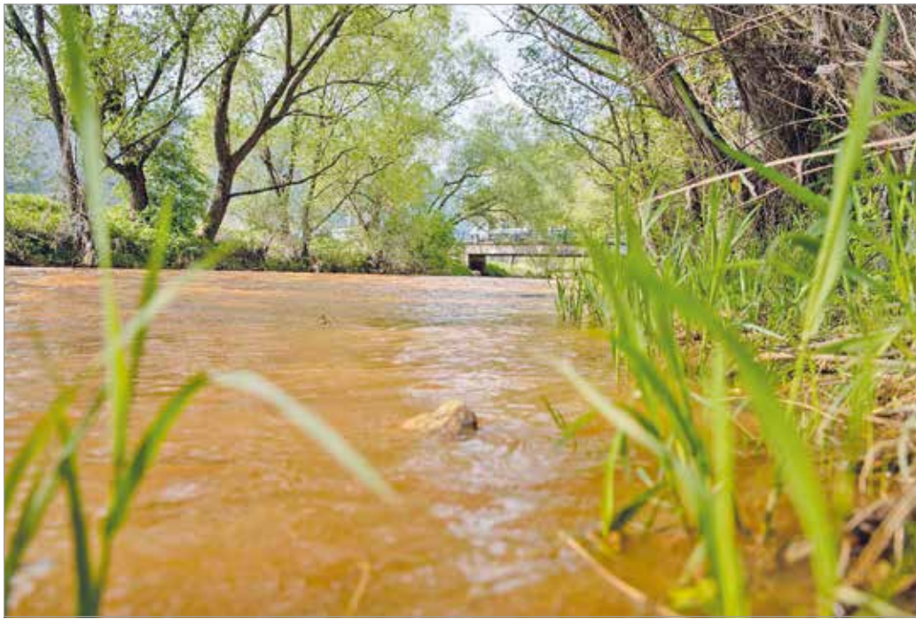
A folyóvizek regenerálódási képessége gyorsabb, mint a tavaké.

– A folyóvizek regenerálódási képessége szerencsére gyorsabb, mint például egy