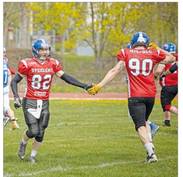
A rájátszás szempontjából fontos összecsapás következik.