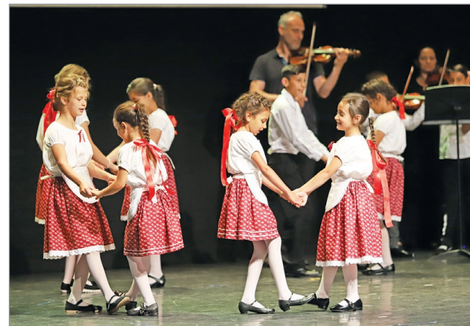
A gálaműsoron az intézmények növendékei léptek fel.

Mint egyházi feladatellátó, a Nyitott Ajtó Baptista Központ immár tíz éve vesz részt a városi és szakképzési feladatellátásában.