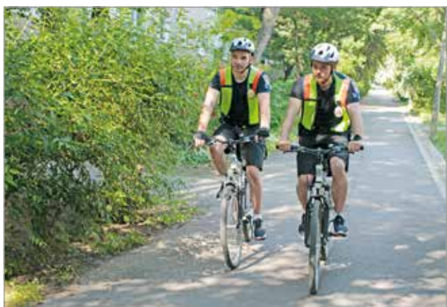
Kerékpáron gyorsabbak és hatékonyabbak a rendészek.