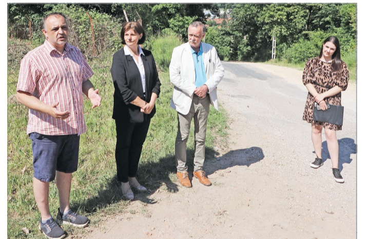
A felújított útnál tartották a sajtótájékoztatót.

Mint az a helyszínen is elhangzott: az utat legfőképp azért kellett rendbe tenni, hogy a hegy tetején lévő, a Szimbiózis Alapítvány által fenntartott bentlakásos otthon fogyatékkal élő gondozottjainak az el látása és szállítása ne forogjon veszélyben. – A majorságban jelen pillanatban százan élnek, mozognak, dolgoznak. Több jelentős intézmény, fejlesztő-