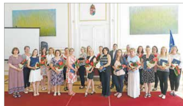
Megjutalmazták a több éve pályán levő védőnőket.

Húszan vettek át elismerést a védőnők napja alkalmából hétfőn a város-házán.