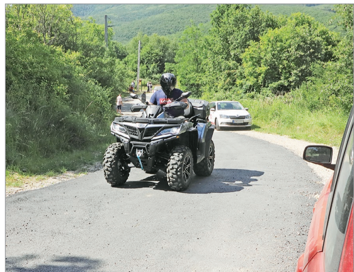
Az út rendbetétele két héttel ezelőtt kezdődött.