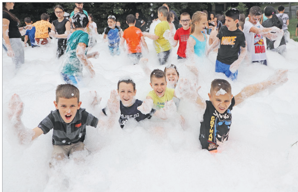
Bárhol is tartják a habfürdőt, az apróságok mindenütt boldogan játszanak.

Nem is csoda, hogy rekordmagas részvételre számítanak az idei