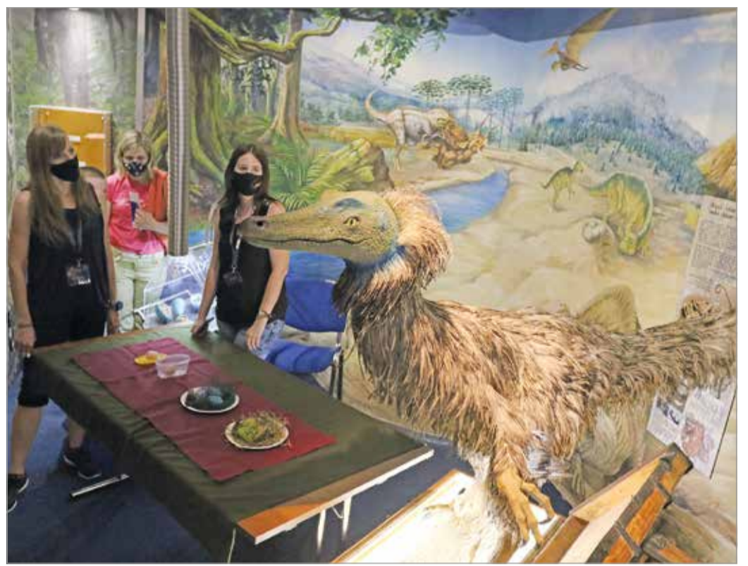
Tavaly is érdekes programokkal várták az érdeklődőket a múzeumok éjszakáján.

A legnagyobb dobása az esemény valószínűleg az, hogy az évek óta zárva tartó Lézerpont Látványtár – új nevével Folk Complex – egykori kiállításával is bekapcsolódik a rendezvény forgatógábjába. Itt pedig illik néhány másodpercnyi feszült csöndet tartani, vagy ideképzelné egy fokozódó erejű dobpergést, mert: a Barna György nevéhez fűződő, teljes mérték-