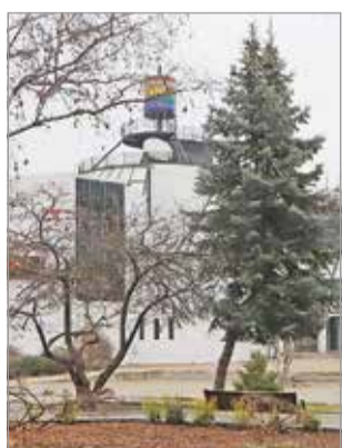
Új funkciót kap egy napra a tér

A programot beharangozó sajtótájékoztatón, kedden délelőtt elhangzott: a kosárlabda utcai változataként is említhető olimpiai sportág egyre népszerűbb mind a rendszeresen, mind a szabadidőben sortolók, a baráti vagy akár családi csapatok számára, így minden esély megvan arra, hogy megdől majd a tavalyi rekord, ami-