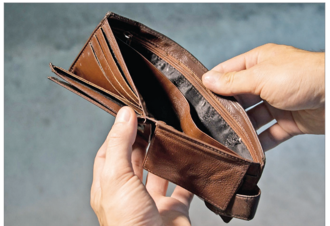
Egyik napról a másikra kiürülhet a bugyellárunk.

– Előrebocsátom, hogy mi egy középosztálybeli család va-