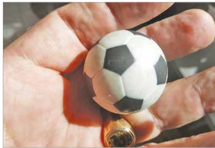
Itt még pihen a labda a kézben...