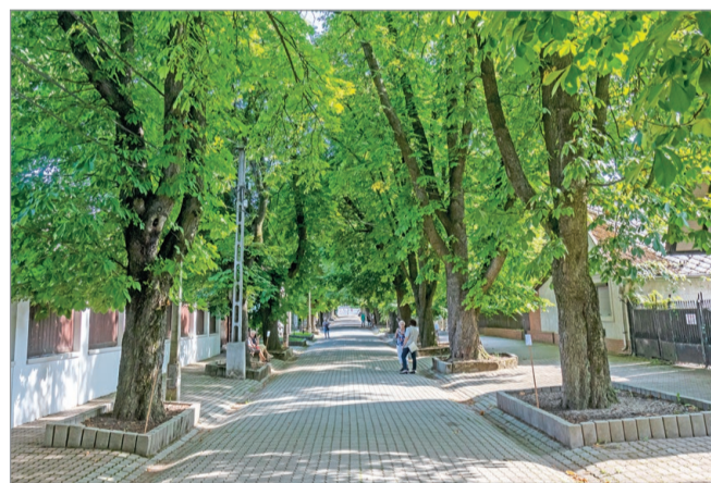
Tovább élhetnek a gyönyörű gesztenyefák.