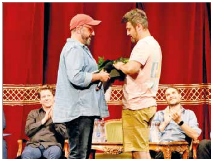
Magyarország legjobb színháza lett a miskolci.