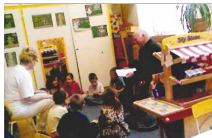
Felkereste az író a vasgyári óvodát is.