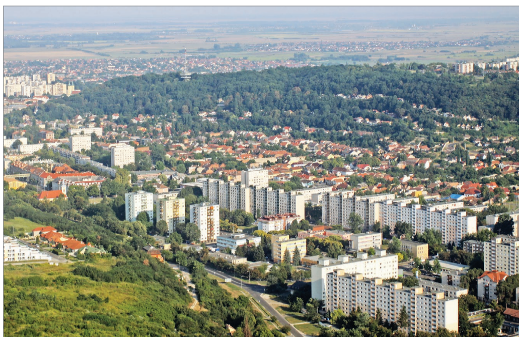
Bámulatos képességekkel rendelkezünk, hogy időnként megkeserítsük szomszédaink életét, ez alól a megyeszékhely sem kivétel.

– Aki például a szomszédjai hangoskodását, hangos ze-