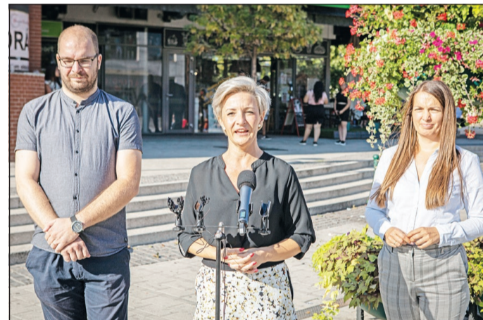
A Jobbik miskolci sajtótájékoztatója.