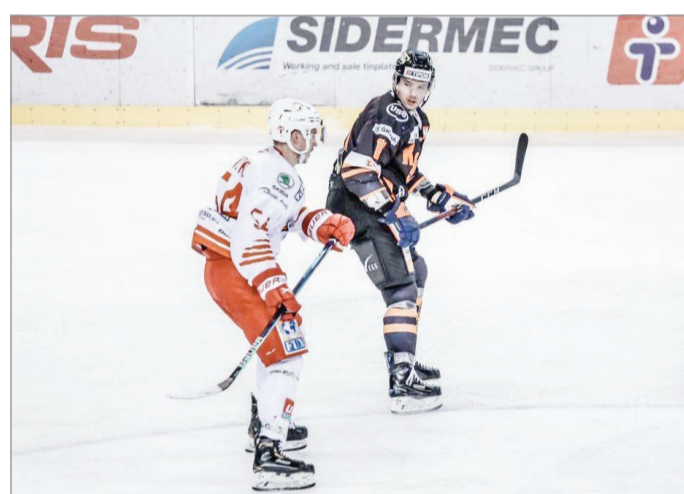
A felkészülési meccsekkel elkezdődött a jeges szezon