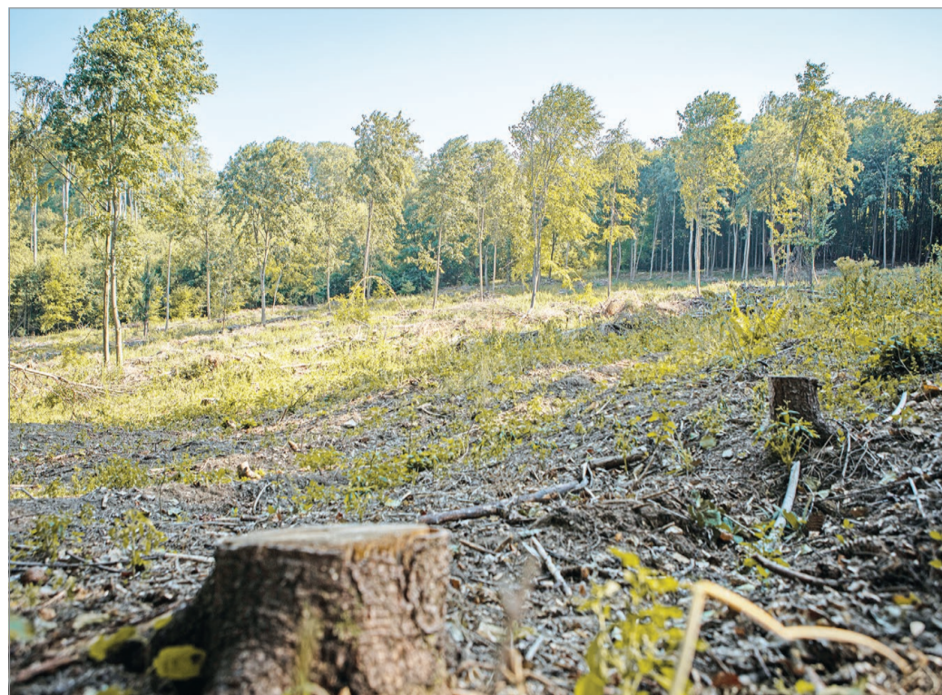
Tarvágás Bánkút közelében.

– „Miskolc polgármestere és városvezetése úgy döntött, a kormányrendelet adta lehető-