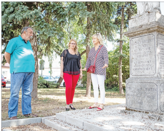
A hejőcsabai I. világháborús szobor megújul.