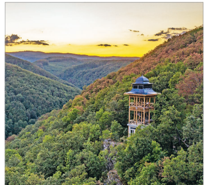
Érthető a turisták kíváncsisága.

A turisták türelmetlensége és kíváncsisága egyébként érthető, a legendás lillafüredi Zsófia-kilátó és a Felső-Hámorból odavezető 1.3 kilométeres tanösvény (eredeti nevén: sétaút) hosszú évtizedek után épült újjá. A munkálatokra még egy GINOP-os pályázaton nyert el körülbelül 50 millió forintot a Magyar Természetjáró Szövetség és az Északerdő Zrt. A beruházás tavaly ősszel kezdődött el a kilátó és a tanösvény esetében