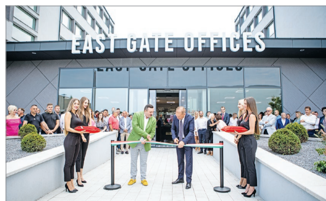
Négyszeresére nőtt a térség minőségi irodaterületeinek mennyisége.