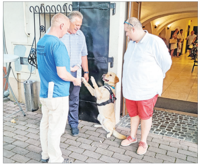
A baráthegyieknek is gyűjtöttek.