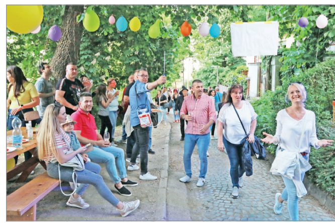
A miskolciai ismét felfedezték az Avas-t.