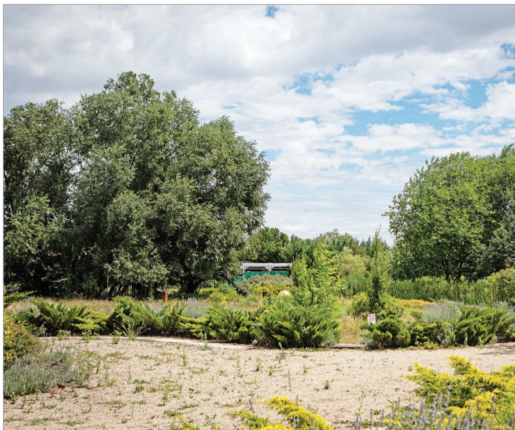
Az egykor csodás környezetre rá sem lehet ismerni.

Érdeemes tudni, hogy a mostani bérlő, a La Crema Kft. 5 évre elővásárlási jogot kapott, az önkormányzat pedig vállalta, hogy felméri a kert értékesítési lehetőségeit, és megvizsgálták, hogy az eladás mennyiben befolyásolja a közelben található Tavi-forrás működését, ami ivóvízzel látja el Miskolc egy részét. A város saját forrásból elkészítette a tanulmányt, amiben az újabb geofizikai mérések alátámasztották: a karsztvíztároló közelében fekvő Tündérvár alatt kellő vastagságú és minőségű védőréteg található, így szakmailag megalapozottnak tűnik majdnem a teljes Tündérvár belső védőterü-