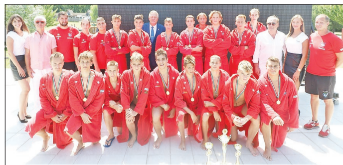
Miskolciak öröme.