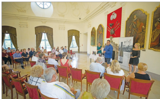
A Miskolci Szimfonikus Zenekar ezután sem pihen...

Augusztus 26-án a már 5 éves múltra visszatekintő Kastély-szerenád sorozat kö-