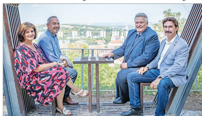
Miskolc új kilátópontja népszerű helyszín lesz a jövőben.

Városi piknik keretében adták át csütörtök délután a megújult Horváth-tetőt. A fejlesztés keretében a területet az elmúlt hónapokban úgy alakították ki, hogy a megújult teraszok minden korosztály számára biztosítsák a változatos kikapcsolódás és a szabadidő aktív eltöltésének lehetőségét.