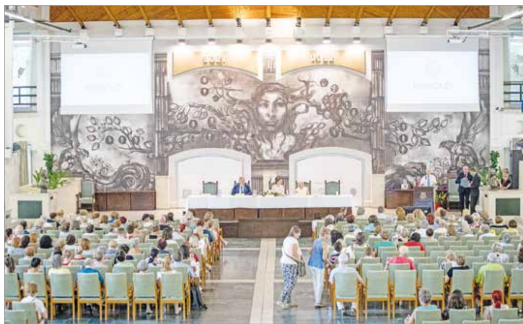
Lelkielsősegély-konferencia az egyetemen.

A miskolci önkormányzat is támogatta a rendezvényt, és Veres Pál polgármester is köszöntötte a telefonos elsőse-