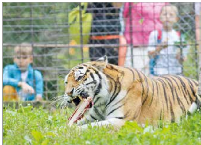
Kedvelik a gyerekek Zénót, a bengáli tigrist.

A Miskolci Állatkert és Kultúrpark augusztus 20-án ünnepli megnyitásának 39. évfordulóját: az alkalomhoz méltón egész napos ünnepi programokkal, meglepetésekkel várják a látogatókat. BM