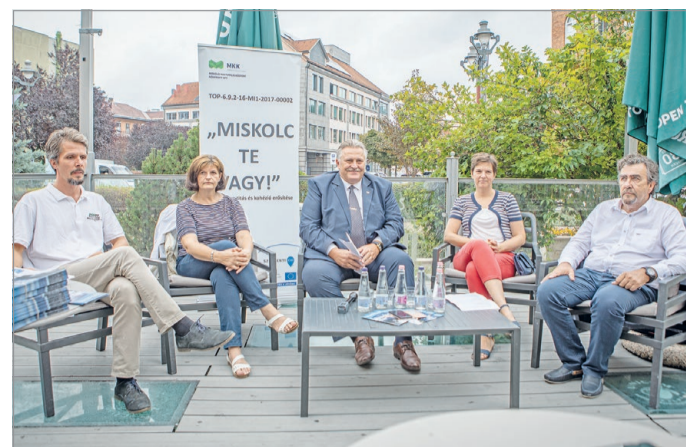
A szervezők hétfőn sajtótájékoztatót ismertették a rendezvény részleteit.