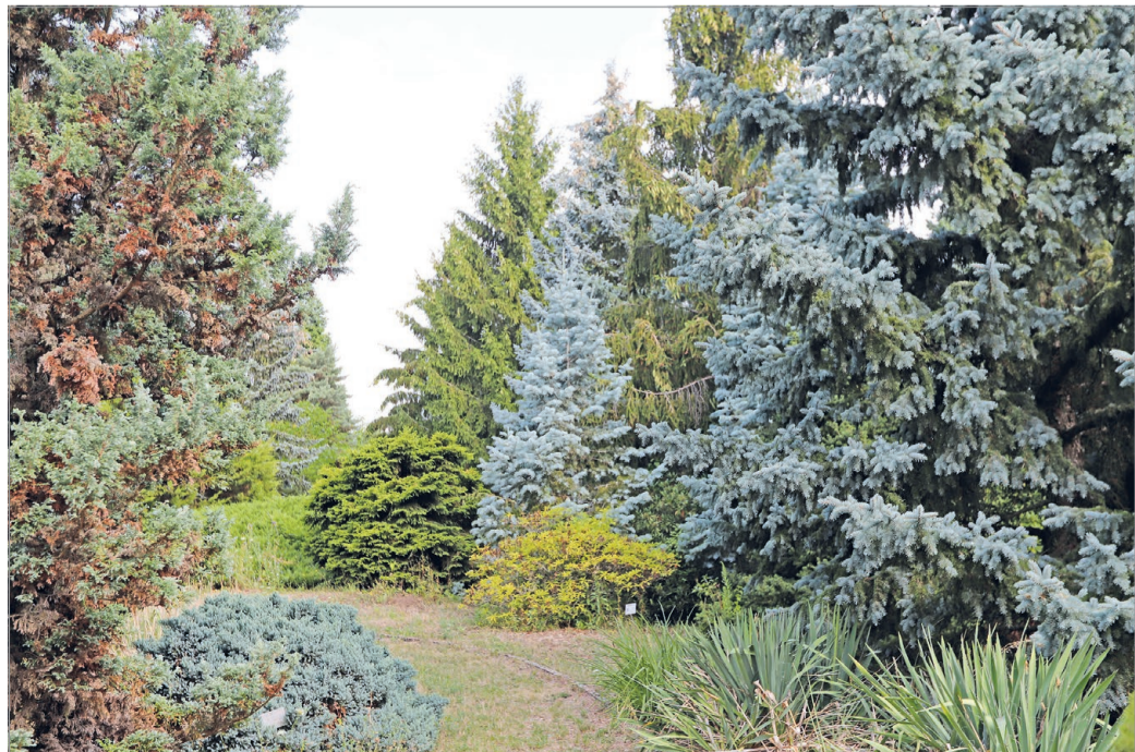
Fenyőkülönlegességek között járkálhatunk.