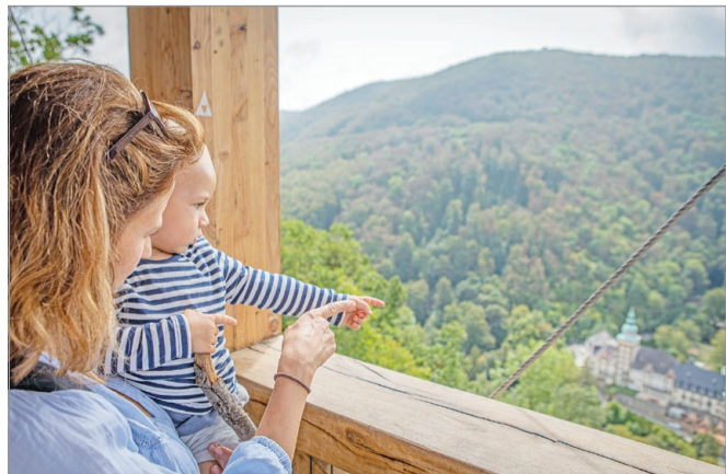
Szép a látvány a kilátó magasságából.

A kilátó nem csak a bükk, de az országos természetjárás alapillére is egyben.