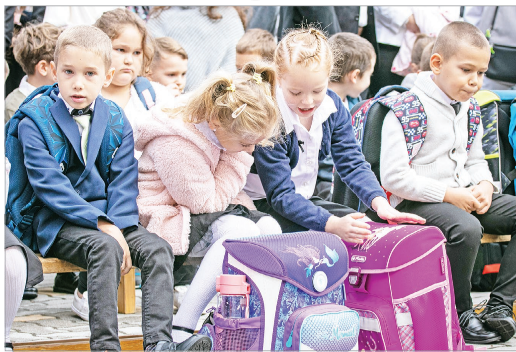
A Szilágy Dezső Általános Iskola diákjainak tavalyi iskolakezdése.

Az ügyfelek körében végzett kutatás arra is rávilágított, hogy azok közül, akiknek nehézséget okoz az iskolakezdés időszaka,