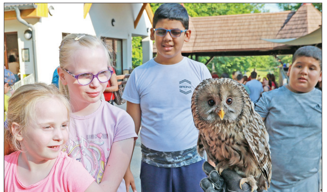
ÁLLATKERTEK ÉJSZAKÁJA. A Miskolci Állatkert péntek este különlegességekkel, érdekességekkel várta látogatóit, akik így egy igazán rendhagyó programon vehettek részt, hiszen máskor nincs lehetőség rá, hogy megismerjék az állatkert lakóinak életét sötétedés után. E napon az állatkert hosszabbított nyitvatartással várta a látogatókat. Az MVK Zrt. ZOO-járatot indított a miskolci programhoz igazodva.

ni, emellett aszimmetrikus pengefalakat is kialakítanak majd, különböző nagyságú alkotófelületekkel, valamint padokat és szeméttároló kukákat is kihelyeznek. A falakra festmények, plakátok vagy különböző installációk, időszakos kiállítások kerülhetnek. Az ötletgazdák már elkezdtek az egyeztetést a környéken lakókkal. Az alkotópark a híd káros hatásainak csökkentésében is segít, ugyanis a falak rezgés- és zajgátlóként is funkcionálnak majd. A kivitelezést az Y-híd beruházója végzi majd el, és az év végére el is készülhet.