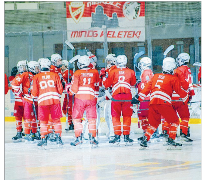
A DVTK akadémistái nemzetközi találkozón vesznek részt, ami kiváló alkalom a megmérettetésre.

Az akadémiai elitképzés egy újabb fontos mérőközhöz érkezett, a 2022/2023-as szezon során a DVTK Jegesmedvék Jégkorong Sportakadémia U16-os és U18-as csapatai részt vesznek az újonnan elinduló Bauer Elite Cup elnevezésű sorozatban, amelyben 3 ország (Ausztria, Szlovákia, Magyarország) 13 csapata szerepel.