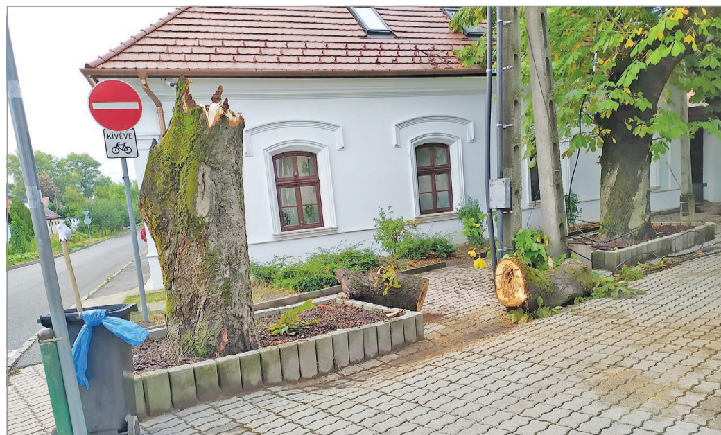
A Vár utcában megadta magát a gesztenyefa a zivatar erejének.