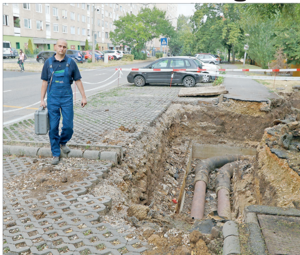
A hálózat előregedése sajnos csökkenti az üzembiztonságot.

Arra is rámutat, hogy sok családos ember dolgozik náluk, sokaknak bent kell maradnia üzembiztonság esetén, hiszen mindenki azt szeretné, hogy mihamarabb visszaálljon a szolgáltatás. Így aztán a család hiába várja haza őket a munkaidő leteltével. És van