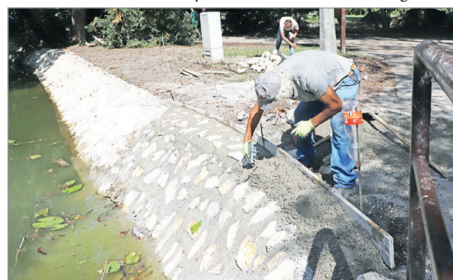
Kevésbé látványos előkészítő munkák.