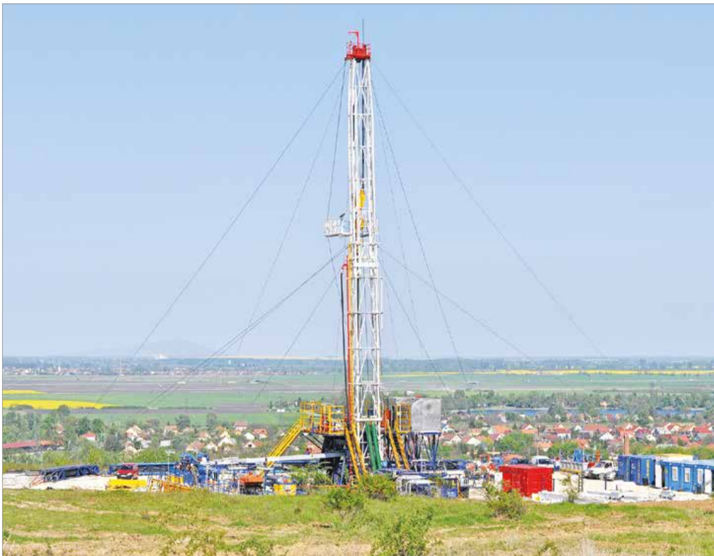
A jelentősebb felújításokhoz nagyobb léptékű európai, vagy állami támogatásokra van szükség.

A miskolci távhőszolgáltatásban a megújuló energia hasznosítása 2008-ban a hejőcsabai városrész 319 lakásának biogázzal történő ellátásával kezdődött meg. Ezt