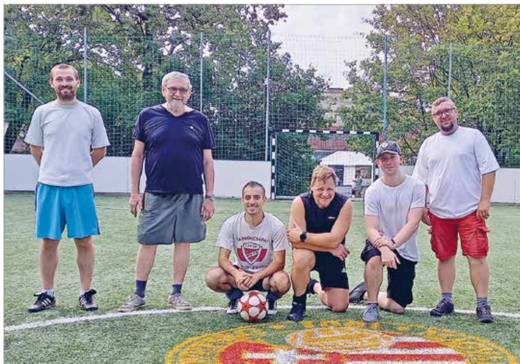
Az ifjúsági sporttelep műfüves pályáján összeállt a Mikom focicsapata.