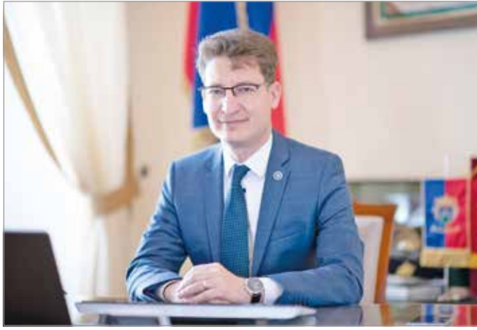
Cser-Palkovics András, Székesfehérvár polgármestere nem öltötte telt kézzel várja a válság végét.

- Az európai döntéshozók tisztában vannak azzal, hogy az energiaválság óriási terhet ró a településekre náluk is. Nemcsak ők, mi is megszoktuk az alapvető szolgáltatásokat. A békére nincs ráhatásunk, nem Miskolcra vagy Székesfehérvárról fogjuk elérni, emberi, gazdasági, pénzügyi és jogi következményei azonban minket is sújtanak, akárcsak a német vagy holland településeket a saját szintjükön. Remélem a kérdéssel az energiacsúcson olyan mélységgel, súlyal foglalkozik, ahogy azt az emberek megélik. Elképzelhető, hogy a téli hónapokban Székesfehérváron - de akár Miskolcon is, de ebben nem vagyok illetékes - nem fognak működni átmenetileg az uszodák, a könyvtárak, a művelődési házak, a sportlétesítmények, a színházak. Jó lenne elkérni mindezt, de ehhez át kellene gondolni az energiaszankció