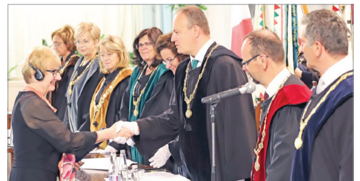
Az egyik kitüntetésre érdemesült.