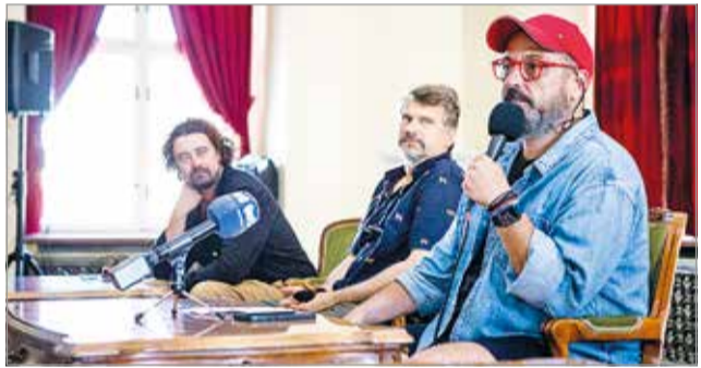
Kétszáz pályaműből hirdettek eredményt.

A mai Magyarország első állandó színtársulata 1823. augusztus 24-én kezdte meg működését Miskolc városában, a Déryné utcában, a teátrum mai épületének szomszédságában. A jövőre kétszáz esztendőszévével megünneplendő intézmény másfél évvel ezelőtt hirdette meg pályázatát.