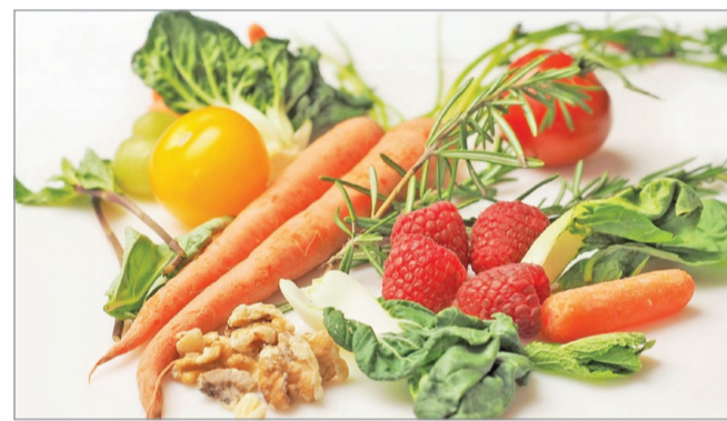
Szervezetünknek szüksége van a vitaminokra.