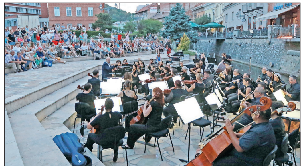
A SZINVÁT ÉS MISKOLCOT ÜNNEPELTÉK. Új fesztivál alapjait rakták le Miskolcon, a Szinva Örökség Napokkal egy kulturális, de az önkéntes közéleti szerepvállalást is erősítő programsorozattal bővítették a palettát a borsodi megyeszékhelyen. Koncertek és zenés-táncos bemutatók, szemégyűjtő és kerítésfestő akciók tarkították a három nap programját városszerte, Lillafüredtől Diósgyőrön át a belvárosig. Az eseményeket a Szinva kötötte össze és a miskolciak lokálpatriotizmusa, város iránti elköteleződése. Képpünkön a Miskolci Szimfonikus Zenekar vasárnapi záró koncertje.