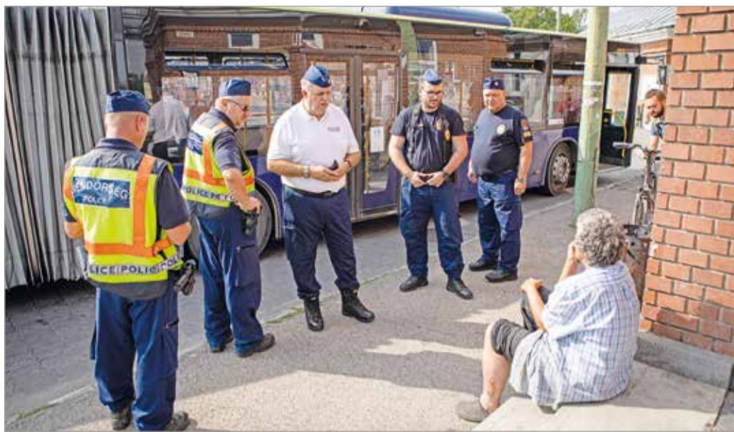
Az Újgyőri főtérén és környékén fokozott ellenőrzést tartottak.

– Természetesen ez nem jelenti azt, hogy a rendészet megnyugodhat. Éppen ezért megpróbálunk a frekvenciát