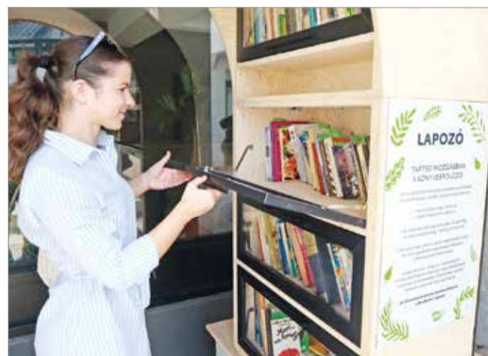
Azonnal birtokba vették a Lapozót.