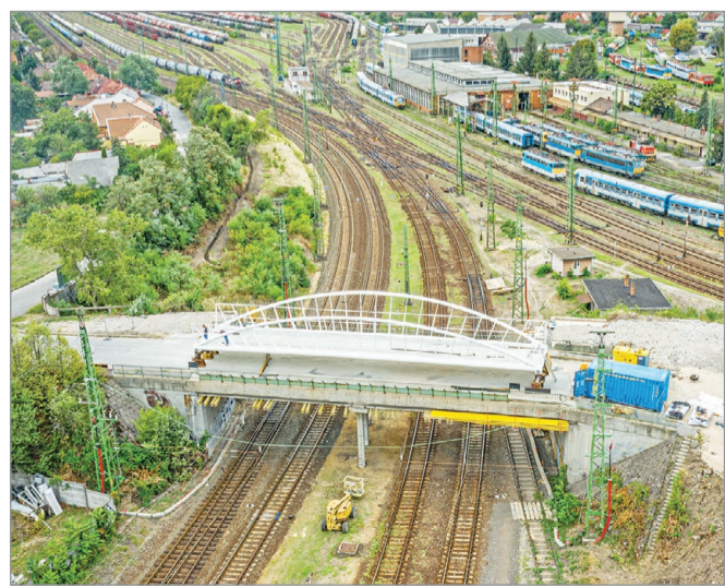
Az új kerékpáros híd fém szerkezeze.

Ilyen pótolandó hiányosságoknak bizonyult, hogy az eredeti tervek szerint csak Szirma felé, tehát egyetlen „csatornán” lett volna biztosítva a kerülőút a Martinkertváros felől a lezárások időszakára. Aminek nagy veszélye, hogy balcsont vagy egyéb havária esetén megbénul a közlekedés a városrész és a belváros között. Ezért a városvezetés kezdeményezte, hogy épüljön meg idejében a másik elkerülőút is, nevezetesen a Csokonai utca. Ami így nem csak a mostani ideiglenes