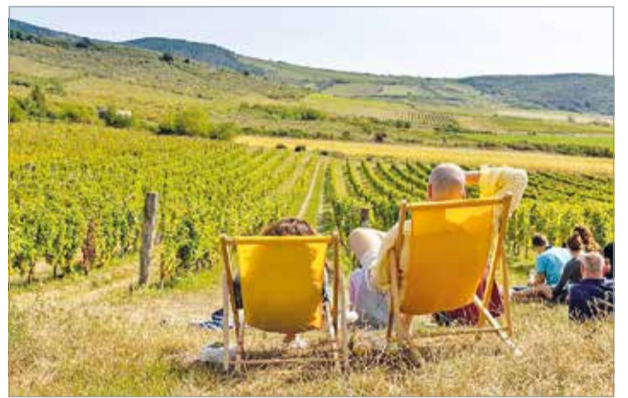
A tokaji borvidéknek üde kulturális színpontja a Kerekdomb Fesztivál

Esténként a koncertek a főszerep: fellép a Margaret Island, a Blahalouisiana, a Honeybeast és a Budapest Bár, Caramel akusztikus koncert-