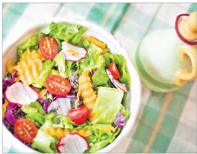
Éhségünket ezekkel csillapítsuk.

Ennek oka a szervezetünk működéséből ered: télen ugyanis nagyobb az étvágyunk. A melatonin nevű hormon felelős azért, hogy jelezze a testnek, ideje aludni télni. Ennek a hormonnak a termelése megnő a mérséklődő napfény hatására, a folyamat pedig hatással lehet az étvágyunkra is. Emellett kevesebb D-vitaminhoz jut a szervezetünk, aminek hiánya hátráltatja a zsír lebontását, viszont