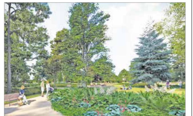
A megújuló Tapolca látványterve