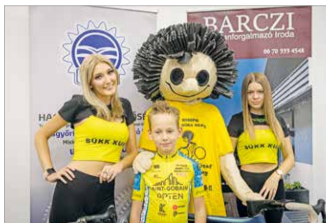
Minden korosztály megtalálhatja a neki való távot.

És már meghirdették a gyerekversenyt, ezt vasárnap a Bosch parkolójában rendezik meg, ahol egy körpályát alakítanak majd ki – hogy mennyire van igény az ilyen programokra, jól