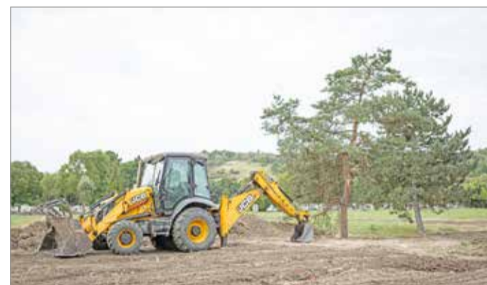
Elkezdődtek a földmunkák is a fejlesztésre váró Szentpéteri kapui temetőnél.