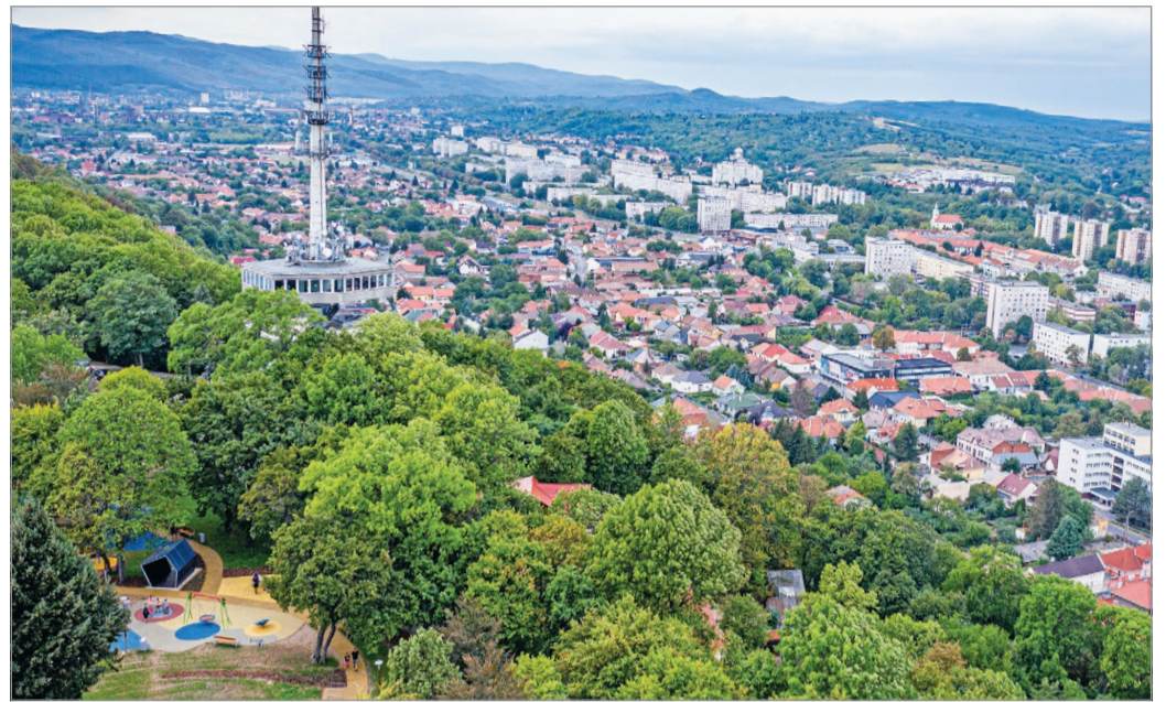
Játszóter, szabadidőpark fenn a magasban, a város felett.

– Szerintem ez most Miskolc legjobb játszótéré, nagyon szuper – lelkesedik Anett látva