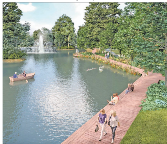
A megújult Csónakázó-tó látványterve