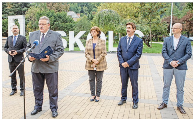
Sajtótájékoztató a Szent István téren.

Rámutatott, az intézményrendszer, az alap- és közszolgáltatások, valamint a Holding és tagvállalatainak működtetéséhez szükséges energiafogyasztás többletköltsége jövőre megközelítheti akár a város költségvetésének a felét is (ez elérheti a 15-20 milliárd forintot – a szerző). – A bölcsődéknek, az óvodáknak, az egészségügyi és szociális intézményeknek, az időszothonoknak működniük kell, és prioritást élvez a közlekedés biztosítása. De mindent megteszünk a munkahelyek megőrzése érdekében is – húzta alá Veres Pál.