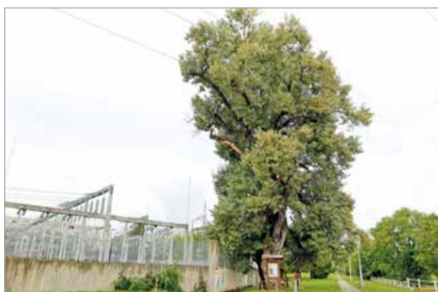
Városunk egyik zöld kincse.