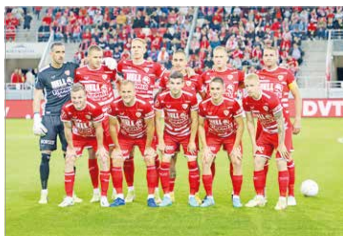
A DVTK legjobb tizenegye.

A Kazincbarcika és a Gyirmót elleni diadalok után, a harmadik derbin is behúzta a DVTK a 3 pontot. Az előjelek alapján pedig a legnehezebb ellenfélnek a 30 gólt szerző MTK ígérkezett, végül könnyed győzelem lett belőle. Kuznyecov Szergej érkezésekor, augusztus 27-ei lapszámunkban ezt írtam: "Újabb botlások már nem férnek bele, ezzel mindenki tisztában van, nyilván az „új fiú” is. Tudhatta, mit vállalt el, fel. Kilenc pont megszerzésével viszont azonnal a mennybe jut, megnyerve a szurkolóserg bizalmát, szimpátiáját." Kevesen hittek ilyen bámulatos fordulatban, mégis bekövetkezett. A zöld gyepen ugyan a focis-