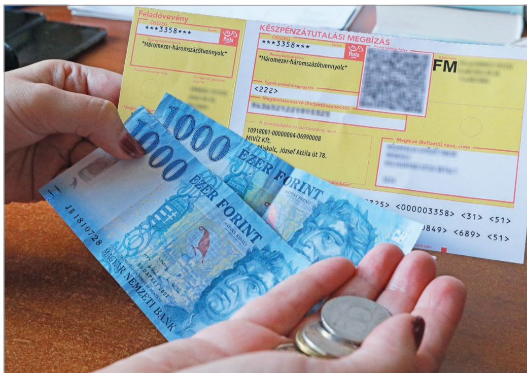
Sokaknak gondot jelent majd a sárga csekkék kifizetése.

A nyomott árak tükrében még az is észszerűnek hathat, hogy a kormány felülvizsgálta az eddigi szabályozást, és módosította azok körét, akikre vonatkozik a rezsicsökkentés. Húztak egy képzeletbeli átlagot, és aki az alatt fogyaszt, továbbra is a megszokott mennyiséget fizeti. Jogosnak tűnik, hiszen