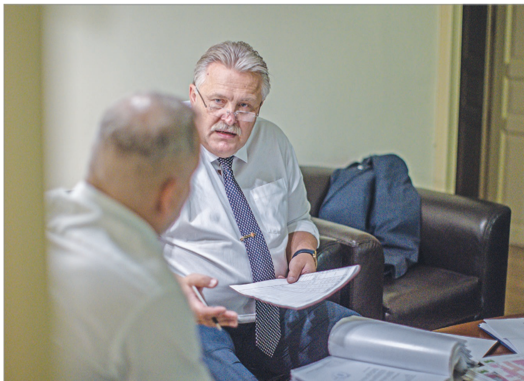
Folyamatos az egyeztetés a hivatal, a városi intézmények és a Holding szakembereivel.