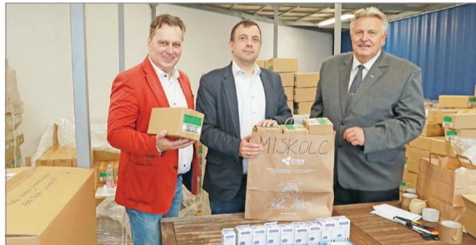
Látogatás a szentendrei üzemben.