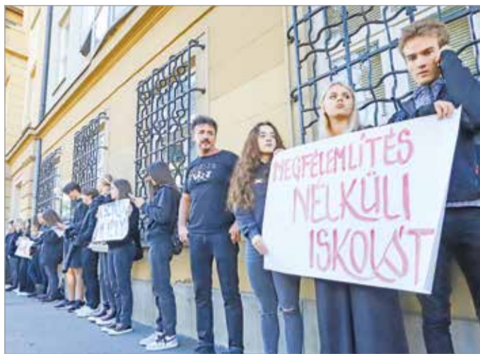
A megfélemlített pedagógusok mellett álltak ki.