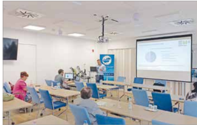
Jelenleg az energiaellátás mindenkinek fájó pont.

A Borsod-Abaúj-Zemplén Megyei Kereskedelmi és Iparkamara székházában szerdán meghívott előadóval arra keresték a választ, milyen energetikai intézkedésekkel, észszerűsítésekkel és beruházásokkal csökkenthető a cégek által felhasznált energiamentiség.