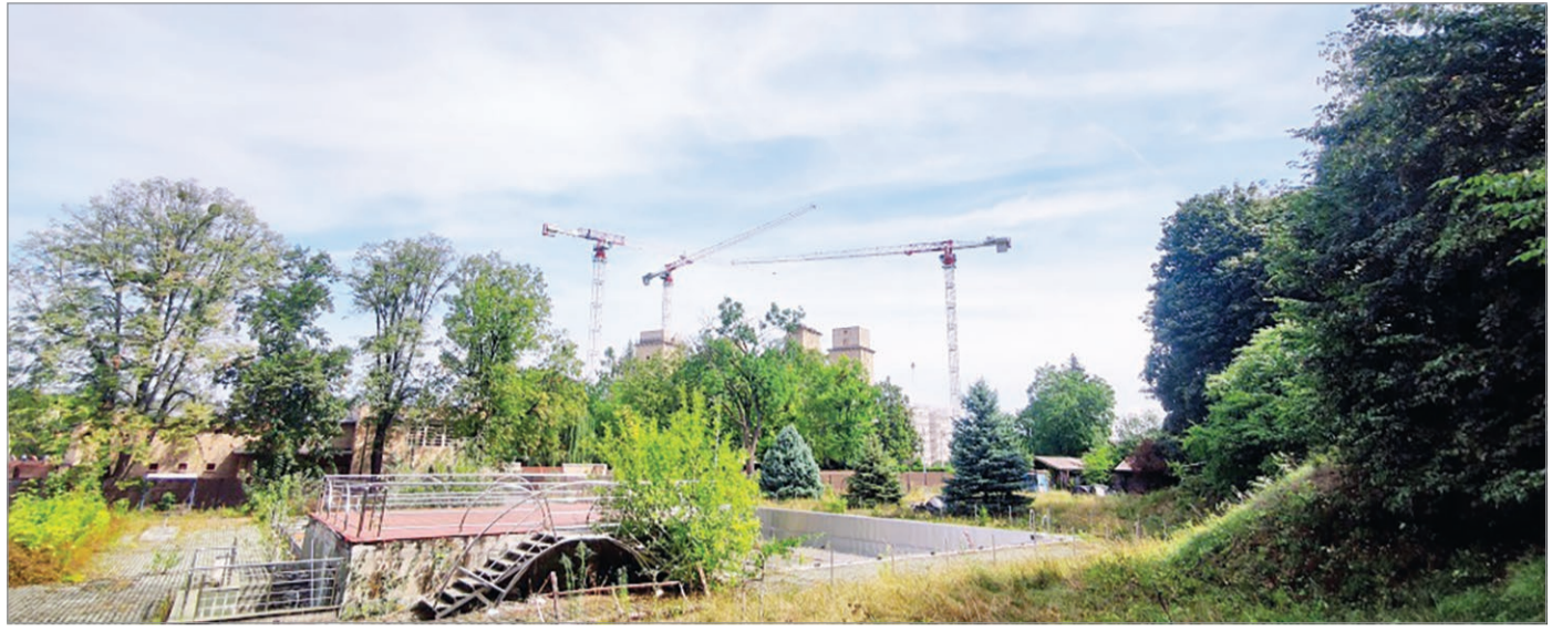
Milyen Diósgyőri Várfürdőt szeretnének?

Ez egy kicsit kezd bonyolódni, de megpróbáljuk leegyszerűsíteni a már említett Diósgyőri várfürdő mintáján keresztül. Tehát adott egy kérdőív, amit bárki kitölthet és olyan kérdésekre válaszol, amelyek a már említett általános közérzetet is felméri, valamint hogy szerintük legyen-e egyáltalán újra strand a terüle-