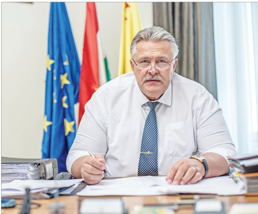
Veres Pál, Miskolc polgármestere.

– Ma még senki sem tudja pontosan, mit hoz az ősz és a tél, mennyi pluszterhet ró a miskolci önkormányzatra, a miskolci intézményekre, a vá-