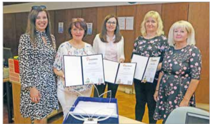
A MIHŐ idei győztes csapata.

„A versenyen a négy elérhető eredményből hármat a miskolci hőszolgáltató csapata hozott el, így a „Legjobb Ügyfélszolgálat Díja” a „Legjobb személyes